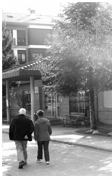
Altsasuko Osasun Etxea.