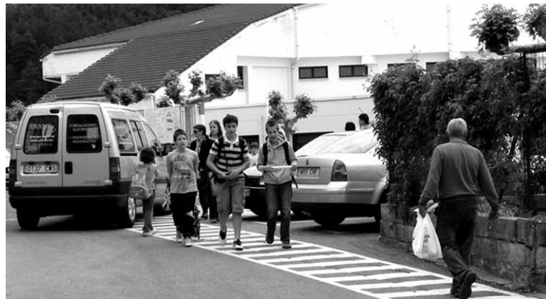
Haurrak Atakondoa ikastetxetik ateratzen.

Programaren funtsa elkarrekin ikasteen datza. Ikasleek batak besteari laguntzen diote eta batera ikasten dute, interaktuatzeko gidoi egituratu bat jarraituz. Ikasleen artean maila handia dagoenean batek tutorearen eta besteak tutorearen pekoa rola joko ditzakete. Elkarrekiko harremana izaten dute eta alde txikia dagoenean