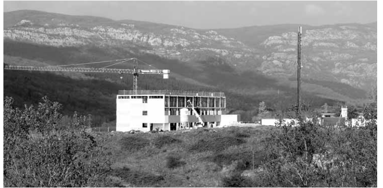
Ikastola berria, kanpo santua eta futbol zelaia hartuko ditu urbanizazioak.

Bestalde, Bakaikuak jakinara- zi digu heldu den urtean berrituko