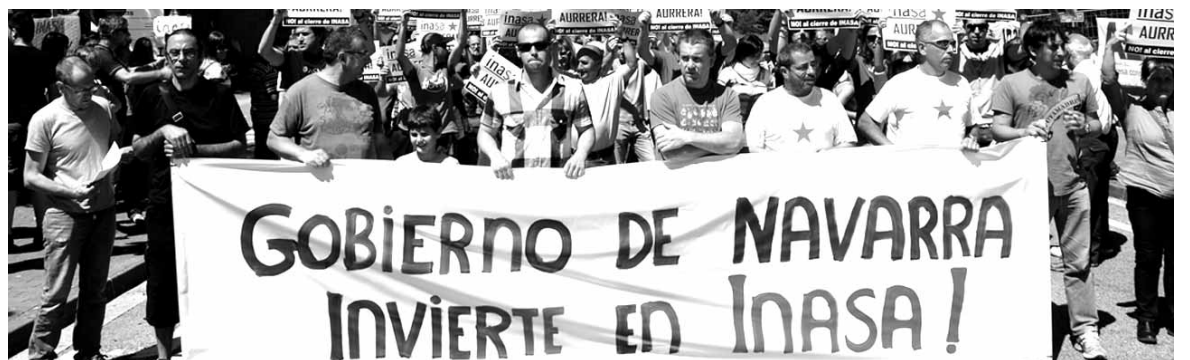
Inasako langileek itxieraren kontra egindako protesta bat.

dira. Arfe itxi zenetik 3 urte. Bi enpresen itxieraren errudun zuzendaritzak egin ditu LABek. Arferen kasuan epaitegiak errudun epaia eman zuen zuzendari-