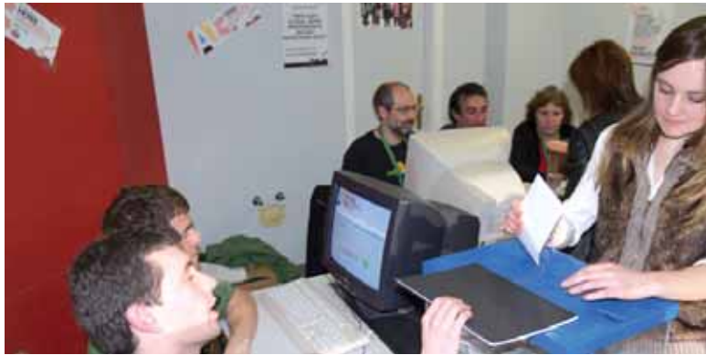
Etxarriarrek bozka ematen.

Nahi duzu Euskal Herria independente bateko herritarra izan? galderari erantzuteko aukera zuten 1990 etxarriar inguruk. Aukera 851k (%42,76) baliatu zuten (12:30ean parte hartzeak %25a gaintitu zuten). Galderari baietz 804k erantzun zioten. Ezezkoa, berriz, 18k eman zioten (%2,12). Boto txuria 26k aukeratu zuten (%3) eta baliogabeak, azkenik, 3 izan ziren (%0,35).