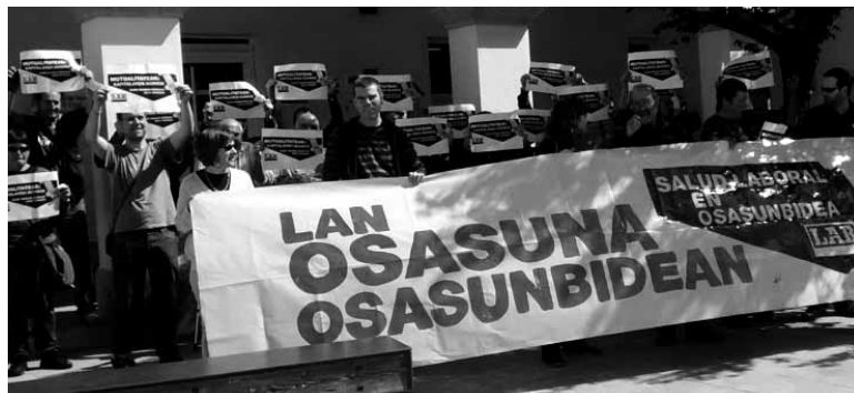
Aurreko osteguneko bilkuran, osasun sistema publikora pasatzea eskatzeko.

Aldarrikapen hori zabaldu zuten aurreko ostegunean LAB sindikatuko 30 delegatuk Irurtzungo osasun etxe aurreko aldean. Europan duela 60 urte gertatu bezala, mutuak desagertzearen alde agertu ziren kontzentratutakoak. LABeko kideak, batzarrean, mutuen baliabideak eta eskuduntzak osasun sistema publikora pasatzeko lan egiteko konpromisoa hartu zuten. Hilaren 28an Lan Osasunaren eguna izanen da LABek lantokietan mobilizazioak iragarri ditu.