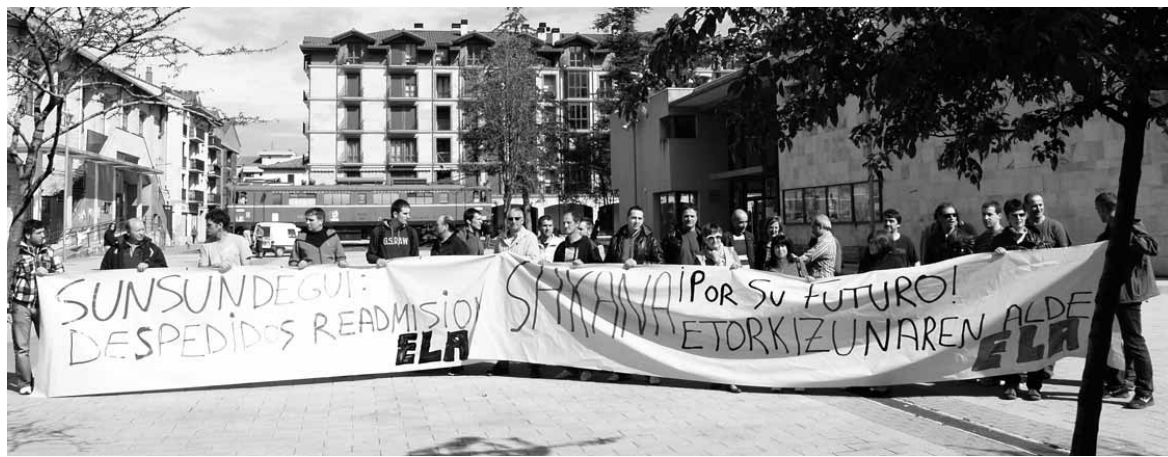
Ostiralean protesta egin zuten, ELA sindikatuak deituta.

Viergek Sunsundegiko zuzendaritzari hiru gauza eskatu dizkio: salaketa jarri duten langileekin negoziatzea, ez dezala dirua epaiketetan gastatu eta kaleratu zituen langileak berriro hartzeko. "Kaleratze subjektiboak izan ziren. Prestatutako jendea da, polibalentea. Haiek kaleratu eta 9 egunera UGTren gertuko jendea kontratatzen hasi ziren" azaldu du ELAko kideak. Viergek salatu du epaiket