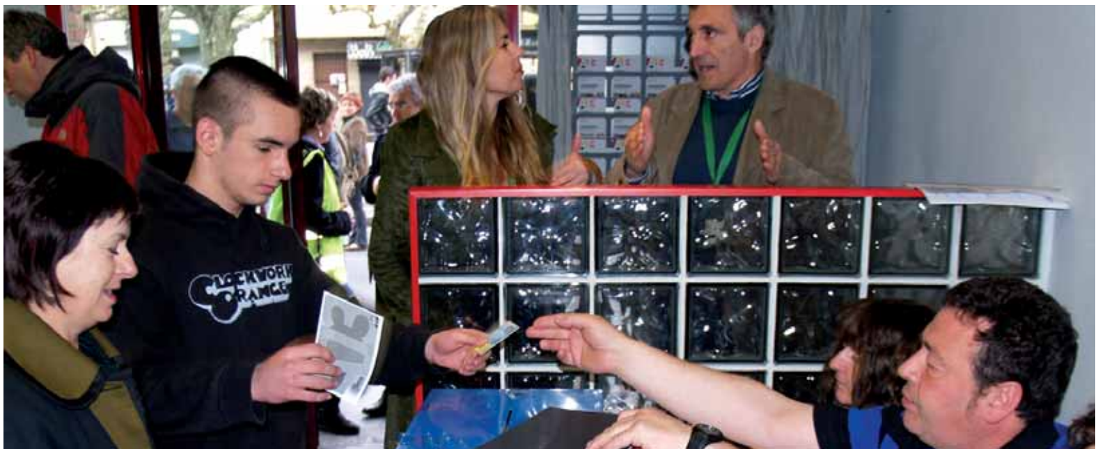
Adin guztitako etxarriarrek eman zuten botoa, ikuskatzaileak bertan zirela.

Altsasuko Udala osasun erreformarekin kexu dago >> 7