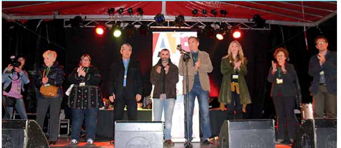
A13 ekimenak antolatutako herri galdeketa “ariketa demokratikoa, ariketa sinbolikoa” zen, “baina sinbolo guztiek duten indar eta pisuarekin”. Igandean lau urte eta erdi bete ziren Kataluniako Areyns de Munt herrian independentziari buruzko aurreneko herri galdeketa egin zela. Atzetik 556 herri galdeketa etorri ziren eta azaroaren 9rako deitua dutena ere. Igande gauean bertan A13 ekimenekoek jakinarazi zuten herri galdeketa antolatze jaso eta barneratutako ezagutza eta esperientzia guztia Euskal Herriko beste edozein herri edo lantalderen esku uzteko konpromisoa hartu dutela.