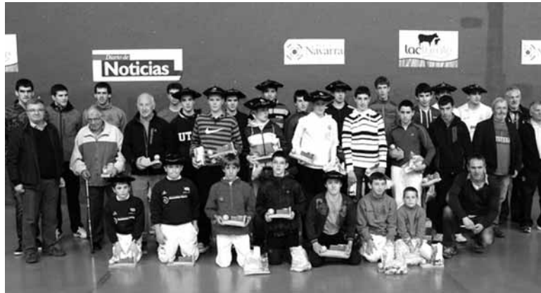
2013 urteko Irurtzungo Pilota Txapelketako finalistak.

GAUR ETA OSTIRALEAN SENIORREN PARTIDAK JOKATUKO DIRA ETA LARUNBATEAN ETA ASTELEHENEAN BENJAMINEN MAILAKOAK