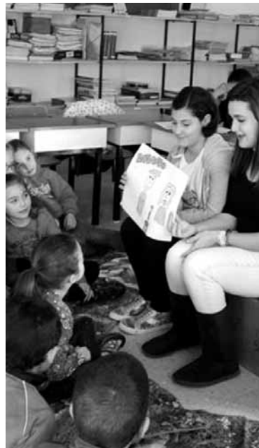
Ikastetxeke ekitaldietako bat.