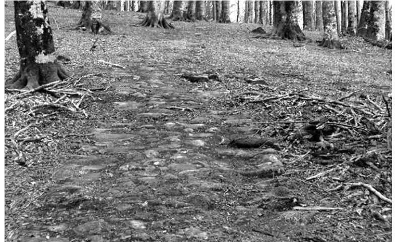
Garai batean Urdiain eta Ataun lotzen zituen galtzada garbitzen ari dira.