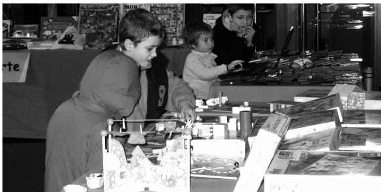
Neska-mutikoak jostailuen erakusketako eskaintzari so.

Euskal Herriko lurralde eta ezauzgarri oso ezberdinetako hainbat herritako udalek egin dute bat euskarazko produktuak sustatzeko egitasmo honetan eta tartean da baita Sakanako Mankomunitatea ere.