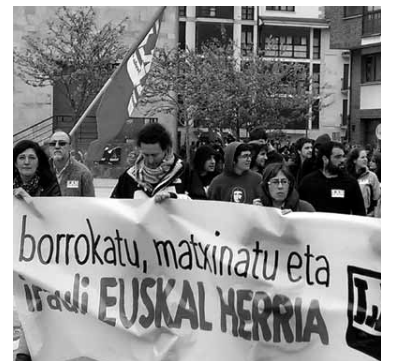
Makina bat deialdi daude.

Sindikatuak hainbat mobilizazio deitu dituzte Langileen eguna dela eta. ELAk Gure eskubideen alde, kalera! Antolakuntza eta borroka leloa hautatu du. Bere militanteak Bilboko Jesusen Bihotzatik 12:00etan aterako den manifestazioan parte hartzeraz deitu ditu. LABek Langileok erabaki, Euskal Herriak erabaki dezan leloa aukeratu du eta eskualdeko mobilizazioak egingen ditu. Sakanan Altsasun egingen da manifestazioa. 12:00etan abiatuko da Foru plazatik. 14:30ean herri bazkaria izanen da.