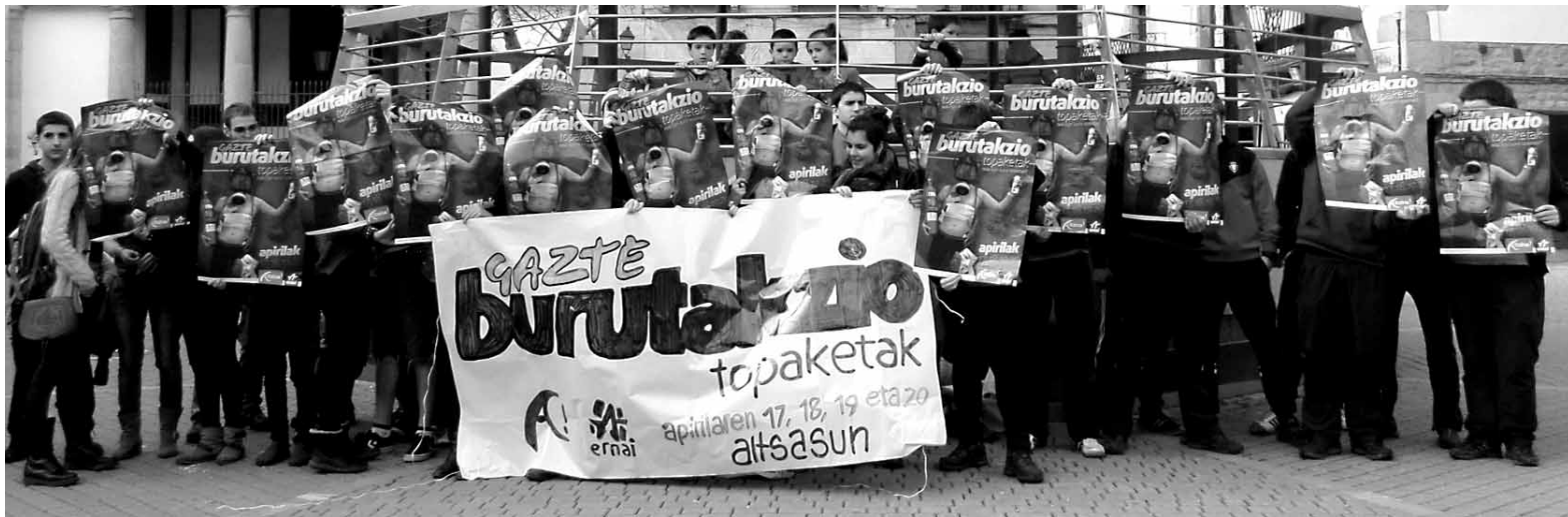
Gazte Burutakzio topaketaren aurkezpena. Antolatzaileek mila bat pertsona espero dituzte.