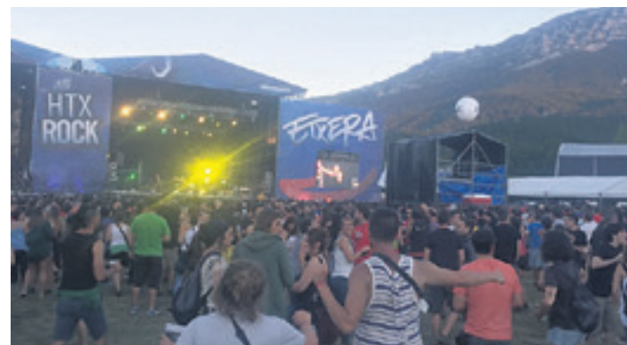
20. Hatortxurock.