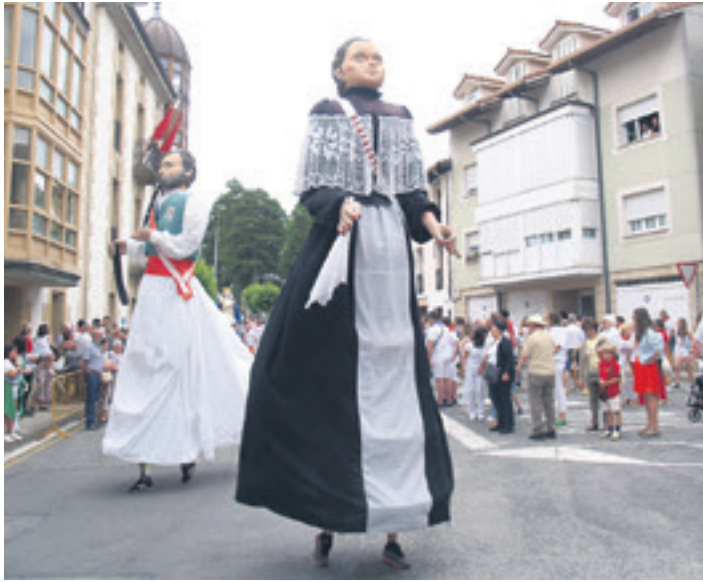
OLAZTI 2024ko Olaztiko festen hasieran erraldoiak.