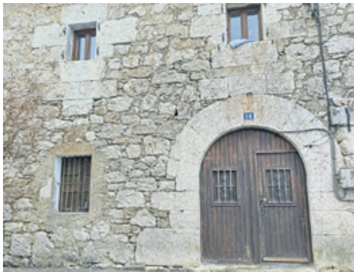
Etxe horren beheko solairuan Zuhatzuko elkarte gisa erabili da. KONTZEJUA

Zuhatzuko Kontzejuak San Martin kalearen 14. zenbakian eraikin bat du. Beheko goiko bi solairuetan etxebizitza bat du, egun alokatuta dagoena. Behekoan, berriz, elkarte gisa erabili du. Hango instalazio guztiak zaharrituta geratu dira, eta ez dituzte betetzen ezarritako gutxienekoak, batez ere zerbitzu higienikoei, sukaldari, aireztapenari eta isolamenduari dagokienez. Lanek 112.627,84 euroko (BEZ barne) aurrekontua dute. Inbertsioari aurre egiteko Zuhatzuko Kontzejuak 60.000 euroko dirulaguntza lortu du Cederna Garalur elkartearen bidez. Kontratua