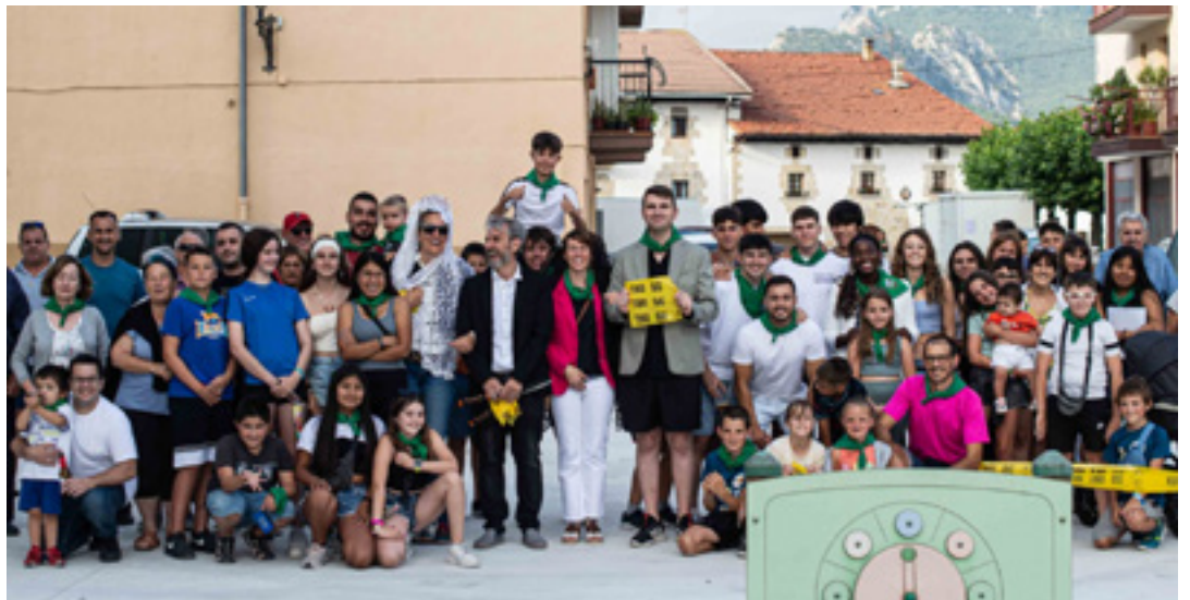
ETXARREN 2024ko festetan herri argazkia egin zuten.

11:30-14:30 Escape Caravana Itineraria konpainiaren familiarterko ikuskizuna, Memoria Historikoaren parkean (eguraldi txarrarekin Erburua kiroldegian). 11:30 Erraldoiak, buruhandiak eta Altsasuko gaiteroak, Domingo Bados eskolatik. 12:00 Hamabietakoa, Santa Ana elkarteak eskainia. 13:00 Moonshine Wagon