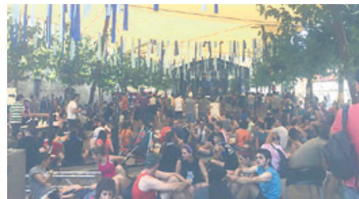
20. Hatortxurock, Lakuntzan. ARTXIBOA

zela eta agur sentsazio hori sumatzen zen.