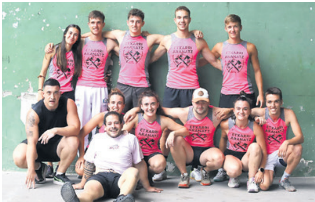
Larunbatean Berako lehen jardunaldian parte hartu zuen Etxarri Aranatzeko taldea. BIHOTZ BERISTAIN