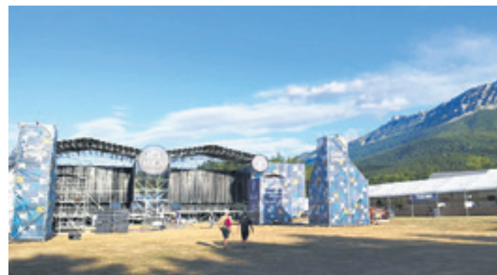
30. Hatortxurock hasi aurretik, azken prestaketak. HATORTXUROCK

N. Bai, jendea bai antolatzaileak hunkituta geunden. Askotan aipatzen genuen: hau azken ez dakit zer da, Atarrabiako azken bilera orokorra, azken... Azkena