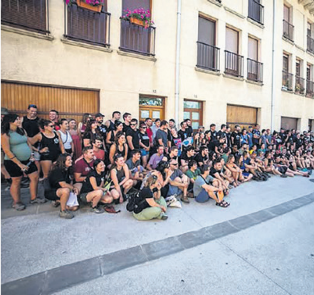
'Inoiz ez zaren lekuetara itzultzeko' film laburraren mustutzearen ondorengo talde argazkia. HATORTXUROCK

gelditzen den: aste bat, hiru egun gelditzen dira, bihar hasiko da... Eta bat-bateko gauza bat da. Lanean ari zara, hesiak jarri behar dira, barrak bete behar dira, ez dakit zer margotu behar da eta bat-batean eguna heltzen da eta orduan agian jabetuko gara agur hori iristen ari dela.