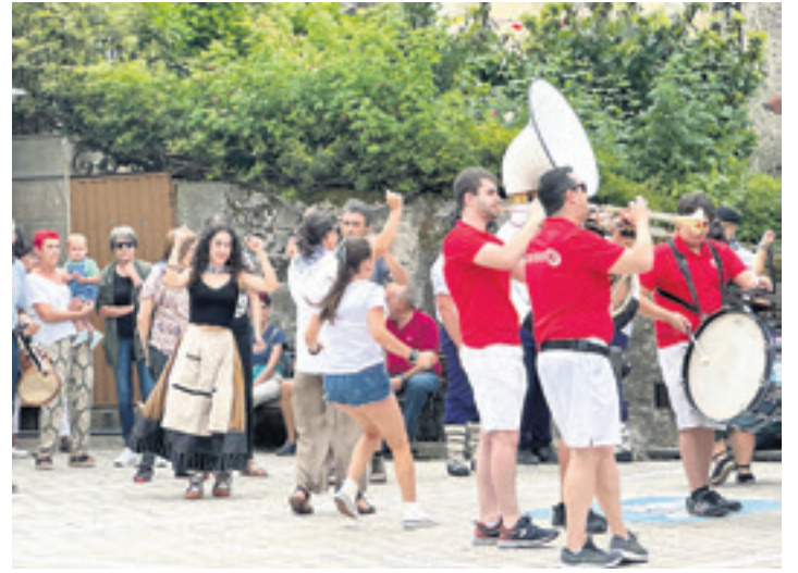
BAKAIKU 2024ko Bakaikuko festetan.