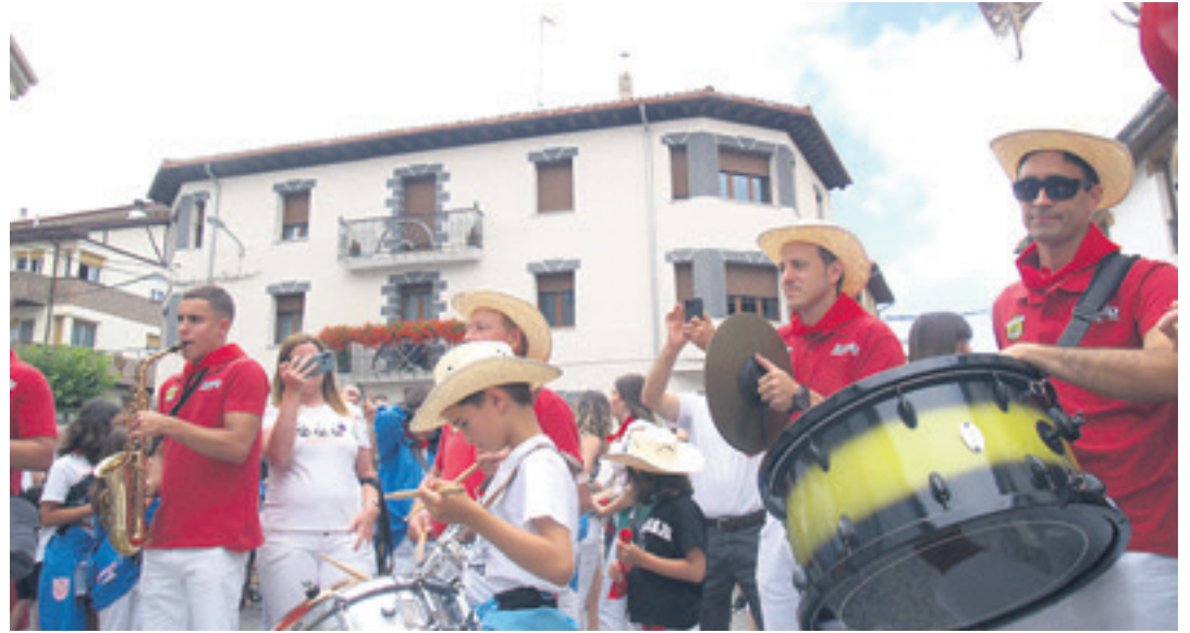
OLAZTI La Cigarra txaranga 2024ko festen hasieran.

20:00-22:00 Tximista taldearekin dantzaldia. 20:00 Auzatea, japoniar bonbak eta buruhandiak. 21:30 Bokatada, gazte asanbladak antolatuta, gaztetxean. 00:30-02:30 Tximista taldearekin dantzaldia.