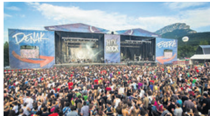
20. Hatortxurock. ARTXIBOA