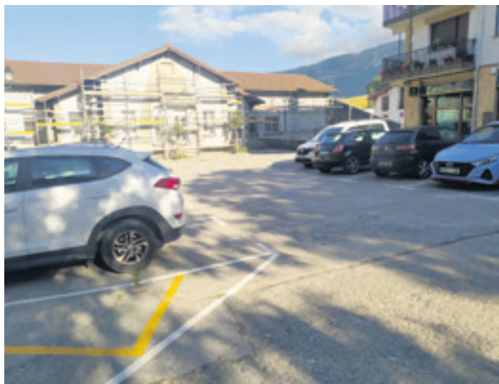
Eskolako fatxada aldamioketara eta pareko plaza zatian aparkalekua antolatuta.

Uharte Arakilgo Udalak eskola birgaitzeko lanak Abilita Construcción y Rehabilitación SM enpresari eman dizkio 529.367,65 euroren (BEZ barne) truke. Lanak eginda, eskolako energia eskara eta kontsumoa murriztuko da. Gainera, ikastetxearen energia kalifikazioa gaur egungo D mailatik B izatera pasako da. Bestalde, eskolan 30kwn-eko behe-tentsioko instalazio elektriko egiteko eta eguzki plakak jartzeko kontratua Eseki LSari eman dio udalak, 30.014,59 euro (BEZ barne) ordainduko ditu. Azkenik, eskolan biomasa galdara jartzeko lanak ere egingen