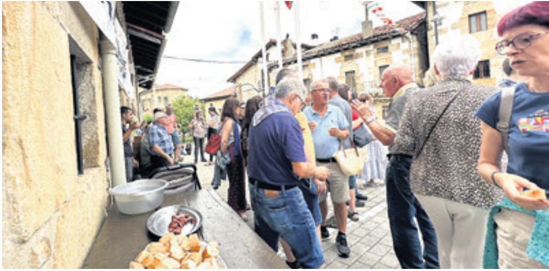
BAKAIKU 2024ko Bakaikuko festetako auzatea.