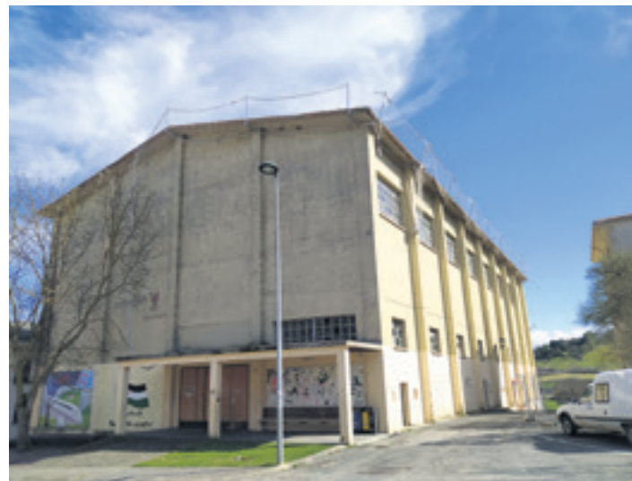
Urdiaingo Elizazpi frontoia lanengatik itxita dago.

Orozek argitu duenez, lanak iraun bitartean pilotalekua itxita egongo da. Horren ondorioz, Urdiaingo irristaketa taldeko kideen entrenamenduak Bakaikuko frontoian egiten ari dira. Beraz, lanak iraun bitartean, astearte eta ostegunetan, 18:00etatik 19:00etara, irristalari urdindarrak Bakaikun trebatuko dira. Alkateak azaldu duenez, "frontoia asko erabiltzen da. Gurasoak haurrekin neguan askotan egoten dira bertan. Gainera, haurrak areto futboleko edo pilotan jokatzera joaten