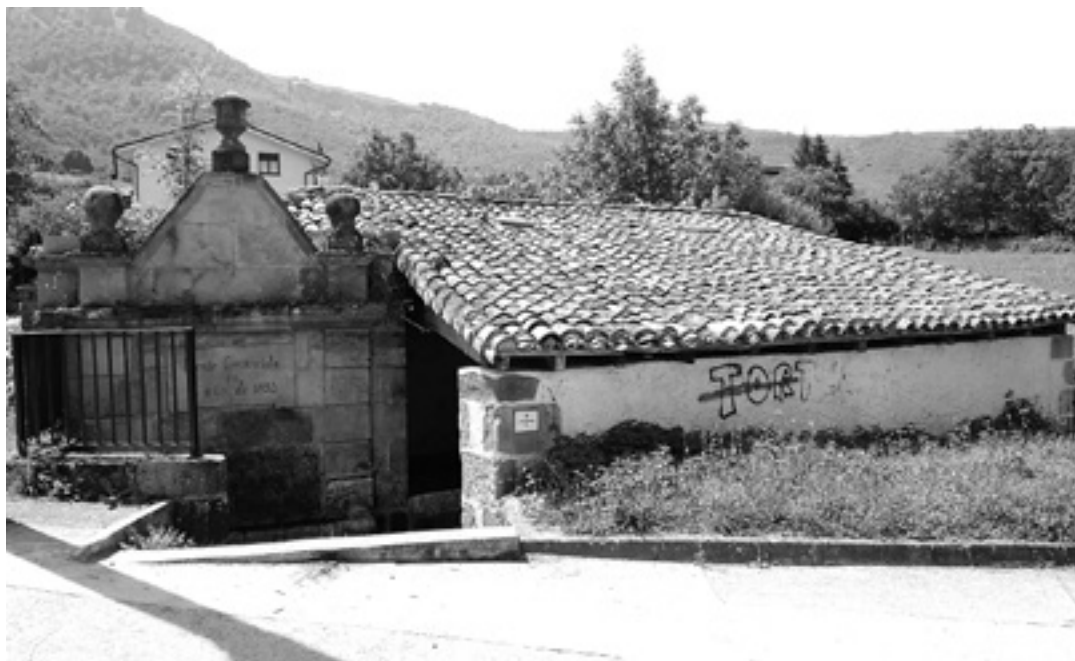
Bakaikuko Anbeikoa iturria eta garbitokia. ARTXIBOA