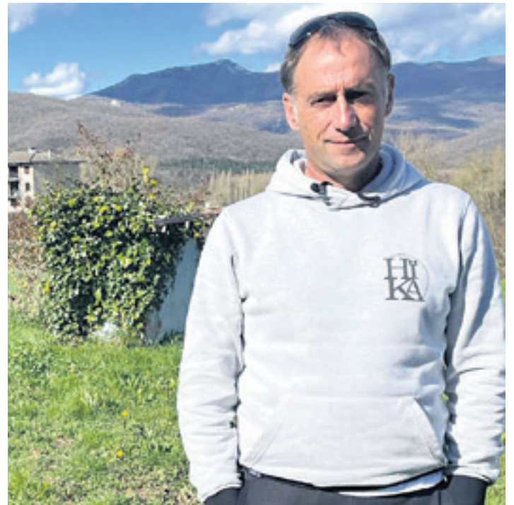
Inaxio Beltza Igoak Xabiererako bidea eginen du bihar.

Helburuak, mila. Iruñetik joaten den ia jende guztia Noain-