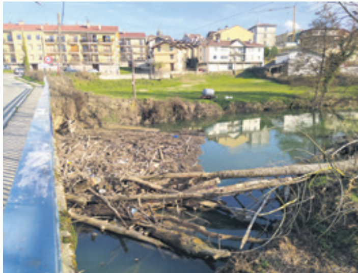
Otsailaren 25era arte ubeldeak zubi kontra izan zuen itxura.