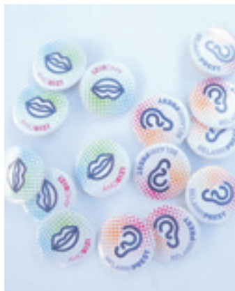
Euskaraldiko txapak.

Data aldaketak ez du Euskaraldiko mamia aldatu: euskara ulertzen duten hiztunen hizkuntza ohiturak aldatzeko mugimendu soziala da, Euskal Herri osoan eragiteko sortua. Mugimenduak herritarren hizkuntza praktikak aktibatu eta euskararen erabilera handitu nahi du, eguneroko harremanetan euskara lehenetsiz eta 11 eguneko praktika sozial masibo bateratu baten bidez. Antolatzaileen nahia da Euskaraldiak irauten duen bitartean