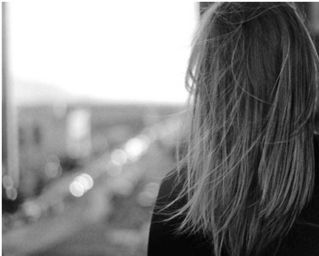
Emakumezko bat leihotik begira. UTZITAKOIA