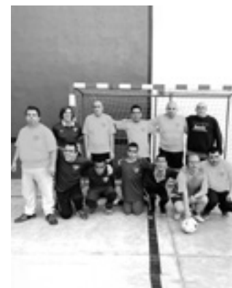
Lagun Artea talde inklusiboa. LAGUN ARTEA

Asteburuan Essor Basqueko gainontzeko hiru etapak jokatu dira: ostiralean Donapaleukoa, larunbatean Donibane Garazikoa, eta igandean Maulekoa.