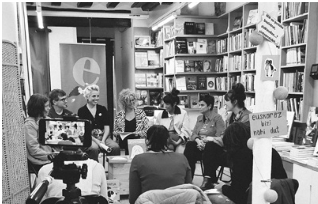
'Mamuki' 2024ko edizioko irabazlearen aurkezpena.