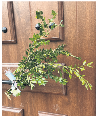
IRAÑETA Ezpel adaxka atean.