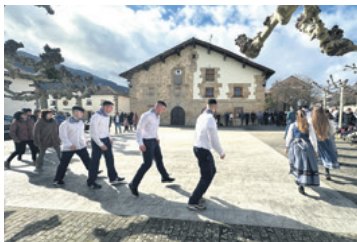
Joan den urteko Ziordiko zortzikoa.