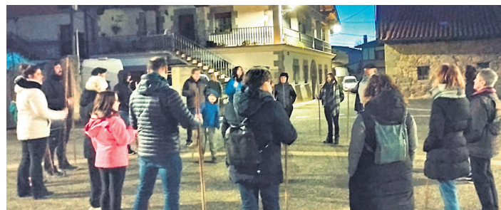
IRAÑETA Kopla kantari kalez kale ibili ziren irintarrak. UTZITAKOA