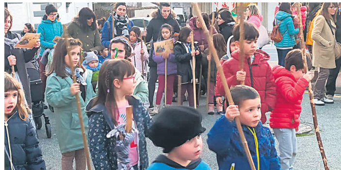
IRURTZUN Makilak eskutan, herrian barna ibili zen segizioa.