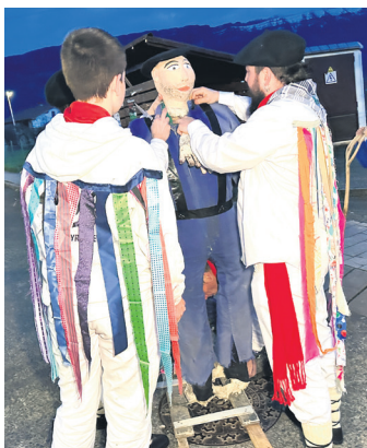
IRAÑETA Koloredun zintak.