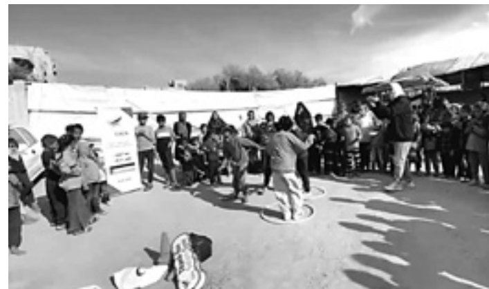
Salam Gaza Nafarroa elkartearen haurrendako proiektua, Gazan.

rrez, eta bertan 500 familia daude; 2800 pertsona inguru. Edateko ura banatu dugu eta labe bat egin dugu. Guretako erronka bat zen labea egitea, buztinezkoa, elektrizitatek eta gasik ez dutelako. Jainkoari esker lortu dugu. Gazako emakume boluntarioen laguntzarekin ari gara ogia egiten eta banatzen. Aterpe honetan 200 haur baino gehiago daude, eta asko umezurtz dira. Haurrendako Irribarre proiektua sortu dugu, alaitasun pixka bat emateko. Musika pixka bat jartzen dugu, pailazoak joaten dira, jokoak, sagar eta gozoki bat ematen diegu... Beldurraren artean alaitasunaren hazia landatu nahi dugu. Eguberrietan ere munduko haurrek Santa Klaus edo Olentzeroen opariak jasotzen dituzten bezala, haiei ere oparixoa eman genien. Gazako haurrek esaten dute: "Zergatik gara desberdinak gu? Zergatik gu jaikitzen gara eta gurasoak hilda ikusten ditugu opariak ikusi beharrean?". Orduan, oparixoa eman genizkien; ez ziren opariak: patata poltsa bat, sagar bat... Dagoena. Urte berriko oparia izan zen, eta eskertuta gaztelaniaz mezua bidali ziguten urte berria zorian. Herri oso eskertua da. Beste proiektu bat da Egiptora joan ziren gaztariarekin, asko ezer gabe gelditu dira muga zeharkatzeko aurreztuta zuten guztia eman zutelako, eta gaixotasun kronikoak dituzte. Botikak bidaltzea lortu dugu.