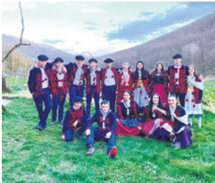
Kinto urdindarrak gaur hasiko dira ospakizunekin. UTZITAKOIA

Kinto ospakizunak despedituta, aurtengo kintoen eginkizunak ez dira hor despedituko. Haien egitekoa baita garileko festen hasieran zortzikoa plazan dantzatzea.