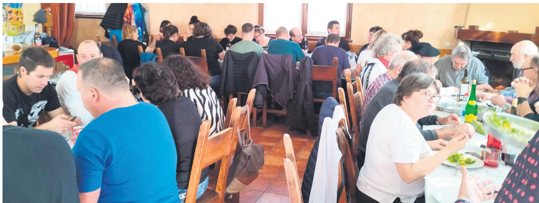
ITURMENDI Txapel Azpi elkarteak ihote bazkaria hartu zuen. 65 irintar elkartu ziren.