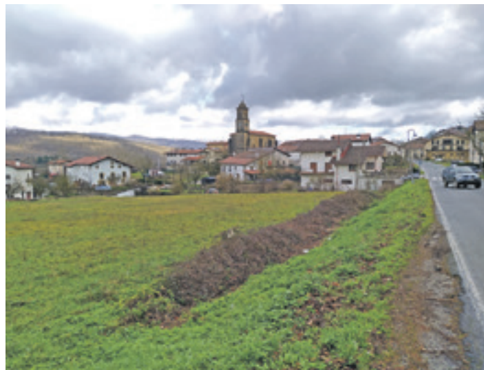
Ezkerrean urbanizazio proiektua hartuko duen eremua.