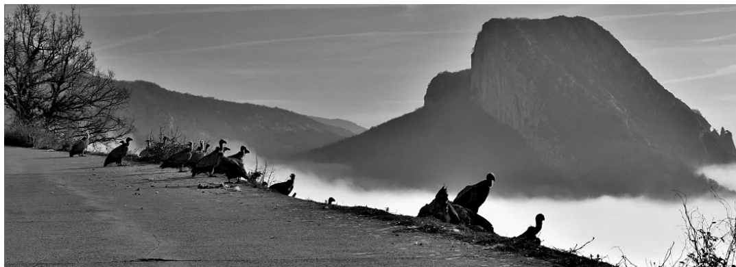
Ganbeleko zenbait, ganbela betetzeko zain.

Eultzia egin Sakanan, Zaraitzun eta Erronkarin gutxienez erabilia. Laboreak aletu. Garai batean larrainean egiten zen eultzia. Emen gariyek, oluek, zikiyuek eta geñakuek biandu ontzen dienes, auntsiye garillan akaberan