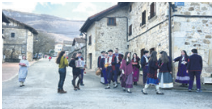
Joan den urteko kintoak eskean.

Aritzaga elkartean bihar goizean. Guztiak baserritarrez jantzita joanen dira. 11:30ak aldera kalera atera eta trikitilarien doinuek lagun kalejira egingen dute. Herri guztitik pasako dira kinto eskean. Haiekin eskuzabala denari pastak eta moskatela eskainiko dizkiete. Herriari buelta eman ondoren, Aritzaga elkartean bazkalduko dute. Han izanen dira 19:30ak aldera arte. Orduan Altsasurako bidea hartuko dute, hango kintoak dantzari ikusi, ondoren