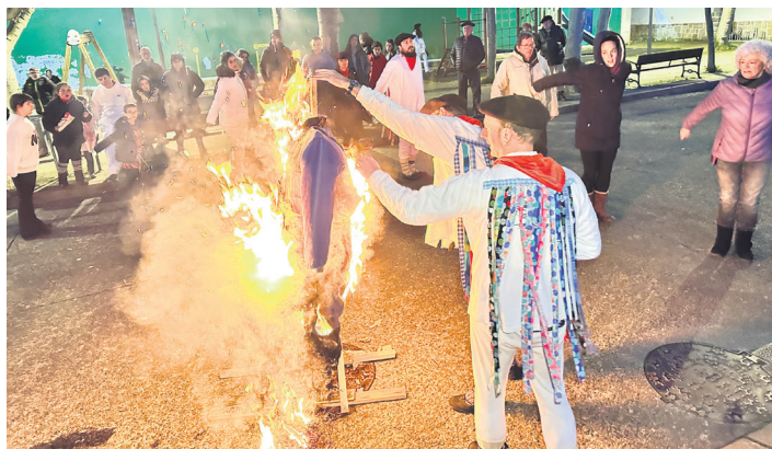
IRAÑETA Atxun Zarkoak sutan bukatu zuten. Inguruan dantzatu zuten.