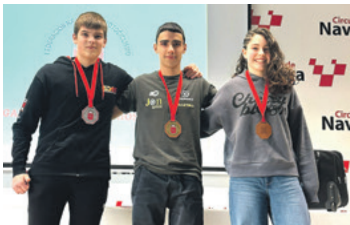
Beraza, Nafarroako Txapelketetan jasotako dominetako batekin. UTZITAKOIA

baina ni mutil batzuk baino azkarragoa naiz”.