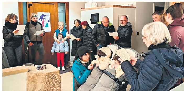
LIZARRAGABENGOA Elkarrekin kopla kantari ibili ziren. UTZITAKOA