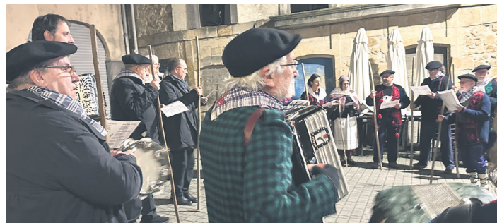
ALTSASU Musikariak erritmoa eramaten lagundu zuten.