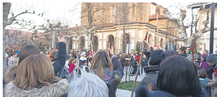
ETXARRI ARANATZ Kantu kalejira jendetsua egin zuten.