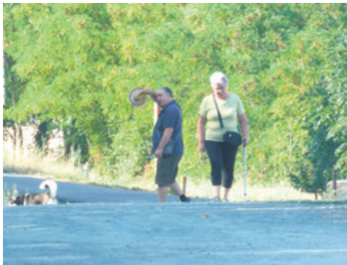
Irurtzundarrak Plazaolako bide berdean paseatzen.

Jarduera Fisikoaren Orientazio Zerbitzuak bost eskaintza barnebiltzen ditu. Alde batetik, kontsultak daude. Elkarrizketa bat da, eta han pertsonaren azterketa fisikoa egiten da. Emaitzaren arabera, pertsona jarduera fisiko antolatu batera bidera-