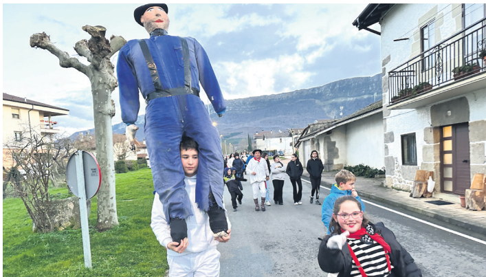
IRAÑETA Atxun Zarkoak urtean behingo bisita egin zuen.