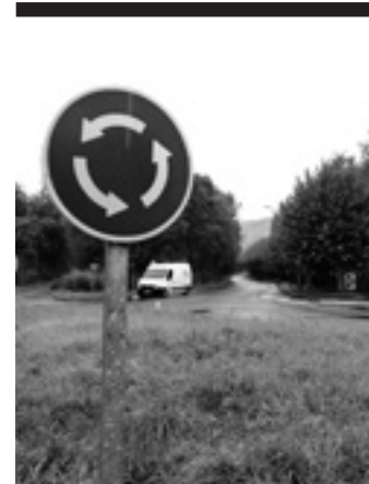
Udalak kale bihurtu nahi duena.

3. Animaliekin lagundutako esku hartzeak, terapiak, hezkuntza eta aisialdi programak eskaintzen ditugu behar bereziak edo aniztasun funtzionala duten pertsonendako. Buru osasun arazoak dituztenendako ere. Natura, terapia baratza gehitu diegu eskaintzari. Natura eta animalien bidez pertsona, natura eta animalien ongizatea hobetu nahi dugu.