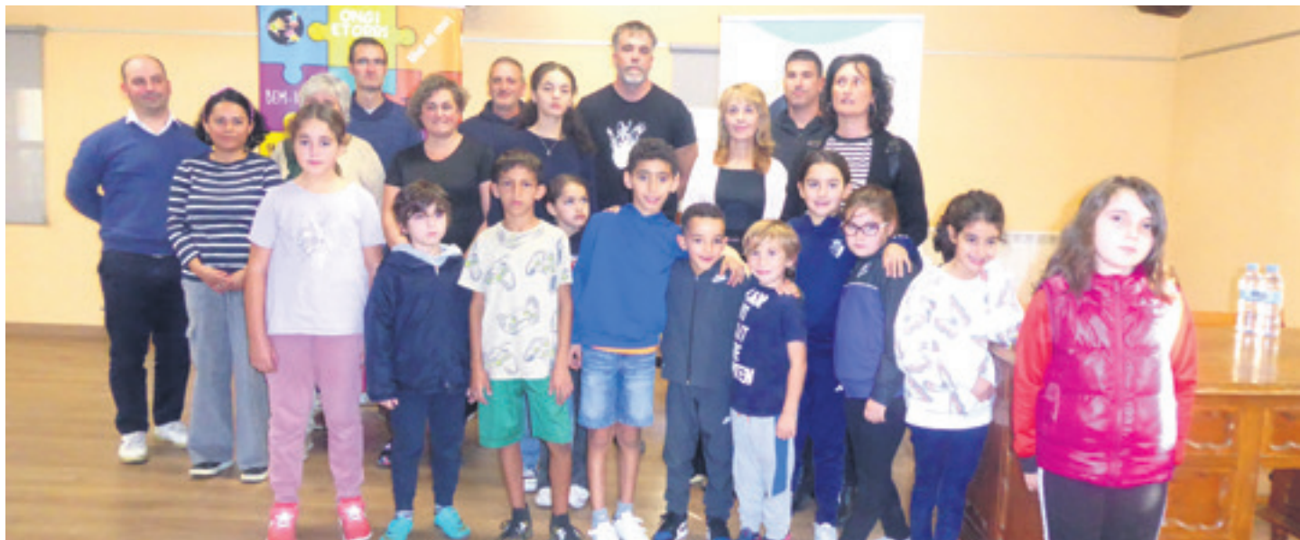
Zurrumurrueen kontrako sari banaketako saridunak.