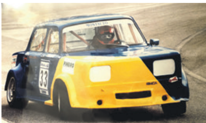
Simca Rallya asko ibiltzen dela dio Harbyk, indar handia duela. UTZITAKOIA