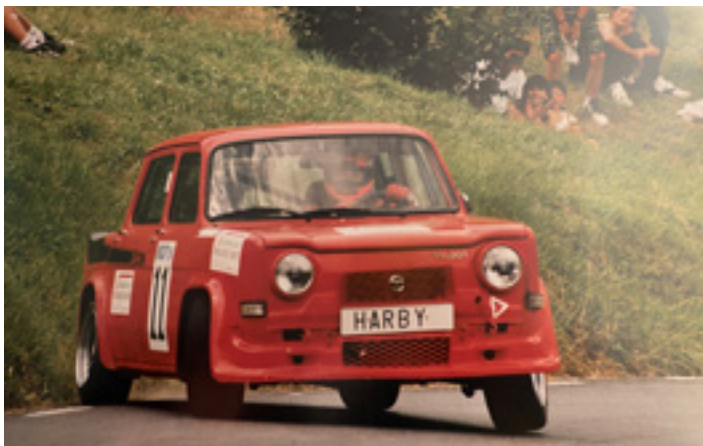
Harbyk lehen Simca gorria Bilbon erosi zuen. UTZITAKOIA