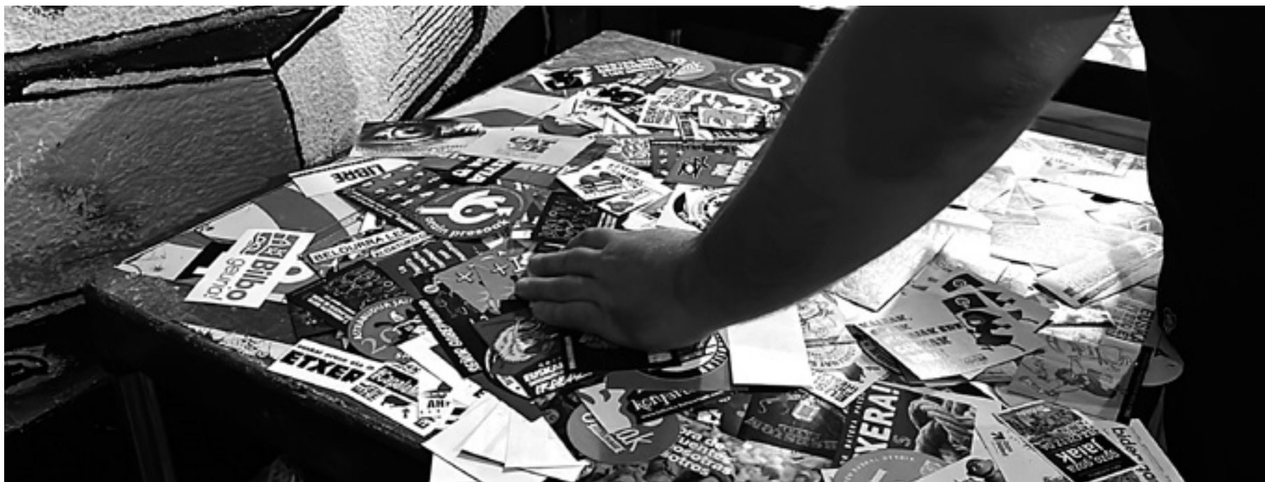
Pegatinak Euskal Herriko Pegatineroen Elkartearen topaketa batean. EHPE