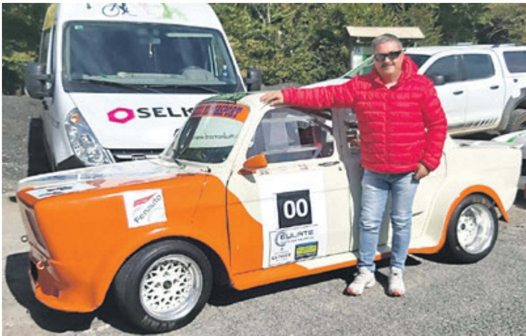
Harby Simca Rallyarekin, Urbasako Igoerako 0 autoa. Aurtan ez da aterako, Alpine eta Porsche nahasketa ekarriko dutelako.