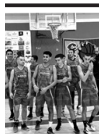
CBASK Narum mailaz jaitsi da.

Etxarri Aranatzek mendi lasterketen lekukoa hartuko du. 49. Mendira Joan Etorria dago jokoan igandean, ferietan, 11:00etan. Oraindik ere izena eman daiteke, gaur, ostirala, 20:00ak arte, Kronoak.com webgunean. Antolakuntzak 2009raino jaiotakoei zabaldu die izena emateko aukera. Hartzabalera heldzea da erronka, eta herrira bueltatzea (10 km, 572 m desnibel +).