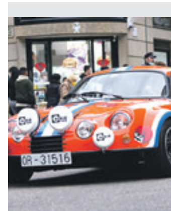
Alpinchea, berrituta. UTZITAKOIA