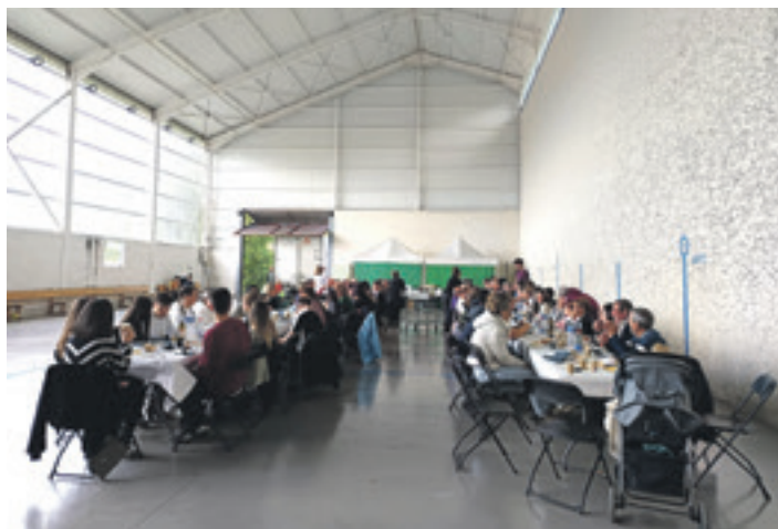
Unanuarrek egun osoko egitaraua antolatu zuten, tartean herri bazkaria.

bildu ziren, eta arratsaldean musika izan zen kontzertu garaira arte. Auzolanean ere bokatak prestatu zituzten, "gau luzea izango zelako". Dena oso ondo joan zela esan du Auzmendik. Dena antolatzeko, aurreko egunetatik eguraldiari begira egon ziren, "nora joan ez genekien eguraldi ona eskatzeko". Ostiralean aparkalekuak antolatzen hasi zirela azaldu du Auzmendik, "jabeekin hitz egiten eta dena antolatzen". Bestetik, Irurtzango, Lakuntzako eta Altsasuko udalei eskerrak ere luzatu dizkie, "komunak prestatu zituzten eta eszenatokiarekin lagundu zuten ere". Sakandarren arteko auzolana izan zen Unanuko; "ikustera etorri zen jende gehiena ere hemengo jendea zen, sakandarrak".