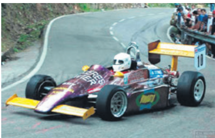
Harbyren Formula Dallara, Alfa Romeo motorra duen autoa. UTZITAKOIA

lako giroa egoten da. Joan nintzen lehen aldian, zale askok geratzen zidaten, autoari argazkiak ateratzeko. Eromena izan zen. Gogoan dut sekulako Ferraria ekarri zutela, baina asistentzia gunean gu ondoan geunden, eta jendeak Ferraria begiratu, baina berehala Simca ikustera hurbiltzen zirela".