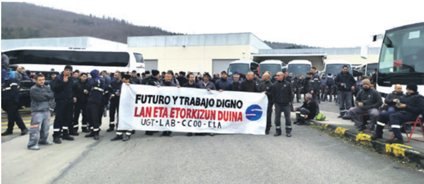
Sunsundeguiko langileak lan eta etorkizun duina aldarrikatuz.