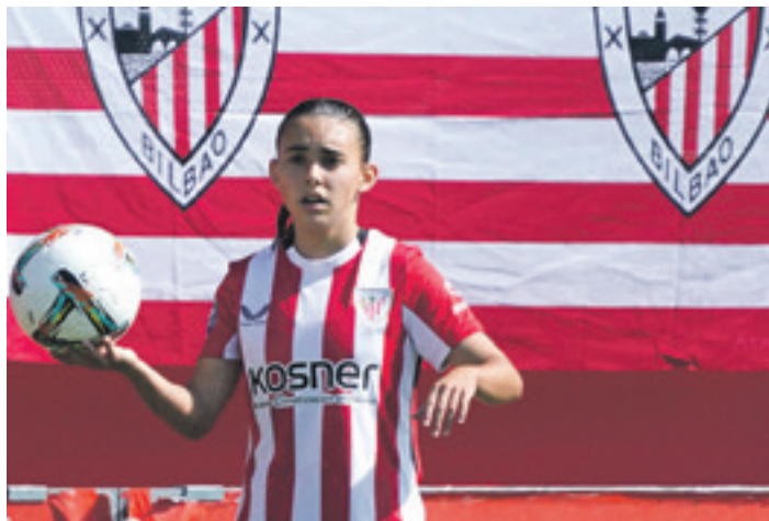
Vilariño Athletic B taldeko fitxa du baina A taldearen dinamikan dago. ATHLETIC CLUB

Gutaz kezkatzen da, beti galdetzen digu nola gauden. Jatorra da, oso gertuko, baina serio jarri behar duenean serio jartzen da. Entrenatzaile ona da, futbolaz asko daki. Berak nahi duena da entrenamenduak intentsitate handi-koak izatea, serioak, eta partidak