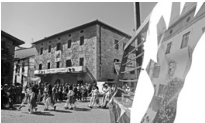
Festetako egun handiko zortzikoan emakumezkoak buruan izan ziren.