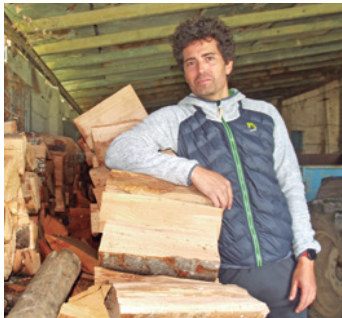
Ubertearra bordan duen joan den urteko pago egurrarekin.

Bai. Enborrak zuk nahi duzun tokira jaisten dizkizute. Bordara