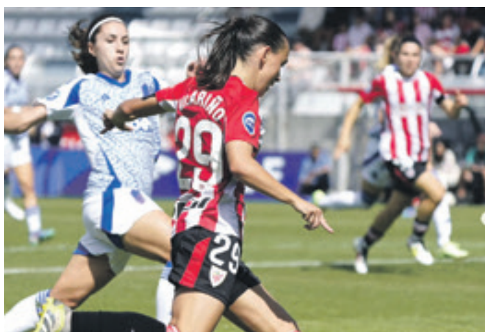
Granadaren kontra titularra izan zen, eta eskuin hegalean jokatu zuen. ATHLETIC CLUB