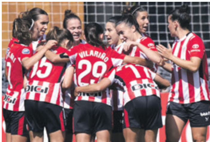
Lehen mailan garaipenarekin debutatu zuen Vilariño. ATHLETIC CLUB

ere halakoak izatea eta gu oso kontzentratuta egotea.