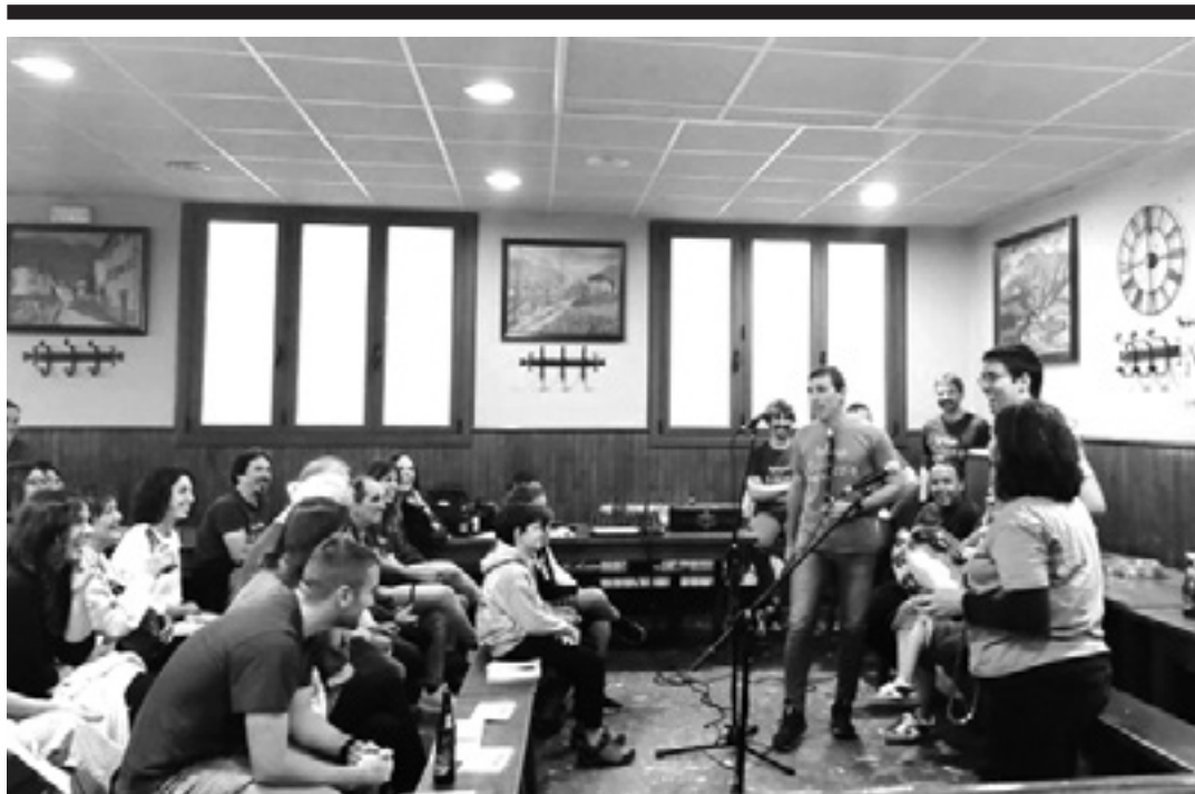
Bardoak 2024ko bigarren saioa, Sunbillan, Pikutara goaz taldearekin. NAFARROAKO BERTSOZALE ELKARTEA