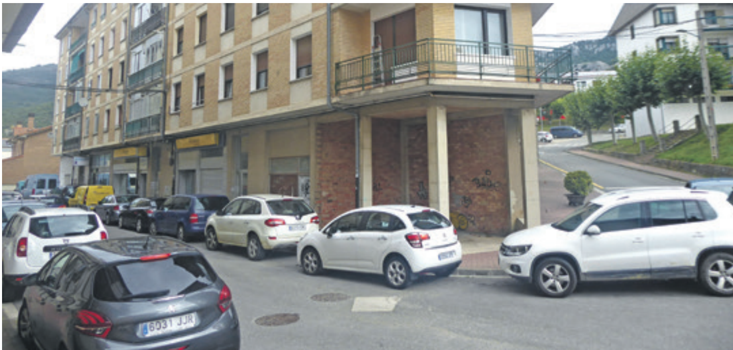
Eszerrean norabide bakarrek kale bihurtu den Berria kalea. Eskuinean aparkalekua egitea aurreikusitako tokia.