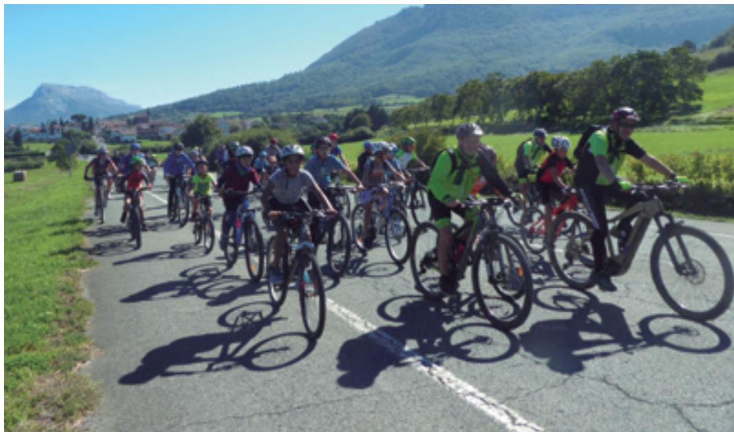
Barranka Txirrindulari Taldekoek gidatuta, Sakanako Bizikleta Eguneko tropela aurrera.

Teknikariak argi du zer aldatu den gehien: emakumeen parte hartzea. "Nabaritu dudana da, keta handiena da. Urtetik urtera, geroz eta emakume gehiagok parte hartzen dute Bizikleta Egunean. Eta helduek ere, gehiago. Hasierako urteetan haurrak eta haien gurasoak aritzen ziren bereziki, baina orain emakumeak eta helduak ere animatu dira. Familian, kuadrillan, lagun artean... Sakanako Bizikleta Eguna oso parte hartzailea da, anitza".