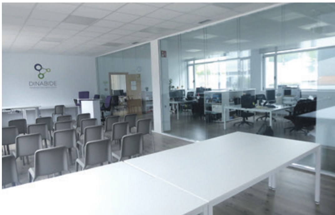
Dinabideko erabilera anitzeko gela eta coworking-a elkarren ondoan daude, baina bereiztuta.