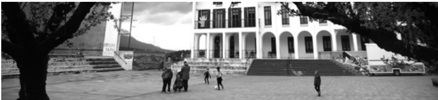
Irurtzungo plazan bi udaletxe daude: ezkerretan Irurtzungoa eta eskuinean Arakilgoa.