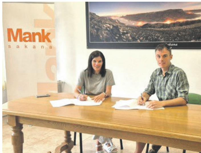
Gobernuko Berta Miranda Ordobas eta Mank-eko buru Aitor Larrazza Carrera.

Ibarreko bizikleta bidea egiteko Nafarroako Gobernuak eta Sakanako Mankomunitateak hitzarmena sinatu zuten agorrilaren 9an. Adostutakoaren arabera, gobernua arduratuko da estatutik jasoko den dirulaguntza tramitatzeko eta kudeatzeko, eta obrak kontratatuzko eta gauzatzeko erabiliko da. Bien arteko hitzarmen berezi baten bidez gauzatu da fondoaren inplementazioa. Mank-ek kudeatuko du obraren lizentziazioa eta exekuzioa. Hitzartutakoaren arabera, lanak hiru urteko epean gauzatu dira, Nafarroak estatutik jaso-