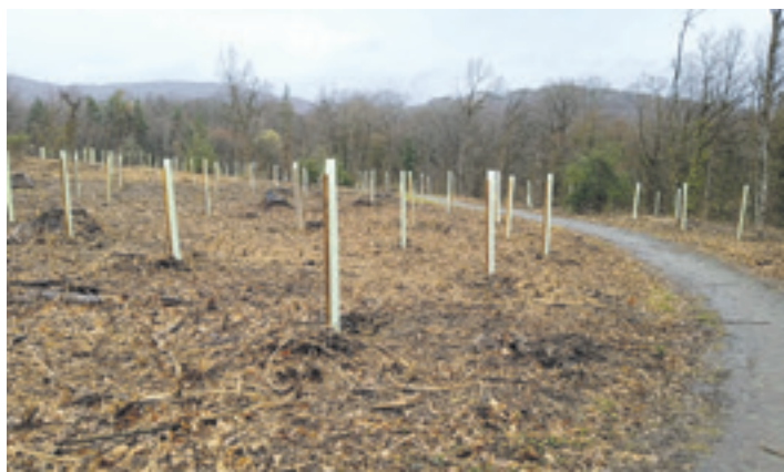
Basoixin joan zen urtean landatutako zuhaixkak.