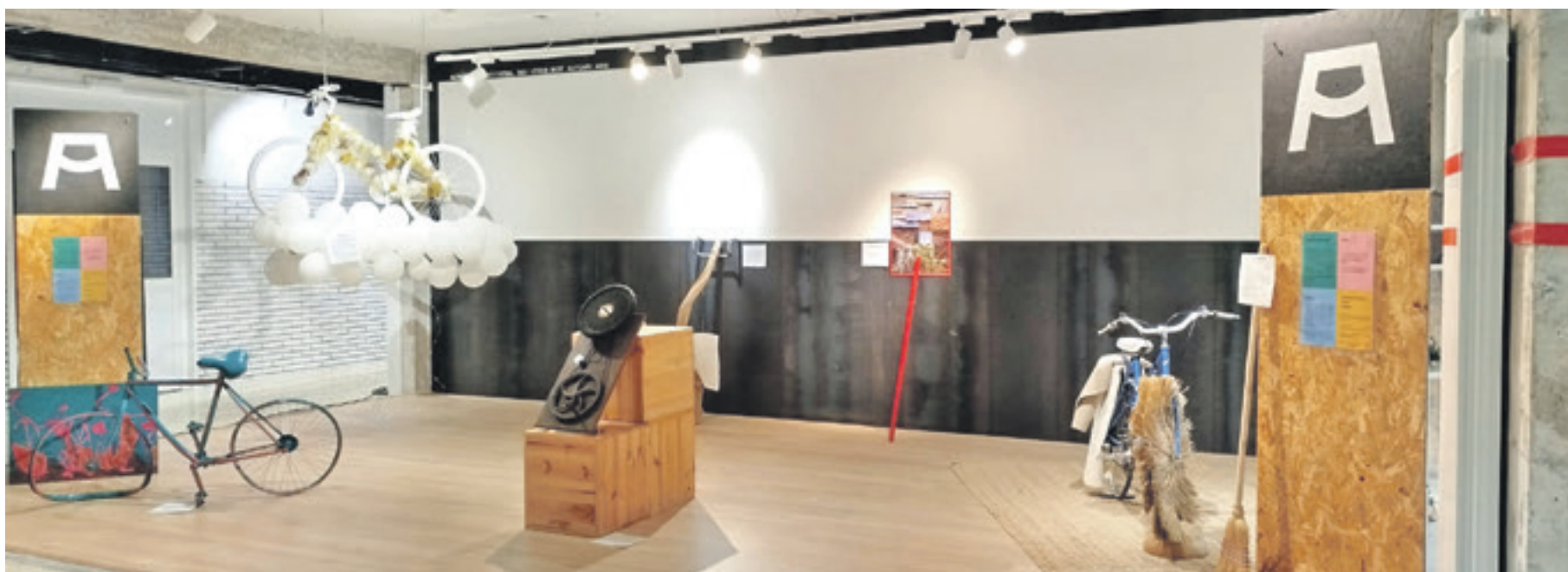
Artekleta erakusketa Altsasu institutuan.