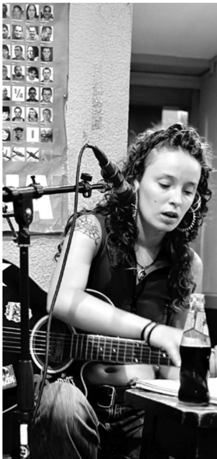
'Nerepe' musikari arbizuarra kontzertu batean.

Mundu berri bat, "literalki". Euskal raparen edo raparen