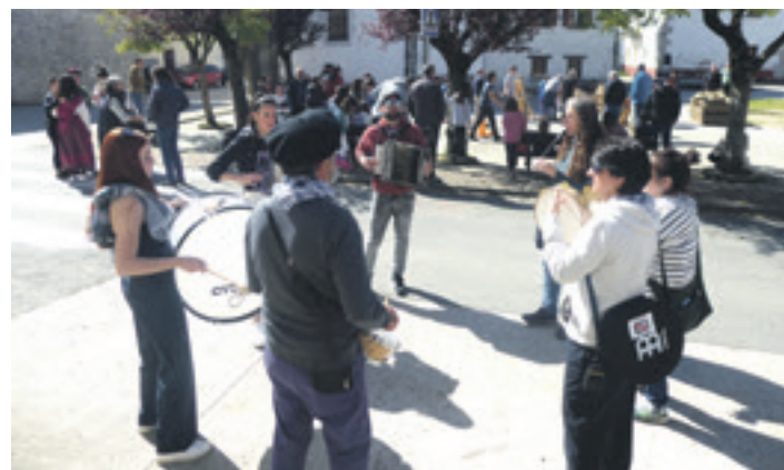
Ihabarko fanfarrea herriko plaza giroten.