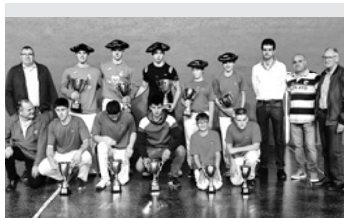
53. Otadiko Kristo Deunako finalistak, bestelako ordezkariekin. PILOTAJAUKU

Denboraldi berriaren atarian dago. "Garai polita heldu da. Diario Vasco, Zaldibarko txapelketa eta Nafarroako Binakako Txapelketa hastear daude. Beraz, entrenamendua onak egitea da asmoa, konfiantza hartzen segitu, erritimoa hartu eta partidak datozen heinean konfiantzarekin jokatu, irabazten saiatzeko". Ez du lan makala.