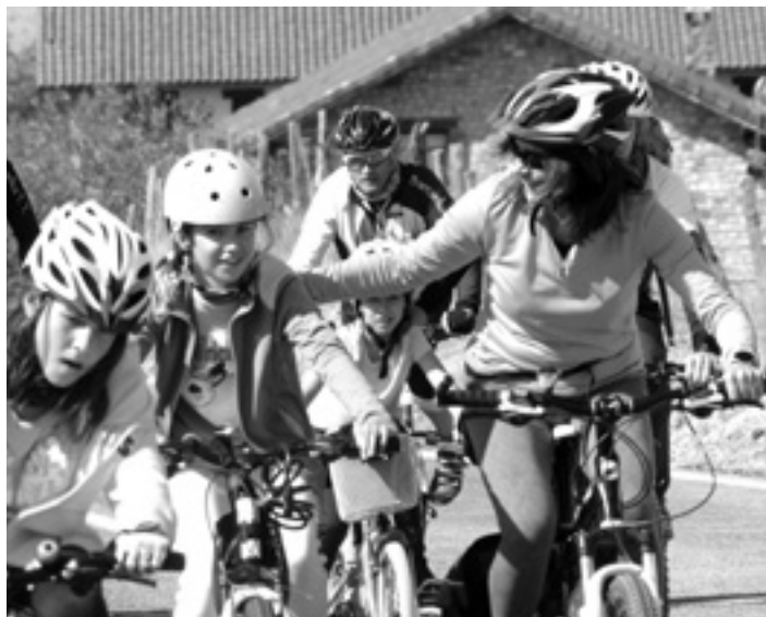
Familiak, kuadrillak, lagunak... parte hartze anitza du Sakanako Bizikleta Eguna.

Barranka Txirrindularitza Taldekoak gehienbat ibilbideaz arduratzen dira. Batzuk aurrean