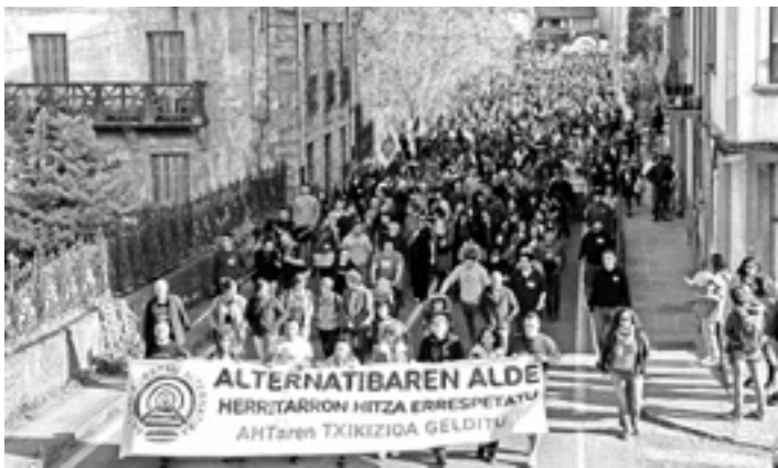
Tren publiko eta sozialaren alde egindako manifestazioa.