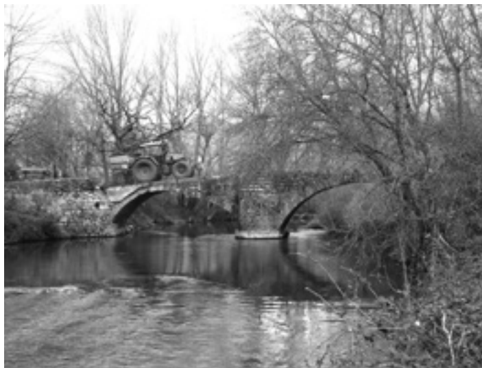
Traktorea hondatutako zubiko begiaren gainean.

Damoklesen ezpata bihurtu zaio zubia Hiriberri Arakilgo Kontzejuari. "Horregatik, ez diegu beste lan batzuei heltzen, eta ez dugu aurrera egiten". Esaterako, kontzeju etxean bi lan dituzte aurreikusita. Batetik, atzeko aldean dagoen atea berritzea. Eta, bestetik, eraikina bera marrotzea. Hala ere, kontzeju buruak