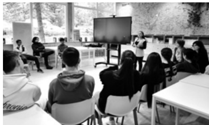
Ekintzaile bat Altsasu Bigarren Hezkuntzako Institutuko ikasleekin. UTZITAKOA