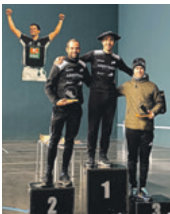
Astiz, gorenean. FEDERAZIOA