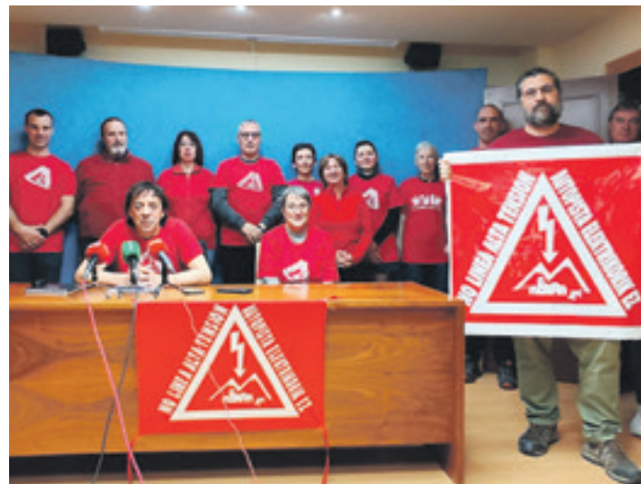
Plataformako kideak. Erdozia, eskuinetik hasita bosgarrena.

Ingurumen inpaktuari buruzko txostena ez zegoen behar bezala