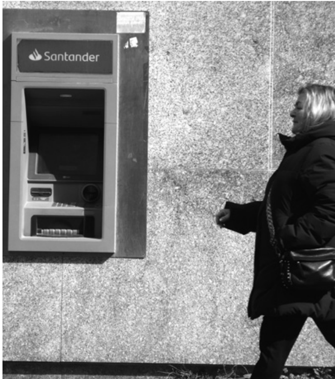
Emakumezkoa Irurtzungo kutzazain baten aldamenetik pasatzen.

Orozek esan duenez, "herri txikiok halako zerbitzuak defendatu behar ditugu, herrietan eduki behar ditugu. Banketxeen irabaziak ikusten ditugunean, azkenean gure diruarekin zer diru irabazten duten, ez da asko eskatzea herri txikiak zaintzea. Herri txikiak ere garrantzitsuak dira".