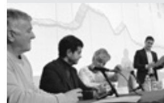
Bi alkateak, hitzarmena sinatzen.

Aurkezpen ekitaldia hasi baino lehen, protagonistek antolatzaileek, Altsasuko eta Etxarri Aranazko alkateek, txirrindulari ohiek, kirol zuzendariak eta bestelakoek—talde argazkiak egin zituzten lortuak korridorean.