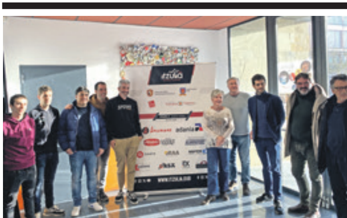
Itzulia Sakanara heltzeko gutxi falta da / 15

Sakanan 21 banku eta kutxa bulego daude, 978 sakandarreko bulego bana / 2-5