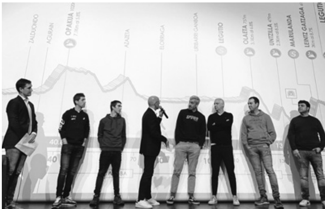
Amarika, Nieve, Mintegi, Guajardo, Flores, Hernandez, Azanza eta Guerrero. Itzulia Sakanan egotearen garrantziaz aritu ziren.