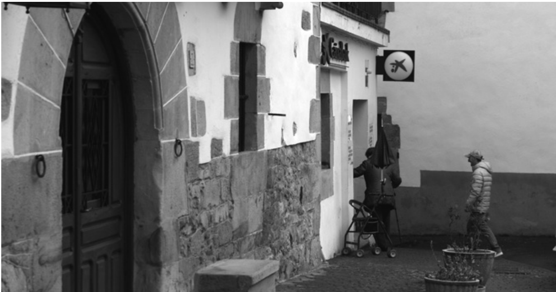
Emakumezkoa eta gizonezkoa Urdiaingo banku bulegoan sartzeaz.

tzeko arazoak dauzka, eta hari gustatzen zaio dirua ibiltzea. Jakina, banku bulegoa bi egun zabalik izanik, jende jarriak kristoren arazoa dauka". Jubilatukoak diruaz aparte, txartela eta libretarekin egiten ditu ordainketak. Irigoienek esan duenez, "batzuetan pin-arekin gaizki ibiltzen naiz, baina bulegoko langileak esan zidan nola egin, eta kitto".