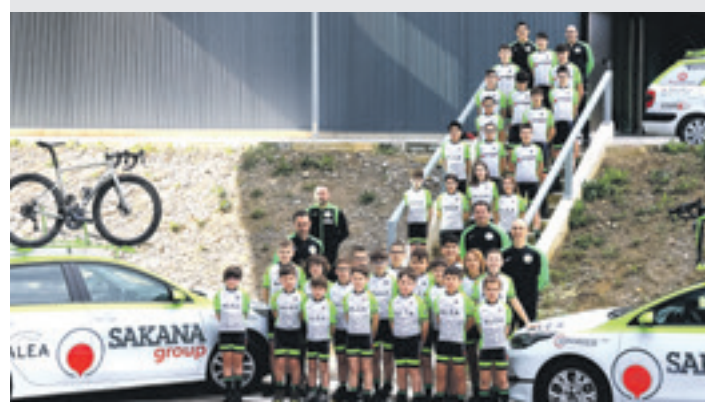
2024 denboraldiko Sakana Group-Alea Aralar taldea.