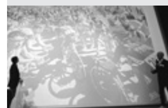
Sakana betetzea espero dute.