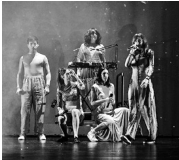
'Badon' antzezlanaren une bat.