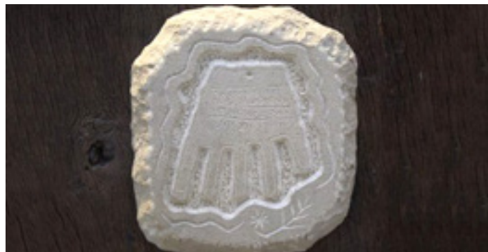
IORTIA KULTUR GUNEA

ALTSASU Sorioneke! Euskal Eskultura 2.100 urte: 50 eskultorek parte hartu dute Eskuahaldunak, Euskal Herriko Eskultoreen Elkartearen erakusketa. Otsailaren 20etik martxoaren 20ra. lortia kultur guneako erakusketa aretoan.