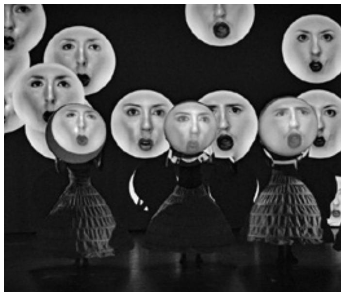
'Badon' antzezlanaren une bat. UTZITAKOIA