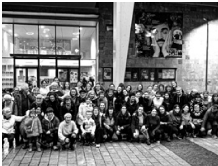
Plaza dantzako parte hartzaileak. ETORKIZUNA

Altsasuko Etorkizuna dantza taldeak Aguraingo Dardara Gunearekin batera zita bat jarri zuten otsailaren 25ean, igandean, 18:00etan Foru plazan; Plaza dantzak ekimena antolatu zuten. Eguna iritsi eta euri zaparradak kontuan hartuta, azken orduan saioa lekualdatu zuten eta Iortia zabalguneko estalpean bildu ziren hainbat herritar. Dantzarien esanetara adin guztietako hamarnaka herritar aritu ziren jauziak eta bestelako euskal dantzak ikasten eta egiten. Igande arratsalde euritsu desberdina pasa zuten, dantzarekin gozatzeko.