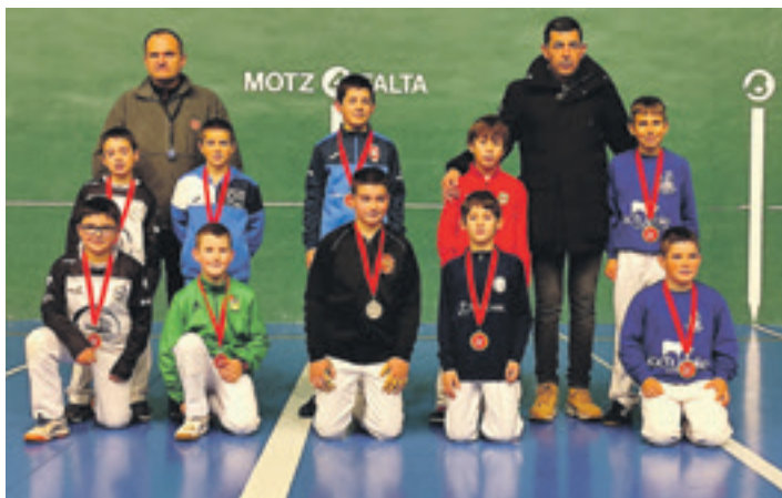
ALDABIDE PILOTA KLUBA