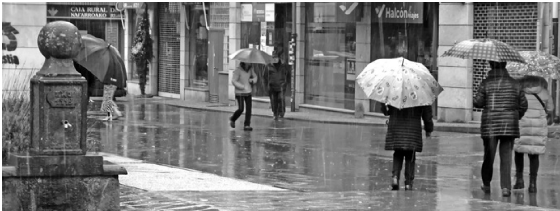
Manosferako mezuak pantailetatik harago zabaldu dira.