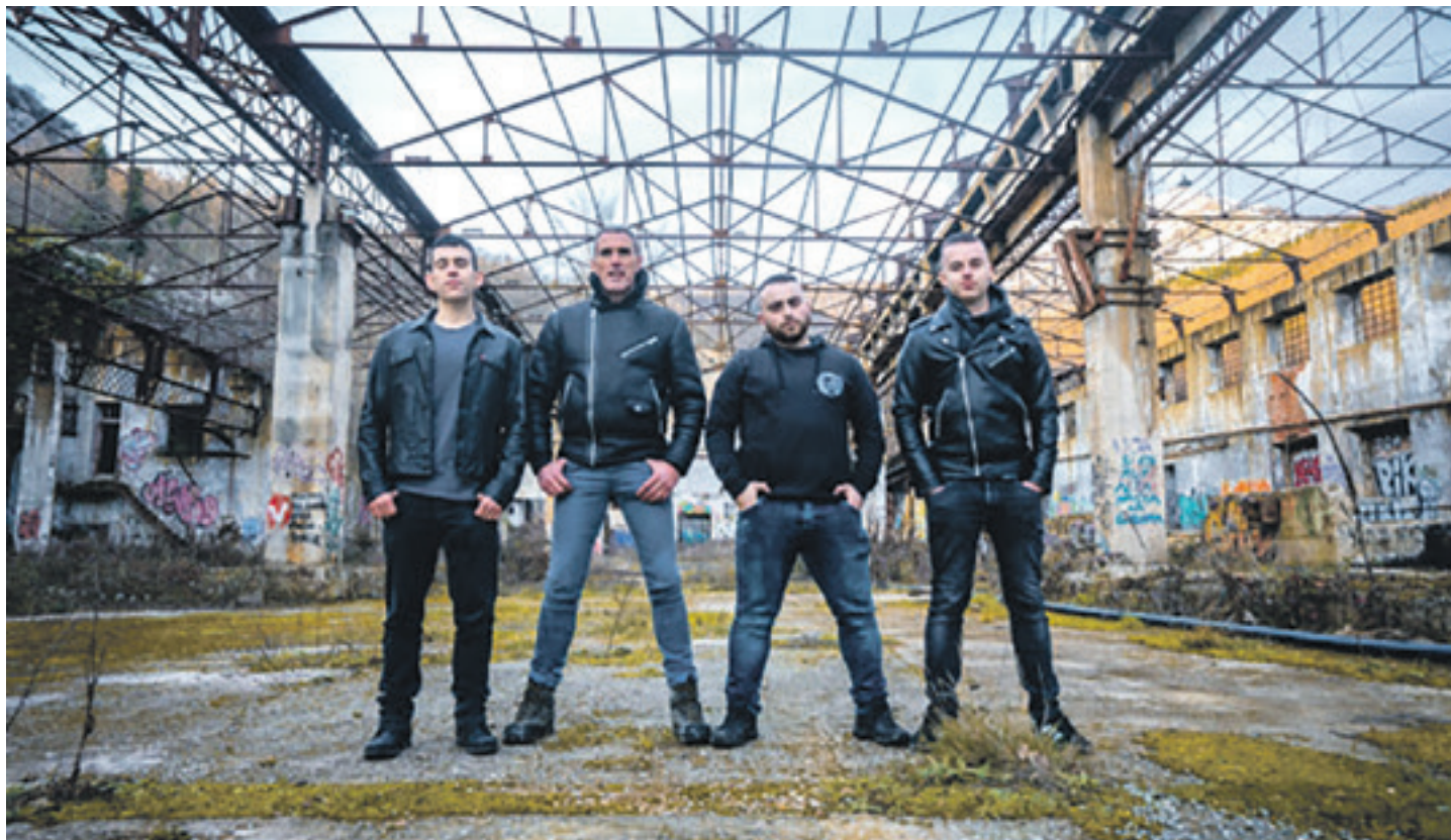
Muga Zero taldea. UTZITAKOIA

"Guk gure musikari eta letrei etxeko punk-rocka esaten diogu. Ez dakigu zehazki nola azaldu", esan du Gaskok. Baina epai-mahaiak esandakoarekin ados daude taldekideak. Lanz: "Definitzioa izan daiteke, bai. Ez dugula sekula pentsatu, baina ongi definituta dago". Lakuntzan "beti" eman den punk horren "jarraipena" egiten du Muga Zerok.