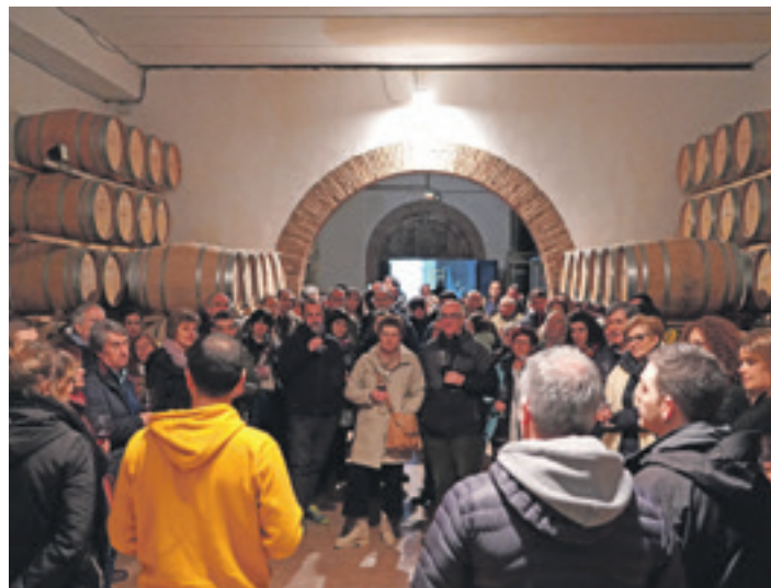
Errigoraren kanpainaren aurkezpena upategi batean egin zuten.

Merkatuaren logikak aginduta oliba olioaren prezioa igotzen ikusi dugu. Ikusi ditugu nekazari eta abeltzainak traktoreekin hiri eta errepideetan protesta egiten ere. Lehen sektoreko egoeraren gordina hiru datuekin azaldu dute Errigorako kideek kanpainaren aurkezpenean: Ager eremuko esplotazioen %36 desagertu dira azken 12 urteetan; Nafarroan nekazarien %7k baino ez ditu 40 urte baino gutxia-