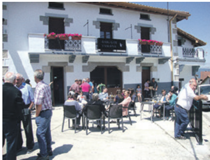
Taberna-jatetxea 2019ko garagarriaren 9an mustu zen.

Hartzen duenak urtero lau egunetan jan-edanak eman beharko ditu: San Adrian festetako astelehenean udalbatzari afaria ematea, Arleze egunean mendian