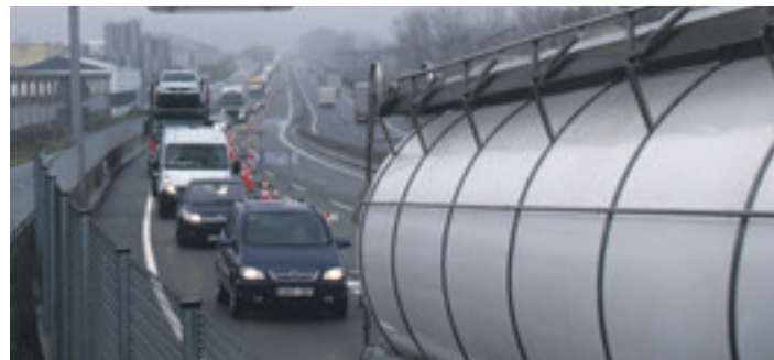
Autobia mozteak erretentzioak sortu zituen. Trafikoaren abiadura moteldu zen.

Altsasuko autobien lotura gunea eta Olatzagutia eta Ziordia arteko A-1 errepidearen desbideratzea eta bikoiztea 1998ko garagarriaren 23a mustu zuten. Nafarroako Gobernuak Ziordian trafikoa zenbartzeko duen neurgailuan egunero 20.721 ibilgailu pasatzen zirela neurtu zuen 2022an. Haietatik, %28,16 kamioiak ziren, hau da, 5.835 kamioi. Trafiko horren erdia herritik pasa da.