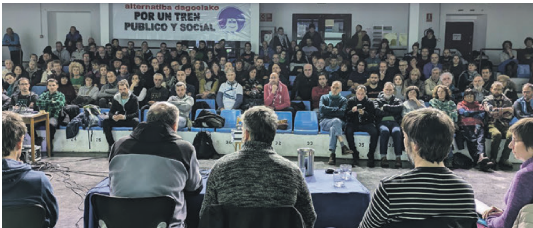
Jardunaldiaren barruan, 200 bat pertsona elkartu ziren larunbat arratsaldeko konferentzian.

Madril arteko trenbide nagusia da, garrantzitsuenetakoa bat da. Hortik pasatzen dira merkantzia eta tren espresak. Gasteiztik Altsasura Alvia moduko trenak 160 km orduko gehienezko abiaduran ibiltzen dira. Baina Gipuzkoan, portu aldean ezin dute abiadura hori hartu tunel eta bihurguneengatik. Eta aldiriko tren asko daudelako.