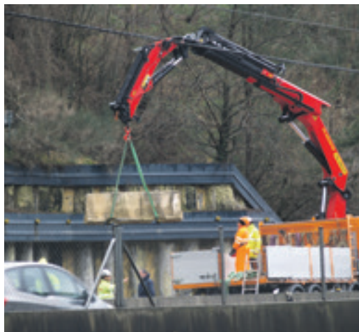
Piezak deskargatzen, bypassa egiteko eta obra babesteko.