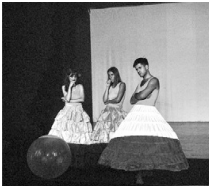
'Badon' antzezlanaren une bat.