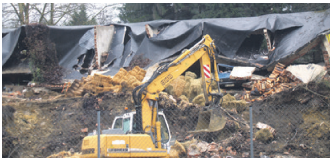
Luiziak euste horma bota zuen eta oinarririk gabe gelditu ziren goiko garajeak. Konpontzeko, mugitutako lurra kendu zuten.