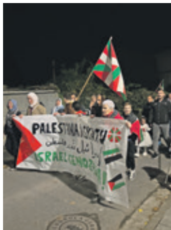
Palestinaren aldeko manifestazioa.

Plataformako kideek dirua bilitzeko ere baliatuko dute larunbateko deialdia. Bi helbururekin. Batetik, Israelgo agintariak epailearen aurrea eramatea. Bestetik, Mundu Bat gobernuz kanpoko erakundeak Palestinan proiektuak garatzera bideratuko