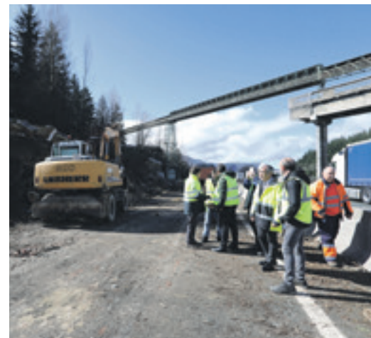
Agintariek eta porlandegiko buruak lanak bisitatu zituzten.