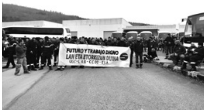
Langileek lantegian protesta egin zuten asteartean.

Enpresa batzordeak zuzendaritzari lau eskaera egin dizkio. Batetik, langileei jakinaraztea enpresaren finantza egoera zein den, eta nomina osorik zergatik ez den ordaindu azaltzea. Aldi berean, zuzendaritzari eskatu diote plantillari eta enpresa batzordeari jakinarazteko zein den berreskurapen plana. Bestetik, enpresa batzordeak soldata bere osotasunean ordaintzea exijitu du. Eta, azkenik, enpresa batzordeak nahi du berreskurapen