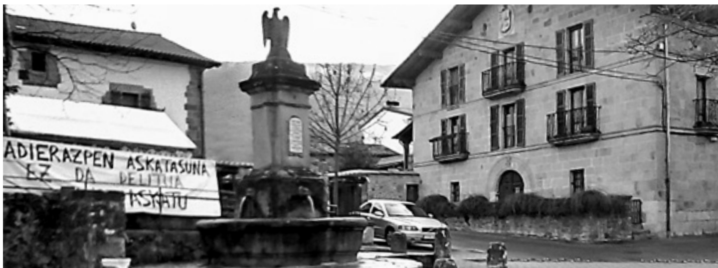
Iturmendiko plazan adierazpen askatasunaren eta atxilotuaren askatasunaren aldeko pankartak jarri zituzten.