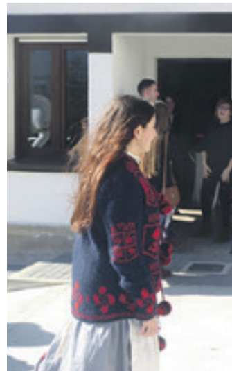
Joan den urteko kintoak.

Baina haiek ez dira kinto ospakizuneko protagonista bakarrak kinto zaharrek eta kinto gazteek haiekin bat egiten baitute. Ospakizunak irauten duen hiru egunetan baserriarrez jantzita ibiliko dira.