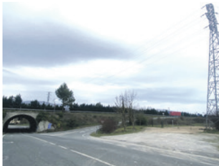
Sakanako Autobidearen (A-10) ondoan egin du udalak kamioiendako aparkalekua.

Orozek gaineratu duenez, "aparkalekuaren araudia otsailaren 6ko udal bilkuran onartu genuen. Jendaurrean jarri, jendeak ekarpenak egin eta behin betiko onartuta egoteko udaberria izanen da. Araudia indarrean dagoenean hasiko dira kamioiak aparkalekua erabiltzen". Alkateak azaldu duenez, jabetu ziren kamioiak uzteko toki aproposik ez zegoela herrian, eta "araudi bat egin aurretik alternatiba bat eskaini beharra gurela iruditu zitzaiz-