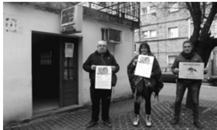
Antolatzaileetako batzuk bilketa eginen den lokalaren alean.

Sundsundeguiko enpresa batzordeak lantegiko zuzendaritzari bosgarren eskaera egin zion. Atzo, otsailak 8, 13:40an informazio batzarra egitea. Enpresa batzordeak soldata osorik kobratzea eskatu zuten. Bestalde, sindikatuek iritzi desberdinak dituzte. Eta zer pauso eman aztertzen ari dira. Erredakzioa ixterakoan ez genuen batzarrean jasotakoaren berririk.