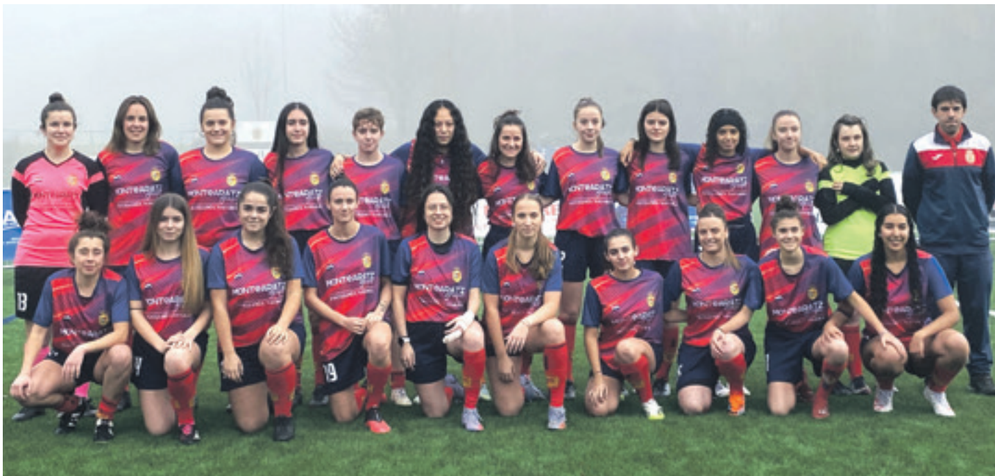
Emakumezkoen Preferente Mailako Altsasu taldea, 2023/2024 denboraldiko aurkezpenean.