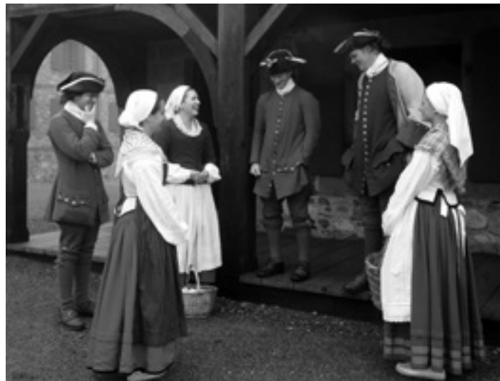
Louisbourgeko aktoreak.