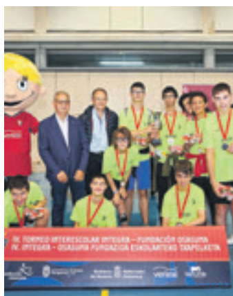
Fundazioaren torneetako bat. OSASUNA F.