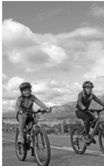
Igandean partaidetza handia espero da.

Aurtengo edizioak harrera oso ona izan du, "jendea ilusioz dago, nabaritzen da. Berriei urtero errepikatzen dutenak gaineratuko zaizkie, eta 10 urtetik gora nagusirik gabe etor daitezkeenez, adin horietan ere neska-mutiko askok ematen dute izena. Oso kontentu gaude" gaineratu du.