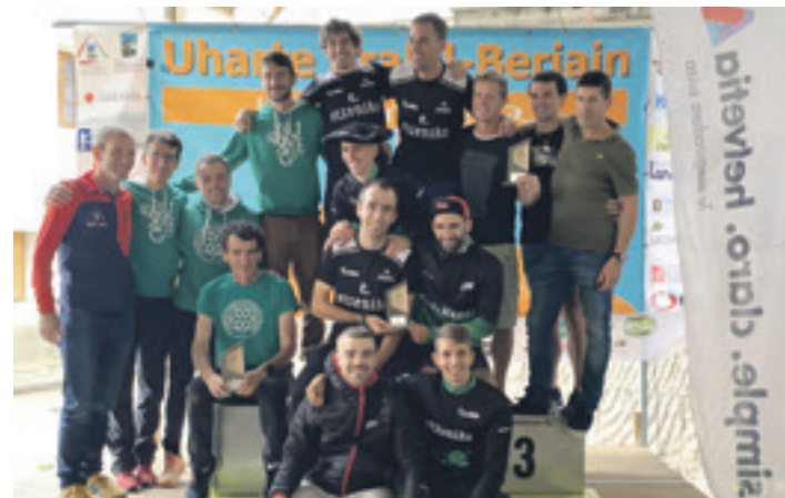
Sakana Bizirik taldea, eskuinean, Nafarroako Km Bertikalen hirugarren taldea.