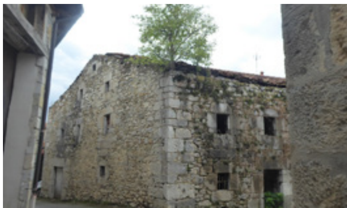
Ekaiako Ganadero etxea, udalak esku hartuko duenetako bat.