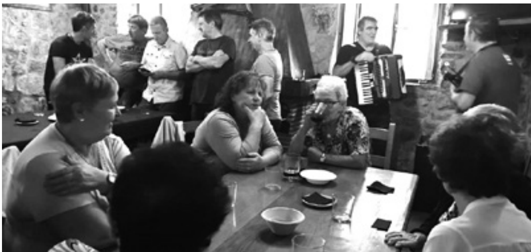
Bazkaldu ondoren kantu eta dantzarako tartea ere izan zen. UTZITAKOIA