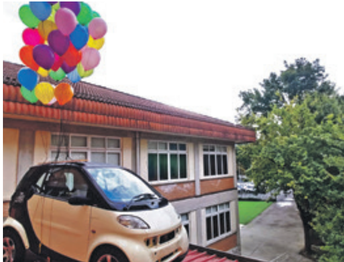
Hegan aterako dela dirudien autoa institutuko sarrerako teilatuan.

Altsasu institutuak 585 ikasle ditu ikasturte honetan. Sakana-ko gainontzeko herrietatik ikastetxera autobusez joaten dira ikasleak, baina 260 bat ikasle altsasuarrendako ez dago garraio publikorik. Eta institutuaren ondoan Iñigo Aritza ikastola dago. Ikastetxerako eguneroko joan-etorria "ikasle batzuek oinez egiten dute, besteek bizikletaz eta beste askok autoz", azaldu dute ikastetxetik. Ondorioa jakina da, ikastetxeko sarrera-irteera orduetan "ibilgailu, autobus eta oinezkoen pilaketa arrisku-tsuak sortzen dira". Ikastetxetik gaztigitatu dutenez, "horri gehitzen bazaio argiztapen eskasa, eta lurzoru eta espaloien egoera txarra, arriskua biderkatu egiten da. Horregatik behar-beharrezkoa jotzen dugu ikasle horiei guztiei konponbide bat eskaintzea: argiztapen egokia, errepidea eta espaloiak berritzea, eta bizikleta, patinete edo oinezkoiegi egokitutako bidea egitea; horrela, Altsasu jasangarriago, osasun-