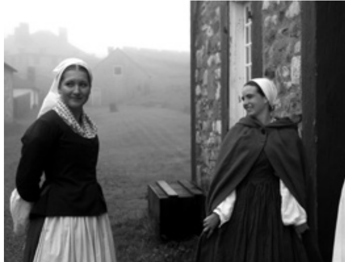
Louisbourgeko Emma Goyetche eta Maddi Beltza.

Bai eta ez. Horrela espero nuen, baina Amerikako Estatu Batuetako eragin handia du. Baina badauka bere identitatea ere.