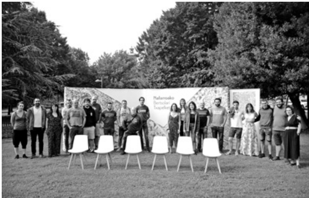
Nafarroako Bertsolari Txapelketaren aurkezpena. NAFARROAKO BERTSOZALE ELKARTEA