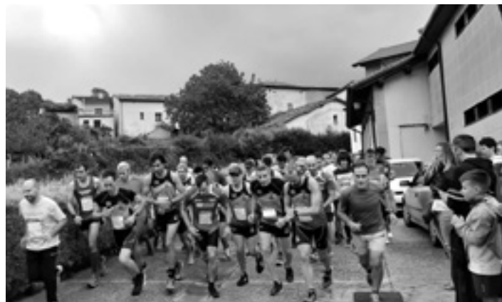
2019an Dorraotik abiatu zen, 2022an Lizarragatik eta aurten Unanutik.

Igandera begira, zenbait gomendio egin ditu antolakuntzak. "Bizikletak ongi prestatu behar dira. Segurtasuna bermatzeko ezingo da antolakuntzak zehaztutako ibilbidetik atera, eta, jakina, kaskoa derrigorrezkoa da. Hamaiketako norberak eramango du. Eta azken gomendioa, ongi pasatu eta Sakanaz gozatu".