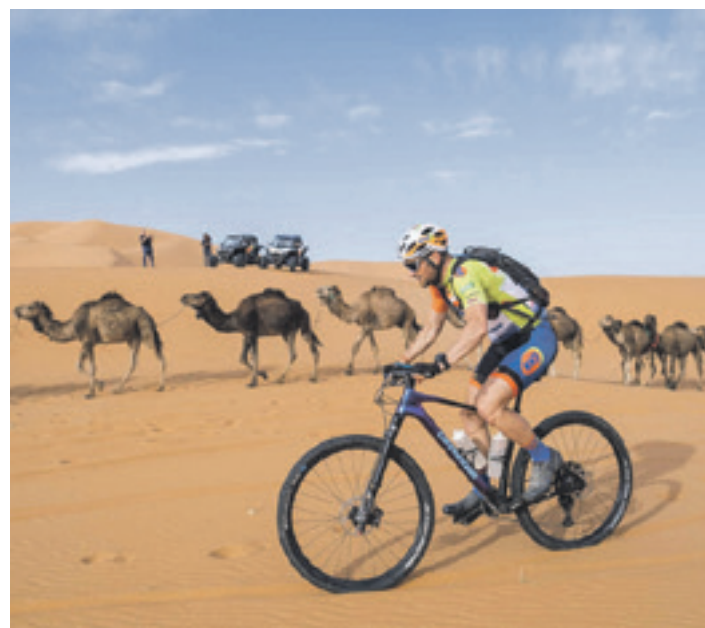
Bikerrek basamortuari egin beharko diote aurre. SKODA TITAN DESERT