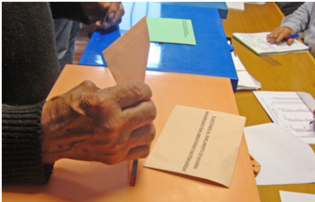
Maiatzaren 28an berriro hautesontziak erabiliko dira.