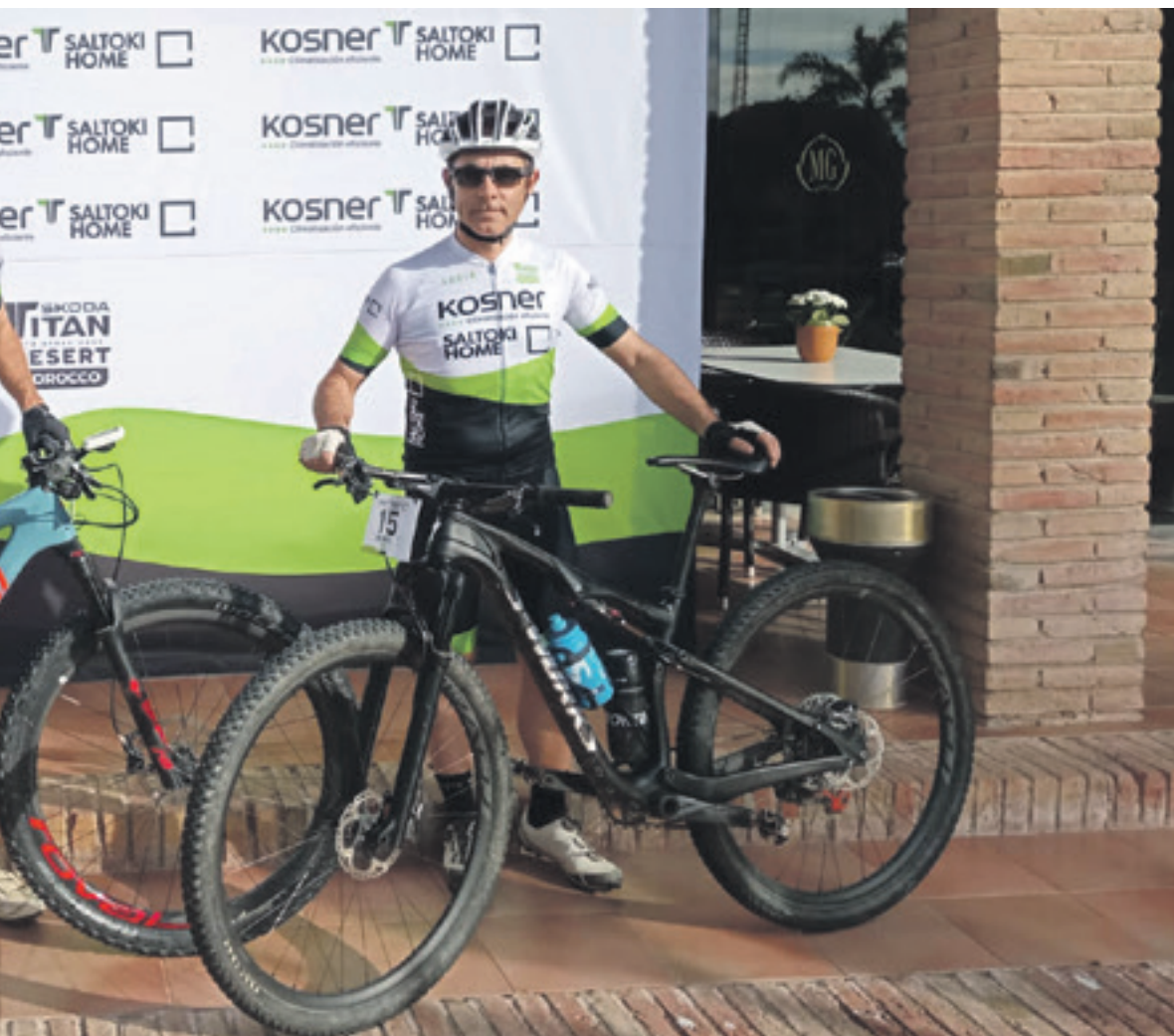
parekin, Titan Deserterako prest. HOSNER-SALTOKI HOME

mendian hasi eta basamortuan sartuko da, eta etapa nagusia izango da, maratoi etapako lehen sektorea (129 km). Txirrindulariek ezingo dute mekanikarien ez kanpokoen laguntzarik jaso. Laugarrena maratoi etapako bigarren sektorea izango da (133,5 km), bosgarrena dunen artean jokatu da (98 km) eta seigarrena eta azkena etapa gorabeheratsua, Maadideko final klasikoa izango duena (71 km).