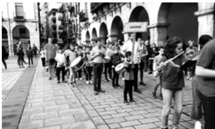
Haize Txikiak Bandako kideak Azpeitian kalejiran.