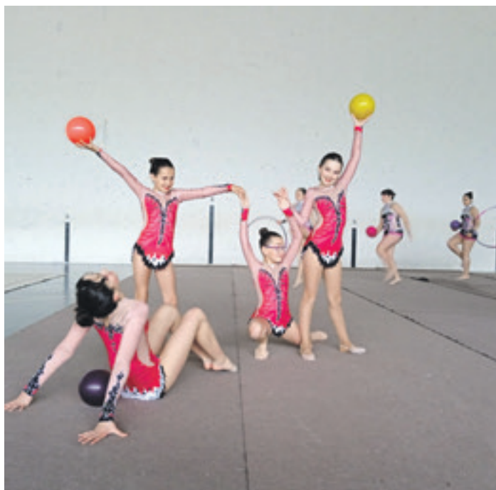
Iskizako talde bat, Olaztiko erakustaldia aurkezteko prest. ISKIZA SAKANA

Txapelketa mailako gimnastek haien bakarkako lana azken aldiz erakutsi zuten, banakako txapelketak bukatu baitira. Bestalde, kimu, haur eta kadete mailetak txapelketako taldeek maiatzaren 20an Tafallan erabakiko den Nafarroako Gimnasia Erritmikoko Txapelketan defendatuko dituzten ariketak mustu zituzten. "Taldekako modalitatean aritzeak koordinazio garrantzitsua eta