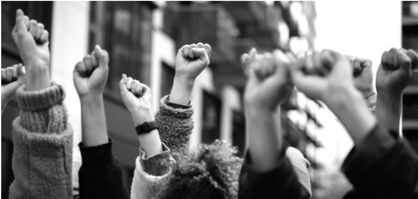
Asteleheneko hainbat mobilizazioetan errepikatuko den keinua. UTZITAKOIA