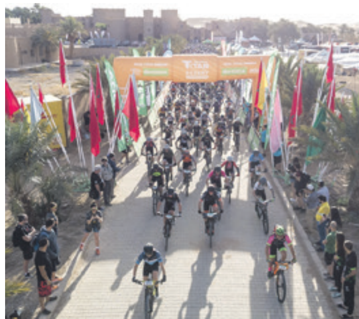
2022ko Skoda Titan Desert etapa baten hasiera. SKODA TITAN DESERT