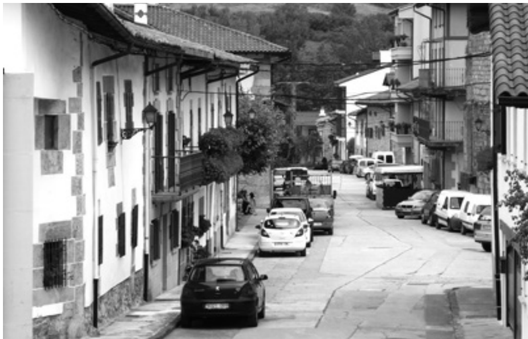
Erreka kaleak herri guztia zeharkatzen du.