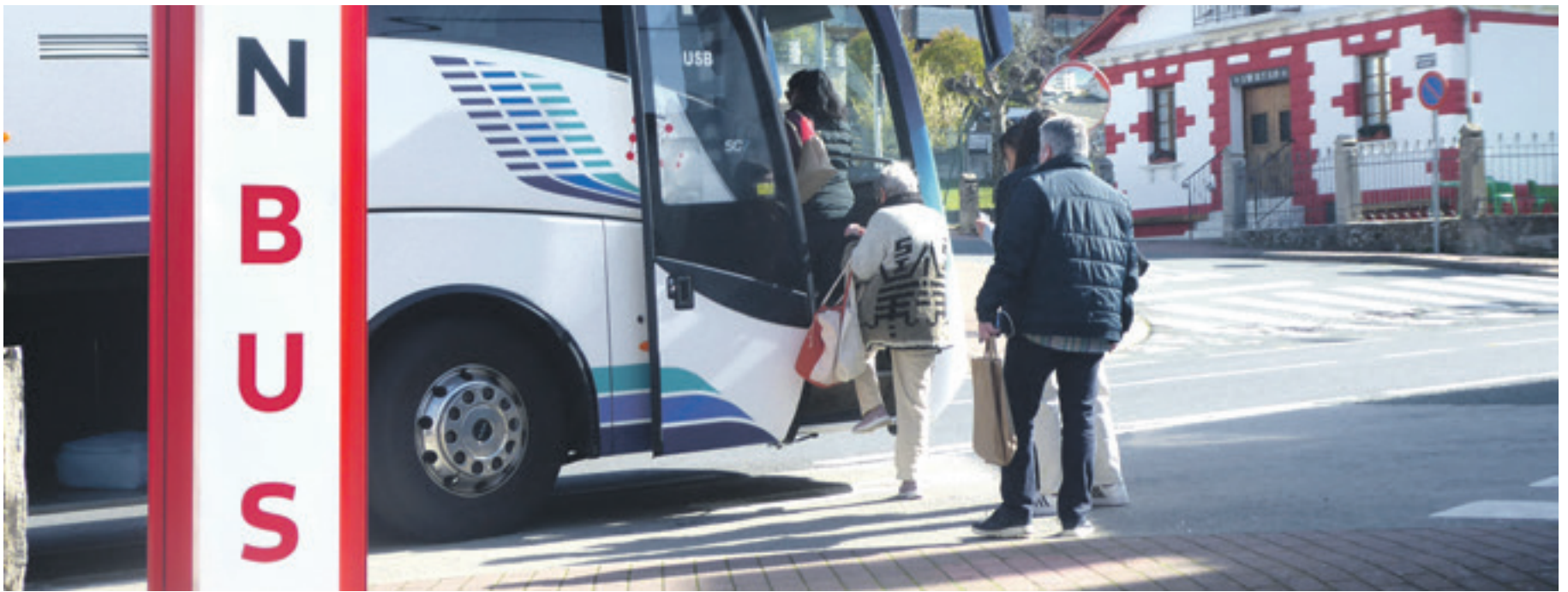
Irurtzundarrak Iruñera eramane dituen autobusera igotzen.