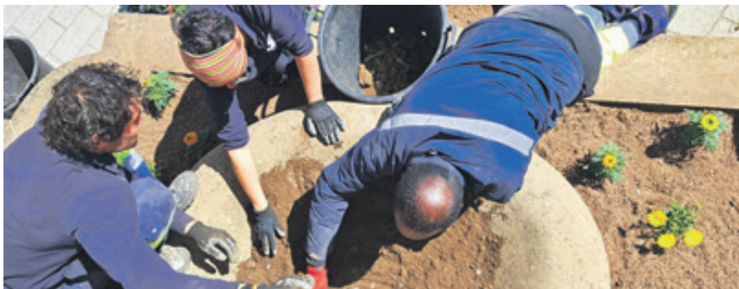
Langileak loreak jartzen lortia plazan.