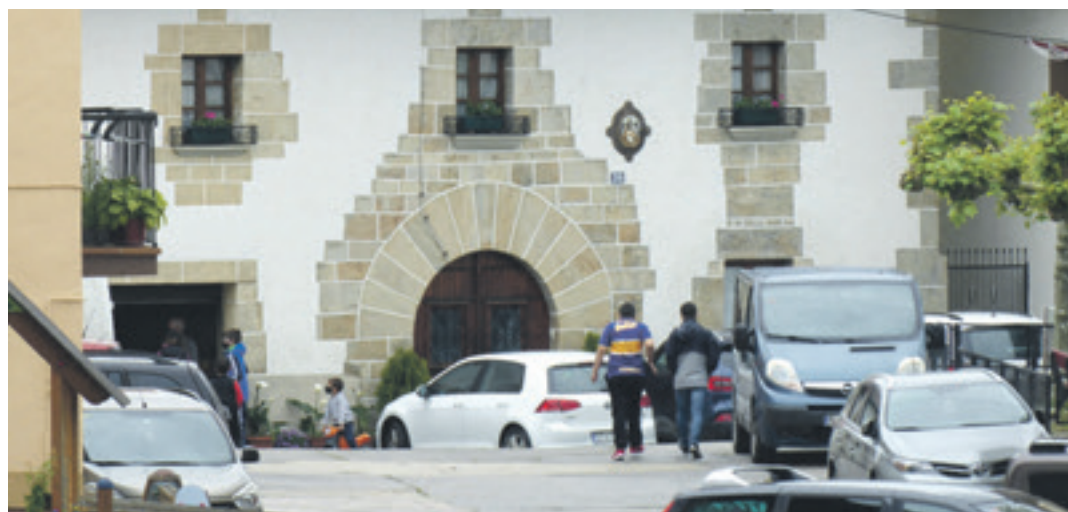
Etxarrendarrak kalean.