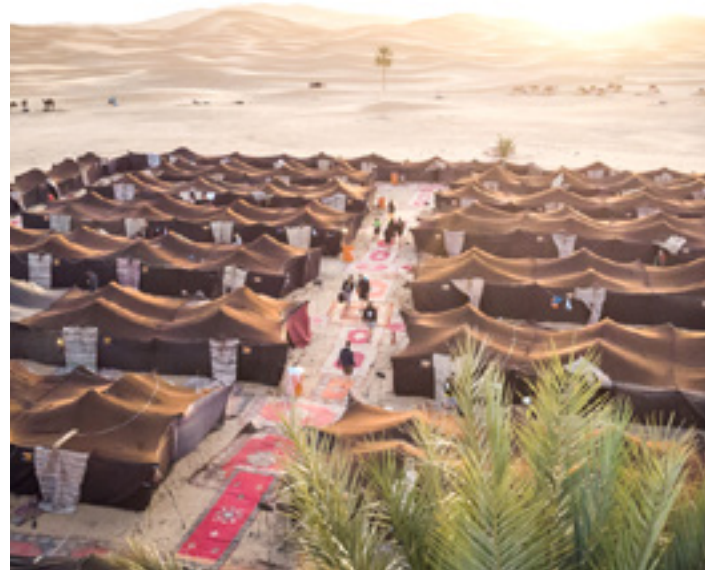
Gaua kanpamenduetako haimatan egiten dute. SKODA TITAN DESERT