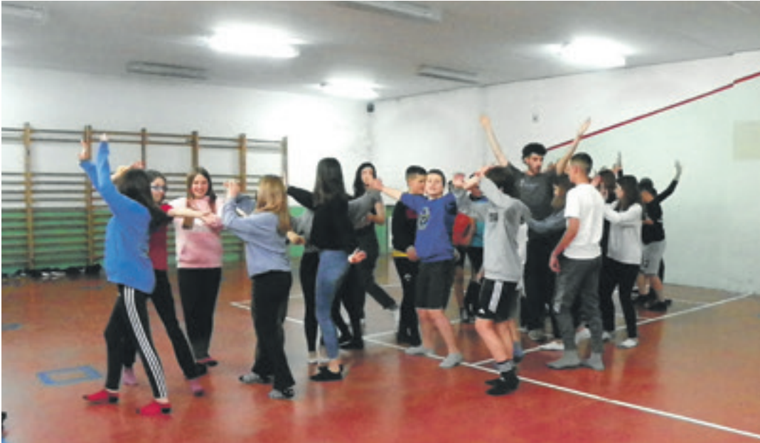
Andra Mari Ikastolako DBH 1. mailako ikasleak Oholtzara salto programaren saio batean.

"Hogei bat pertsona nola gidatu, nola egin zurekin denbora guztian egoteko eta inor ez esertzeko. Adibidez, bihurrienari erresponsabilitate bat ematen badiozu, talde guztia irabazi duzu".