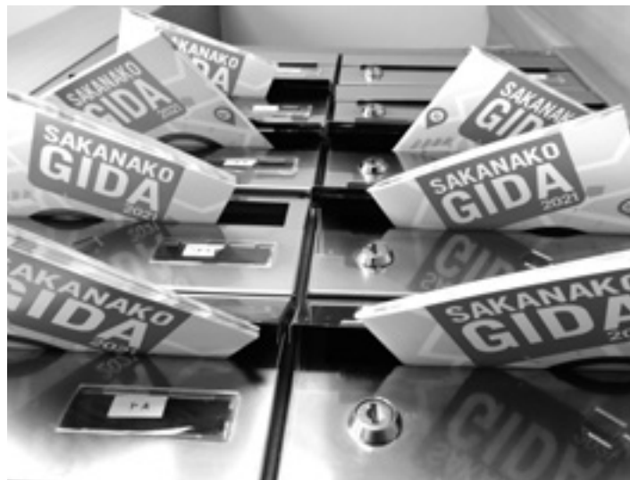
Ibarreko postontzi guztietara iritsiko da Sakanako Gida urte akaberan.

Gidak balio du tokiko ekonomia-aren muina diren zerbitzu eta establezimenduen eskaintza zabalak sakandarrei eta bisitariei ezagutarazteko. Sakanakoari balioa eman eta aitortzeko, ibarreko zerbitzu eta establezimenduekin harremanak estutu eta bultzada emateko helburua du. Pandemiak tokiko merkataritzaren eta zerbitzuen premia agerian utzi zuen. Merkataritza txikiak asko sufritu zuen, eta pairatzen ari da gaur egungo