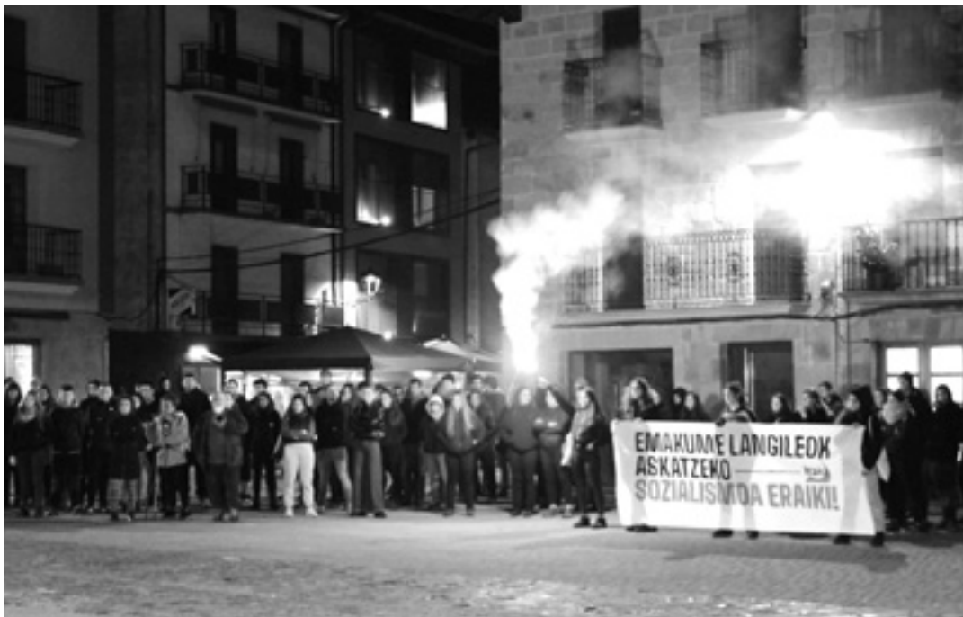
Itaiakoen indarkeria matxistari aurre egiteko sozialismoaren eraikuntza aldarrikatuko dute. UTZITAKOA