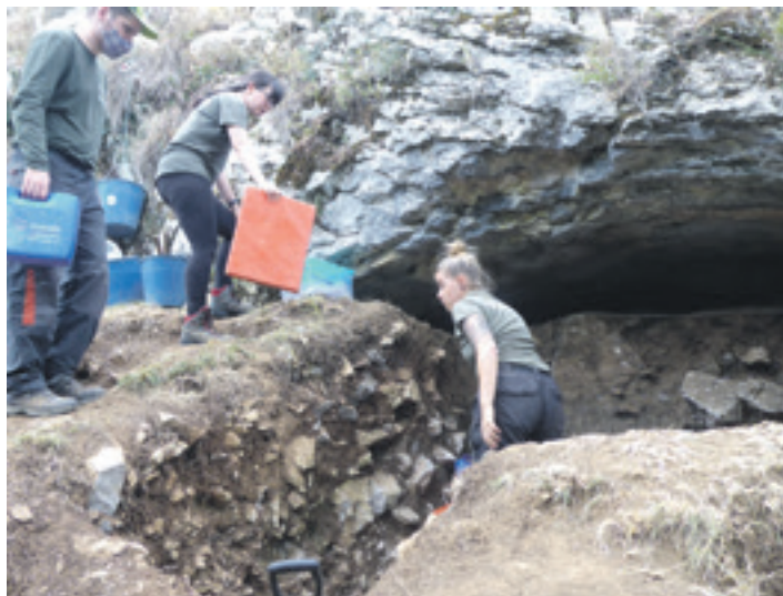
Arkeologoak Koskobilo II lezean.

25 metroko desnibela gainditzeko 150 metroko luzera eta metro bateko zabalera duen bidea zabalduko da, %16ko malda izanen duena. Bidearen zoruan kaskailua jarriko da. Pertsonak bai, baina animaliak ez sartzeko pasabidea jarriko da ere. Bidea pintura berdearekin eta proiektu-