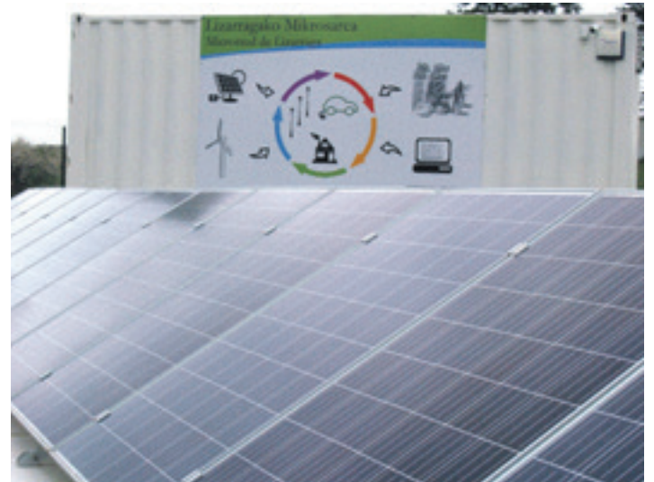
Lizarragako mikrosareko eguzki plakak.

Energia komunitatea "elektritzitatea sortu eta kilowatta merkeago ateratzea baino askoz gehiago da. Hainbat arlo hartzen ditu: ingurumena, gizartea, pertsonen ingurumen eta gizarte konpromisoak, zero kilometroa, jasangarritasuna, tokiko enpresak laguntzea...", nabarmendu du Agirrek. Eta gaineratu duenez, "jendeak egin nahi duenaren eta hartu nahi duen konpromisoaren arabera haziko litzateke. Tresna