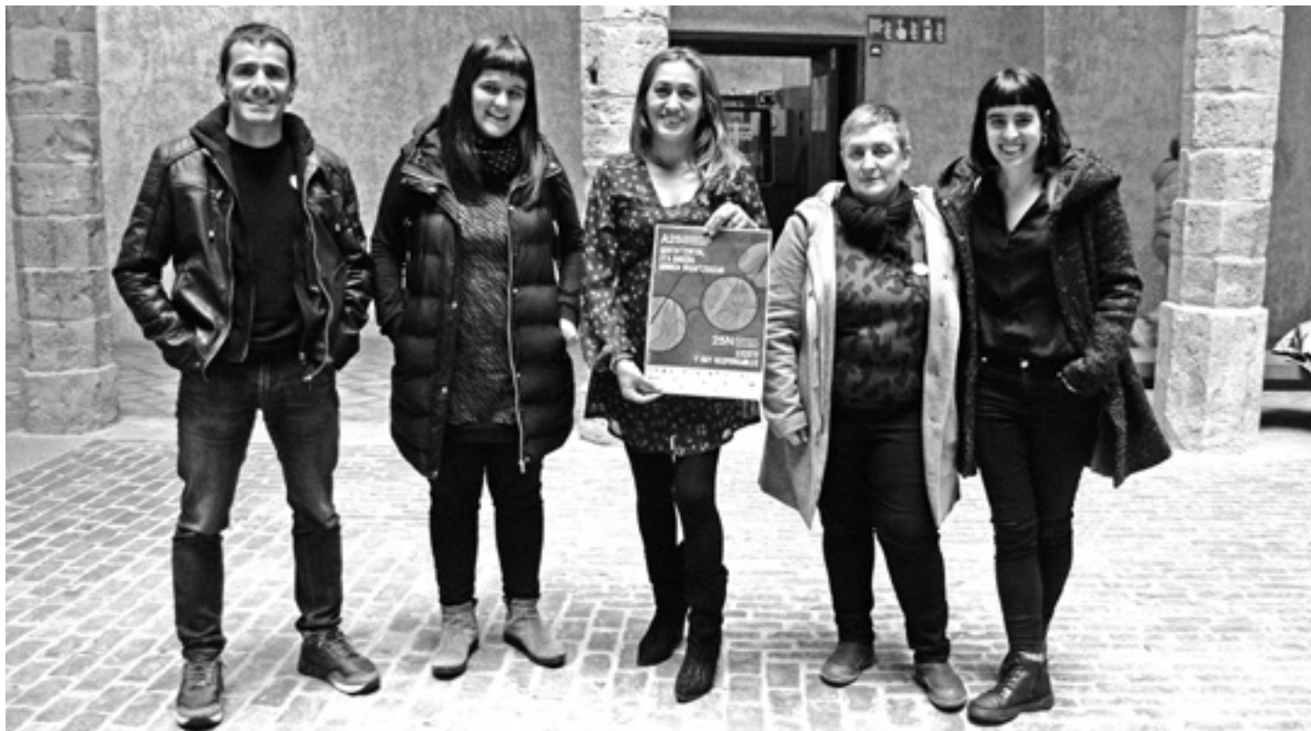
Nafarroako aurkezpenean Urdiain, Sakanako Mankomunitatea, Lakuntza, Etxarri Aranatz eta Arbizuko ordezkariak egon ziren.