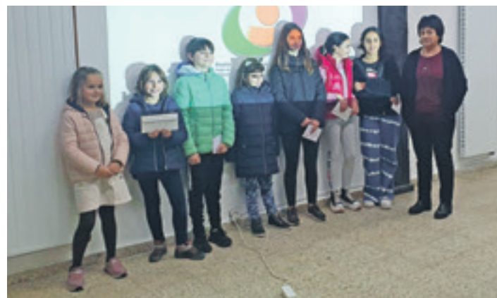
Lehiaketan sarituak izan diren haur eta nerabeen talde batzuk.

Koskobilo II lezearen sarreran %40ko aldapa dago. Han lurrera finkatutako 3x2 metroko burdin sare sendoaz egindako plataforma jarriko da, lau pertsonendako tokia izanen duena; hara eskailera batzuen bidez igoko da. Lezearen sarreran, bestalde, 3,5 metro zabal eta 4 metro luze duen teilatua jarriko da.