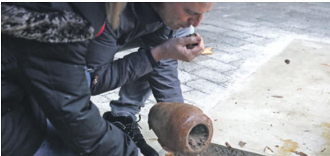
Hobietako bateko lurra memorialean uzteko momentua.