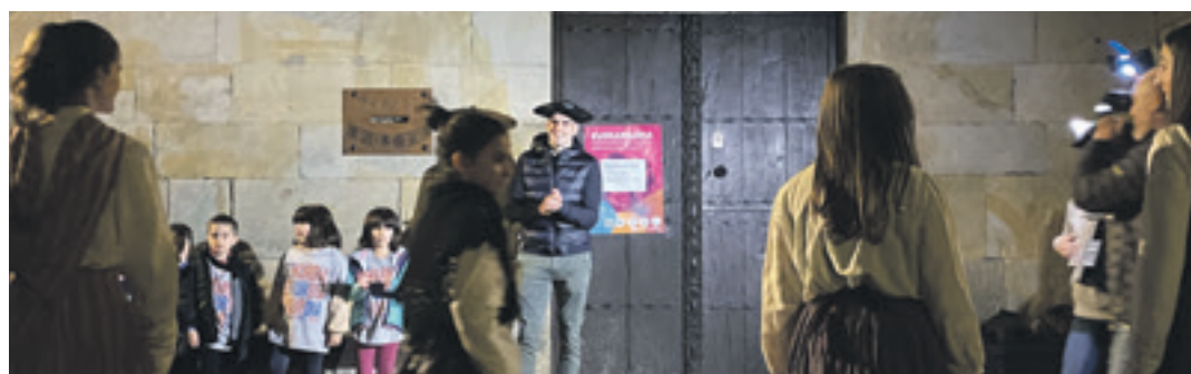
Ezkurdiaren zaleak, pozik. Arbizuarek ongi etorri hunkigarria egin zioten txapeldunari.

nire lana zein izan behar zen: partidari sartuta egotea. Partidatik ez ateratzeko exijitu nion neure buruari. Eta harro nago lortu nuelako” dio.