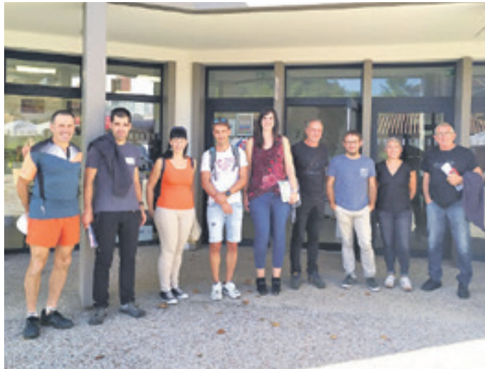
Sakandarrak Baigorri harrera egin zietenekin batera. Elkarlana aztertzen ari dira.

Lastailean bi bilera egin zituzten aldeek. Sakandarrekin batera