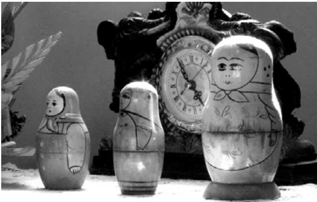
Matrioska panpinak 'Matrioskas. Las niñas de la guerra' dokumentalean. UTZITAKOIA