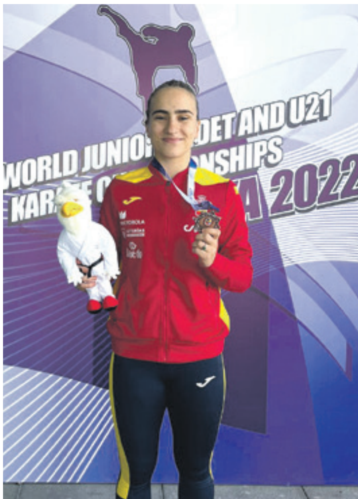
NAFARROAKO KARATE FEDERAZIOA