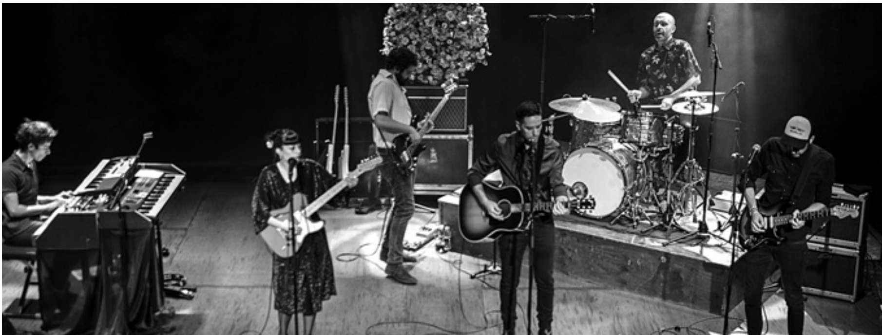
Pasadena taldea kontzertuan. UTZITAKOA