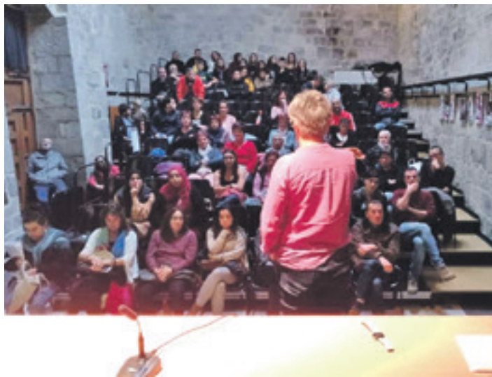
Diagnostiarenekin aurkezpenaren kultur etxea bete egin zen. UTZITAKOIA

Nafarroako Gobernuako Migrazio Politiketako Departamentuaren dirulaguntza (14.000 euro; udalak 3.000 euro jarri zituen itzultzaile kontratatze) eskuratu zuten udalak, zerbitzuak eta oinarrizko gizarte zerbitzuen mankomunitateak. Nafarroako Unibertsitate Publikoko Soziologia eta Gizarte Laneko Saila herrialdeko hainbat herritan halako diagnostiak egin izan ditu. "Eskarmentu handia dutelako eta Altsasuko institutuan beste diag-