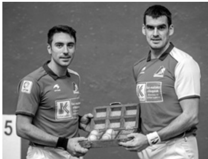
Ezkurdiak eta Etxeberriak ez zuten materialaren inguruko kezarik izan. JESUS CASO

Azaroaren leian, Domu Santu egunean hasi zen Nafarroako Jubenilen Lau eta Erdiko Txapelketa, Guillermo Mazo Memoriala, Etxarrengo Aranburu pilotalekuan. Ohi bezala, Etxarrenek txapelketako egoitza nagusia izaten jarraituko du, Lekunberriko Jaian Jai pilotalekuarekin batera. Aurten 11 pilota klubetako 32 pilotarik hartuko dute parte txapelketan. Aste honetan bi jardunaldi jokatu ziren eta horietako batean Markinak (Irurtzun) 4 eta 18 galdu zuen Navaroren (Larraun) kontra. Astero Nafarroako jubenilen Lau eta Erdiko bi jardunaldi jokatu dira eta final handia abenduaren 3an izango da, Labriten.