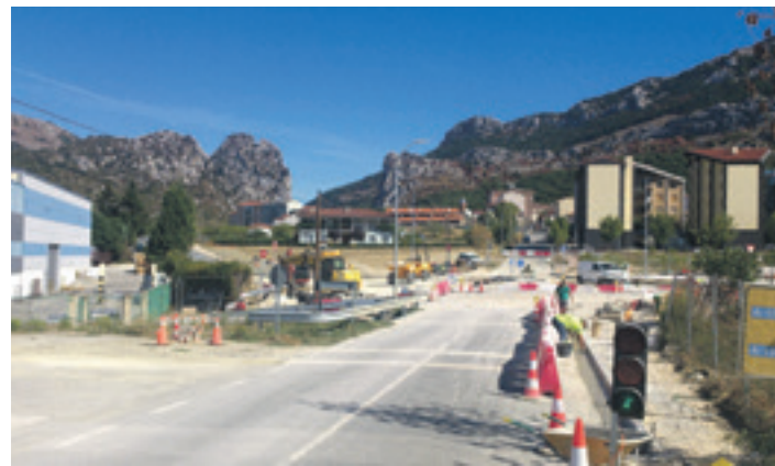
Irurtzongo saihebidetako lanak oso aurreratuta daude.

Bestetik, Garbitoki udal erakinean ur ihes batek hainbat kalte sortu zituen duela hilabete batzuk. Alkateak azaldu duenez, "gimnasioko tatamiak berritu eta galdara konponduko ditu udalak". Horrek 10.000 euroko aurrekontua du. 7.472,4 euro aseguruak ordainduko du eta, gainontzekoa, 2.527,6 euroak udalaren diruzaintzako gerakinarekin.