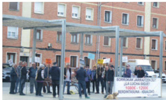
Astelehenean, 12:00etan, Altsasuko Zumalakarregi plazan bilkura eginen dute.