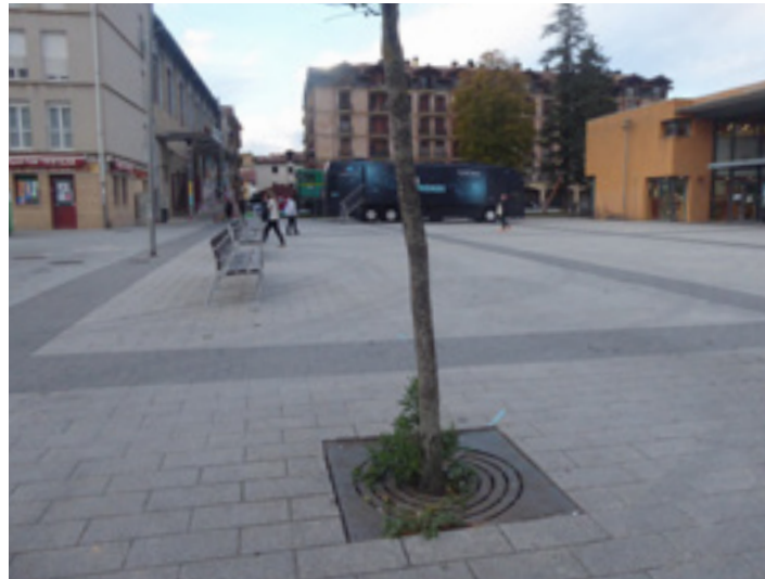
Iortia kultur guneko zabalgunean eraikiko dute estalpea.

Horregatik, udalak, lanak emateko deialdi berria egin du. Eraikitze lanak kalitate prezio eskaintza onena egiten duen enpresari emanen dizkio. Aurreneko deialdian bezala, oraingoan ere 473.769,24 eurotan (BEZ kanpo) eman nahi ditu lanak udalak. Aurrekontu horretatik Nafarroako Gobernuak 300.000 euro ordainduko ditu eta udalak gainontzekoa. Foru administrazioaren dirulaguntza jasotzeko hitzarmenaren baldintzetako bat zen lanak abenduaren 12rako despedituta egon behar zirela. Udalaren eta gobernuaren arte-