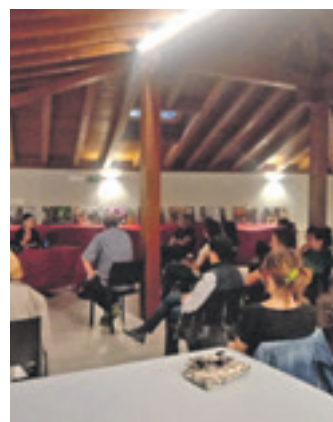
Hizlaria entzuten. UTZITAKOIA

11:00etatik 13:00etara eman dezakete arropa Arakilgo udal-txearen azpiko arkupean. Aurreneko bilketa eguna astelehenean egin zen. Jende askok jai egunekin zubia hartu zuenez, inork ez zuen arroparik eraman. Hala ere, jendea galdetza hurbildu zen. Eta bakarren batek ordutegitik kanpo arropa ematekotan gelditu zen. Bakarren batek ekimenean lagundu eta ekarpen bat egin nahi badu 648 070 710 edo 620 254 230 telefono zenbakietara hots egin dezake.