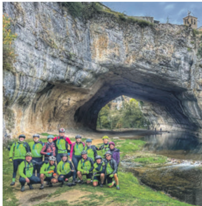
BARRANKA TXIRRINDULARITZA TALDEA

BTT "Zoragarria" izan da Sakanako Mankomunitateko Kirol Zerbitzuak Barranka Txirrindularitza Taldearekin urtero antolatzen duen BTT irteera. Igandean Burgosera joan ziren irteeran parte hartu zuten txirrindulariek, eta Medina de Pomarretik Puentedeyra joan eta etorria "ikusgarria" izan zela nabarmendu dute guztiek.