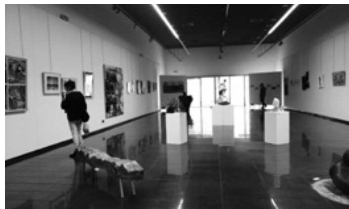
XI. Arteazoka Iortia kultur guneko erakusketa gelan.