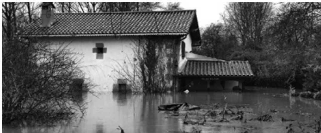
Uholdeak Bakaikun.