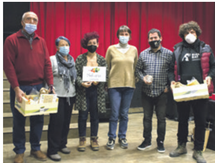
Arakilgo hazien sareak eta Biak Bat elkarteak saritu zituzten joan den urtean.

Sari nagusia banatzerakoan, SSBk hiru balio izanen ditu kontuan egitasmo kolektiboak aitortzeko. Batetik, dinamismoa eta erresilientzia gaitasuna oraingo eta etorkizuneko erronkei aurre egiteko. Bestetik, aniztasuna aberastasun kolektibo gisa ikusia. Eta, azkenik, elkartasuna eta onura komuna bilatzea komunitatearen beharrak lehentsiz. Horretarako funtsezko elementuak dira komunitatearen