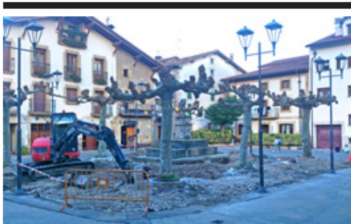
Plaza itxuraldatzeko lanak egiten ari dira.