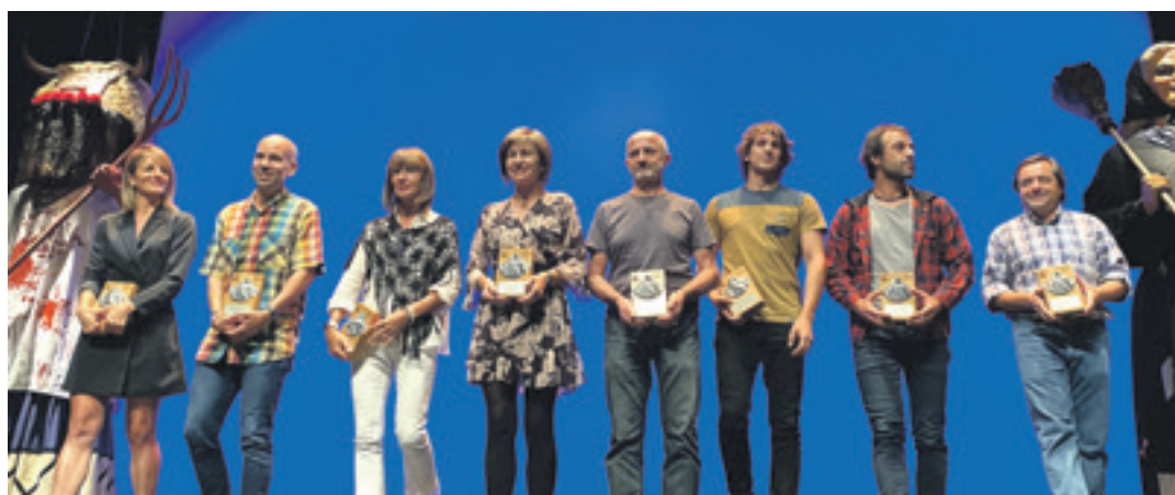
'Pyrenaica' aldizkariko sarietako saridunak, Altsasuko erraldoien ondoan.

behar da, ezin da nolanhiko zapatillekin joan. Eta abiatu aurretik eguraldi aurreikuspenak begiratu behar dira.