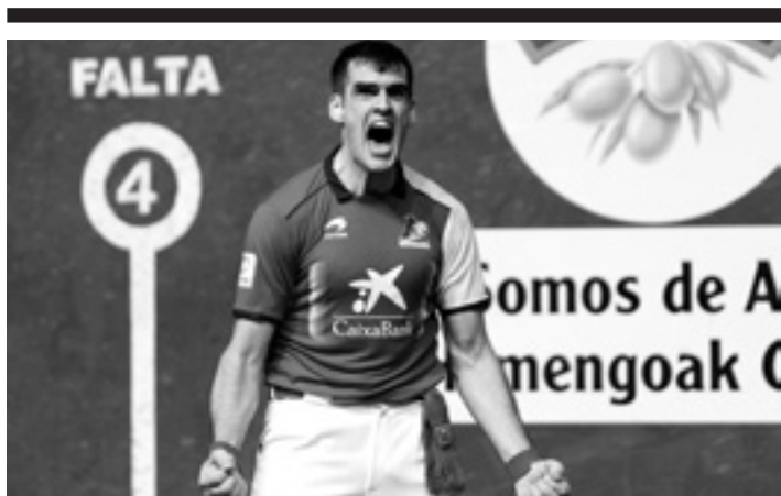
Lehen jardunaldian galdu ondoren, presio gehiago du Ezkurdiak. ASPE