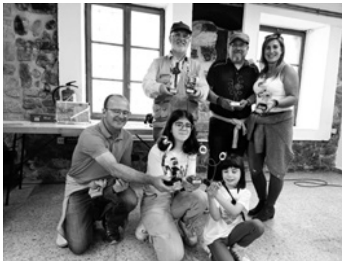
Altsasuko ferietako 36. Argazki Rallyaren irabazleak.