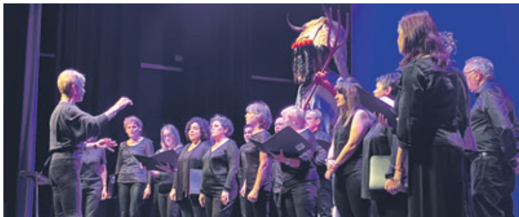
Erkudengo Ama abesbatzak hiru kantu eskaini zituen, bi mendiarekin lotutakoak, eta 'Agur Jaunak', ekitaldia itxi zuena.

Altsasuko Mendigoizaleak taldeetik eskerrik berezienak eman nahi dizkiete galan parte hartu duten kultur eragile guztiei, aurkezleei, Iortiako teknikari eta langileei, eta bestelako antolakuntza lanak egin dituztenei. "Guzti, guztiei, milesker horren gala polita prestatzen parte hartzeagatik" nabarmendu dute.