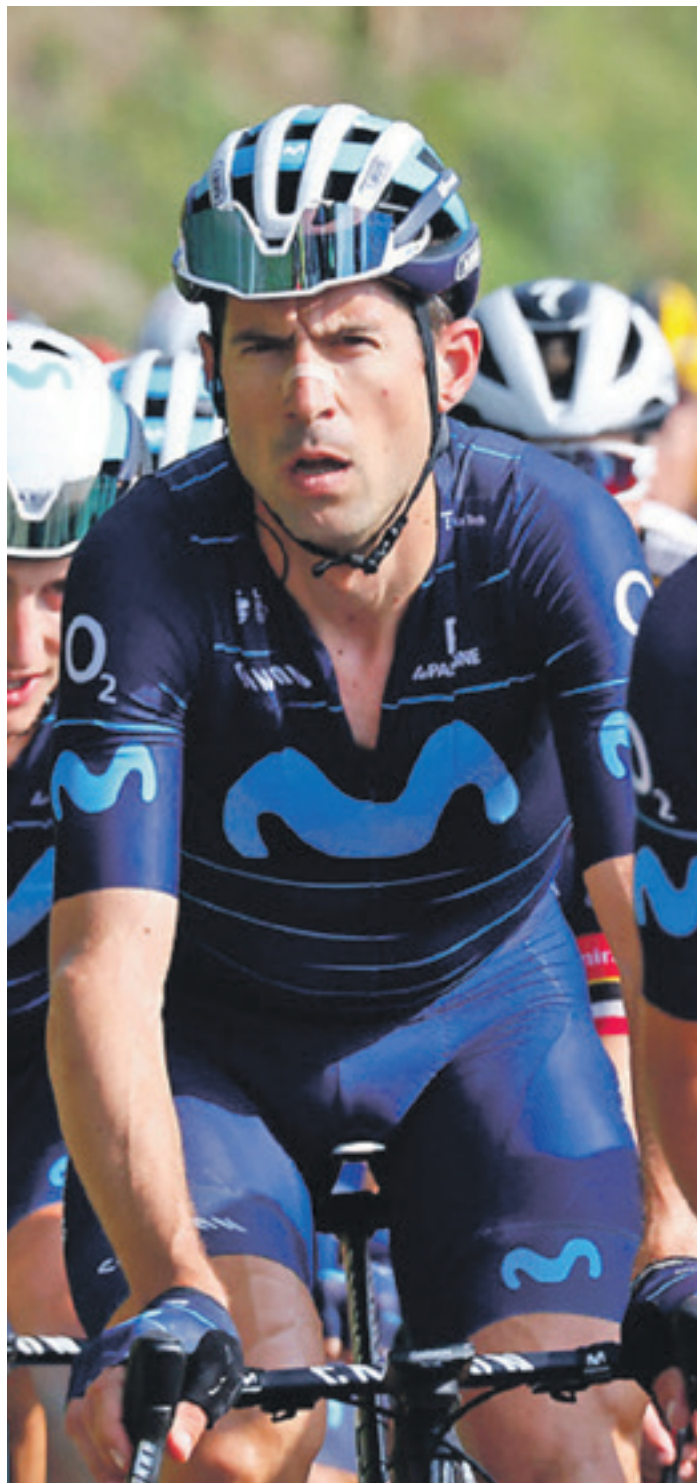
Erbiti denboraldiko azken proban, Lombardian, Valverderen agurrean. MOVISTAR TEAM

Bai, baina maitasun-gorroto harremana dut eurekin. Gustuko ditut, taldeak askatasuna ematen dit klasikoetan ongi aritzeko, baina atsekabe gehien sortu izan dizkidatenak dira, hain zuzen ere alergiaren garaian izaten direlako. Askotan saiatu naiz ongi