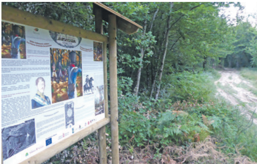
Aizkibel eta Erregengurutza artean, Sebastian Fernandez de Lecetari buruzko informazio panela dago.