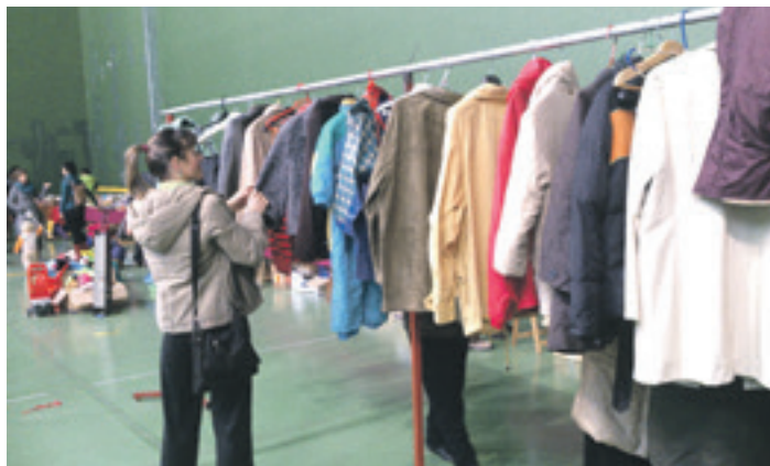
Itxipuruk frontoian antolatutako azokan arropa begira.

Elkarri Laguntza elkarteak "pobrezia eta bazterkerien aurrean gizartea sentsibilizatu nahi du, ezertxo ere ez dutenen beldurra, estutasun eta jakineza ikustarazteko". Gaineratu duenez, "familia eta pertsonen gizarteratzea eta ahalduz lantzen