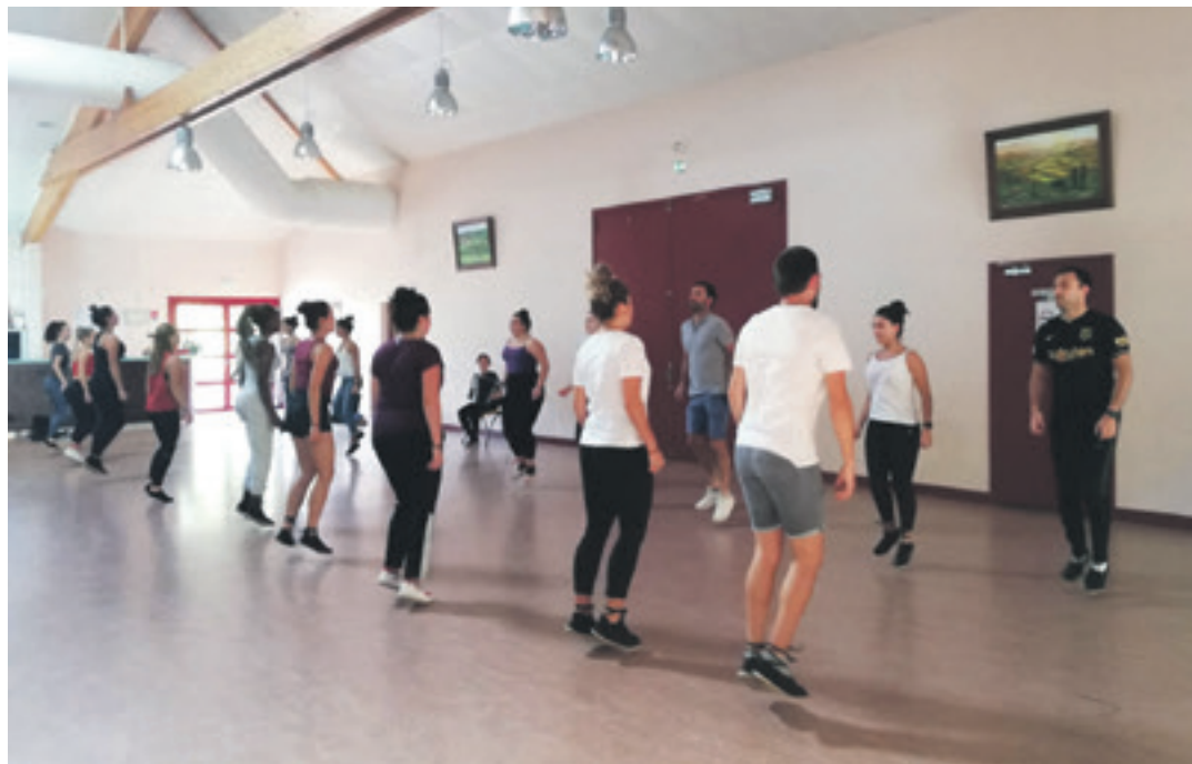
Orritz dantza taldeko kideak Baigorri, Arrola dantza taldearen ikastaroan.