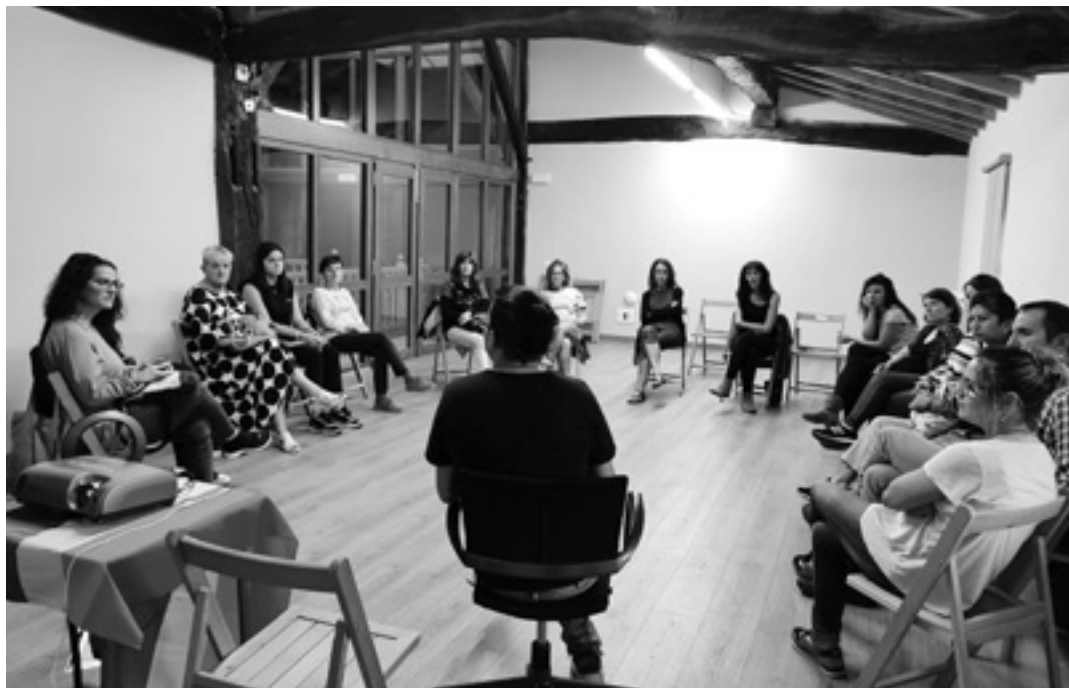
Urri Trans programa ostiralean Uhartea Arakilen hasi zen, 'De vuelta en casa' dokumentalarekin. @BERDINTASUNAS