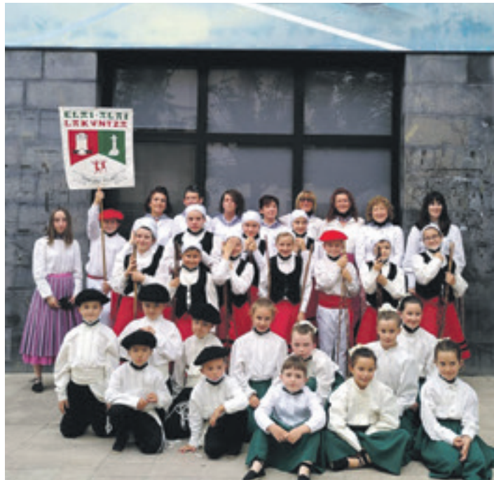
Elai Alai dantza taldea. UTZITAKOIA

Euskaraldia zer den jakin ondoren, entitate batek arigune egitea erabakitzen badu, lehenik bere kideen euskara ulermeneren azterketa egin behar du. Horrela, arigune izan daitezkeen talde edo espazioak identifikatzen dira. Hori eginda, arigune izan daitezkeen talde edo kideekin ariketa adostu behar da. Azkenik, arigune gisa izena eman behar da, edo aurretik izanez gero, eskaera berretsi. Hori eginda, entitateak Euskaraldian parte hartuko duela jakinaraziko die kide guztiei. Aldi berean, egokia izan daiteke ariketa prestatzeko baliabideak ematea parte hartzaileei. Entitate barruan euskarazko praktikak bultzatzeko lehentasunezko neurri edo pauso berriak ematea erabaki daiteke, eta hala eginez gero, Euskaraldiak horiek gizarteratzera animatzen du. Ari-