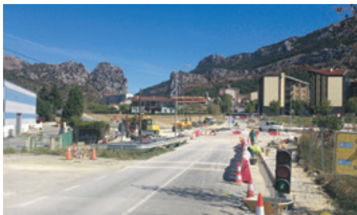
Lizarra kalean errotonda egiten, saihesbidea ezkerretik doa.