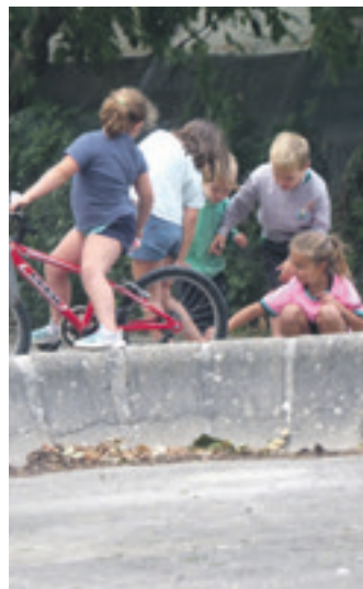
Informazioa: www.eranafarroa.eus .

Azaldu dutenez, "euskara ikasteko ikastetxeak funtsezkoa izaten jarraituko du, baina umeak han urteko esna orduen %15