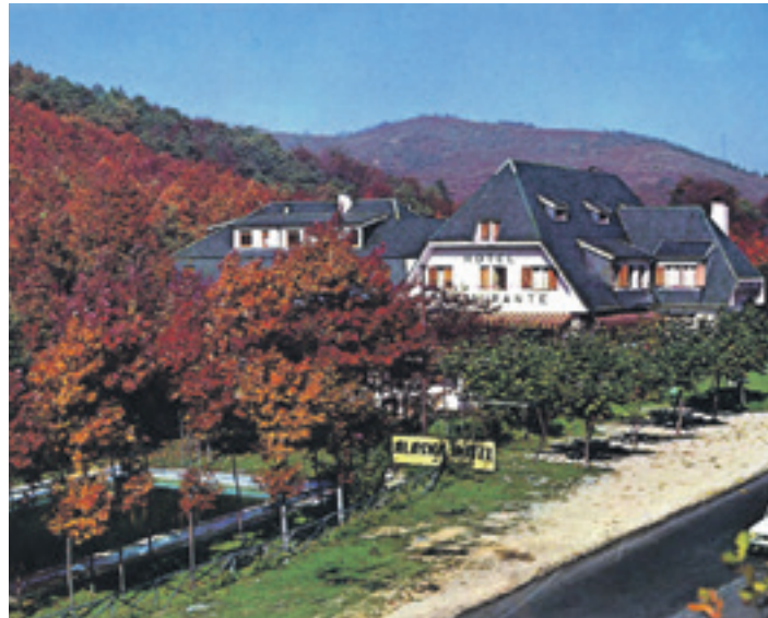
Alaska Hotela argazki zahar batean.