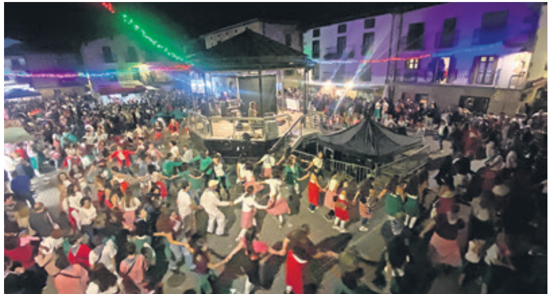
ALTSASU Urtero bezala, altsasuarrek gauero Larrain dantza eta Altsasuko zortzikoa dantzatu dute Foru plazan.

19:00 Txupinazoa, kultur etxean. Erraldoiak eta buruhandiak. 19:30-21:00 Musika Ken Bat taldearekin, San Migel plazan. 20:00 Bonba japoniarrak, Intsumisioaren plazan. Banaketa, San Migel plazan. 21:00 Zezensuzkoa, San Migel plazan. 21:30 Afaria, gaztetxean. Maisuenea gaztetxeak antolatuta. 22:30 Karaokea, gaztetxean. Maisuenea gaztetxeak antolatuta.