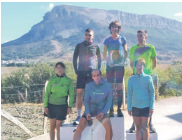
Ergoienako Birako podiuma.