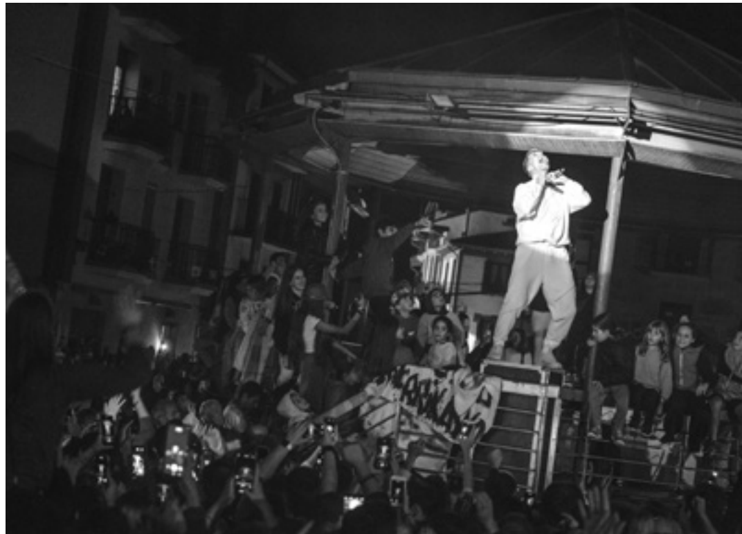
Zetak-ek Altsasun eskaini zuen kontzertua. IBAI ARRIETA

Guretzako sormen intentzioa oso garrantzitsua da. Sormen inten-