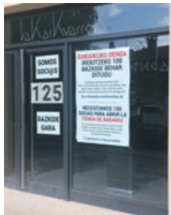
Dagoeneko 133 bazkide dira.

Bakaikuarrok herri kooperatibak Herriko Denda lastailaren 5ean, asteazkenarekin, zabalduko du. Herriko merkataritza gunere berraren mustutzea, berriz, bi egun pasata, ostiralean, egingen dute. Kooperatibako bazkide bakoitzak 60 euro jarriko ditu. Gainera, larunbatetik aurrera guztiek bazkide-tza dokumentua bete eta sinatu beharko dute ere.