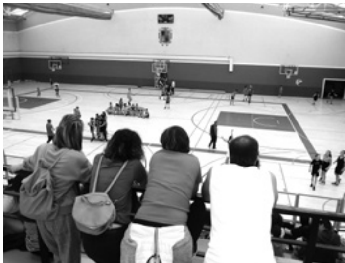
Larunbatean itxura ederra izango du Zelandik.

Larunbatean guztira lau partida jokatuko dituzte elkarren kontra, lau kategoriatan: kadeteak (CBASK Kadeteak vs Agurain kadeteak, 10:00etan); nesken Senior Maila (CBASK Xabi Gorriz Tattoos senior neskak vs Agurain senior neskak, 12:00etan); Maila Autonomikoa (CBASK Ifuel senior mutilak vs Agurain senior mutilak, 16:00etan) eta, azkenik, Autonomien Artekak (CBASK Narum senior mutilak vs Agurain senior mutilak,