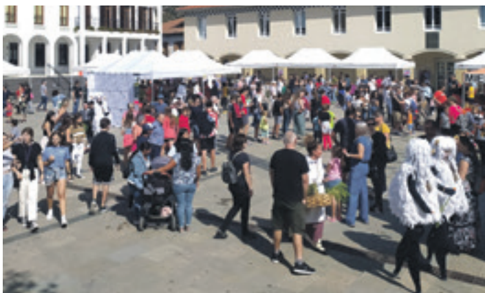
Jendea eta Iskidiren ardiak ekoizleen postu artean.