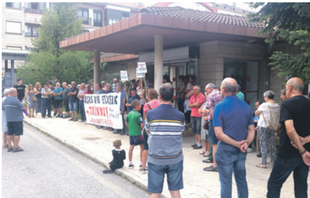
Osasun publikoaren aldeko kontzentrazioa osasun etxe parean.