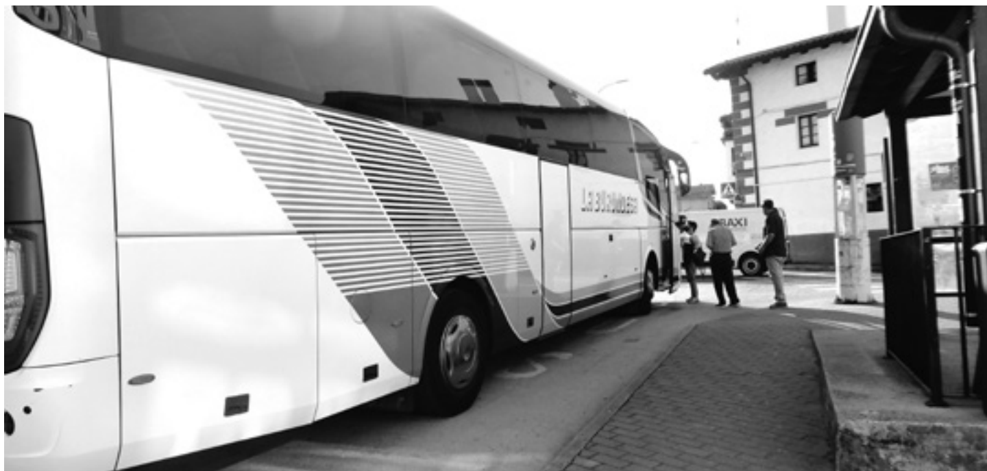
Irurtzango autobus geltokian jendea autobusera igozten. ARTXIBOA