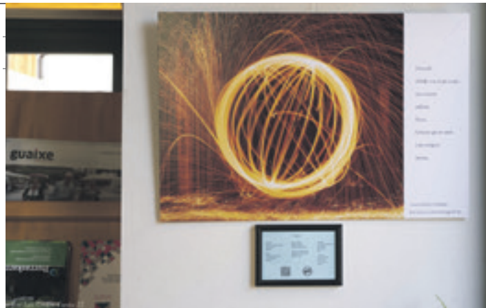
IRURTZUN Nueve fotopoema erakusketa. Urriaren 9ra arte. Pikuxar tabernan.