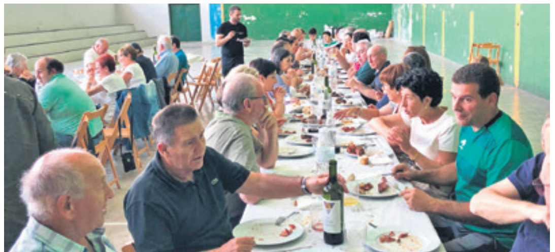
ERGOIENA Ibarreko nortasuna indartzeko asmoz, IV. Ergoienako Eguna ospatu zen Lizarragan larunbatean. Goizean Ergoienako Bira jokatu zen. Egurdiko bazkarian 60 bat ergoendar elkartu ziren.