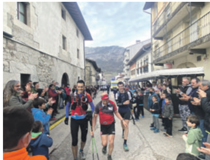
Martxoan Noelia Fundazioaren alde Uharte Arakilen antolatutako kirol erronka.