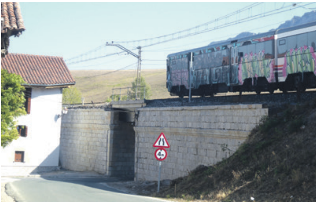
Tren erregionala garbitu berri den zubi gainetik pasatzear.