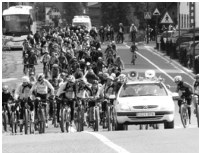
Sakanako Bizikleta Egunak antolaketa lan handia du atzetik.