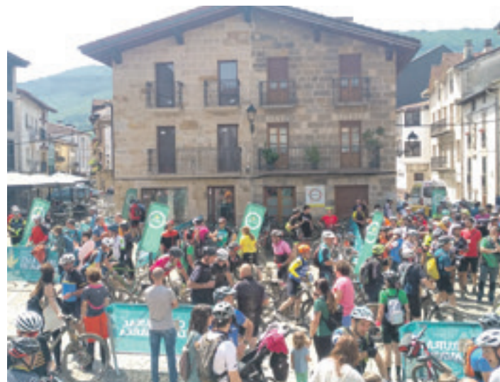
Altsasuko plazak itxura ederra izan zuen igandean.

Barrankak 700 pertsonarendako muga jarri zuen eta tokia bete zen, proba ez lehiakorrik duen arrakastaren isla. Gehienek ibilbide luzea egin zuten (46 km, 939 metroko desnibel +). Santa Luziasakanetik Sorozarretara jotzen zuen, Ibarrea eta Ameztatik Olazti eta Ziordiarena den Batureko iturrira heltzeko. Aizki-