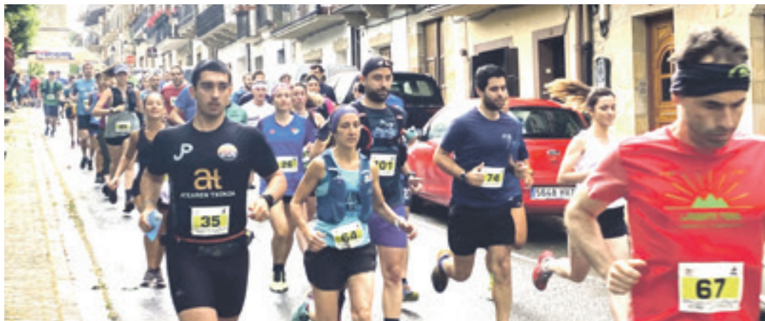
Korrikalariak zitzu bizian atera ziren Aralarrerantz.