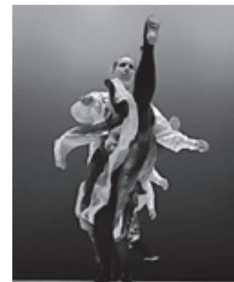
Altsasuko dantza ikaslea. BIHOTZ

Altsasuko Musika eta Dantza Eskolak ere ikasturteko amaie-