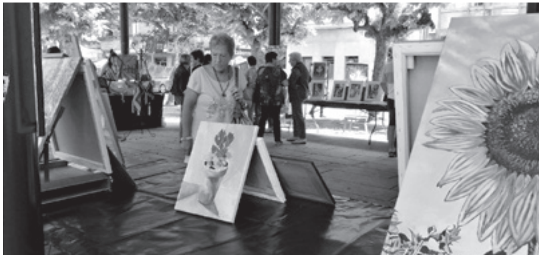
Etxarri Aranazko artisten erakusketa, herriko plazan.