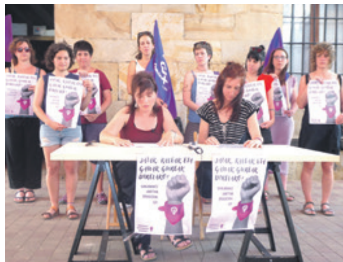
Festa "jendartea antolatuta dagoen moduaren eta ditugun balioen isla da".

Mugimendu feministako kideek festei begira gizonezkoei bi es-