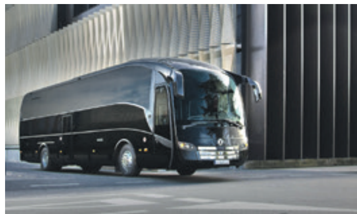
Sunsundeguien Sc7 autobus modeloa.