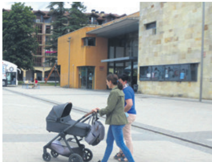
Iortia kultur guneko barne argiztapen berria du. ARTXIBOA.

Bestalde, Eskualde Garapeneko Europako Funtsak (EGEF)