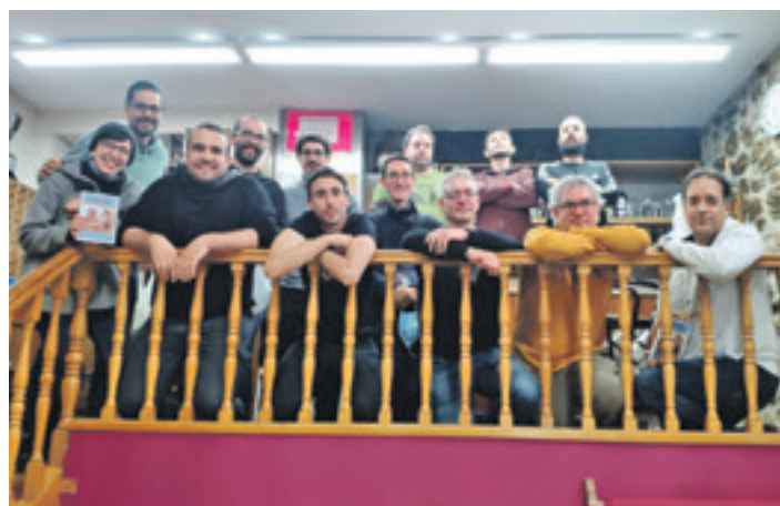
DBA txapelketako parte hartzaileak. LAGUN ONAK