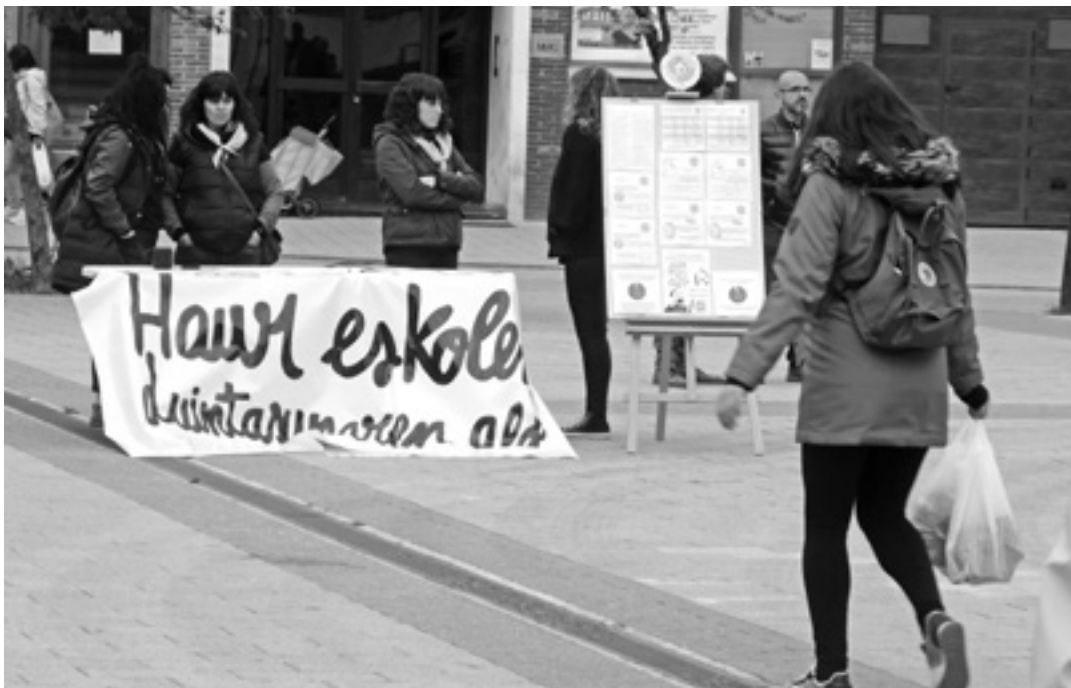
Haur eskolen duintasunaren aldeko sinadurak biltzeko mahaia Altsasuko azokan.