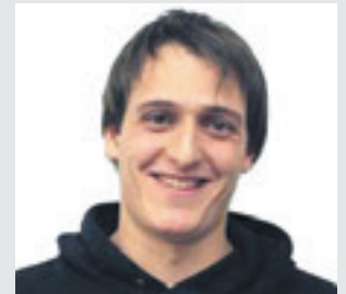
SAATS KARASATORRE MARTINEZ 1992; ETXARRI ARANATZ

daudelako, baina iristen da momentu bat, urteak pasa ahal, plazak gutxitzen direla". Genero ikuspegitik ere oreka bilatzen dute.