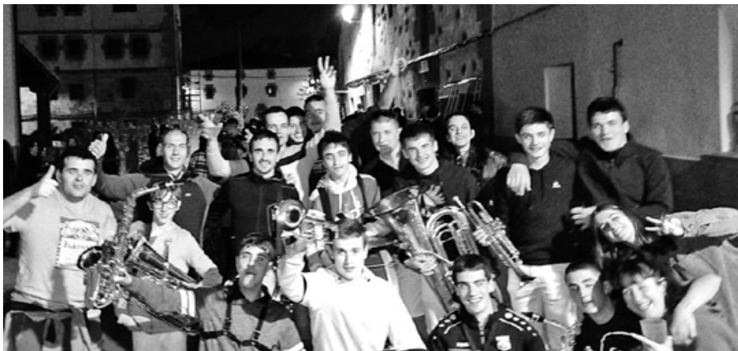
Eztanda Txaranga kideak Iturmendin egindako kalejiran.