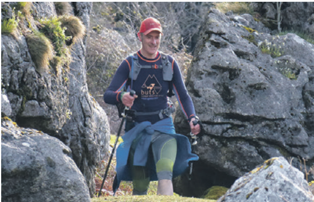
Mendizalea Urbanan, 2019ko Hiru Mendi Zerrak martxan.

puntuagarria da. Bi ibilbide dau- de: Hiru Mendizerrak Ibilaldi Luzea (46 km eta 2.700 m desnibel positiboa) edo Hiru Mendizerrak Ibilaldi Laburra (26 km, 1.200 metroko desnibel positiboa). Bi ibilbideetako mendizaleak bate-