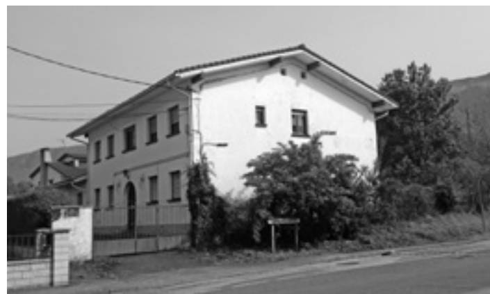
Udalak zaharberritu nahi duen eraikina.