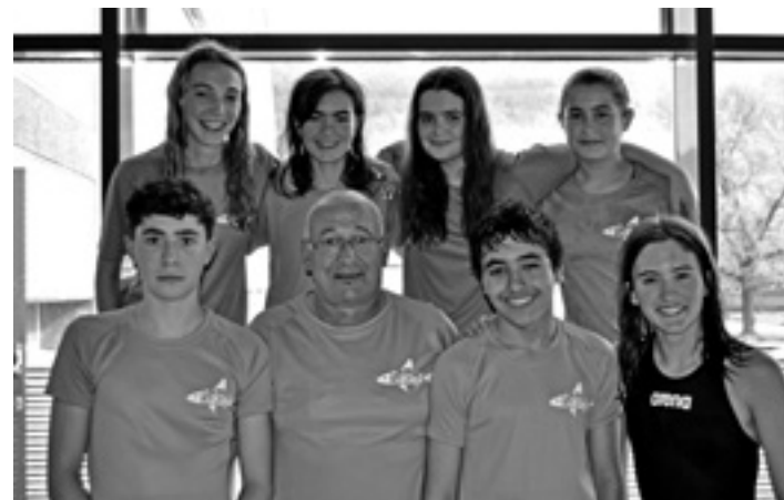
SAKANA IGERIKETA TALDEA

TRIAITLOIA Tarragonako Deltebre Triatloi ezagunean lan ona egin zuten hiru sakandarrek