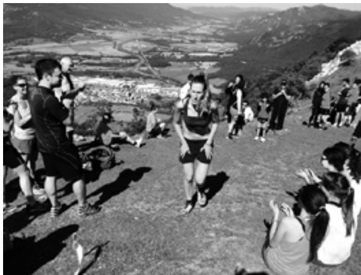
Korrikalaria Ergako kronoigoerako helmugara iristear. Behean Irurtzun.

Herritarrek aukeratutako proiektu horren bidez SL-NA 138 ibilbidea, Saien balkoia delakoa, berriro homologatzea eta Irurtzun eta Latasa herriak lotuko dituen beste ibilbide bat sortzea aurreikusitak da: Ergako bira. Bide berri hori, Plazaola aparkalekutik abiatuz, SL-NA 138 tokiko ibilbidea hartuta Trinitate-rantz joko du, ondoren ermita-rantz desbideratuz. Erga mendi gaineko ermitatik Latasaraino jaitsiko da, handik, Arrantzaleen