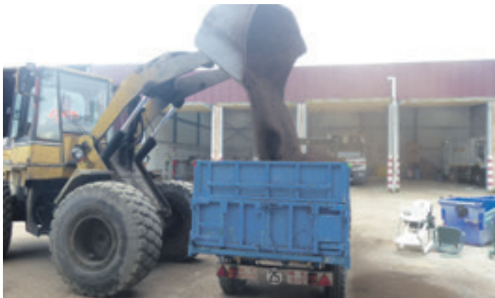
Gurdia konpostez betetzen. Zakuak eskuko palarekin bete behar dira.