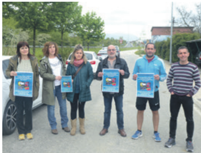
Jaibusaren sustatzaileak arduradun gisa lan egiteko jende bila dabilta.