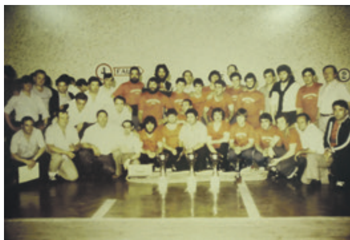
Elkarteko sokatira taldeko kideak gorritz eta bazkideak. LAGUN ONAK