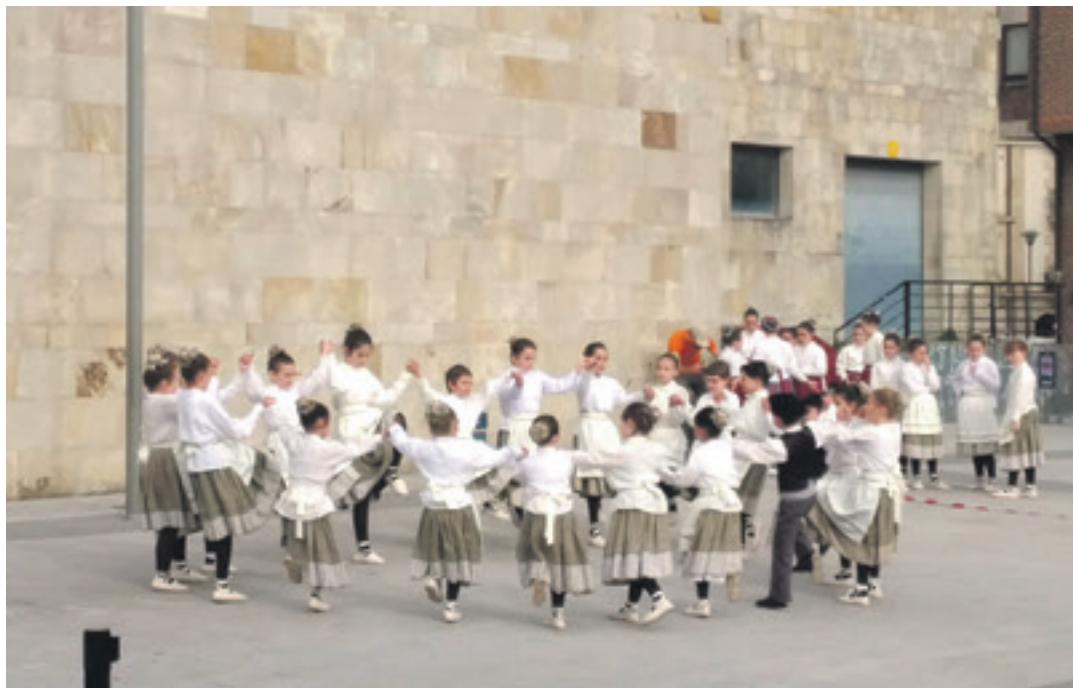
Dantzaren Nazioarteko Egunean Etorkezuna Dantza Taldeak emanaldia egin zuen.