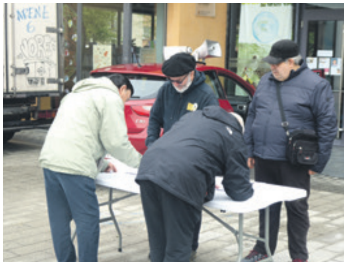
Azokara joandako gizonetakoak sinatzen.

Bestetik, sinatzaileek diputatuari eskatuko diete berma dezatela pobrezian atalasetik beherrako pentsiorik ez daitezela izan. Horretarako, "soldata eta pentsioetan genero arrakala kendu eta gutxieneko pentsioa lanbide