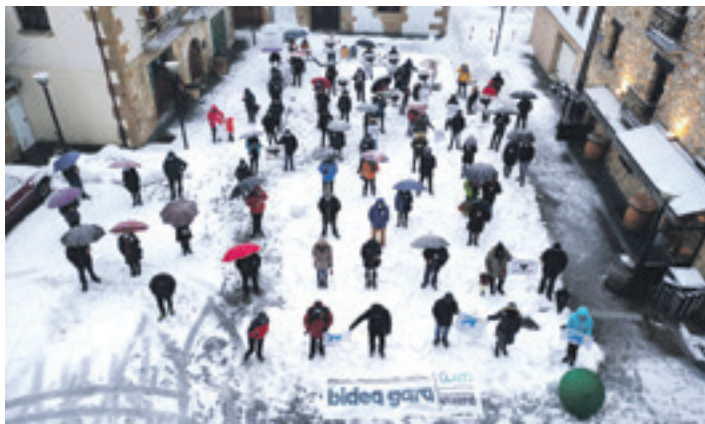
Olaztiarrek Izan Bidea dinamikarekin bat egin zuten.