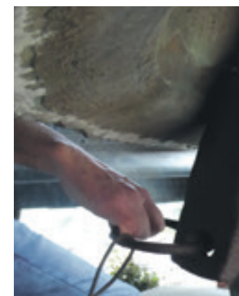
Ezkilaren mihiari eragiten.

Altsasun 134 egunez entzunen dira ezkila errepikak, asteartetik irailaren 14ra arte. Gainera, urteko aurrenekoa, atzenekoa bezala, ohi baino luzeagoa izaten da, 15 edo 20 minutu. Gainontzeko egunetan errepika motzagoa izanen da. Ezkila errepika jotzeko ohitura galdu egin zen eta 1970ko hamarkadaren hasieran berreskuratu zuten.