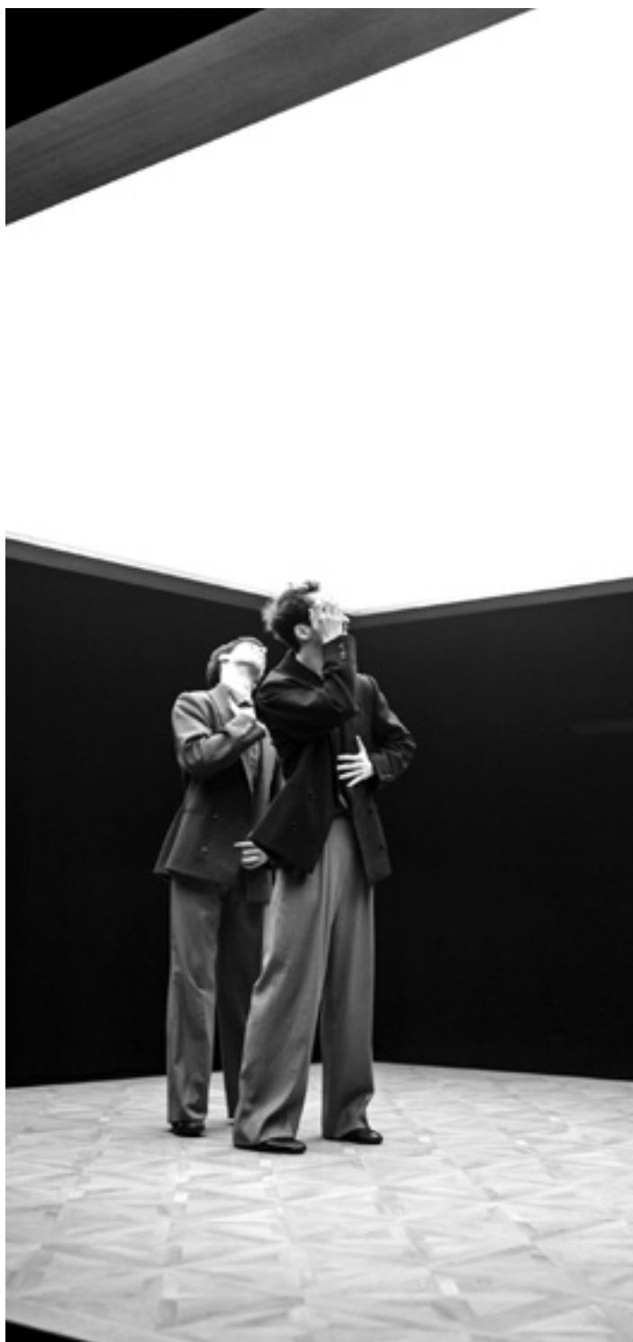
'Los Perros' ikuskizunaren une bat. IRANTZU PASTOR

Sakanan igarotako denbora horretan, eta Betisa Anda Altsasuko kultur teknikariari esker, Altsasuko kanpai dorrean eta errepiketan egoteko aukera izan zuten. Tomas Ganboari kanpaijoleari Arruazun egin zioten omenaldian egon ziren ere. "Kanpaiekin bueltaka egon ginen, batez ere Sakanan egon ginen hilabete horretan. Zoritzarrez, edo horrela sortu delako, materialaren garestitzeagatik kanpaien fabrikazioaren ideia burutik kendu behar izan genuen". Nahiz eta kanpaiak bisualki ez egon,