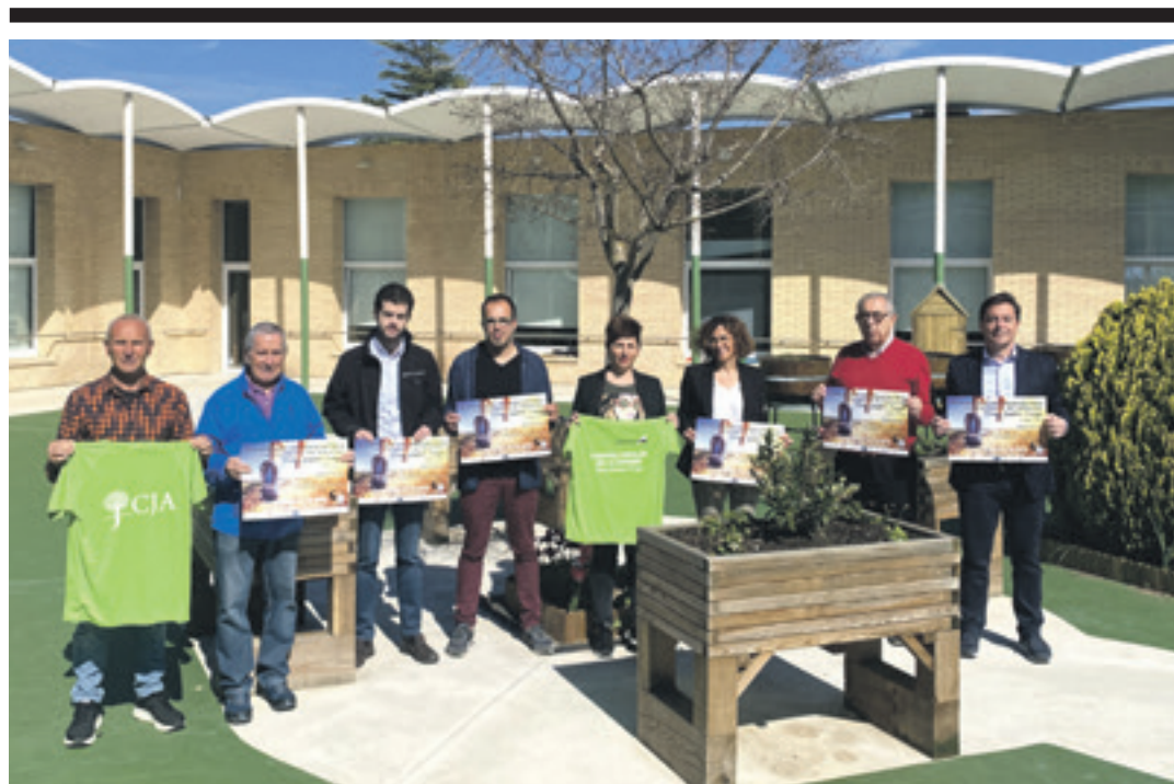
Josefina Arregi Klinika I. Alzheimer Herri Lasterketako antolatzaileak, babesleak eta laguntzaileak.

Ekainaren 4an XI. Ziordiko Lasterketa Solidarioa jokatuko da. Haurren probak 17:00etan hasiko dira, martxa solidarioa 17:30ean eta helduen lasterketa 18:00etan. Izena ematea zabalik dago Ziordiko Running Taldeak WIX plataforman duen webgunean. Bestalde, Aitzkozar Herri Krosa ekainaren 11n jokatuko da, aurten Bakaikun.