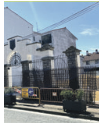
Lanengatik espaloia itxita dago.

Bestalde, Tokiko Azpiegitura Planari buruz galdetu zien udalak arbizuarrei. 14 erantzun jaso ditu eta lehentasunezko jo dute Fernando Urkia kalearen zati bat berritzea. Beste bi lanetarako ere laguntza eskatuko du udalak: kiroldegiko klimatizazio sistema aldatu eta berritu eta udaletxeo bulego eta artxibategiko solairua birmoldatu. Kontsultaren bidez ekarpenak ere jaso ditu udalak eta esker ona azaldu du.