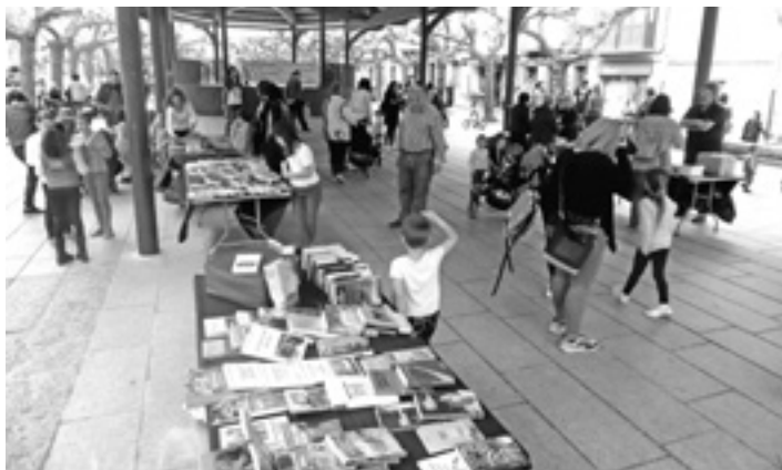
Besteak beste, liburu trukea egin zen Etxarri Aranazko Liburuaren Egunean.