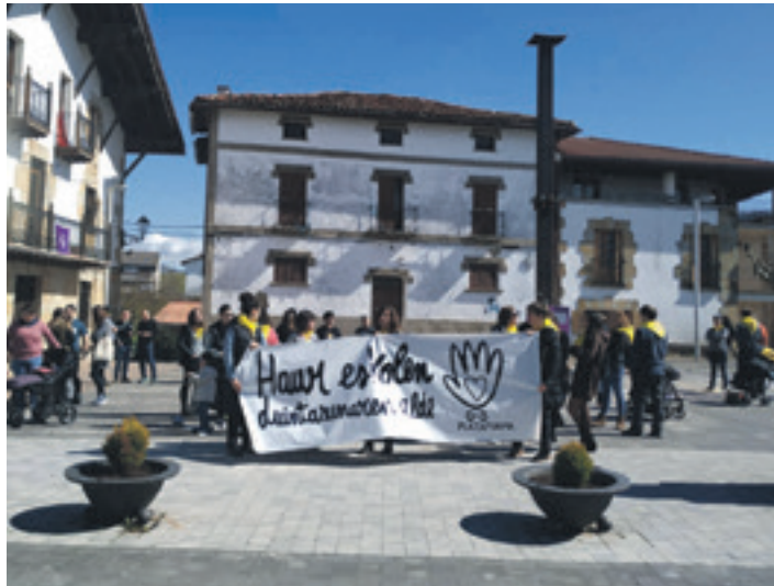
Haur eskolen duintasunaren alde Arbizun egindako kontzentrazioa.