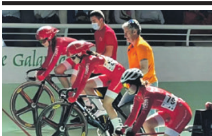
Kadete mailakoak, proba hasteko prest. NAFARROAKO PISTA SELEKZIOA