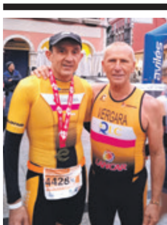
Maiza, dominarekin, eta Vergara.