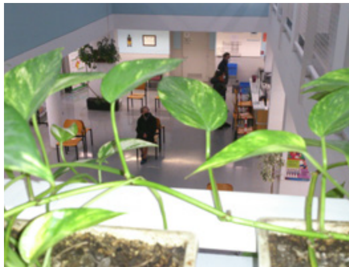
Etxarri Aranazko osasun etxea.