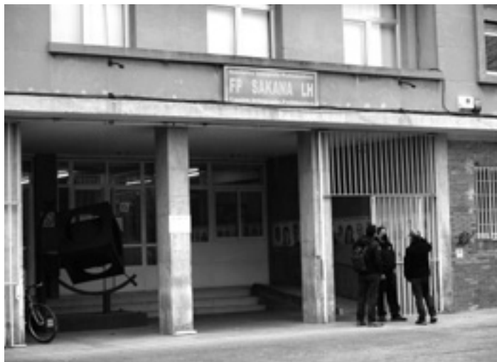
Sakana Lanbide Heziketa institutuaren sarrera.

LH Bereziaren bidez hezkuntza premia bereziak (aldi baterakoa edo iraunkorra) dituzten gazteen prestakuntza eta kualifikazio beharrei erantzuten zaie. Behar bereziak dituzten ikasleek ikasketak gaingitzean ziurtagiri bana jasoko dute. Han gaingitutako lanbide profesionalen moduluak azalduko dira. Ziurtagiriak LH eta Kualifikazioen Katalogo Nazionalaren lan kompetentzien akreditazio balioa du. Behar bereziak dituzten pertsonak lan merkatuan txertatzeko balioko du ikasketa berriak. Institutuak dagoeneko Oinarrizko LHko Merkataritza zerbitzuak ikasketak eskaintzen zituen eta familia bereko ikasketa da aipatutako azken eskaintza berria. Eskain-