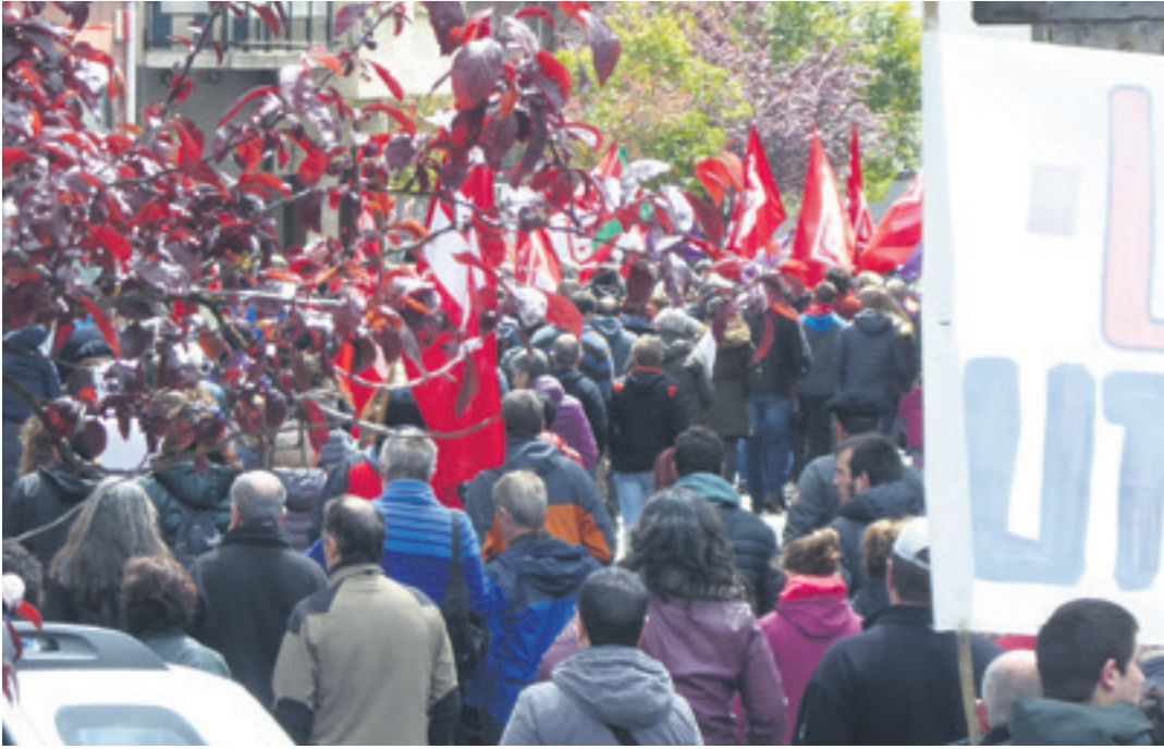
Maiatzaren leheneko bilkurek jendetza bilduko dutela aurreikusten da.