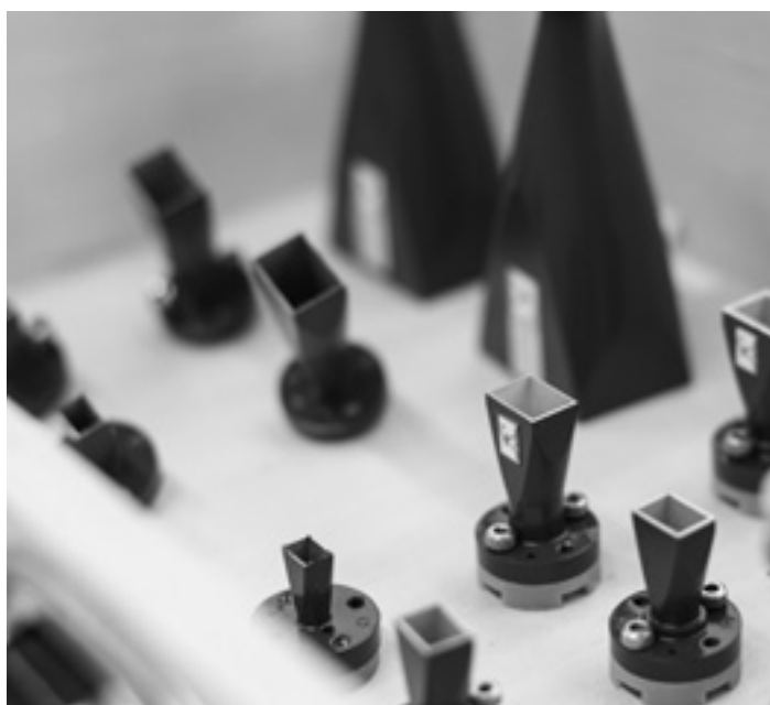
Huawei taldearen 6G teknologiarako antenak, Anteralek egindakoak.

antena horiek eskatzen duten exijentziari erantzuteko" nolabait "kalitatea bermatu ahal izateko". Une honetan, Anteral enpresak Italiako eta Frantziako enpresa batzuekin du harremana fabrikaziorako.