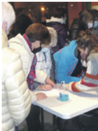
Otsailean hasi ziren sinadurak biltzen.

Aurretik zetorren pertzepzioa, baina pandemiarekin handitu egin da osasun publikoak okerrera egin duela. Hori zuzentzeko sortu zen Nafarroako Osasun Plataforma. Haren hainbat mobilizazioetan parte hartu ondoren, ibarreko hainbat pertsonak Sakanako Osasun Publikoaren aldeko Plataforma sortzea erabaki zuten apirilaren 4an. Nafarroan eta Sakanan osasun publiko duina izatea, eta horretarako, beharrezko giza eta material baliabideak izatea aldarrikatzen