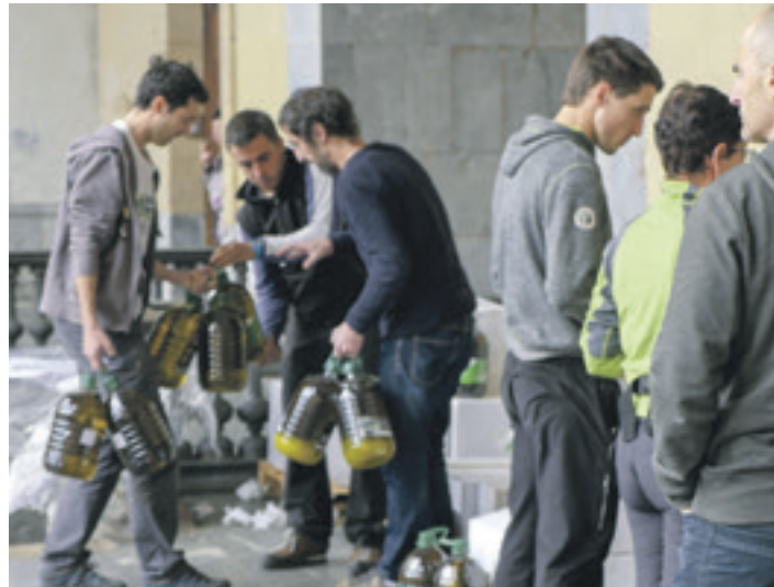
Egindako eskaera jasotzen. ERRIGORA

Errigora ekimeneko kideek jakinarazi dutenez, aurtengo egin diren kontserba, arroza, pasta eta lekale eskaera guztien %20 ekoizpen ekologikoa izan da. Aurreratutakoak, heldu den urtean ekoizpen ekologikoko eskaintza handiagoa izanen da eta aukeren artean potxa ekologikoak izanen dira. Irailerako