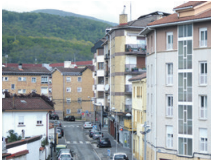
Erkuden kalearen ikuspegia.

Nola biziko liratekeen galdetuta, 29k esan zuten bakarrik bizitzeko litzatekeela, 28k familiarekin bizitzeko eta 22k beste pertsona batekin partekatuzko litzatekeela.