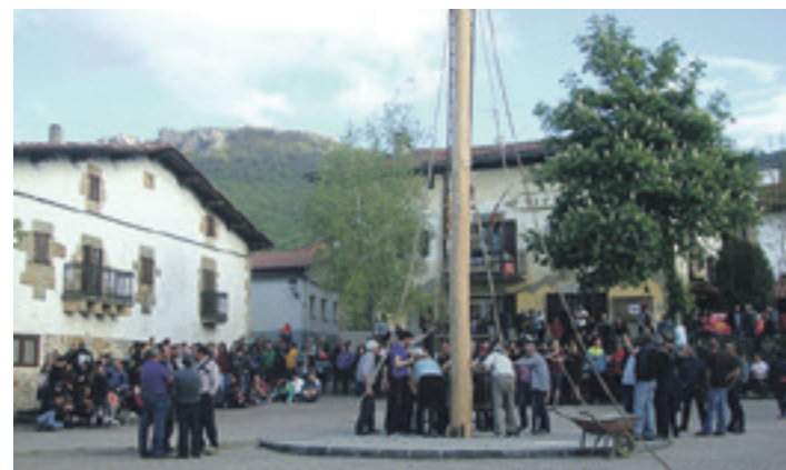
Iturmendiarrak maiatza zutitu ondoren hura finkatzeko lanean.

Sakanako plataformak deitutako hiru bilkura horietan ere sinadurak bilduko dituzte. Estatuko Osasun Publikoaren Pribatizazioaren kontrako Koordinakundeak Herri Ekimen Legegilea sustatu du. Haren bidez sinadurak bildu eta lege proposamena Kongresuan aurkeztu nahi dute. Sinatzaileek osasun unibertsal, %100 publiko eta kalitatezkoa berreskuratzea eskatzen dute. Astearteko bilkurez aparte, Herri Ekimen Legegilearen aldeko sinadurak igandean ere jasoko dituzte, 13:00ak aldera, Iortia kultur gune parean.