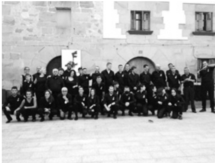
Haize Berriak banda.