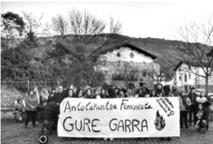
Urdirarrek kontzentrazioa eta herrian barnako buelta egin zuten. UTZITAKOIA

lista eraikitzea da, guztiok bizi baldintza berak izanen ditugun eta aberastasunaren fruituak denon eskura izanen diren errealitatea". Horretarako, "komunismoaren eraikuntza helburu duen antolakuntza politikoa gorpuztu" nahi dute, "zapalkuntza guztien kontra borrokatuz eta antolatuz". Gizarte kapitalistan "emakume langileok esplotatuak eta zapalduak" daudela nabarmendu zuten. Itaiako kideen iritziz, "instituzioak burgesiaren menpekoak dira eta argi dago oligarkiak ez duela berdintasuna sustatzeko inongo interesik". Antolamendutik gaineratu zuten, "ezkerreko alderdien proposamen feministek guztiok eskubide berak izatea eta aberastasunaren birbanaketa eskatzen dute, baina horren guztiaren atzean emakume langileak askatzeko ezintasuna dago". Itaiako kideek uste dutenez, "beraien diru mailerik gabe gutxi egin dezakete ezkerreko alderdiek ogi apurrak kudeatzeaz harago; gainera, burgesia bera zilegitzen dute. Politika horiek lortu dutena klase altuko emakumea askatzea izan da".