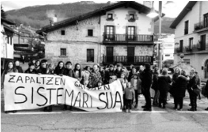
Bakaikuarrek emakumezkoen eskubideen alde elkartuta.