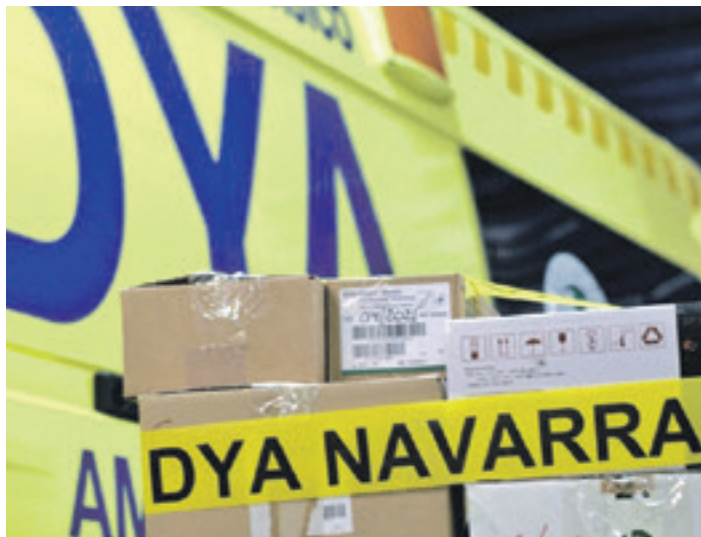
Nafarroako DYAk dagoeneko botikak bidali ditu Ukrainara. @DYANAVARRA

Bestalde, Nafarroako DYAk Ukrainara bidaltzeko material bilketaekin bat egin du, eta Altsasuko egoitzan jasoko dute hori. Hara laguntzarekin joan aurretik 669 774 993 telefonora hots egitea eskatu dute DYAkoe.