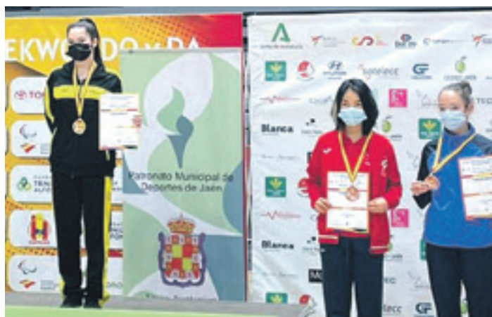
ESPAINIAKO IRRISTAKETA FEDERAZIOA