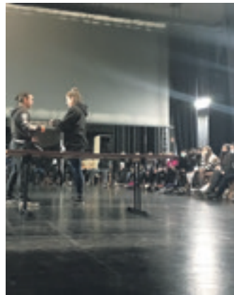
Herenegungo antzerkiforuma. INSTITUTUA

dea lan hitzarmenaz hizketatzeko elkartu ziren atzo goizean. Enpresa batzordean gehiengo duen ELA sindikatutik jakinarazi dutenez, oraindik ez diete halakorik proposatu. Dagoen eskaintzaren eta energia kostuaren arabera hartuko du erabakia enpresak. Beraz, oraindik ez da enplegu erregulaziorik izanen. ELAk gaineratu duenez, "zabalduetako informazioa ez da enpresatik atera". Olatzagutiko plantan ehun bat langilek lan egiten dute.