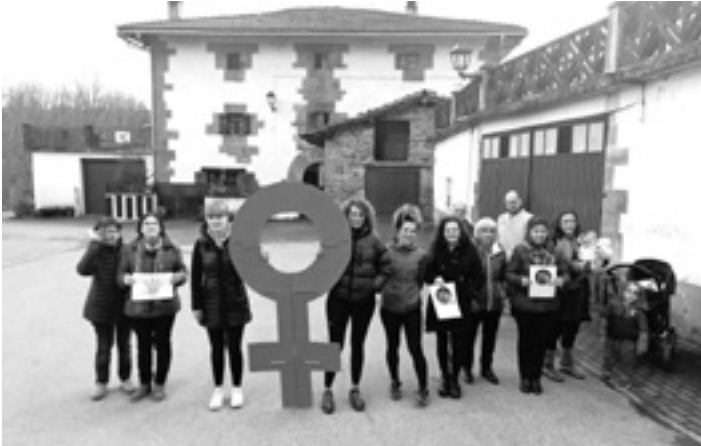
Lizarragabangoan bilkuraren ondoren elkartera joan ziren. UTZITAKOIA