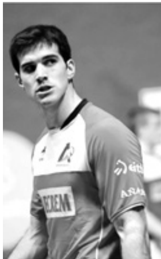
Zabaletak partida zaila du etzi. UTZITAKOIA

Material aukeraketan Imazek Aspekoengan jarri zuen presio guztia. "Beraiek dira egungo txapelkunak eta txapelketa hasi zenetik, faborito argiak". Elezkanok, aldiz, "presioa guztien dako berbera" dela adierazi zuen. "Ez dugu presio gehiagorik egungo txapelkunak garelako. Igan-dekoa partida oso garrantzitsua da, eta gurean zentratuko gara" gaineratu zuen. Zabaletak aitortu zuen bere buruari "asko" eskatzen diola, eta Binakakoan orain arte jokatuak hamabost partidetatik soilik lauzpabost partidetan gelditu dela egindakoarekin gustura. "Partida askotan ez dut gozatu. Boladak izaten dira, baina konfiantza itzuliko da, konfiantza hori lantzen delako" argi utzi zuen.