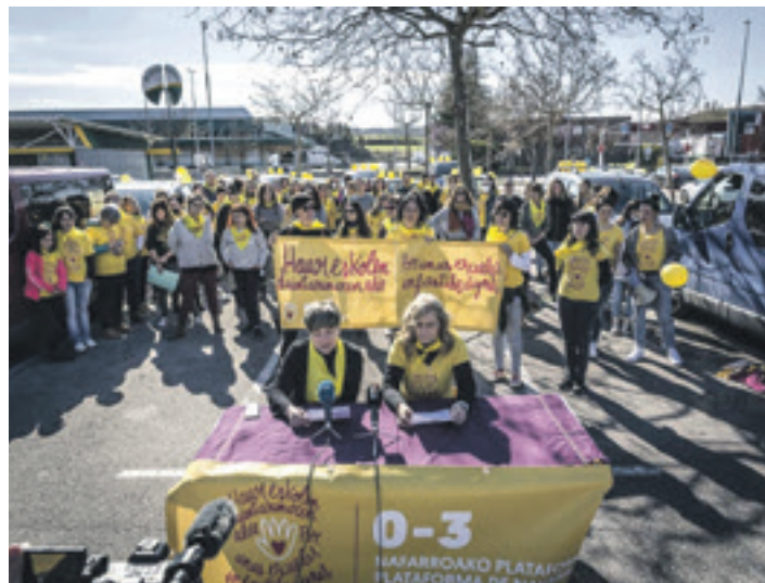
Haur eskoletako hezitzaileek Iruñean auto karabana egin zutenekoa.

Departamentuaren Haur Hezkuntzako curriculumari buruzko Dekretuaren zirriborroa plataformako kideei ez zaie batera gustatu, "gutxiespena eta mespretxua nabaria da". Azaldu dutenez, "dekretuak dio Haur Hezkuntzako lehen zikloa ziklo osoa edo, gutxienez, ziklo horretako urte oso bat hartzen duten ikastetxeetan eskaini ahal izan dela. Eta hemen dago