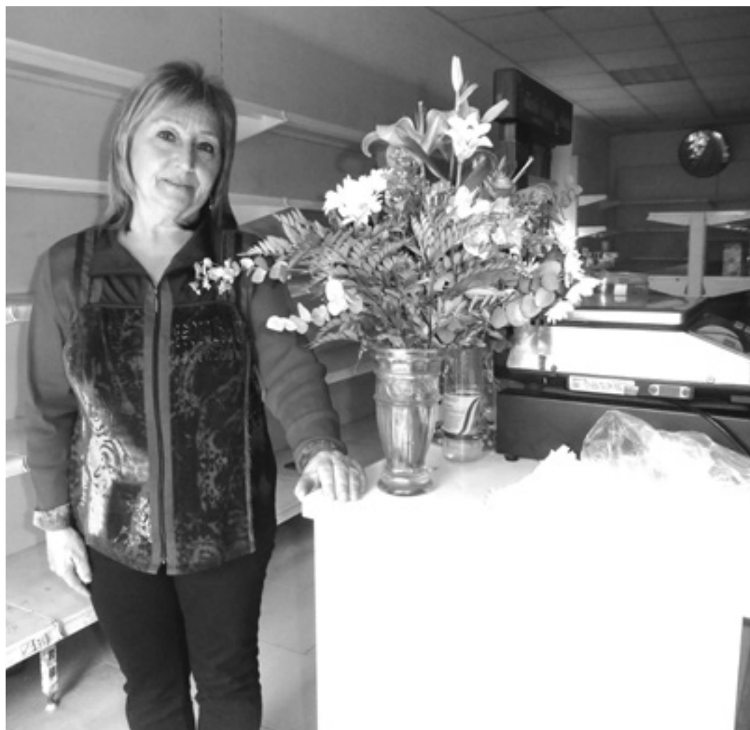
Kontxi bakaikuarrak bera omentzeko eman zioten lore sortaren ondoan.

"AZKEN EGUNETAN JENDEA PENAZ. ULERTZEN DUTE NIK NIRE BIZITZA BEHAR DUDALA"