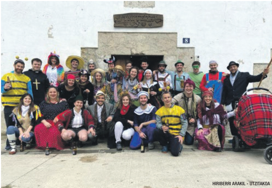
HIRIBERRI ARAKIL - UTZITAKOA