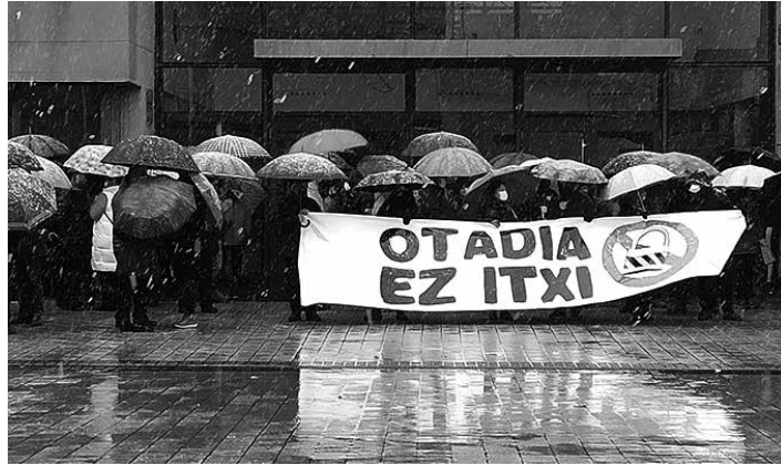
Makina bat jende elkartu zen larunbatean aterpetxearen itxieraren kontra egiteko.

Antolatzaileek kanpaina posible egin duten ekoizleak, eskalgintzako eragileak, boluntarioak eta herritarrak zoriondu ditu. Bestetik, Nafarroako erakunde dei egin diete: "erantzukizuna hartu eta behar beste baliabide jar dezaten hizkuntza politikari buelta emateko".