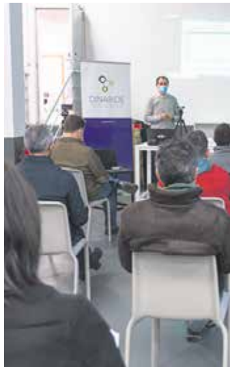
Behatokiaren bilera Dinabiden. SGA

Horrekin batera sektore bakoitzaren ekintza ildoak egokitzeko beharra ikusi zen, erronka eta proiektu handiagoei aurre egiteko. Hala, industria joerak dira: enpleguaren berreskurapena, enpresa gutxiago baina handiagoak ditugu. Bestalde, dinamika demografikoak langi-