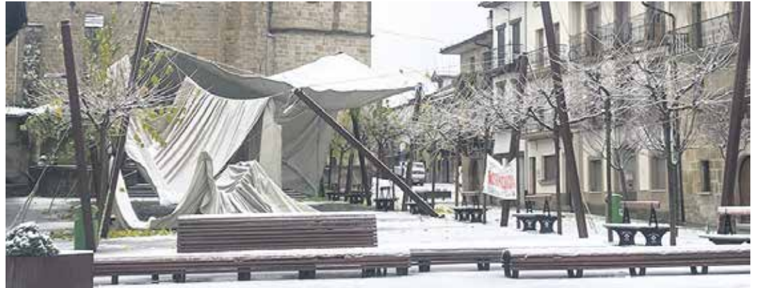
Elurra toldo gainean pilatu eta euskarria den faroletako bat erori zen.