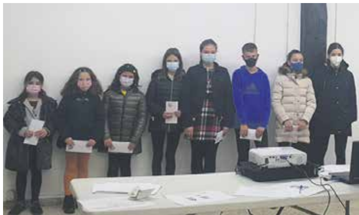
Saritutako margolariak. GIZARTE ZERBITZUEN MANKOMUNITATEA