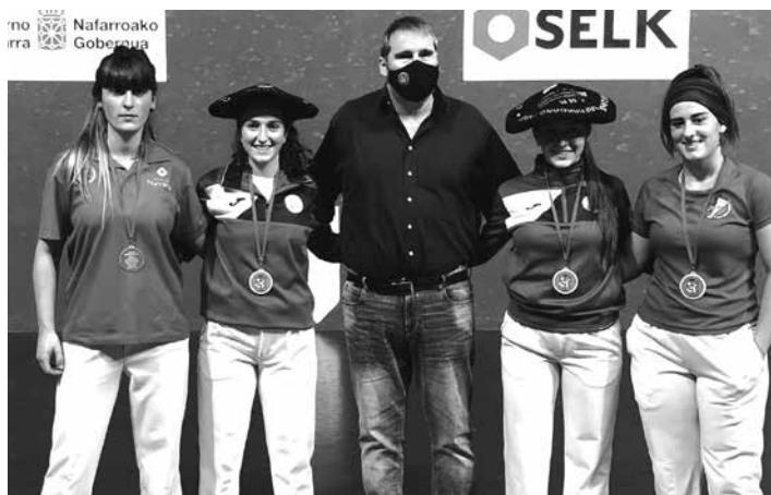
NAFARROAKO PILOTA FEDERAZIOA