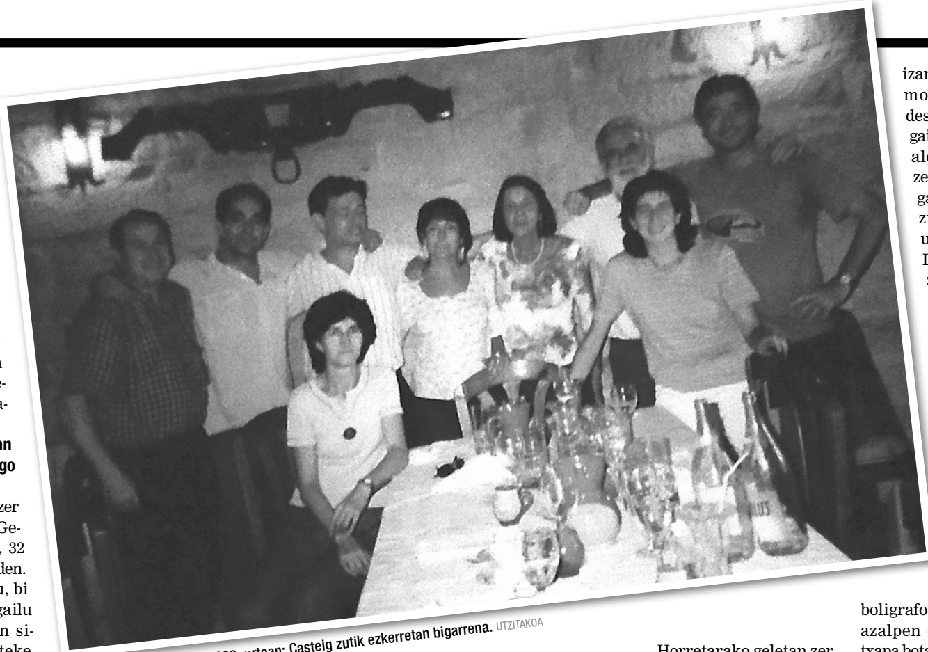
Irakasleen bazkaria 2003. urtean; Casteig zutik ezkerretan bigarrena.

Irakasle asko pasatu dira. Zurekin hasieratik dagoen norbait ba al dago?