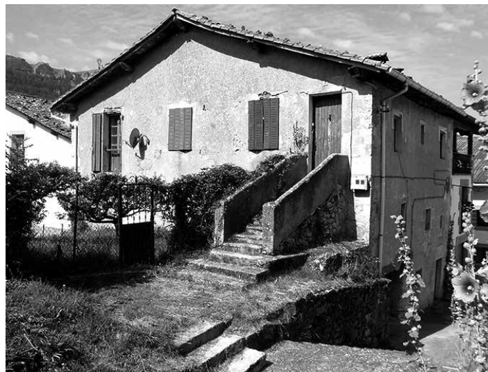
Dorraako Kontzejuak etxerako proiektua eginda du dagoeneko.

Etxeko lehen eta bigarren solairuak etxebizitzetara bideratu nahi ditu Dorraako Kontzejuak.