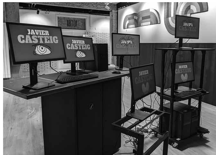
Irakaslearen azken egunean institutua agurtu zen. IES_ALTSASU_BHI

Ez dut berebiziko presioa izan jubilatzeke. Nahi dudalako egin dut; momentua iritsi dela badakit, eta bukatu da.