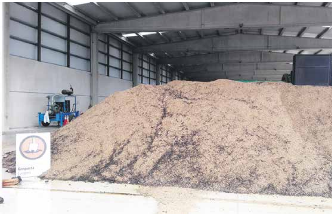
Konpost plantan hainbat kartel jarri dituzte, bisitendako gida izanen dira. UTZITAKOIA