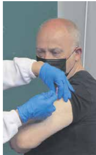
Txertoa hartzen. ARTXIBOA

Lau udalerrri handitan pilatu dira COVID-19 kasu gehien: Lakuntzan 56, Altsasun 55, Irurtzunen 42 eta Etxarri Aranatz 38. Kasu gutxiago zenbatu dira beste seitan: Arakilen 12, Urdiainen 10, Uhartarakilen 8, Olatzagutian 5, eta Ergoienan eta Bakaikun launa. Irañetan eta Iturmendin gaixo bana izan dute. Eta, azkenik, kasu bat bera ere ez da egon ez Arruazun ezta Ziordian ere.