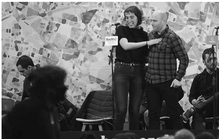
NAF. BERTSOZALE ELKARTEA