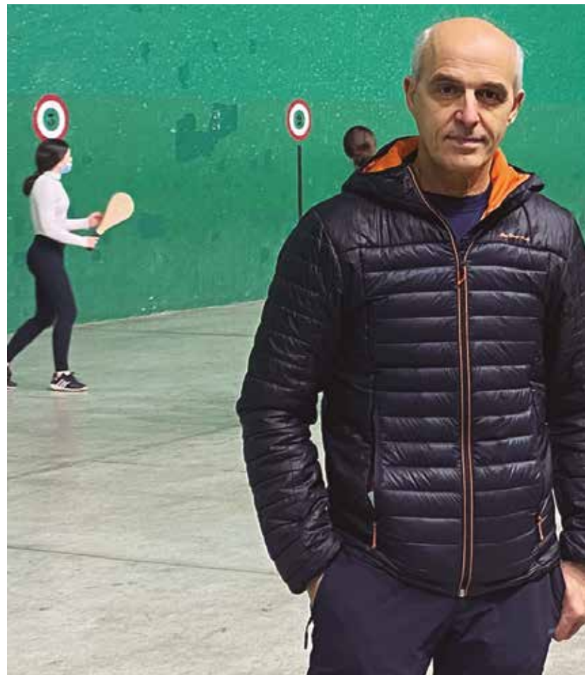
Gure Pilotako emakumezkoen pala taldearen ardura izateaz gain, azken urteetan Gure Pilotako pr...

Talde bat aurrera ateratzeko atzean ilusioa duen monitore edo arduradun bat behar da, motibazioa duena, txapelketak antolatzeaz arduratuko dena, beste klubetako jendearekin harremana izango duena, hango palistak hemengo txapelketetan parte hartzeko. Lan asko egin behar da. Nik oraindik emakumezkoen pala aurrera ateratze-