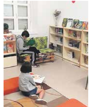
Uharte Arakilgo liburutegia.

2017an egin ziren Txirinbulo haur eskolako lanak, baina langileek salatzen dutenez, "udala, eraikuntzaz gain, ez da beste ezertaz arduratu". Eraikinak lehen momentutik hezetan, itxesurak eta matxurak dituela gaineratu dute, eta mantenu egokia egitea eskatu zaiola udalari, baina "ez dutela erantzunik jaso". Materialak erosteko duten partida ekonomikoa ere "eskasa" dela salatu dute, eta prestakuntza ikastaroetan ikasitakoa ezin dutela praktikara eraman "baliabiderik ez dagoelako".