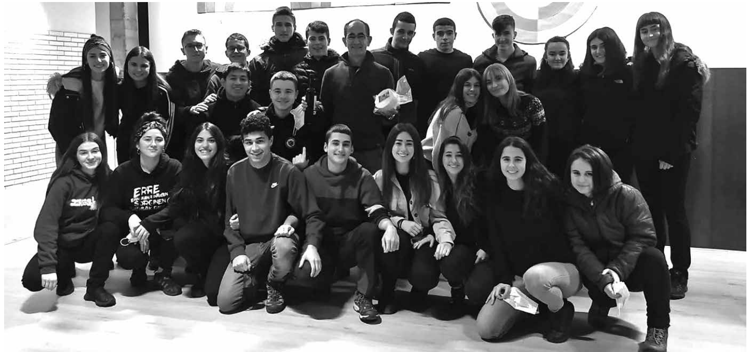
Casteigen azken eguna izan zen astelehenean; ikasleek agurra egin zioten. IES_ALTSASU_BHI

Nik ez daukat ezaugarri berezirik. Ni langile bat naiz. Lan egin behar izan dut. Aparteko dohainik ez daukat. Baina sartu naitzen gauza guztietan horretarako lan egin dut, eta gauzak ahalik eta hobekien egiten saiatu naiz