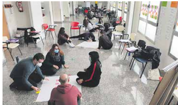
Intxostiapunta gazte gunean plangintza osatzeko parte hartze prozesua.