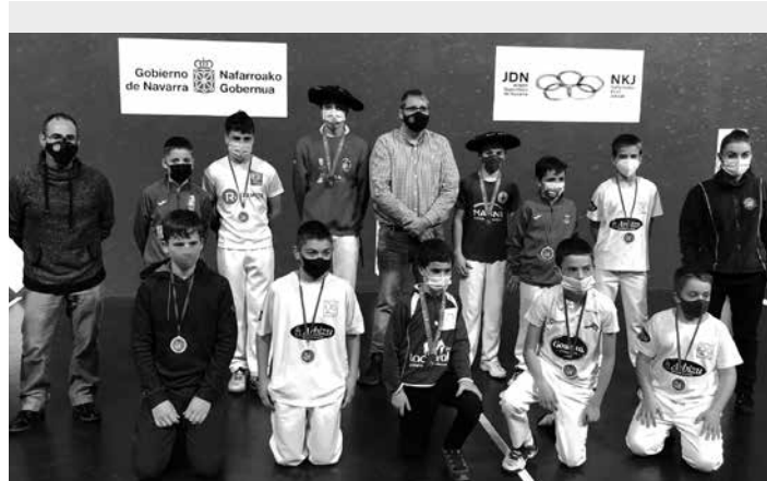
Nafarroako Banakako Txapelketako finalistak. NAFARROAKO PILOTA FEDERAZIOA

Bestalde, Promozioako Binakako lehen bi jardunaldiak irabazita, Bakaikoak eta Elizegik Zubizarreta III.a eta Eskiroz izango dituzte aurkari larunbateko Lizarrako jaialdia mustuko duen partidari.