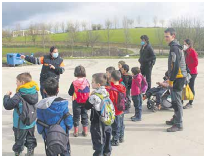
Ikasleak irteera batean. ARTXIBOA

Haur Hezkuntzan ikasleen %20,39 hartzen ditu, 582 ikasle, aurreko ikasturtean baino sei