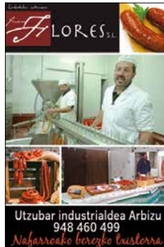
Utzubar industrialdea Arbizu 948 460 499 Nafarroako berezko txustorra.