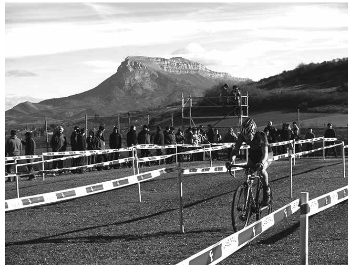
Ziklo-krosa lasterketa berezia izaten da. Irudian, 2019ko Urdiaingo Ziklo-krosa.

Urdiaingo Ziklo-kroseko ibilbidea 2019 urtekoaren ia berbera da, Sagardia auzoaren inguruan egin den aldaketa txiki bat izan ezik. Aitziber futbol zelaia ardatz hartuta, 2,3 kilometroko zirkuitua prestatu dute Burundakoek. Lasterketa Felipe kale parean hasiko da, Urdiaingo behealdean, eta tropela frontoiraino igo on-