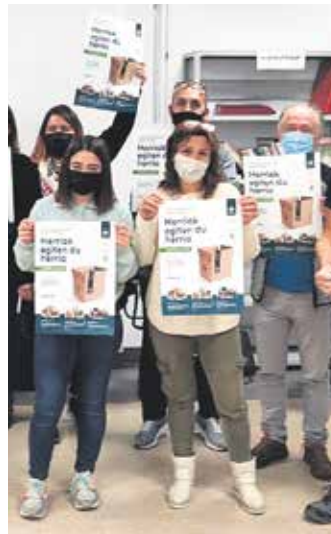
Antolatzaile batzuk. ERRIGORA.EUS

Errigorak hiru zareko eskaintza osatu du: beltza edo normala (55 euro), berdea edo ekologikoa (65 euro) eta txuria edo berezia (75 euro). Aurreko urteetan bezala saskiak milaka etxetara eramaten ditu Errigorak, auzolanean. Eta horri esker, Nafarroa hegoaldeko eta erdialdeko euskalgintzari ekarpen ekonomiko garrantzitsua egiten dio. Izan ere, saski bakoitzaren balioaren %25 ematen zaie ai-