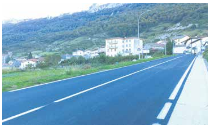
Lizarragarako errepideko zorua berrituta eta eskuinean ezponda egina.