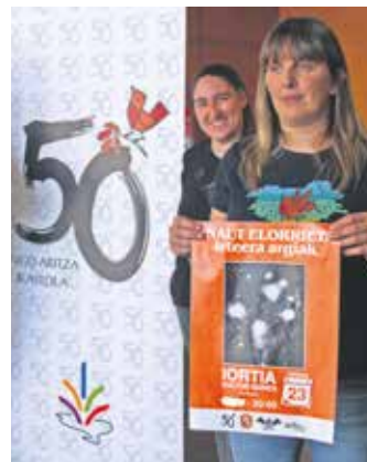
Egitarauko lehen ekitaldia aurkezten.

Baztarrikak aukera baliatu du "ikastolako komunitatea osatzen dugun familia, familia ohi, lan-