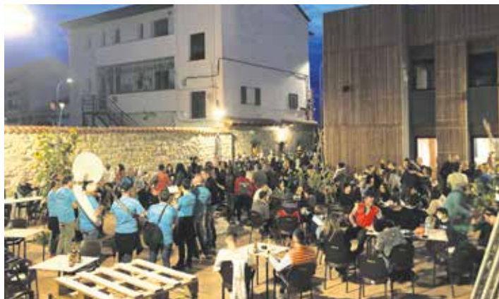
Txarangak jendea erakarri zuen. PIKUXAR