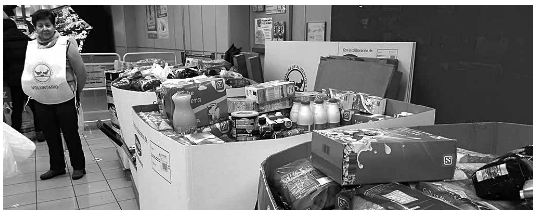
Elikagai bankuak betetzeko urtero bi bilketa egiten dira gutxienez. ARTXIBOA