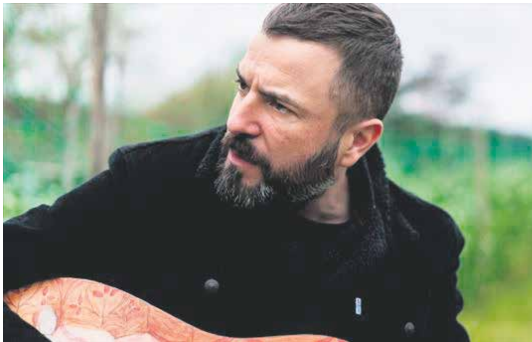
Eñaut Elorrietaren kontzertua izanen da bihar Altsasun. UTZITAKOIA

2019an kaleratu zenuen, eta, ondoren, pandemia etorri zen. Nolakoak izan dira bi urte hauek?