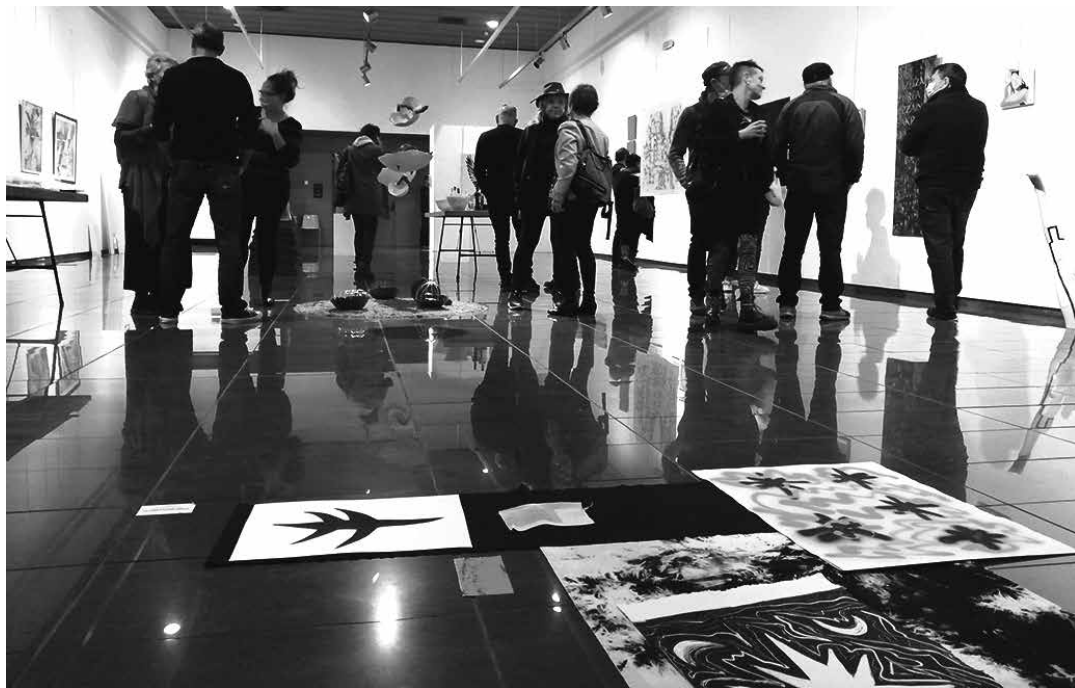
Hamargarren Arte Azoka mustu zuten ostiralean; azaroaren 4ra arte egonen da zabalik.