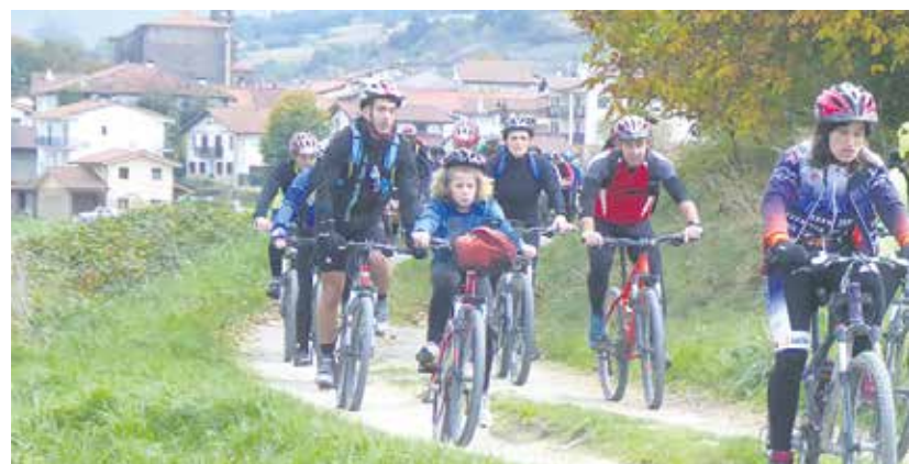
Txirringulariak, Urdiainera bidean. Eguraldiak eutsi zion, eta bizikletan ibiltzeko eguraldi aproposa