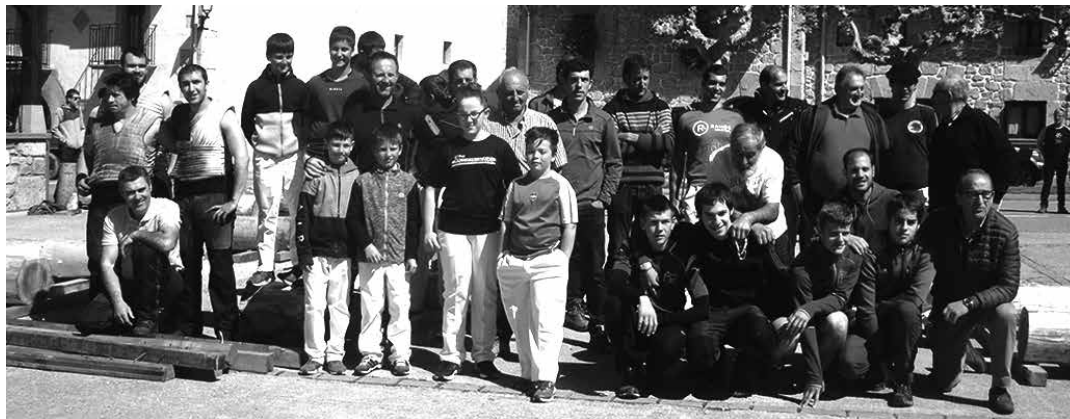
Sakanako Herri Kirol Eguna azken edizioa Arruazuk hartu zuen, 2019ko maiatzaren 5ean.

Erriberatik esku hutsik itzuli ziren 3. mailan dabilzan bi talde sakandarrak. Aralar Mendik Ribera de Navarra liderra estutzea lortu zuen, baina azkenean 5 eta 1 gailendu zen Tuterako taldea. Xota ere ongi aritu zen Cintruenigoko Garbayo Chiviteren kontra, baina Erriberako taldeak irabazi zuen (3 eta 1). Sailkapenean Aralar Mendi zortzigarren da (4 puntu) eta Xota hamabigarren, punturik gabe. Gaur, ostirala, Aralar Mendik sailkapenean bigarren den Universidad de Navarra hartuko du, 19:00etan, eta Xotak hamabigarren den Anaitasunaren kontra jokatu du, igandean, 12:00etan Atakondan.