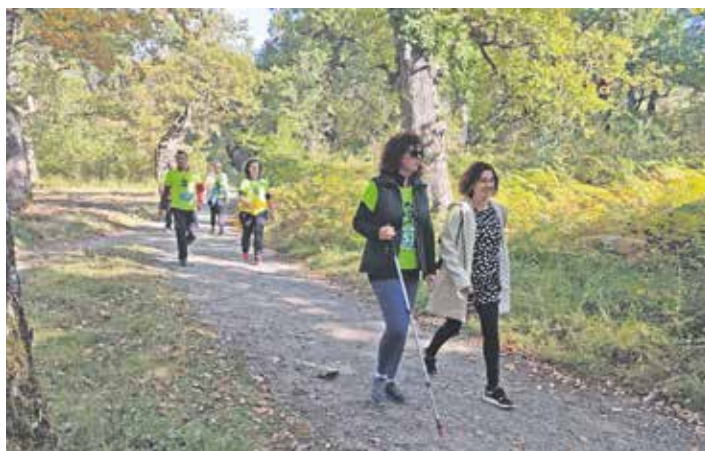
Oinezko martxa egitera animatu ziren asko.