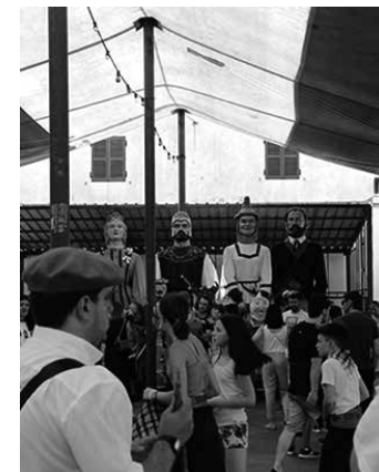
Gaitaria eta erraldoiak.

Udalak 2019 eta 2020an jaiotako ubertearrei ongi etorria egin eta festetako ttattarra jartzeko eguna antolatu du. 12:30ean izan da harrera, plazan. 11:00etan erraldoi eta gaiteroekin kalejira izanen da. 16:00etatik 18:00etara haurrendako puzgarriak, pilotalekuan. 19:00etan Puro Relajoren kontzertua, plazan. Ondoren, auzatea eta zezensuzkoa.