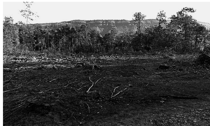
Berriki Baso itxin haritz amerikar ugari moztu dituzte.