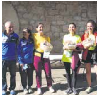
Hiru onddo saski zozketatu ziren.

ruetan 7 kilometro osatu beharra zuten guztiek, ibilbide berbera kontrako norabidean eginez. 268 pertsona animatu ziren Altsasuko baso eta paraje zoragarrietan barna prestatutako zirkuitua egiten, oinez batzuk, eta korrikan besteak. Ondoren, partaideen artean 3 onddo saski zozketatu zituzten. Segidan 41. Ferietako Eskolarteko Krosa abiatu zen, kategoria txikiko lasterketak. 59 neska-mutiko aritu ziren, aurrebenjamin, benjamin, kimuen eta haurren mailetan. Antolatzailak "oso pozik" zeuden ekimenak izandako erantzunarekin eta sortutako giroarekin.