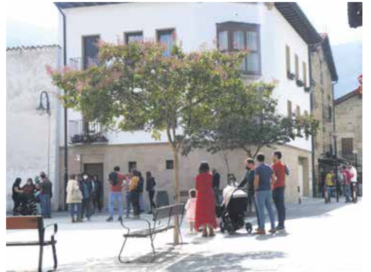
Olaztiarrak San Migel plazan.

Zestauk azaldu duenez, Bidelagun egitasmoa martxan egon den hiru hilabeteetan zortzi boluntario beste horrenbeste ikaslerekin elkartu dira astero, ordu bat edo bi. Aurretik, boluntarioek hainbat arlotan prestatutzatza jaso dute, esate bate-