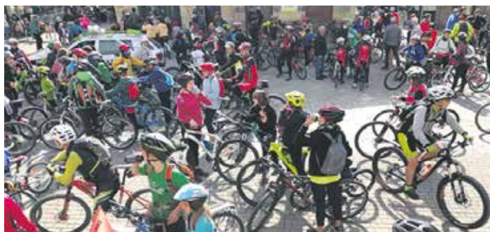
Txirrindulariek Altsasuko plaza bete zuten.