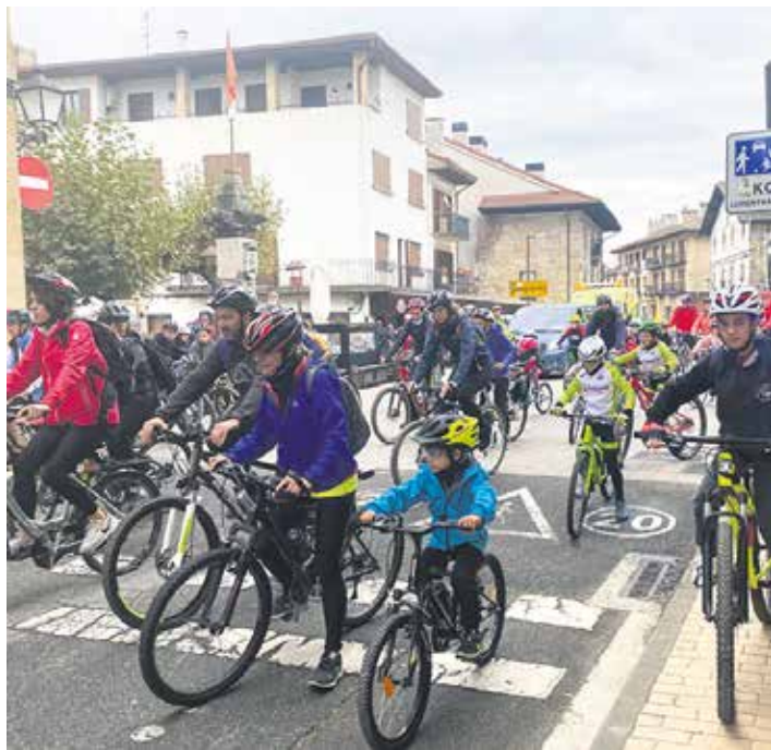
Hamaiketakoa eta gero, Lakuntzatik ateratzen.