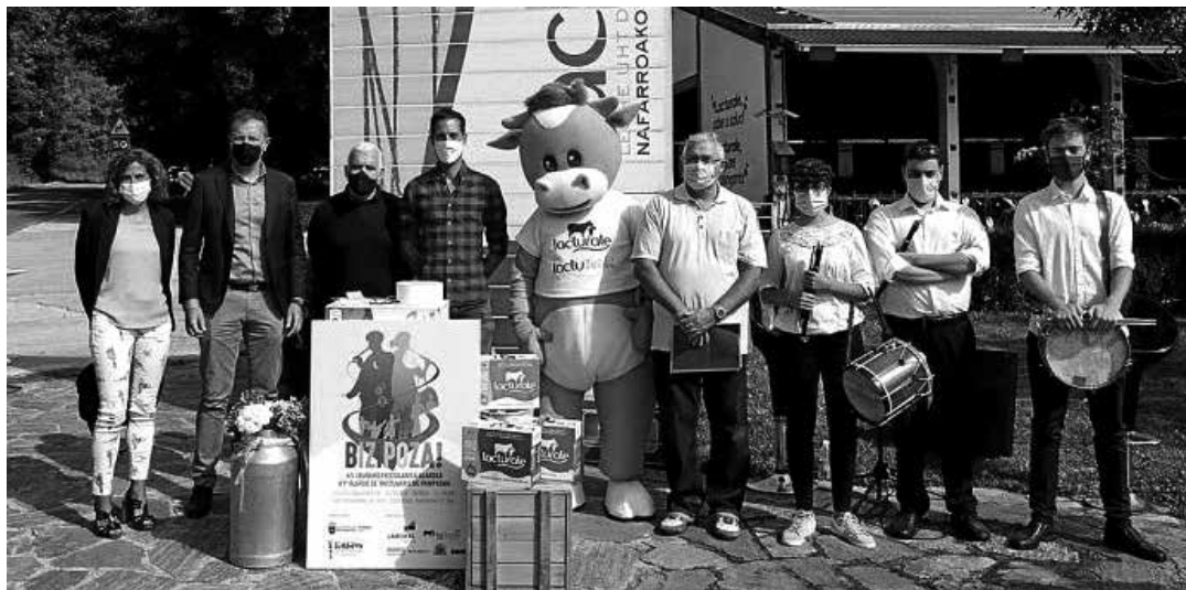
Txistulariak, antolatzaileak eta babesleak, 'Bizipoza!' kontzertuaren aurkezpenean.