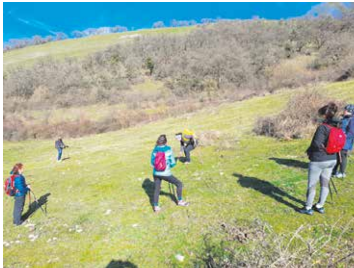
Programaren barruan ipar martxan egiten aritu ziren Ergoienan.

Sakanako Mankomunitateko Kirol Zerbitzuak eta Anitzartean Kulturartekotasun Zerbitzuak Naturanitzean Gozaten programa antolatu dute elkarlanean, Sakanako natura ezagutu, kirol praktika berriak sustatu eta lagun berriak egiteko. Programa ilbeltzean hasi zen, eta ordutik Sakanako txoko eta mendi ederretan barna hainbat irteera edo ekimen antolatu dira. Hurrengoa lastailaren 31n, igandearekin, izanen da: Naturaren hizkuntza ikasi eta ezagutu lelopean San Pedro eta inguruko paraje eta harizti ederretan egingo den ibilbidea.