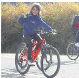
Gaztetxoak oso pozik zeuden.