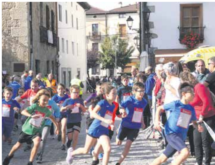
Neska-mutikoak Ferietako Eskolarteko Krosean aritu ziren.