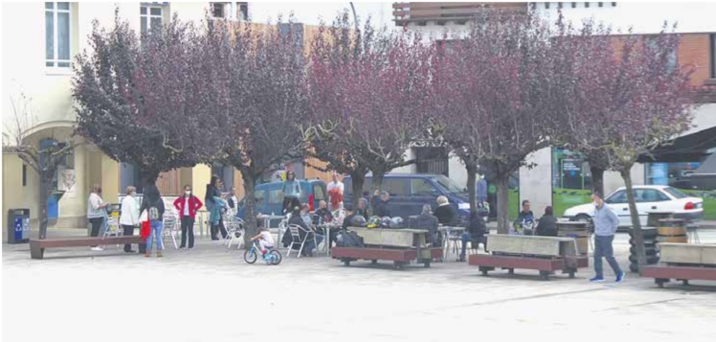
Sakandarrak ez daude pobrezia-aren mamutik salbu.