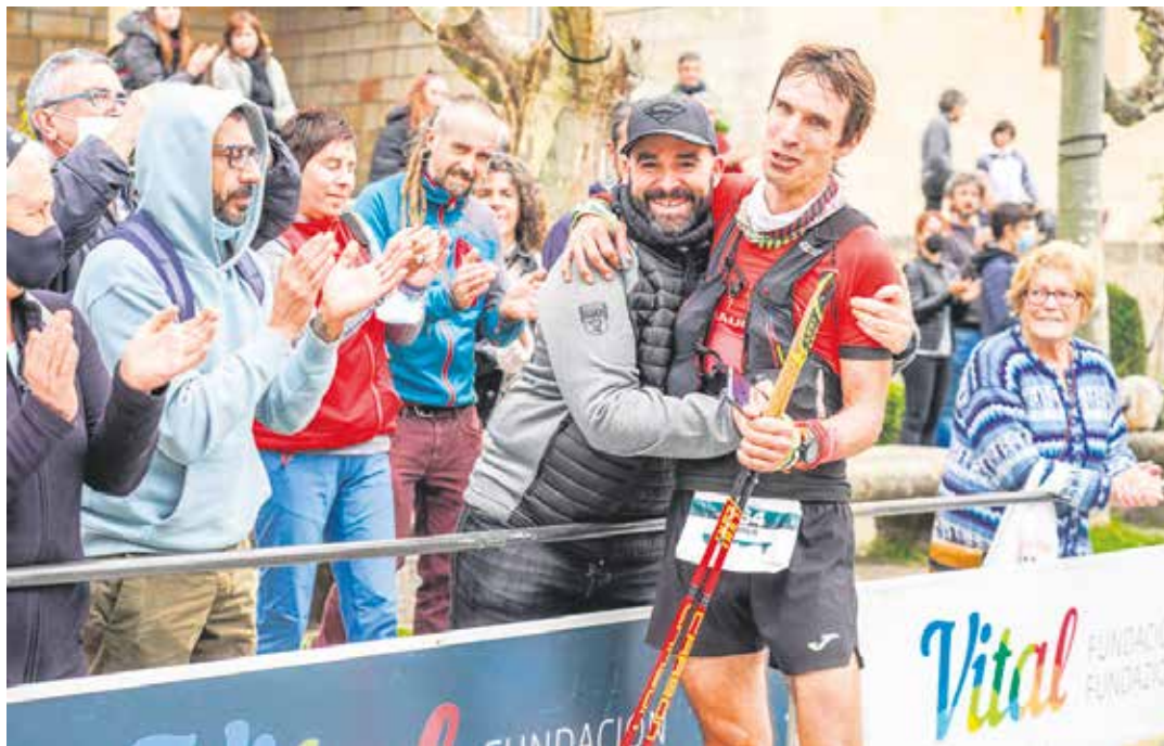
Ander Erice Hiru Haundien helmugan, Araian, hornidura guneetan lagundu zuen lehengusua besarkatzen. UTZITAKOIA