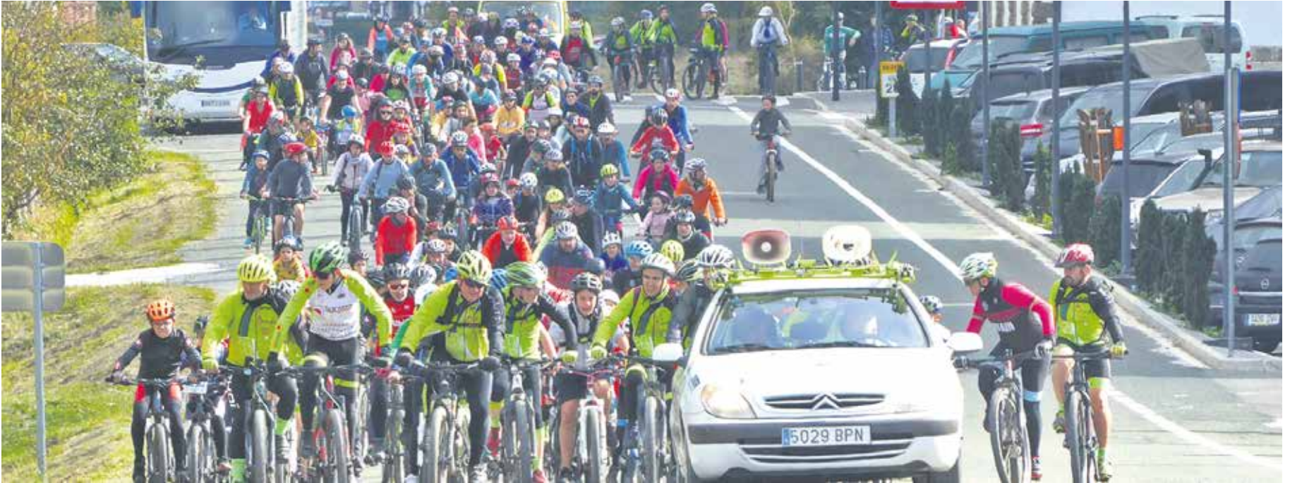
Sakanako Bizikleta Eguneko parte hartzaileak, Urdiainen azken txanpari ekiteko prest. Aurrean, Barranka, Burunda eta Aralar Txirringularitza taldekoak.