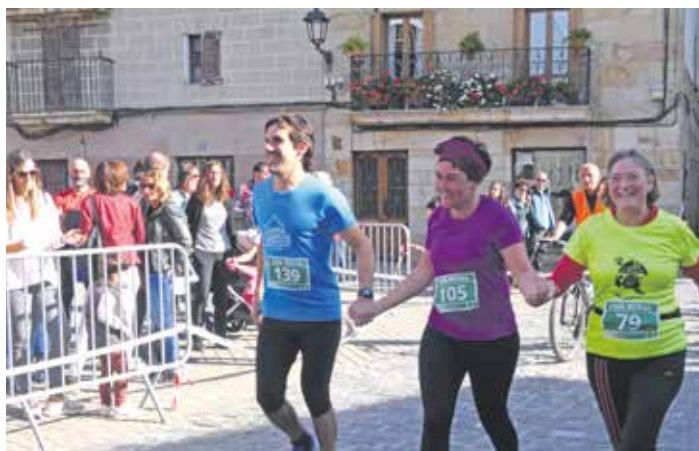
Lasterketan parte hartu zuten hiru pertsona, helmugan.