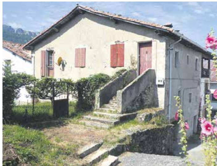
Meistruban etxea herri erdian dago.