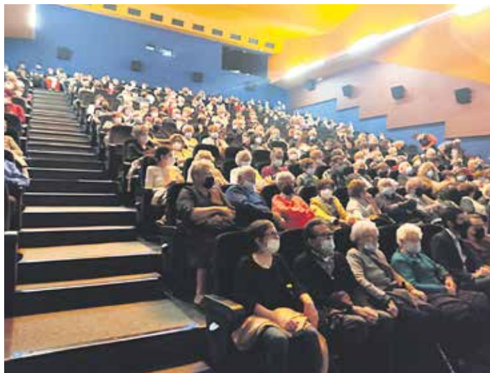
Iortia kultur gunea bete egin zen asteazkeneko aurkezpenean.