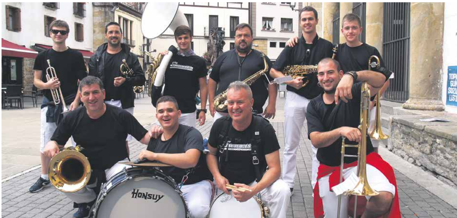
Txorongo Txaranga Altsasuko festan izanen zirenean kontzertua eskaini zuen plazan.