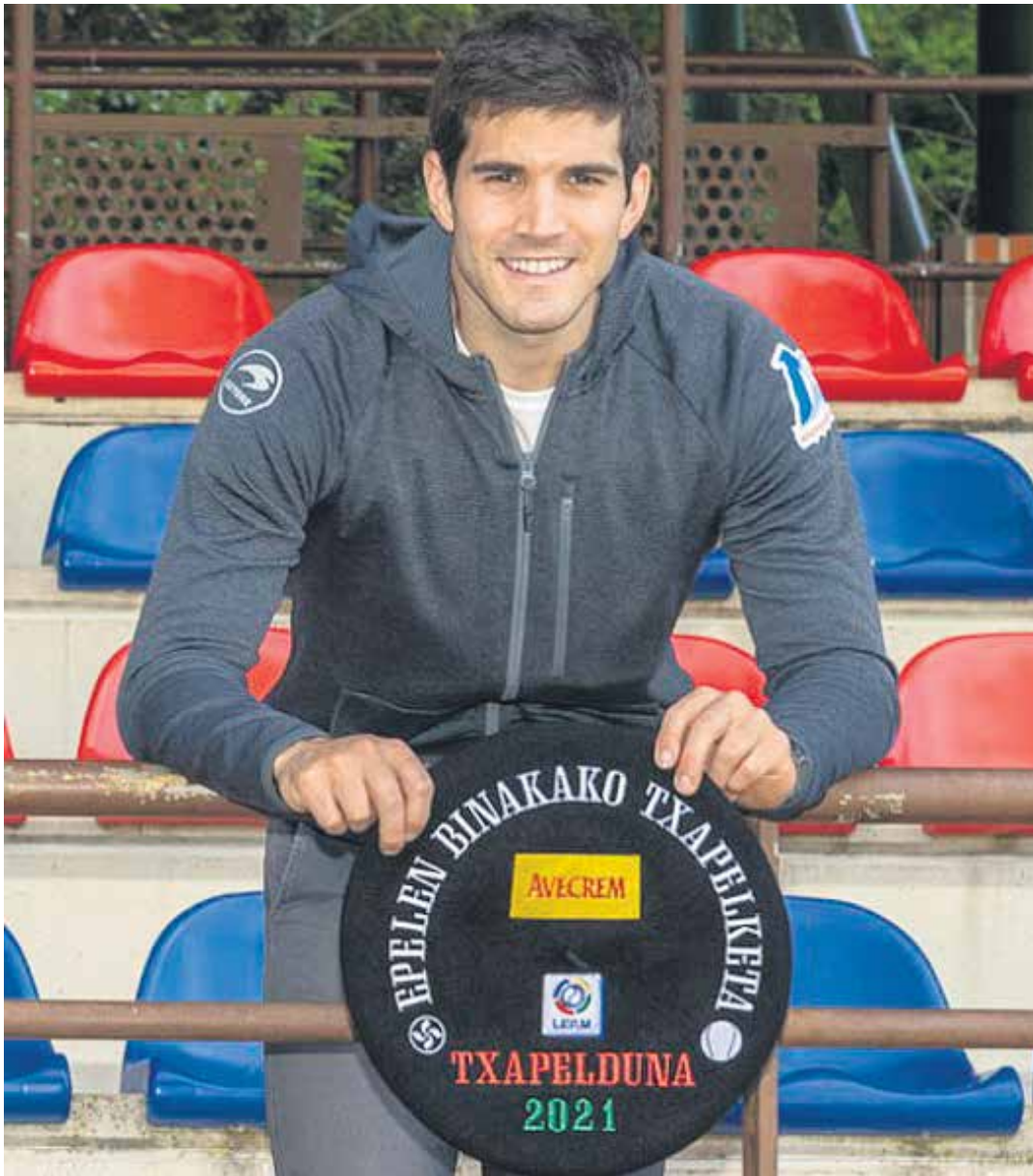
Oraindik ere txapela gehiagoren gose dela eta horretarako gogor entrenatzen duela aitortu du etxarrendarrak. ASPEPELOTA.EUS