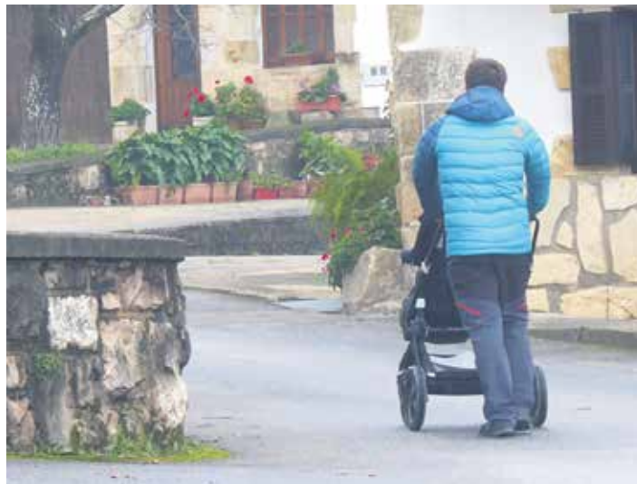
Gizona umearen aulkitxoarekin kalean gora.

D ereduaren alde egin nahi duten guraso askoren zalantza da haiek euskara ez dakitela. Euskara Zerbitzuko teknikariek gogorarazi diete euskaraz ez da-