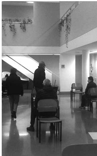
Etxarri Aranazko osasun etxea.

Nafarroako Osasun Plataformako kideek gaztigatu dutenez, "pandemiaren kudeaketa gogor kolpatzen ari da Nafarroako herritarren osasun eskubidea. Aurrez aurreko arreta murriztea,