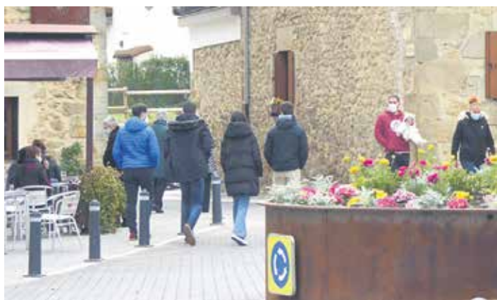
Urdindarrak Kaluxa kalean.