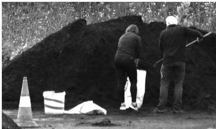
Konpost metatik zakua betetzen.