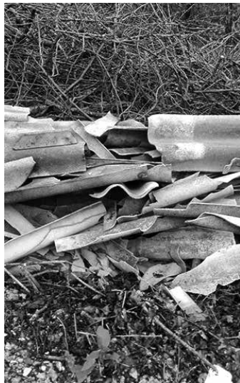
Uralita puskek botata.