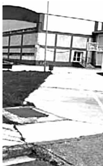
Eskolako patioaren zati bat.

Eskolako patio nagusia zelaiegia da eta euria egiten duenean dauden estolda zulo eskasek ez dute ur guztia hartzen eta putzuak sortzen dira. Sarrerako patioan ez dago halako arazorik. Konponbidea emateko kiroldegiaren hego mendebaldean ura jasotzeko saredun kanaltxoak jarriko dute, baita kirol pista berrituaren mendebaldean. Bi hartune horiek