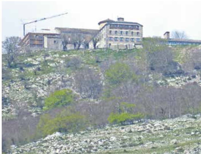
Aralarko santutegiko lanak Uharte Arakildik.

Lanak 450.000 euroko aurrekontua dute, eta beste 100.000 euro eraikina jantzeko.