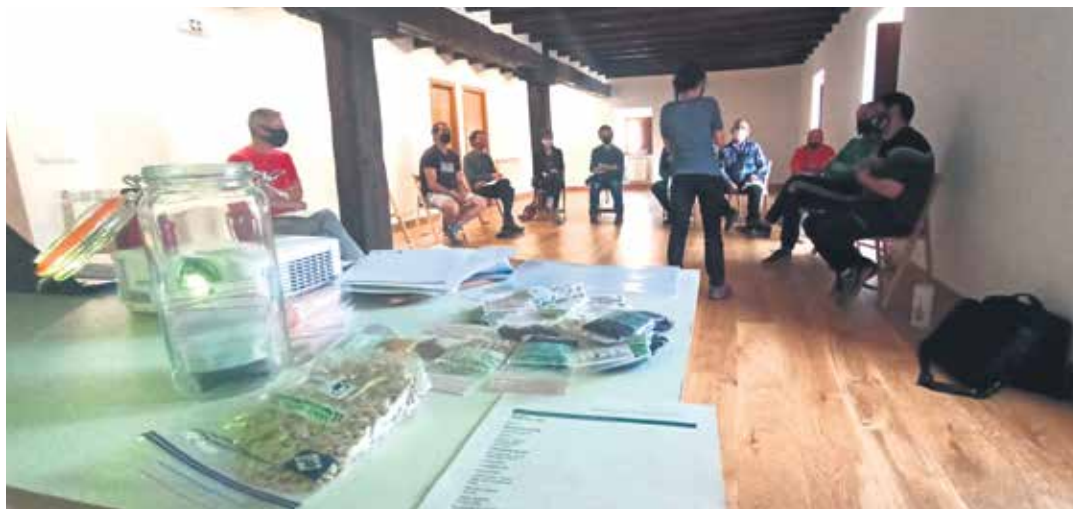
Zaintza sareko kideak azalpenak entzuten, mahai gainean haziak zain dituztela. SAKANAKO GARAPEN AGENTZIA