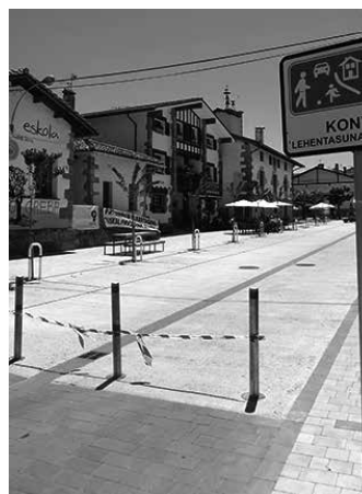
Karrika Nagusia itxita.

Herrian bertan oinezkoen lehen-tasuna eman asmoz, Arbizuko Udalak erabaki zuen asteburuetan karrika Nagusia ibilgailuen trafikoari itxiko ziola. Eguzki ordu gehien eta arbizuarrek kalera gehien ateratzen diren garaian jartzen da neurria indarrean: maiatza eta lastaila arteko asteburuetan, zehazki, ostiraleko 15:00etatik asteleheneko 08:00ak arte. Bitarte horretan ibilgailu gidariek Arbizu zeharkatzeko Uhalde eta Errekondo karrikak erabili behar dituzte.