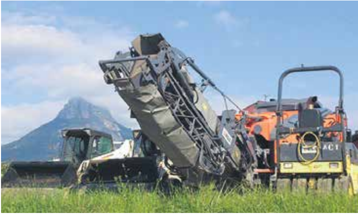
Errepideak eta kaleak asfaltatzeko ibiltzen diren makinetako batzuk.