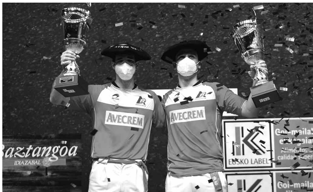
Etxarrengo atzelariak sari emate ekitaldi osoan ezin izan ziren malkoei eutsi.

lana da, entrenamendu asko. Hori da txapelaren arrazoia. Eta zerbait lortzeko horrenbeste lan egin eta gero, lortutakoan zapore hobea du" azaldu zuen Etxarrengoak.