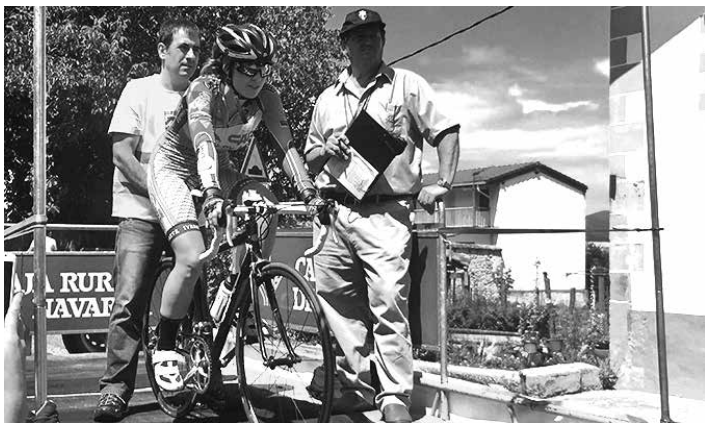
Aurretik Nafarroako Erlojupeko Txapelketa hartu izan du Iturmendik.