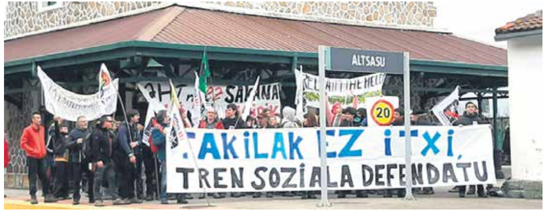
Altsasuko tren geltokian joan den urteko otsailaren 8an egindako elkarretaratzea.

Gobernutik azaldu dutenez, Lurralde Kohesio Departamentuaren proposamena Europako Batzordearen 2004/35/EE Zuzendaritza Nagusiak 22 errepidetakoz babesak egokituko ditu. Horretara 400.000 euroko (BEZa barne) bideratuko