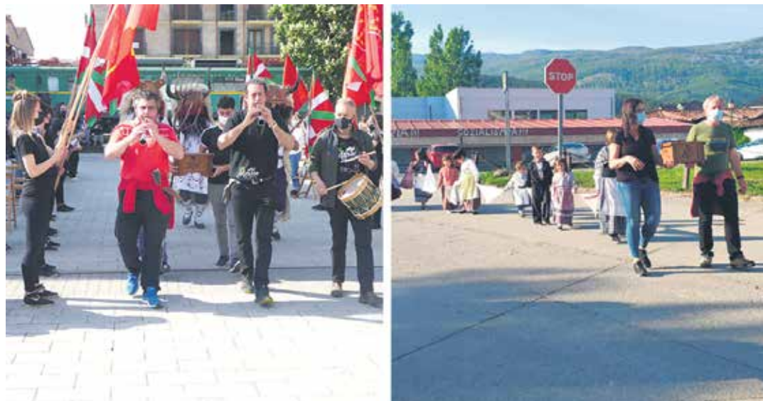
Ezkerrean, Kutxa Bira Altsasura iritsi zenean eta ezkerrean, Arbizura iristen.