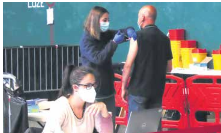
Aste honetan 1.136 txerto jarri dira Sakanan.

Hala ere, bai Nafarroako Osasun Zerbitzuak baita Etxarri Aranazko Udalak ere etxarriarrei dei egin diete COVID-19 gaitza ez transmititzeko prebentzio neurriak betetzeko eta elkar zaintzeko.