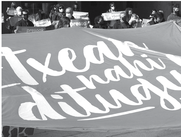
Etxarriak presoek herriratzea eskatzen.

Karasatorreren eta Paroten lekualdaketekin Espainian preso dauden etxarriarren lau lekualdaketatik hiru egin dituzte.