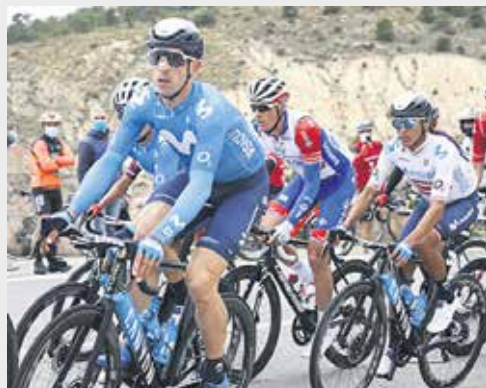
Masen alde lan egingo du Erbitik. MOVISTAR TEAM