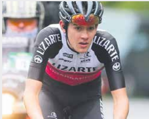
Arrietak eraso jo zuen Balentziagan. LIZARTE

Iraitz Goñi txapelduna Zarrakazteluko lasterketan 3. sailkatu zen arbizuarra, Nafarroako Master 40 Txapelketan lehena