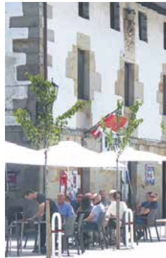
Arbizuarrek terrazan. ARTXIBOA

Bi herrien perimetro itxiera ezarrita dagoen bitartean arbizuarrek eta etxarriarrek bakarrik beraien dermionan ibiltzeko aukera izanen dute. Ezin izanen dira dermiotik inolako justifikaziorik gabe atera. Arbizuarrek eta etxarriarrek justifikaturiko joan-etorriak egiteko honako arazoietako bat izan beharko dute, dagokion ziurtagiriarekin egiaztatu beharko dutena: osasun arazoak; lan edo lege arloko betebeharrak betetzea; uniber-