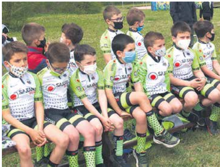
Aralar taldeko gaztetxoak, argazki sesioaren zain, Arbizuko ekokanpinean.

Neska-mutilak trebatzea eta txirrindularitzarekin goza dezatela, hori da klubaren helburua. Betiko helburua. "Izan ere, hori