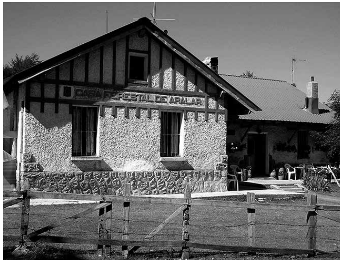
Duela 12 urte botatako eraikina.