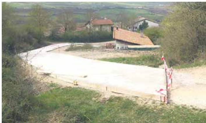
Unanuko Kontzejuak Berriainerako pista lehena zati konpontzen ari da.