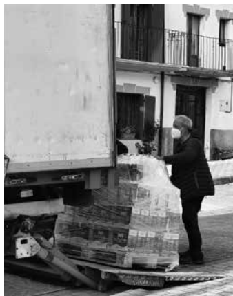
Jasotako esnea kargatzen. @BAKAIKU_INFO