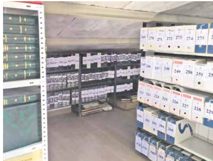
Ergoienako Udalaren artxiboa txukundu egin dute. ERGOIENAKO UDALA

Hitzarmenaren arabera, foru administrazioak hirigintza planak balio dituen 48.000 euroen