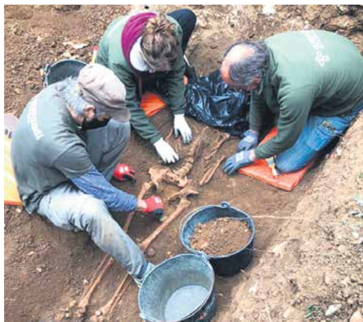
Aranzadi zientzia elkarte-ko kideak gorpua deshobiratzen.