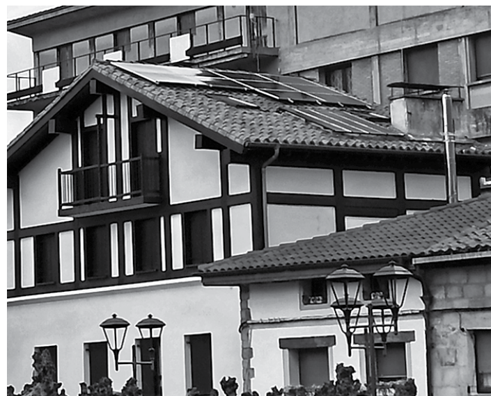
Plaka fotovoltaikoak Olatzagutiako etxe batean.

"PREZIOAREN %40-50-A AURREZTU DEZAKEGU PLAKA FOTOVOLTAIKOAK JARRIZ"