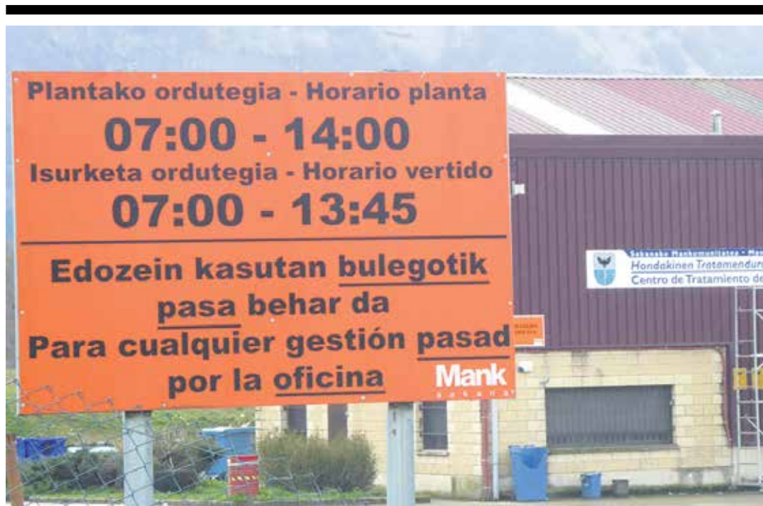
Tratamendu plantara ezin da joan. Emausko Trapuketarien zerbitzua eskatzeko 'https://labur.eus/HnUEa' edo 948 464 867.