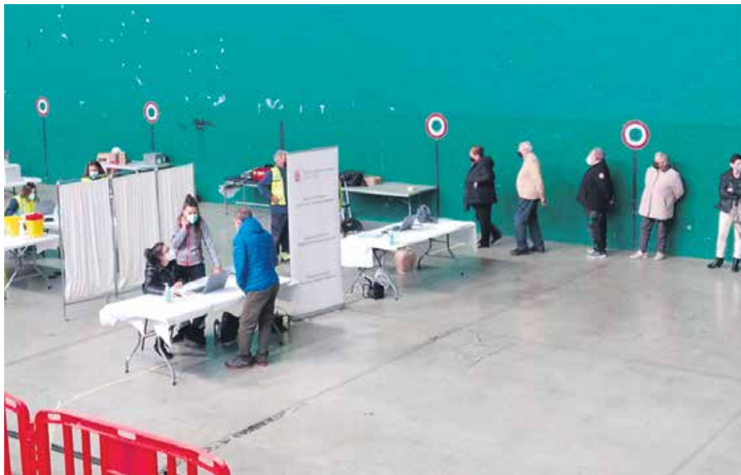
Sakana erdialdeko 70 eta 79 urte artekoek txertoaren lehen dosia jaso zuten asteartean Etxarri Aranazko frontoian.