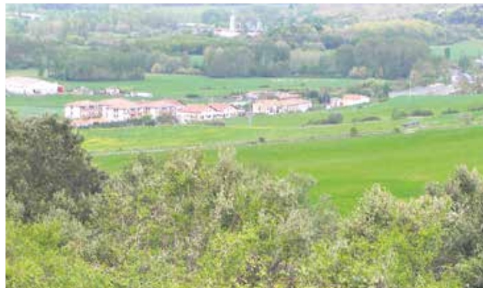
Izurdiagako Geltoki auzoa.