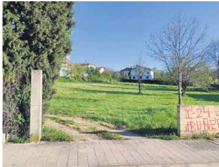
Udalak salduko dituen partzelak dauden tokia.

Alkateak jakinarazi duenez, "dena ongi badoa, lursail horrek