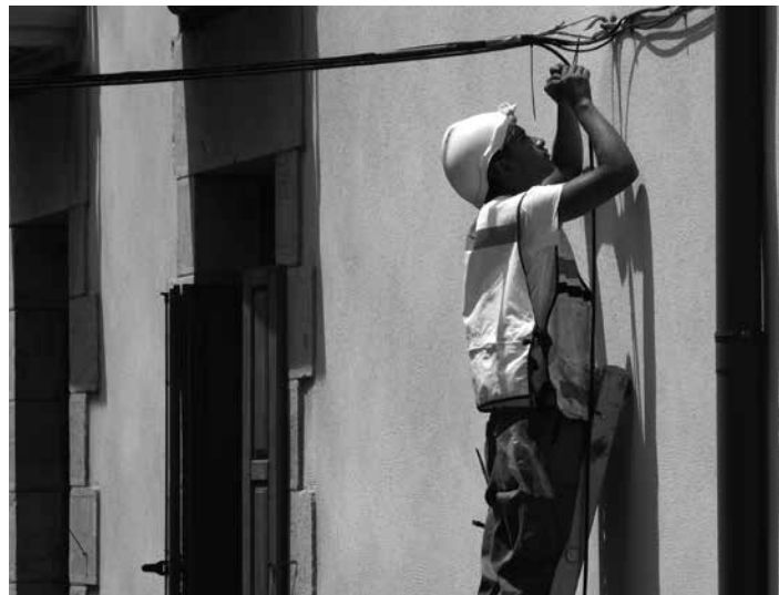
Langilea zuntz optikoko kablea jartzeko lanean.

Herriko kaleak berri zirenean argindar sarea lurperatu zen. Horrekin batera, lau hodi jarri ziren lurpean, aurreikusiz haien bidez telekomunikaziorako sareak eta bestelakoak sar zitezkeela. Garaia iritsi da eta Arruazuko Udalak lau hodi horietako bat bera ere ez du erabiliko zuntz optikoa sartzeko, argiteria publikokoa erabiliko du. Alkateak azaldu du erabaki horren zergatia: "lanak egin zirenean Movistarrek hodiak eta arketak jarri zituen, baina udalak pagatu zituen. Hala ere, enpresak beretzat ditu eta zuntz optikoa hortik sartuz gero, edo kanon bat pagatzen zaio edo epaitegian salaketa jarriko luke". Alkateak nabarmendu duenez, udalak enpresari hodiak erabil-