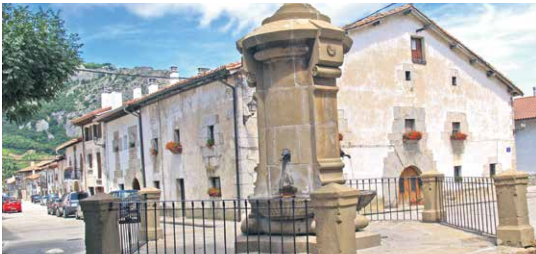
Plazako iturria eta Felipe Gorriti kalea.