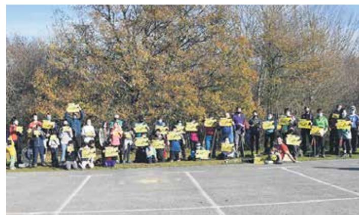
Azaroaren 28an Madotz eta Astitz arteko bidea egin zuten.

Koskobiloko aztarnategiak zeresana ematen segituko du. Joan den mendeko 50. hamarkada hasieran leizeko bi adarretan zegoen lur eta material guztia hondakindegia batean bota zuten. Handik material asko berreskuratu zuten. Baina udan Aranzadi zientzia elkarteko kideak han izan ziren arkeologia indusketa egiten. Jasotakoa aztertzen ariko dira orain. Ziurrenik Koskobiloko aztarnategiak zeresana ematen segituko du.