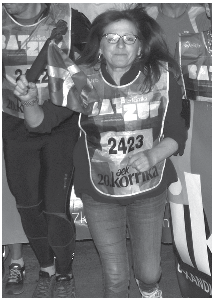
2017ko Korrikako lekukoa hartuta Arbizon.

zuten lehen km-a. Gero Satrustegi berritro etxera eraman genuen, eta Iruñera.