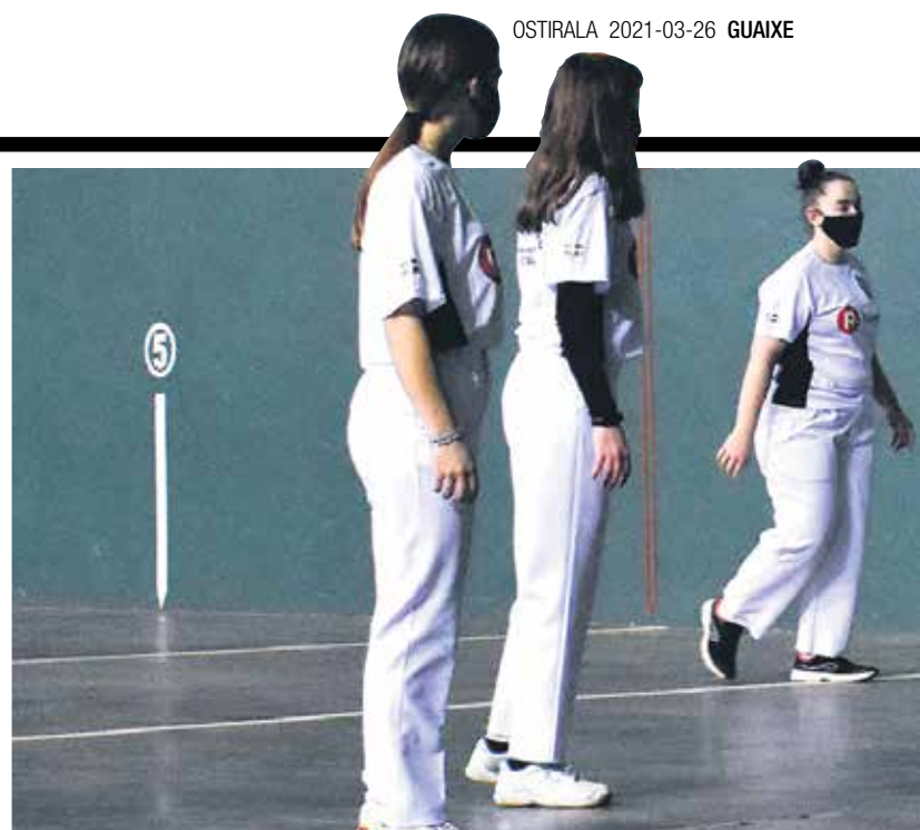
Pilotajaukuko esku pilotako emakumeen taldeko entrenamendu bat, haurren eta kadeteen mailak.

REMONTA EUSKAL JAI BERRI FUNDAZIOAK ALTSASUN ERREMONTE ESKAINTZA EGITEA PROPOSATU DIE