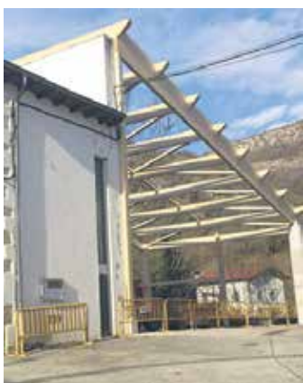
Frontoia estaltzeko lanen lehen fasea.