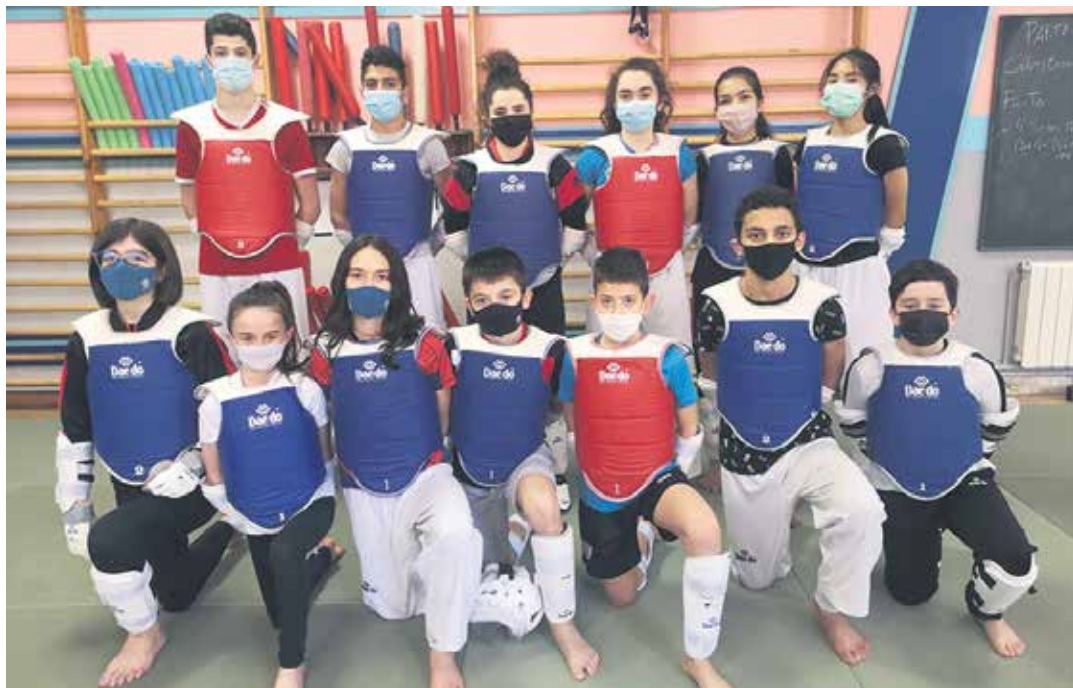
Bargagain Taekwondo Taldeko lehiaketa taldeko kideak, larunbateko entrenamenduan. BARGAGAIN