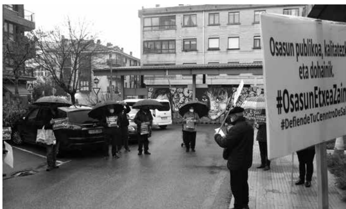
Altsasun bilkurez aparte sinadurak biltzen ari dira zerbitzua hobetzeko. UTZITAKOIA