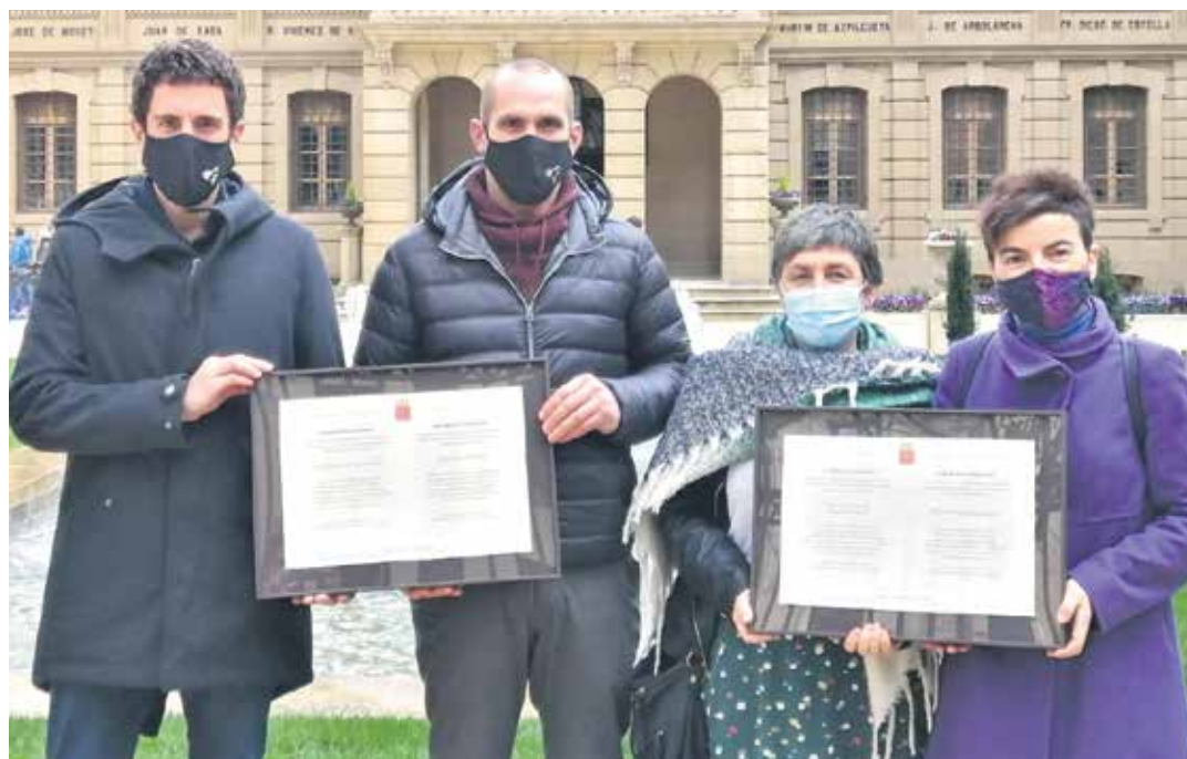
Bakaikuko eta Etxarriko udal ordezkariak diplomekin Nafarroako Jauregiko lorategian.

Frontoiari teilatua 2019an jarri zion Egiarretako Kontzejuak. Lanen bigarren fasea aurten egingen da eta, horrela, Egiarretako frontoia guztiz estalita geldituko da. Kontzejuak aurtengo aurreikusitako lanen artean dago frontoiko eskuin paretan itxitura egitea, haizeaz eta euriaz babesteko. Behealdean, segurtasun gardeneko beirak, ia 5 metrora arte, eta, horrela, Satrustegi mendilerroaren ikuspegiarekin gozatzeko aukera izanen da, eta handik teilatutako polikarbonato zelularreko plaka gardena. Gainera, eskuin paretaren azpian dagoen porlanezko habea harriz forratuko da, banku luze bat sortzeko. Azkenik, frontoia eskuin alderantz handituko da, han dagoen egurrezko zutabea bildu eta babesteko. Lanek 39.675,52 euroko (BEZ barne) aurrekontua dute. Haiek egiten interesatuek eskaintzak apirilaren 15eko 10:00ak arte aurkez ditzakete.