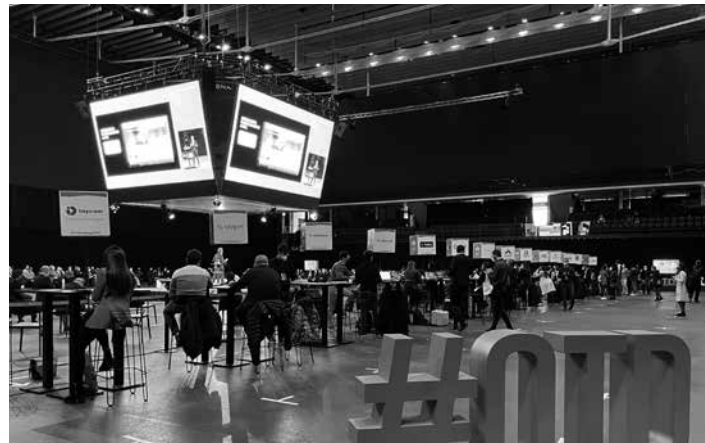
SAKANAKO GARAPEN AGENTZIA

#OTDChallenge2021 eraldaketa digitaleko topaketa handia hartu zuen Iruñeko Nafarroa Arenak herenegun eta atzo. Nafarroako Industria fundazioak antolatutako topaketan 600 profesional baino gehiagok parte hartu zuten, haietatik %15 Nafarroatik kanpokoak. Dinabide bere azpiegitura eta egitasmoak aurkeztu zituen.