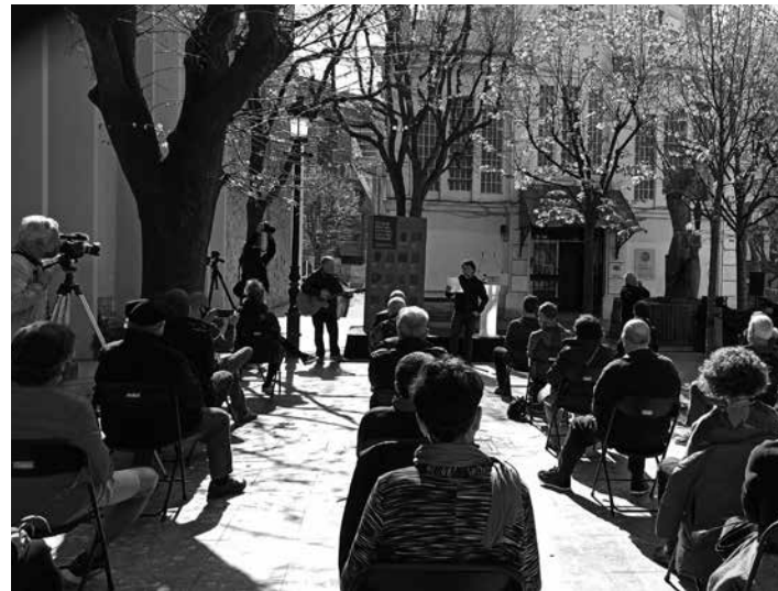
Donostian torturak hildako 14 pertsonak gogoratzeko ekitaldia. UTZITAKOIA

Egiari Zor fundazioko kideek gaztigatu zuten, torturaren ondorioz hildako 14 pertsonak ez dute zegokien aitortza jaso. Gaineratuz, "tortura basati horien guztien erantzuleek, egile materialek eta erakunde erantzuleek zigorgabetasun osoa izaten jarraitzen dute. Eta nahikoa da jada". Ordezkaritza politikoa eta instituzionalek erantzukizun politikoak beren gain ez hartzeko aitzakiak erabiltze dituztela salatu zuten. Donostiako ekitaldian