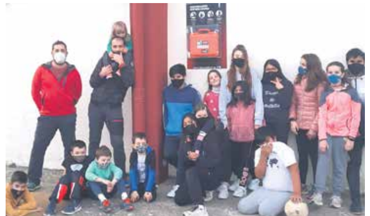
Etxarrendarrak frontoian jarritako desfibriladorearen ondoan. ARAKILGO UDALA

Hitzarmenean jaso denez elkartek plazaren erabilera publiko udal zerga batzuk ez ditu ordaindu beharko. Bestalde, Pikuberri elkarteak plazaren erabilera publiko erabilera edo jarduera egiteko. Udalak Piku plazan zerbait egin nahiko balu elkarteari baimena eskatu beharko dio.