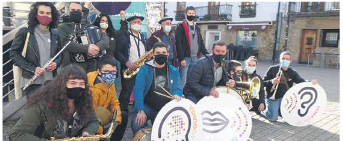
Zangitu fanfarreko kideak.