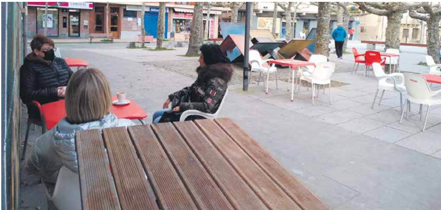
Jendea Etxarri Aranzako plazako taberna bateko terrazan eserita.