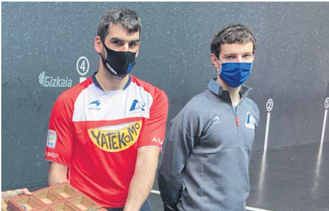
Bi bikoez asteazkenean aukeratu zuten finaleko materiala eta nahi zutena topatu zuten saskian. ASPE