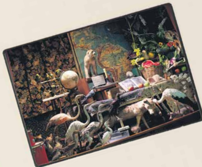
'Love needs time to kill' proiektuaren irudi bat.