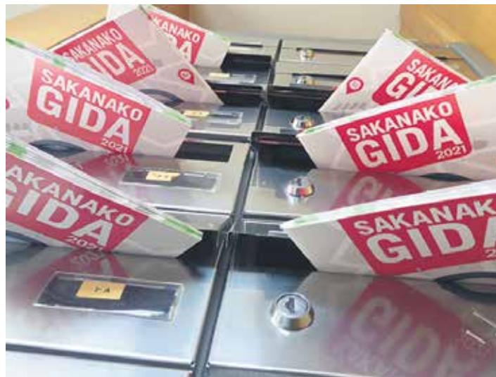
Zerbitzu eta establezimenduen berri ematen duen Sakanako Gida buzoietan.

Sakanako Gida, ibarreko dendek, zerbitzuen, enpresen eta autonomoen informazio osatua eta eguneratua du. Eta horixe jasoko dute sakandar guztiek beraien etxeetan hurrengo egunetan. Guaixe fundazioaren ekimenez argitaratu da gida komertzialaren zarpigarren edizioa. Hura zabaltzen duenak egunerokoan baliagarria zaion informazio praktikoa opatuko du, esaterako, osasun etxe, udal edo bestelako erakundeen telefonoak. Sakanako Gidaren aurtengo berritasuna hainbat herritako mapak dira, establezimenduak kokatzen lagunduko dutenak.