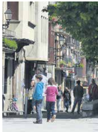
Etxarriarrak plazan. ARTXIBOA

Herriko saltokietako kontsumoa sustatzeko ekimena martxan jarri du Etxarri Aranazko Udalak. Horretarako, Sakanako Dendari, Ostalari eta Zerbitzuen Elkarrearen ezinbesteko laguntza izan du. Etxarrin bizi! Etxarrin erosi! lelopean bi kontsumo bonu atera ditu Etxarri Aranazko Udalak. Lehenengo bonua 15 eurokoa da. Herritarrek 8 eurotan erosiko dute, eta udalak 7 euro finantzatuko ditu. Bonu hori ekimenean atxikitako ondoko saltokietan erabili daitezke: ile apaindegi eta