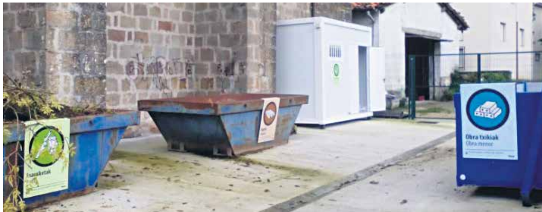
Ziordiko elizaren atzeko aldean zabaldu dute hondakinendako ekarpen gune berria.

Behin diagnostia despedituta, Altsasuko Udalak foru administrazioaren dirulaguntza jasoko balu, bigarren faseari ekinen lioke, bizikidetzaren plana egiteari.