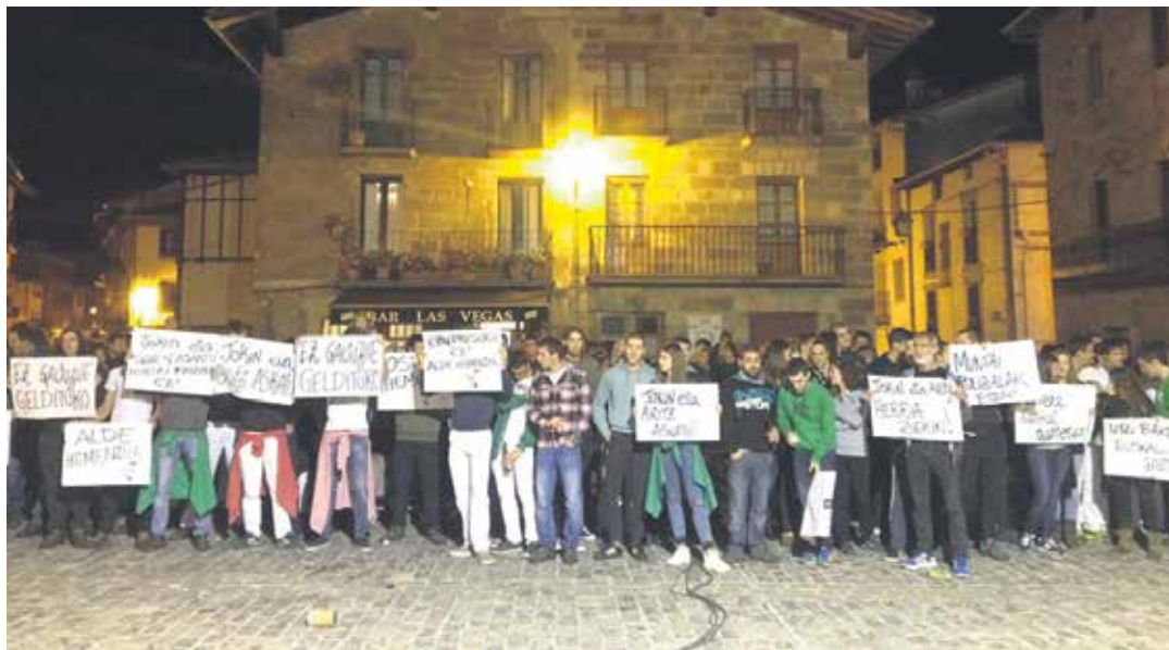
Lehenengo atxiloketen ondorengo mobilizazioak. ARTXIBOA