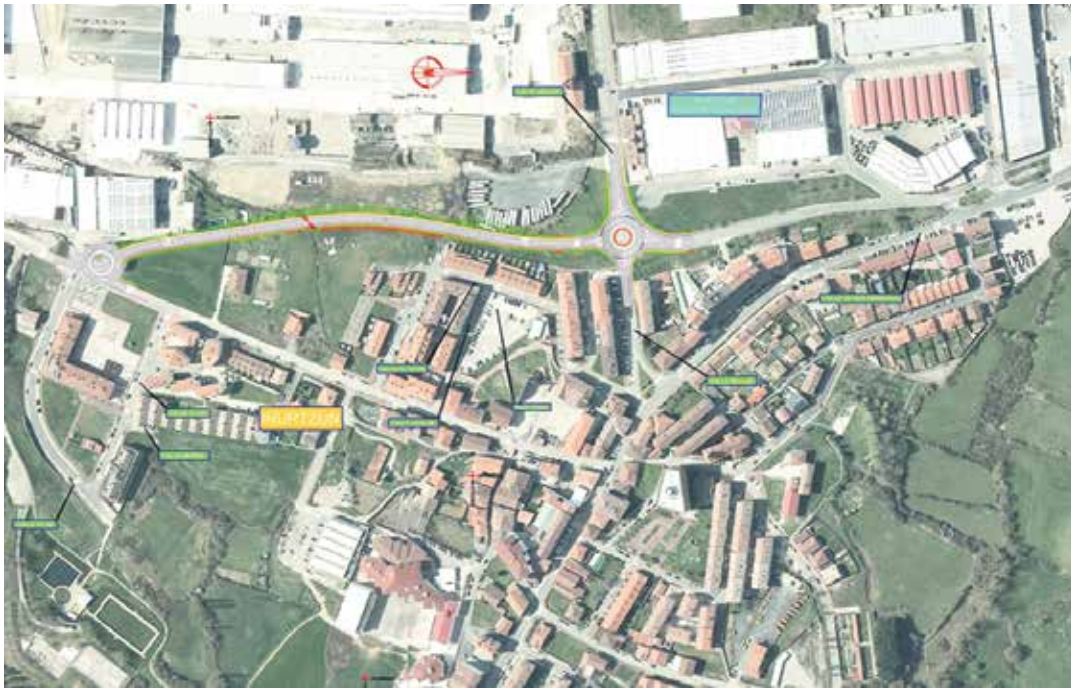
Irurtzunen egingo duten saihesbidearen plana. IRURTZUNGO UDALA