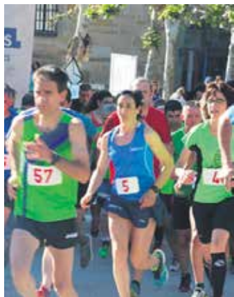
Korrikalariak Bakaikun. ARTXIBOA