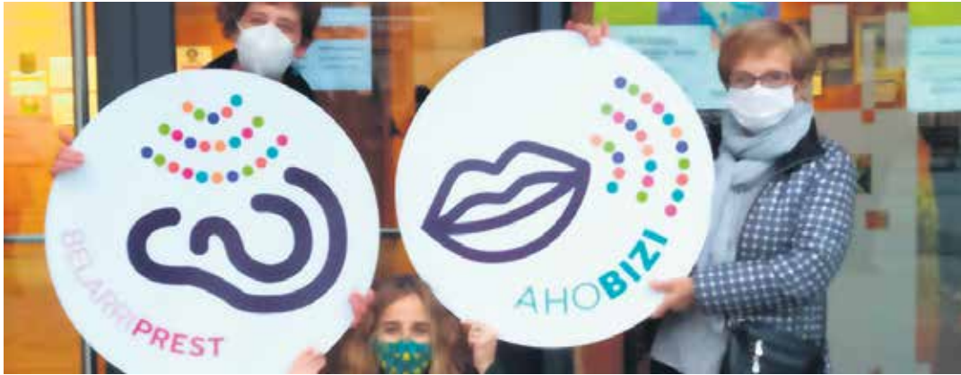
Joan den asteburuan hasi ziren txapa banaketarekin. UTZITAKOIA