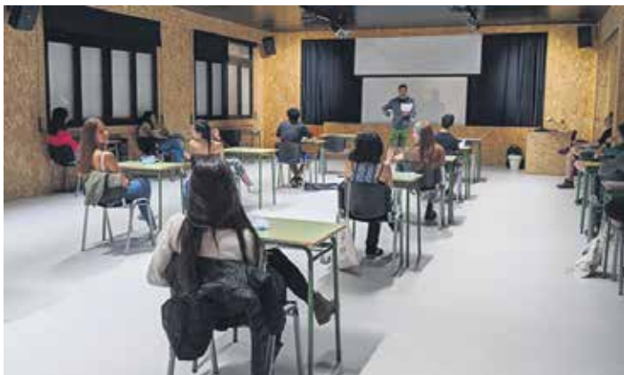
Altsasu BHI ikastetxeko ikasleak ikasturte hasieran. ARTXIBOA