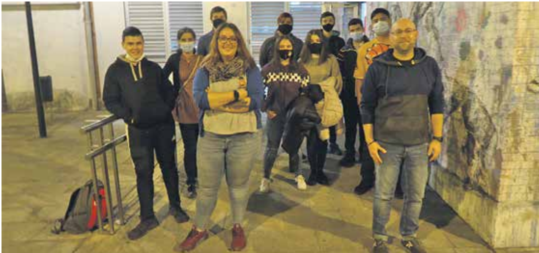
Intxostiapunta gazte guneko begiraleak.