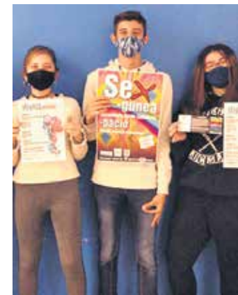
Berriemaileetako batzuk.