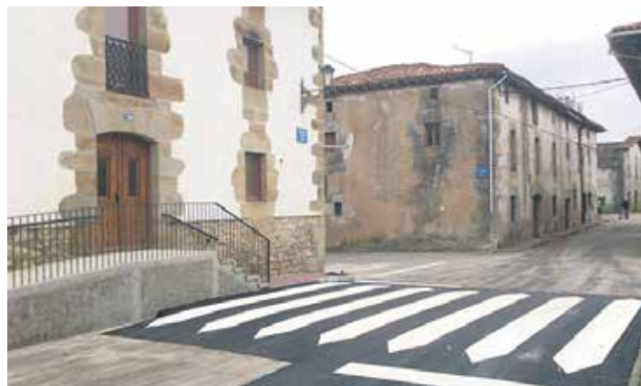
Zebrabideak kontzeju etxea eta Batasunaren Iturria plaza lotzen ditu.

Behatoki kide diren eragileek hilaren 18ra arteko epea dute beraien proposamenak info@sakanagaratzen.com helbidera bidaltzeko. Mezuan ekimenaren izenaz aparte, honakoak ere bidali beharko dituzte: haren sustatzaileen izen-abizenak eta kontaktua, ekimenaren azalpena eta proposamenaren zergatia. Behatoki kideen ordezkaritza batek osatutako epaimahaiak jasotako proposamenen artean bat aukeratuko du. Sari banaketa azaroaren 26an egingen da.