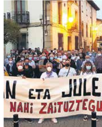
Presoen askatasuna aldarrikatzen.

Altsasun hurrengo bi igandetan Gure Etxea eraikineko beheko solairuan izanen dira 13:00etatik 14:30era. Izena eman edota txapak jaso nahi dutenek handik pasa beharko dira. Gainera, Sakanako batzorde guztiek etxeetan jartzeko Euskaraldiko banderolak salgai dituzte bost eurotan.