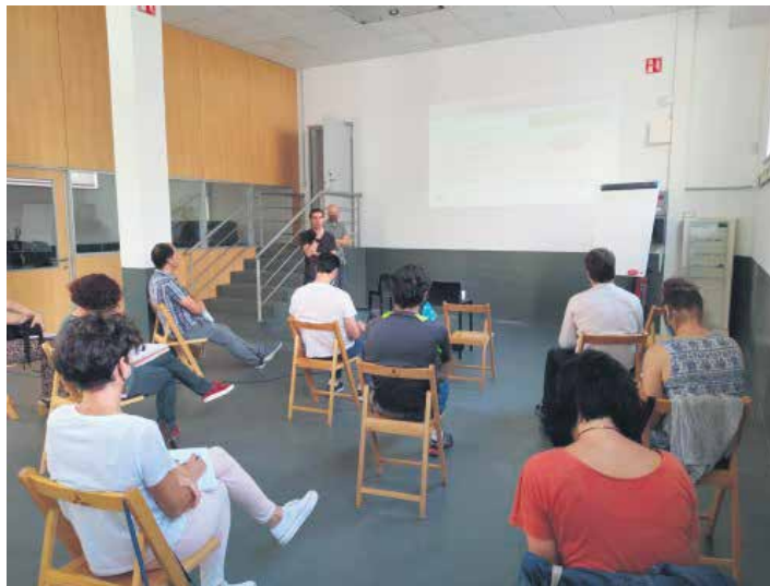
Sakanako Sozioekonomia Behatokiak Dinabiden egindako bilera. ARTXIBOA

COVID-19ak sariketaren antolazailen asmoak aldarazi ditu. Izan ere, "Sakana Sariak ospaki-