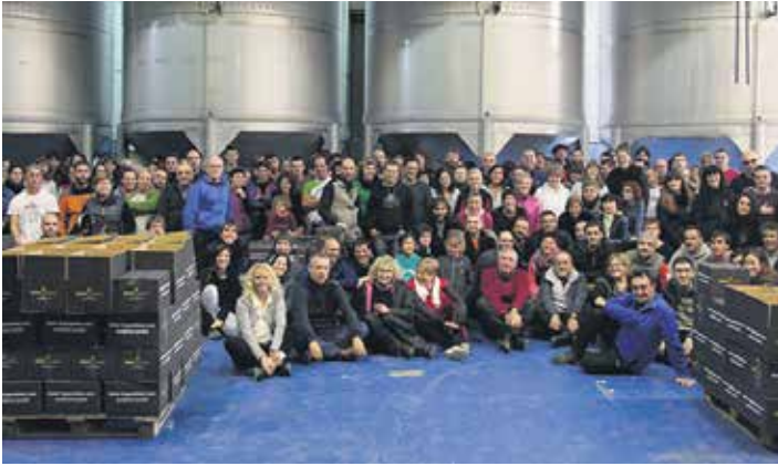
Auzolanean aurrera egiten duen ekimena da Errigora. WWW.ERRIGORA.EUS