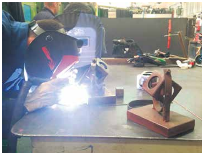
Lanbide Heziketan Nafarroako Gobernuaren hezkidetzari sariak egiten.

Mank-etik azaldu dutenez, "pornografia geure seme-alaben sexu hezitzailea izatea nahi ez badugu, bere eraginari aurre egiteko estrategia eta baliabide eraginkorrak partekatu behar-