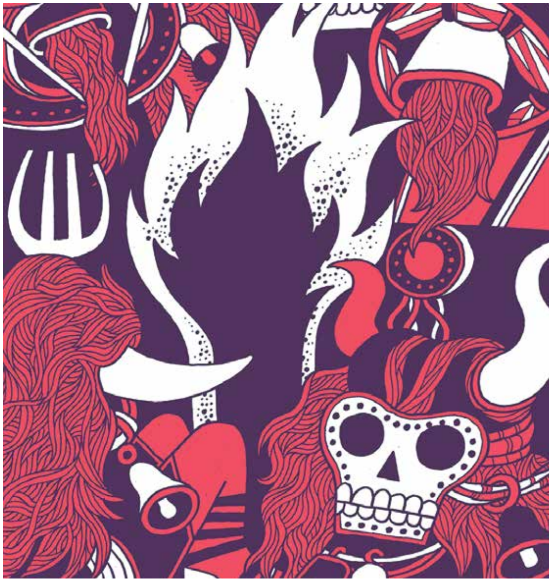
Elias Taño komikirako egindako ilustrazioa.