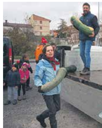
Peñakoak jatekoak biltzen.

Mojen kongregazioa lagundu nahi dutenek haien egoitzara (Iruñeko Buztintxuri auzoan, Gipuzkoa etorbidea 38.) eraman ditzakete jakiak (patatak, kuiak, kuaixoak, babarrunak, sagarrak, intxaurreak...). Bestela, diru ekarpena egiteko aukera dago. Horretarako, ES62 2100 91 61452100020177 kontu korrontean erabili daiteke. "Kontuan izanik zertara bideratzen den, ahal den neurrian, sakandarrak eskuzabalak izatera animatzen ditugu".