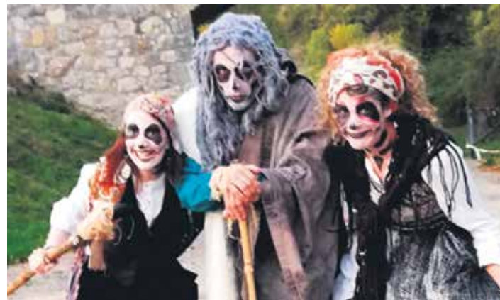
Joan den urtean egindako Ibilbide Beltzako une bat.

Enpresen kasuan sozietatezergako zerga oinarrian kenkaria izanen dute. Gainera, 300 euro ematen badituzte kuota-likidoan %30eko kenkaria izanen dute, %20koa gehiago bada. Bai pertsonak bai enpesez ES11 3008 0045 98 4071845517 kontu korrontean sartu behar dute dirua eta gai gisa "Aralarko santutegia Mezenasgoa" jarri behar dute.