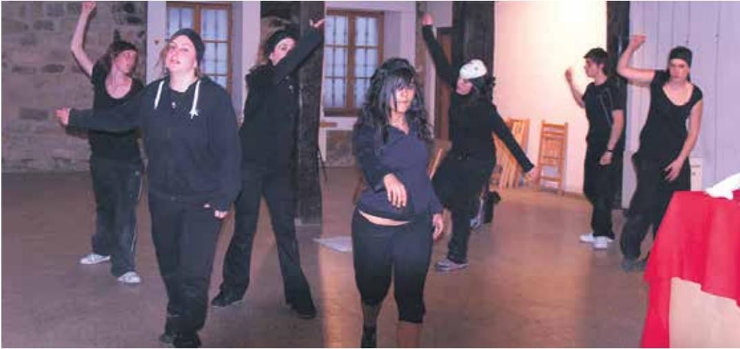
Zerbitsuak gazteendako eskaintza Gure Etxea eraikinean ematen hasi zen.