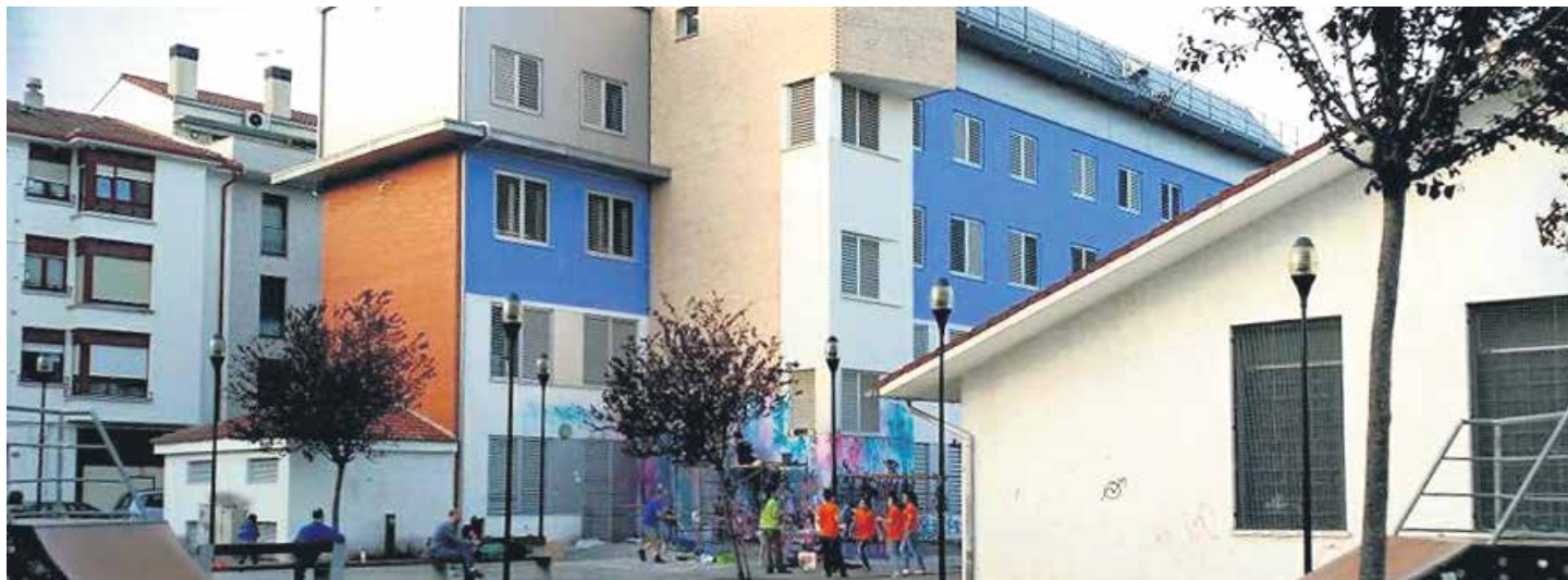
Intxostia punta gazte guneko sarrera margotu zutenekoa. UTZITAKOIA