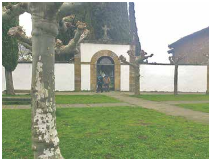
Kanpo santuak bisita ugari hartu ditu aste honetan.

Burunda pilotalekuak jarduera sailkatuari buruzko araudira egokitzeko eta, hartara, irekitzeko lizentzia lortzeko lanak eman ditu Altsasuko Udalak. Instalazio