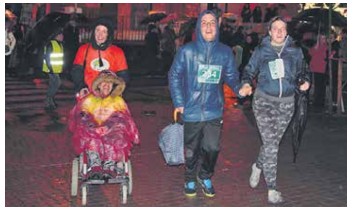
Guztien ahaleginak du saria helmugan, auzate ederra. ARGAZKIA

Osasunak 138 futbol taldeekin hitzarmenak ditu eta tartean daude Lagun Artea, Etxarri Aranatz eta Altsasu. Bestalde, talde gorritxoak gaur egun Lakuntzan eta Etxarri Aranatzan ditu futbol eskolak.