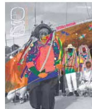
Mozorrotu zaitetz gurekin