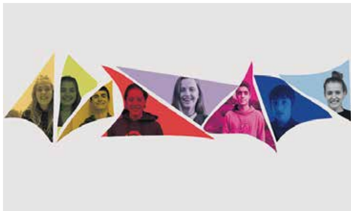
Nafarroako Eskolarteko txapelketako Etxarriko saioan parte hartuko duten bertsolariak.