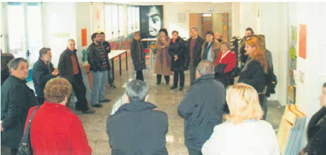
Intxostiapunta gazte gunearen aurkezpena.

Baina urteurrena urriaren 3an hasi zuten, Elektrokela elektrotxaranga altsasuarraren emanaldiarekin. Intxostiapunta gazte gunearen patioan egiteko aurreikusita zegoen, baina eguraldi txarra zela eta, bertan dagoen gimnasioan egin behar izan zuten. Erritmoarekin hasi zuten urteurrena. Urriaren 10ean escape room -a izan zen eta aurreko ostiralean bertso saioa izan zen. Izan ere, euskara sustatzea da gazteria zerbitzuaren helburuetako bat.