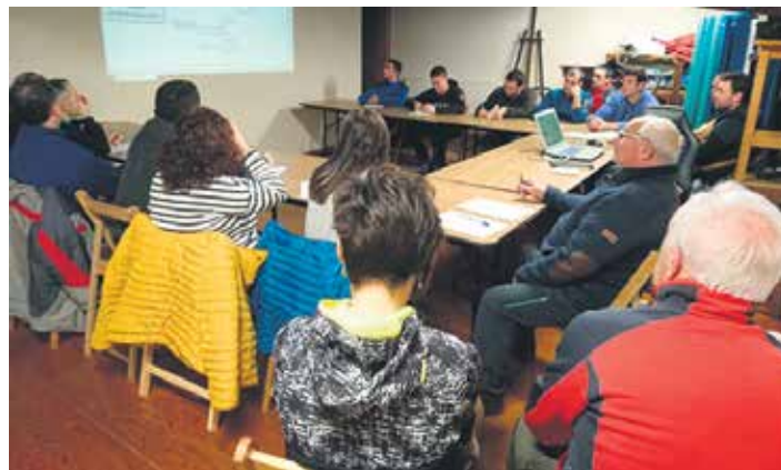
Bakaikuarrak plan estrategikoa lantzeko bileretako batean.

eta, ondorioz, industrialde inguruko eraikinen ur beltzak ere jasoko dira: Errotatxiki, Ibar-musu eta Ameztia. Bestalde, Excavaciones y Transportes Orsa SM-ak asfaltatuko du Otadiko bidea. Lanak abenduaren 15erako despedituta egon beharko du. Eta haren truke enpresak 30.578,36 euro (BEZ kanpo) jasoko ditu. Azkenik, joan den astean Alde Zaharreko argiteria publikoan bonbillak LED argiekin ordekatu zituzten. Telman SL enpresak lan horiengatik 44.599,86 euro (BEZ kanpo) jaso ditu.