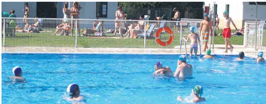
Dantzaleku igerilekuak.