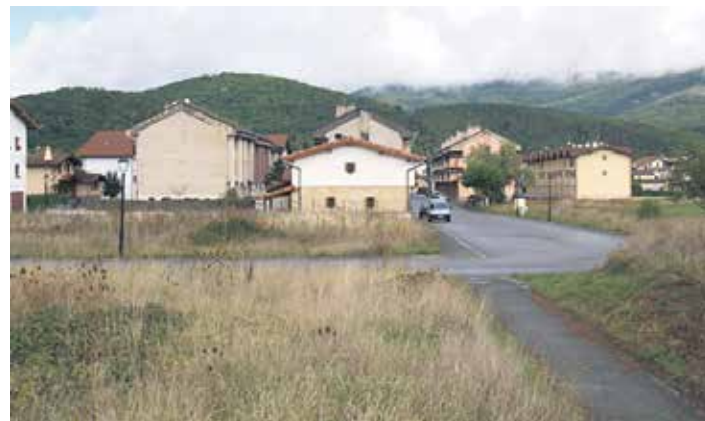
Akerruntza kalea Kattuka paretik.

Bestalde, Altsasuko Udalak bi dirulaguntza jaso ditu. Nekazaritza azpiegiturak sortu eta hobetzeko 36.730,17 euro. Horrekin eta udalak jartzen duenarekin Zezenagako itxitura egingen da eta Otadiko bidea asfaltatuko da. Horrekin batera, Altsasuko Elkarbizitza Planerako diagnostia egiteko udalak 8.000 euro jaso ditu.