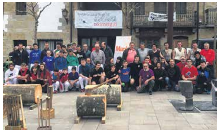
2018an Lakuntzan jokaturako Sakanako Herri Kirol Eguneko parte hartzaileak.