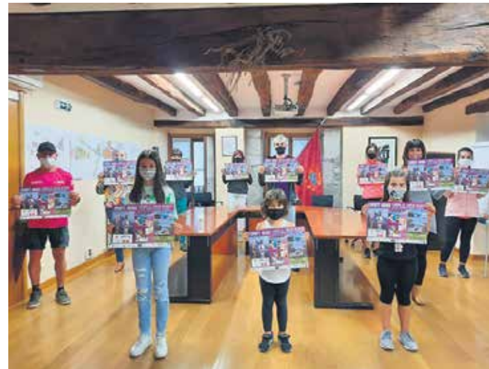
Igandean Uharteko Zumbathoian parte hartzeko deia egin dute.

COVID-19 pandemia dela eta, antolatzaileek beharrezko segurtasun neurri guztiak beteko direla ziurtatu dute. Musikari jarraiki zumba monitoreek prestatutako koreografiekin goiz ederra pasatzea izanen da hel-