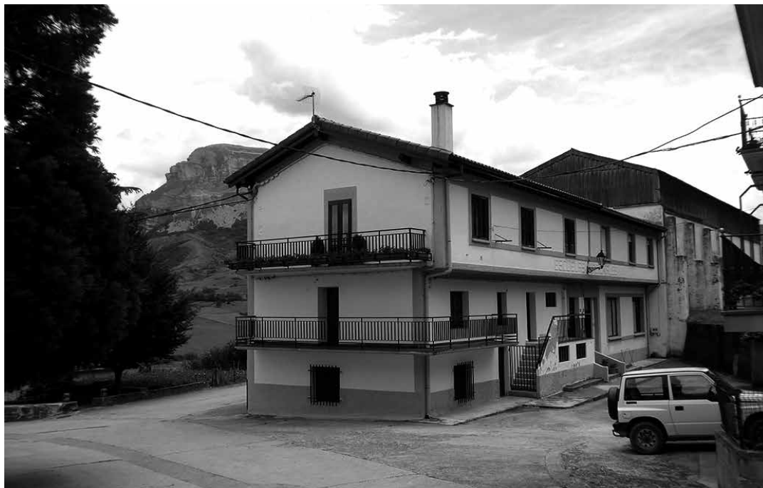
Eskola hartu zuen eraikina. Eskuinekoa Jai Alai frontoia da. Ezkerrean, kalearen beste aldean, parkea dago.