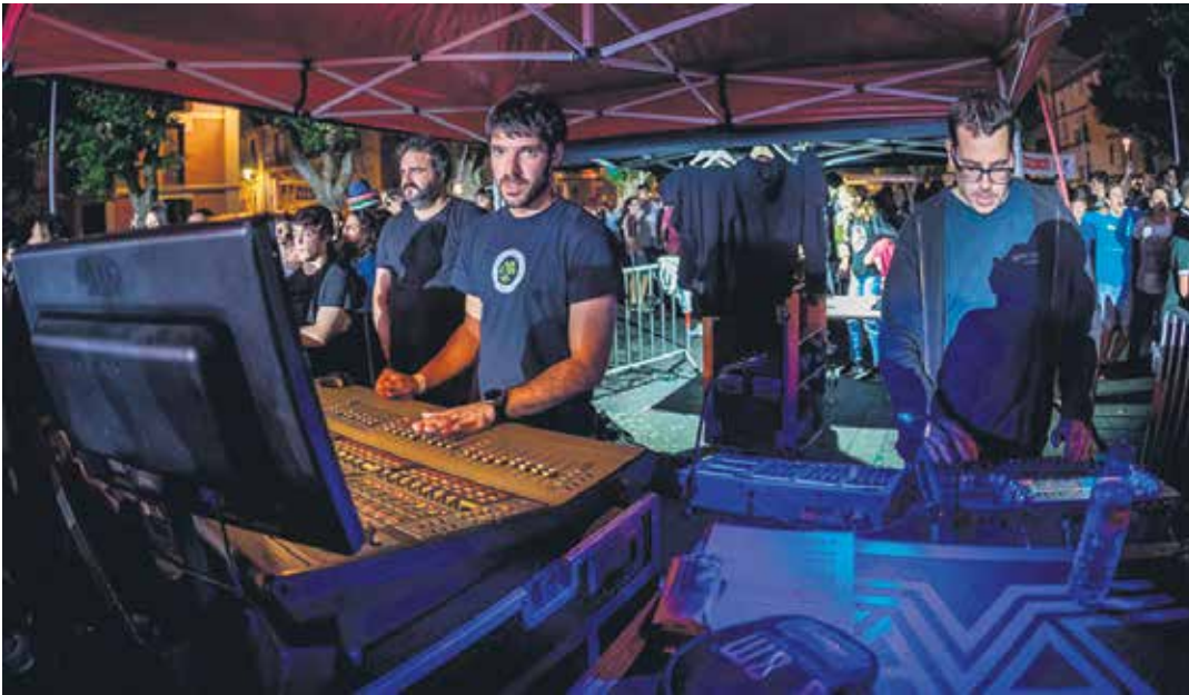
Ion Kadarso Berri Txarrak taldearen biran soinu teknikaria izan zen. UTZITAKOA