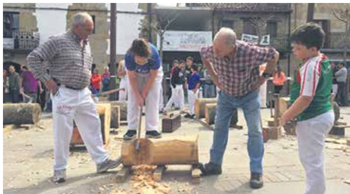
Erdoziatarak etorkizuneko aizkolariekin, Sakanako Herri Kirol Egunean.

trontzan jartzen badituzu, ahal duten guztia egiten dute, eta gustura; zaku bat jartzen badiezu, berdin; koxkolak jartzen badizkiezu, berdin... Sokatiran talde mistoak dira, nahastuta aritzen dira; berdin zaie. Hori da herri kirolek duten gauzarik hoberena" ondorioztatu zuen.