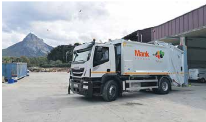
Aurki Sakanan barna ibiliko den kamioi berria.