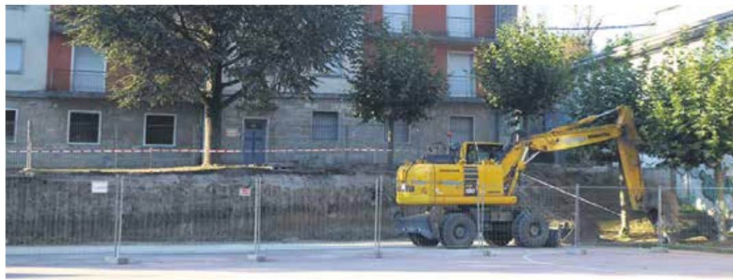
Palaz areto futboleko harmailak bota zituzten, berriak jaso ahal izateko.

Lurralde Kohesiorako Departamentuak 13,5 milioi euro ordaindu dizkie udalei aste honetan. Kopuru horren %5,72, 772.657,02 euro, Sakanako udalek jaso dute. Diru horrekin toki entitateek COVID-19ren eraginari aurre egiteko ekonomia suspertzeko neurriak hartzeko aukera izanen dute. Besteak beste finantzagarriak diren jarduerak dira energia eraginkortasunarekin, hiri-mugikortasun-jasangarriarekin, udal eraikinen egokitzapenarekin, banda zabaleko konektibitatearekin eta uraren erabilera-eraginkortasunarekin lotuta egiten dituzten inbertsioak. Heldu den urteko irailaren 30era arte egin ditzakete inbertsioak.