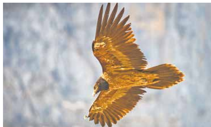
Ugatza, hegazti harraparia.

Manifestazioko deitzaileak, bestalde, kexu agertu dira foru administrazioarekin: "Maria Txibite Navascues lehendakariari eta Osasunbideko ardura dunei biltzeko eskatu genien duela sei hilabete eta oraindik ez dugu erantzunik jaso. Errespetu falta da. Errazagoa izan da Euskal Herriko pentsiodunen mugimendua Toledoko Ituneko presidentearekin biltzea hemen goordezkari politikoekin baino".