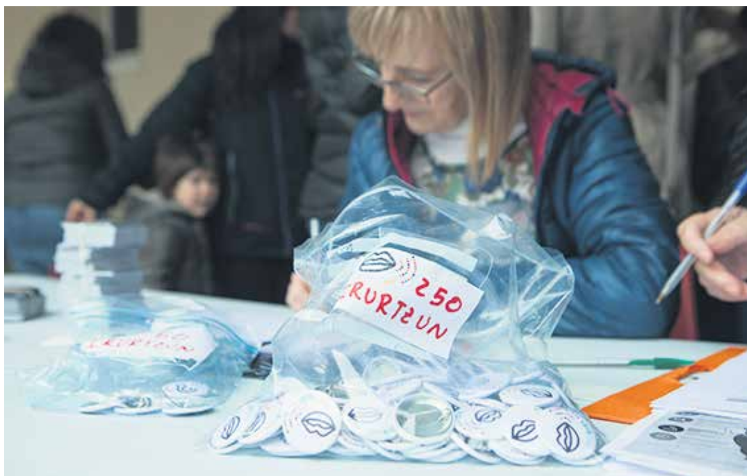
16 urtetik gorakoek eman dezakete izena. Webguneaz aparte herrietan ere izena emateko aukera izanen da.