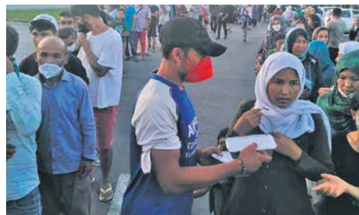
Morian jatekoa banatzen.

Bestalde, azken urtean hildako Aralarko Deun Mikel Goiaingeruaren Kofradiako, Anaitasuneko kideen eta Ongile guztiak gogoan izateko lastaileko aurreneko igandean egiten den meza ere bertan behera gelditu dela jakinarazi du kofradiak. Gaudemus abesbatza gregorianoak abestu ohi du elizkizun horretan..