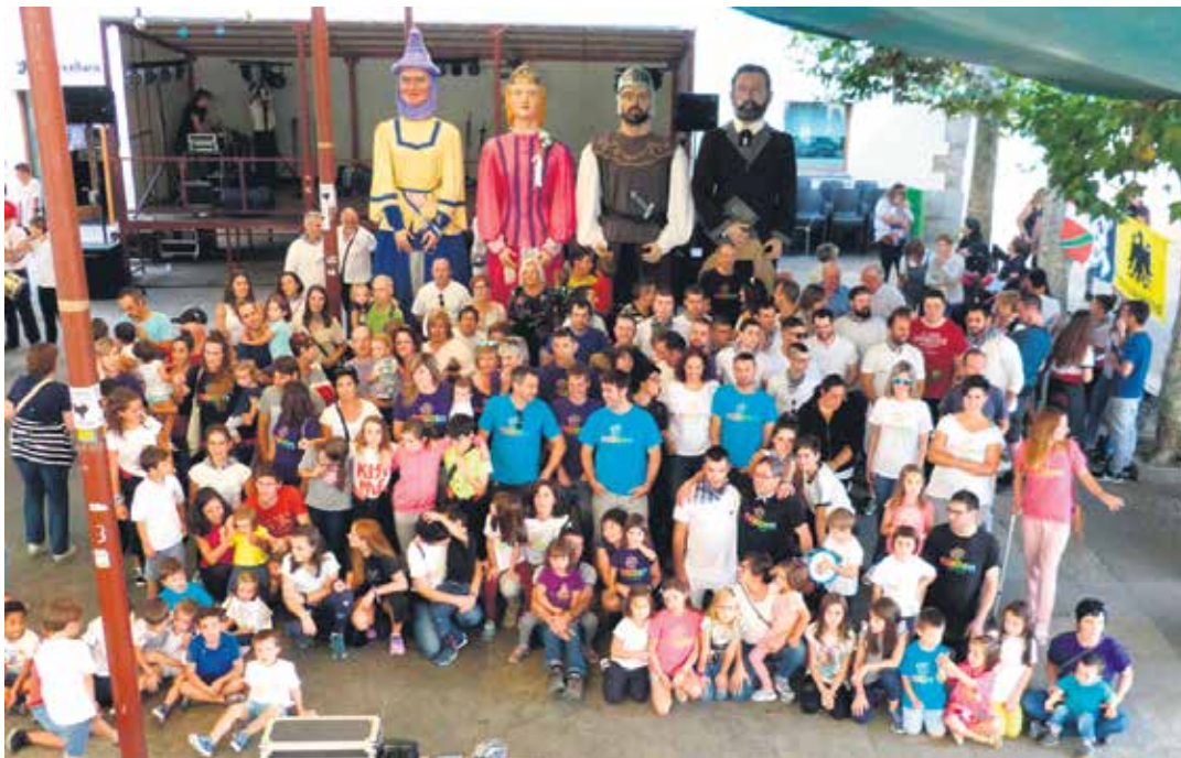
2019ko Sanmigeletako txupinazoan Naizen elkartearen aldeko herri argazkia egin zuten Uharte Arakilen. UTZITAKOIA