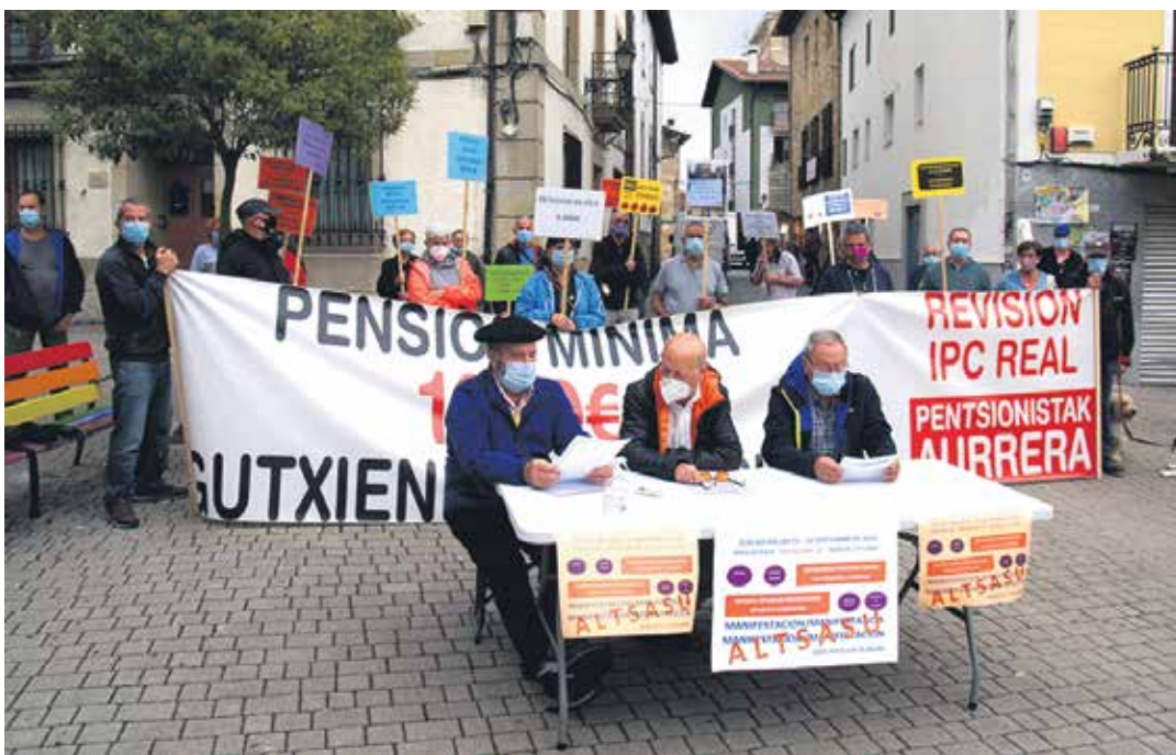
Astleheneroko pentsio duinen aldeko kontzentrazioa baliatu zuten manifestazioa aurkezteko.