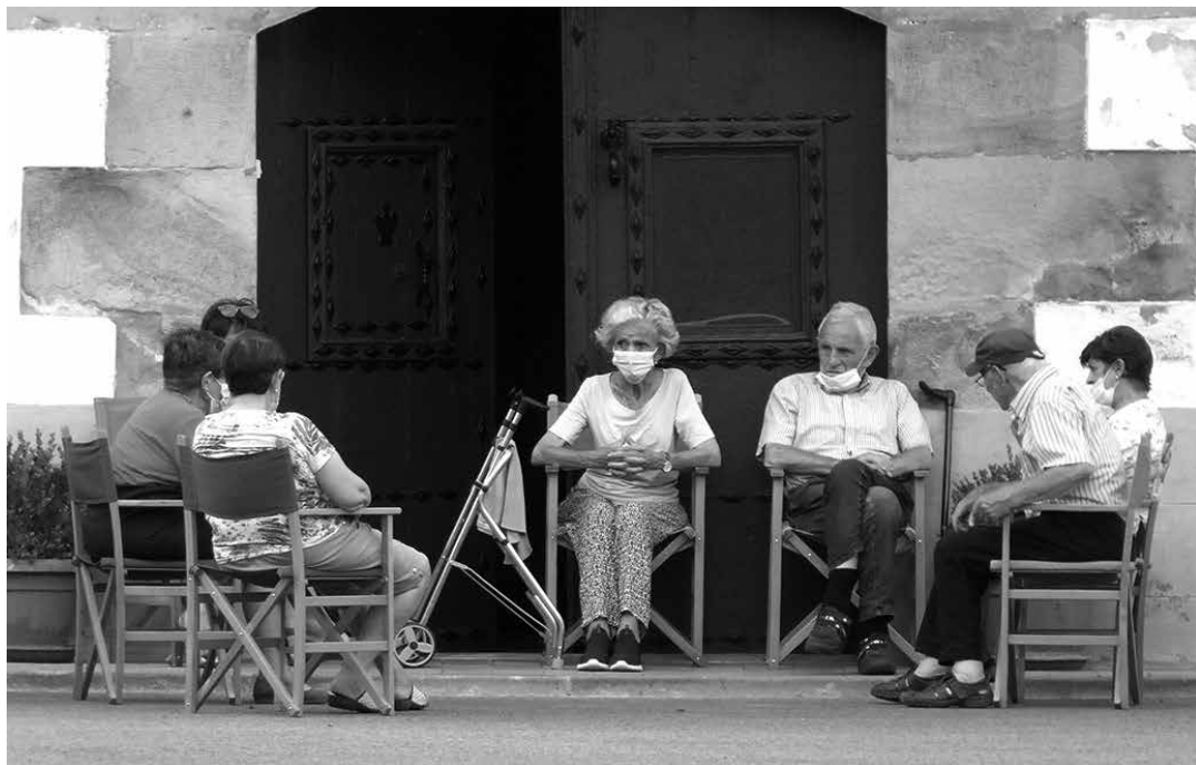
Arbazarrek eteko atean hizketan udako arratsalde batean.