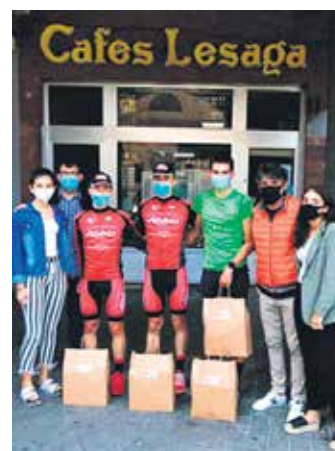
Lizarrako juniorren podiuma.