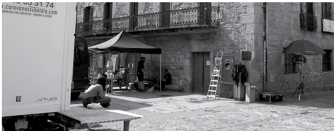
Asteartean hilerrian egon ziren filmatzen. Kanpoko aldean figuranteak zain egon ziren.