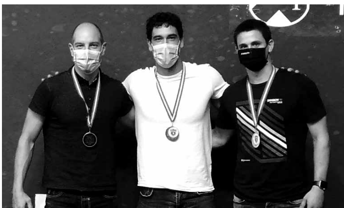
Ongay, Bergera eta Retegi Bi, txapelkunordeen dominekin. UTZITAKOA