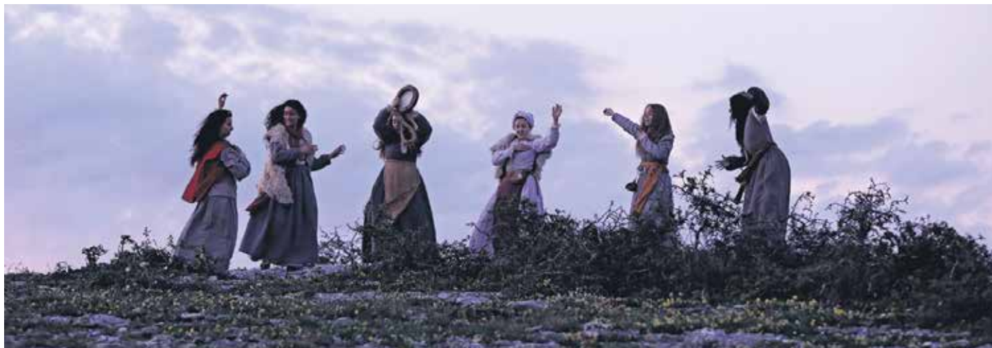
Akelarre filmaren hainbat eszena Urbasan grabatu zituzten. DAVID HERNANZ

"GAIA UNIBERTSALA DA; SORGIN EHIZAK EUROPA OSOAN EGON ZIREN XVII. MENDEAN"