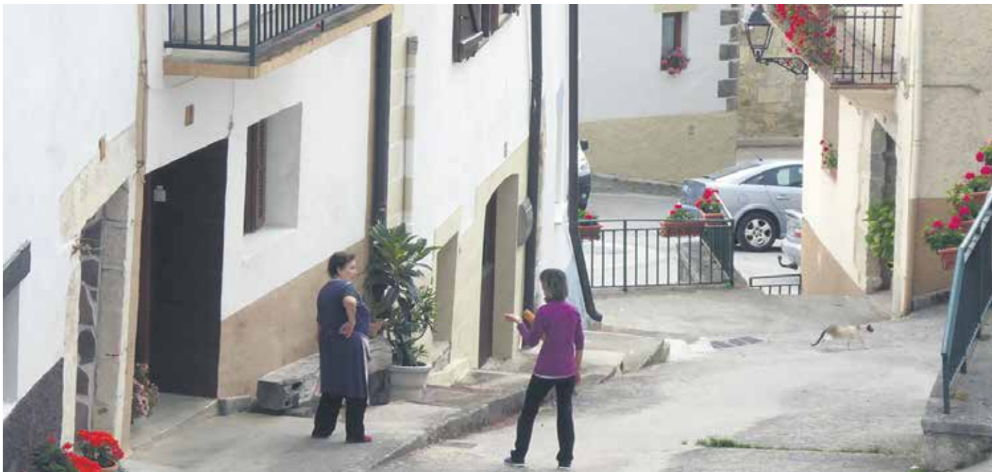
Bi lizarratar kalean hizketan.