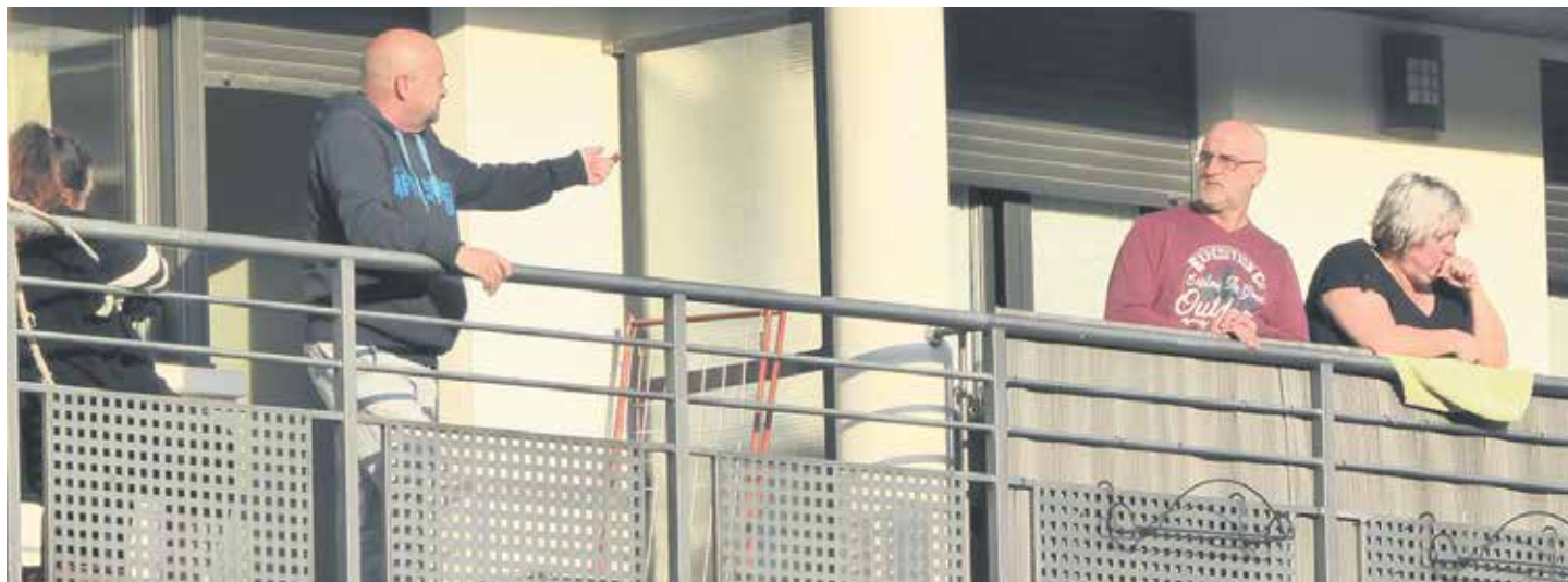
Herri eta auzo bakoitzean ekimen desberdinak izaten dira: emanaldiak, ekitaldiak, musika baffleatik....