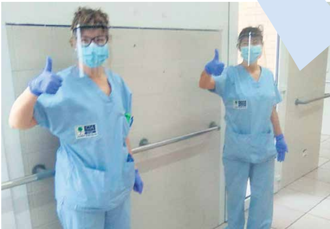
Josefina Arregi Klinikako langileak Sakanan egindako aurpegi-babesgarriekin.