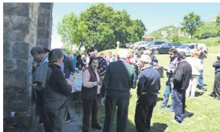
Arakildarrak San Isidro egunez Itxasperi ermitan elkartzen dira.

Fernandezen arabera, "ezohiko egoerak ikaskuntza gisa balio dezakete airearen kalitate txarrak urtero eragiten dituen milaka heriotzak murrizteko. Argi baitago trafikorik gabeko egun batzuk nahikoa direla atmosfera garbitzeko". Horregatik, "pertsonek osasuna arriskuan jartzen bada, neurri sendoak hartzeko ez genuke zalantzarik izan behar". Administrazioei eskatu die ondoren ondorioak azter ditzatela.