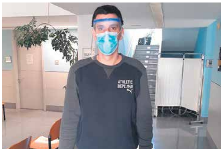
Etxarri Aranazko Osasun Etxeko langile bat babesgarriekin.

Momentuz Sakanako bi enpresa gehitu dira ekimenera, Urdiaingo Magotteaux eta Lakuntzako Lamapor.