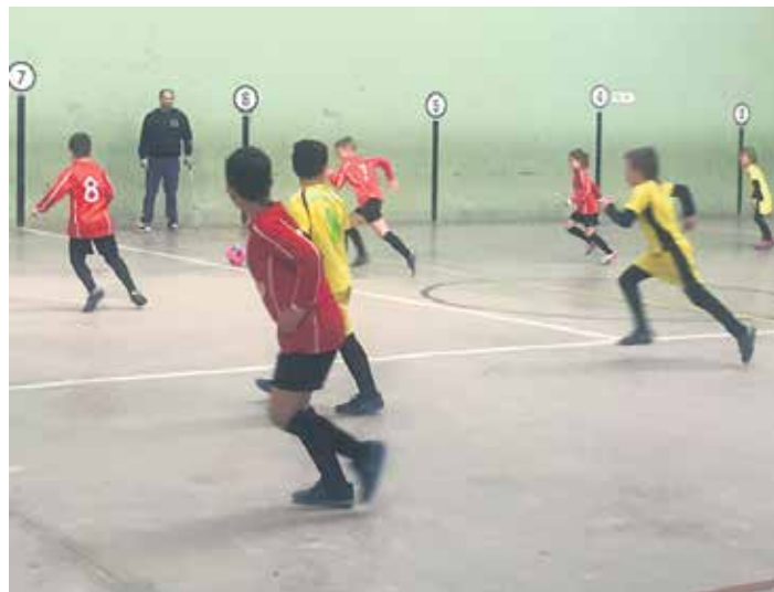
Sakanako Futbol Topaketetako partida bat. Momentuz, bertan behera gelditu dira.