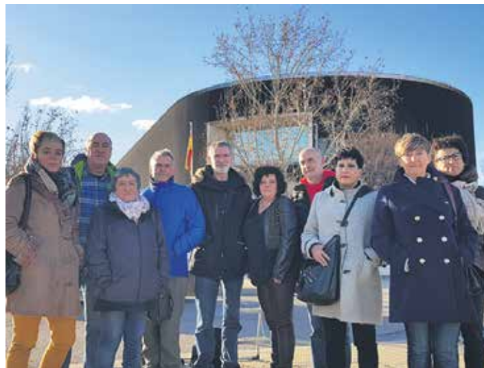
Gurasoetako batzuk Espainiako Auzitegi Nazionalaren parean.

Gainera, azpiegitura egonda. Ez dakit guztiendako adina azpiegitura egonen den, baina, nolabait, astean behineko bideo-konferentzia bat-edo posible izanen balitz gauza ederra litzateke haiendako, familia edo lagunendako. Harremana mantentzeko modu bakarra kabina batetik, pagatuta, egindako telefono deiak dira, ezta? Gainera, garesti xamar izaten da. Aurtengo berria izan da lehen bost minutuko deiak zirela eta orain zortzi minutura luzatu dutela. Oker ez banaiz hamar dei dituzte. Eta gero kartak. Baina posta zerbitzuan ere murrizketak