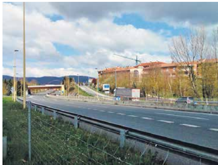
Iparaldeko Autobia (A-1) ia hutsik Altsasu parean.

Altsasuko airearen kalitatea neurtzeko estazioak neurtzen dituen beste sustantziatan ez da