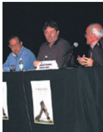
Aurkezpenean 108 pertsona izan ziren.

Ikerlariak dokumentazioaren garrantzia nabarmendu zuen. Eta herrien arteko mugarritatze dokumentuak aipatuta, toki-izen asko galdu direla gaztigatu zuen.