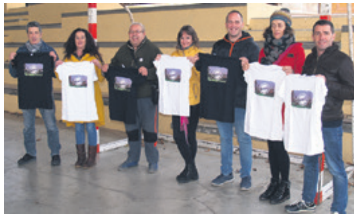
Elkartasun topaketa Iturmendiko frontoian izanen da. Goian antolatzaileak.