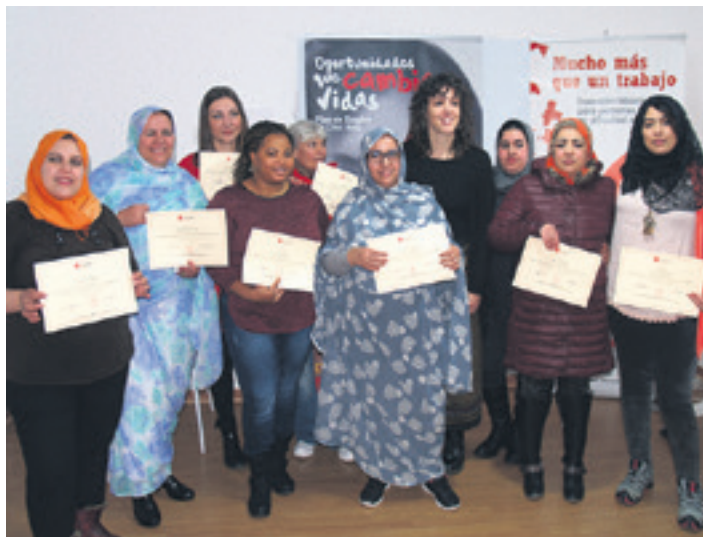
Ikastaroko parte-hartzaileak eta arduraduna.

Oulalitek ere hitz hartu zuen eta adierazi zuenez, "lehen ez genekizkienak dakizkigu orain, eta egunerokoan eta lana opatzerakoan baliagarriak izanen zaizkigu. Gainera, jende zoragarria