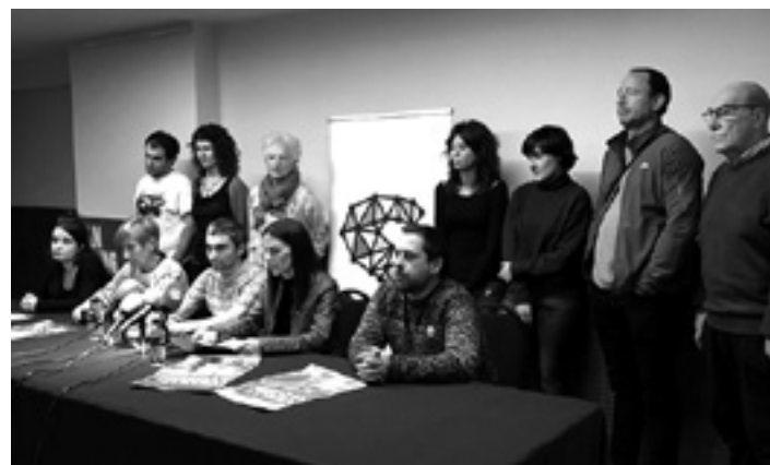
Sareko kideak Iruñeko manifestazioa aurkeztu zuteneko.

Bi eragileek esan dutenez, "egokitu zaigun bide luze honetan zehar, batzuetan zurrumurruek edota bestetan nolana hiko informazioak ez dira batere lagungarriak izan Altsasuko gazteen askatasuna lortzeko eta lege bidegabekeria hau geldiarazteko". Eta "halako bidegabekeriarik ez Altsasun ez beste inon berriz gerta ez dadin lanean jarraitzeko konpromisoa" berretsi dute.