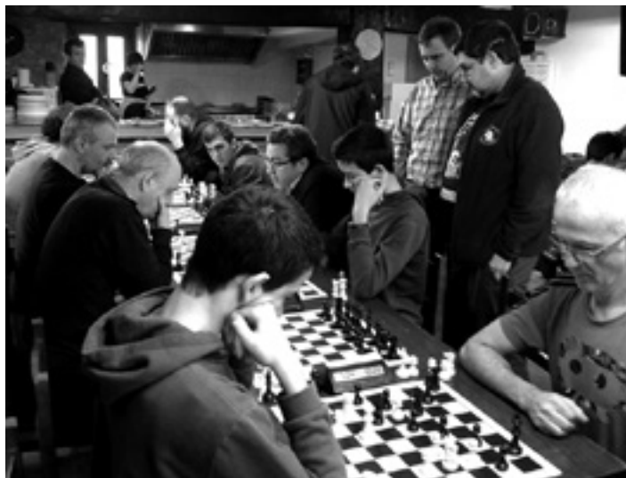
Joan den urtean Satrustegin jokatu zen txapelketa.

Proba antolatzeko, Sakanako Zaldi Beltza Xake taldearen, Nafarroako Gobernuaren eta Ziordiko Udalaren eta elkartearen laguntza izan du Mank-ek. Ziordiko Errekakartea elkarteak hartuko du aipatu txapelketa, bihar, abenduaren 21a, larunbata, goizeko 10:00etatik aurrera.