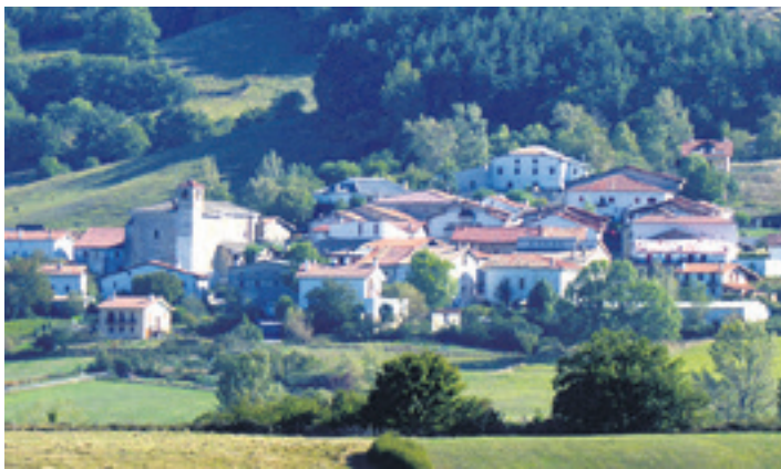
Unanuko ikuspegia Lizarraga sarreratik.