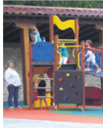
Haurrak jolas parke berrian. ARTXIBOA

Agorrilaz geroztik erabilgarri dago Ziordiko haurrendako jolas parke berria, elizaren ondoan dagoena. Udaleko langilea ardu-