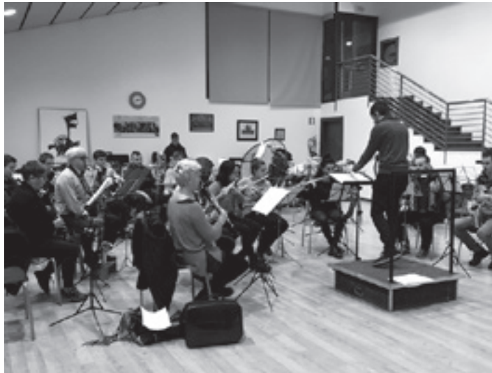
Haize Berriak banda entsegu batean.

Bandak interpretatzen dituen abesti guztiak Ezeolazak kanta-