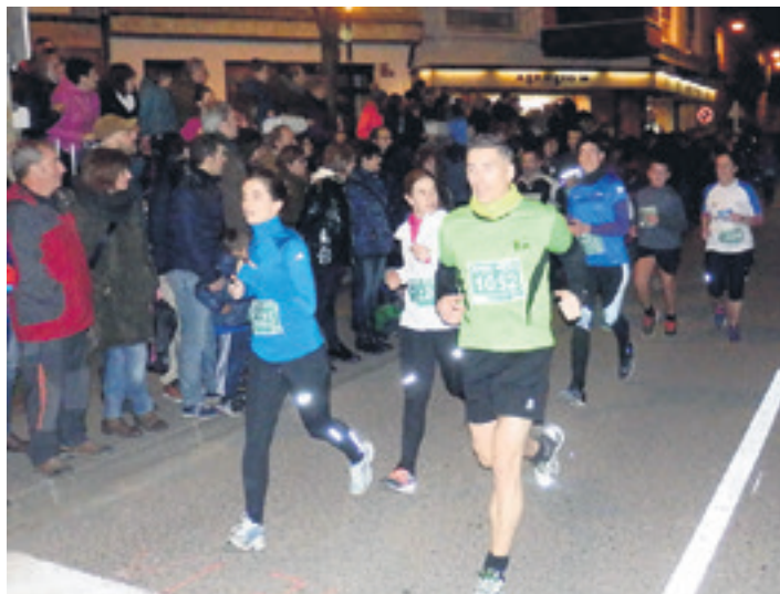
Altsasuko San Silvestrean giro bikaina izaten da.

Abenduaren 31n zapatilak jantzi eta 2019. urtea korrika despeditzera gonbidatu gaituzte Altsasan, Olaztin, Irurtzunen eta Uhartre Arakilen. San Silvestreak probarik herrikoiak eta kuttunenak dira korrikalariendako, urteari agur esateko modu polita. Sakanan lau lasterketa izango dira: Nafarroako proba zaharrena den Altsasuko San Silvestreak 41. edizioa beteko du, Olaztiko San Silvestreak, aldiz, 18. edizioa izanen du, eta III. Pikubestre lasterketa antolatu du Irurtzunen Pikuxarrek. Horretaz gain, Uhartre Arakilen II. San Silvestre Traila antolatu dute.