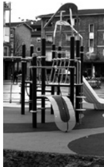
Zumalakarregi plaza berritua.

"Udalak han bizi diren auzokideekin laguntzarekin batera egindako zolatze lanen ondoren, Zabala, eta ederra gelditu da gure <txokoko> Tomas Zumalakarregi plaza". Hala idatzi zuen Belarrak Diario de Navarran 1970eko garagarrilaren 7an. Urte hartako ilbeltzaren 5ean argitaratu-