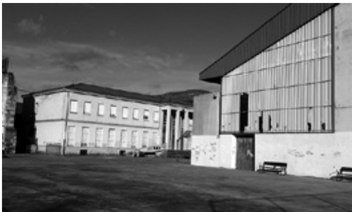
Eskola ezkerrean eta frontoia eskuinean, konpondu beharrekoak agerian dituela.