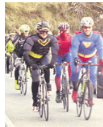
Batzuk mozarrotuta igo ziren iaz.

Izena ematea egunean bertan egin beharko da, Uhartre Arakilgo igerilekuetako tabernan, 15:30etik aurrera. Kategoriaz txikiak dohain dute parte-hartzea eta kadeteak eta helduek, aldiz, 2 euro ordaindu beharko dituzte. Lasterketaren ondoren auzatea eta txikiendako txokolate-jana izanen dira