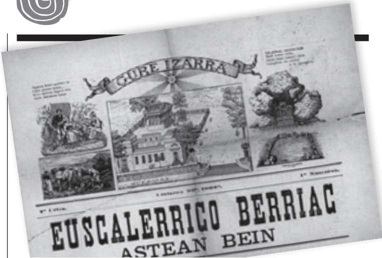
Gure Izarraren 1888ko urriaren 30eko astekaria.