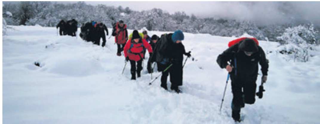
Mendizale sakandarrak Aralarko santutegira bidean, duela bi urteko Mendigoizale Egunean.