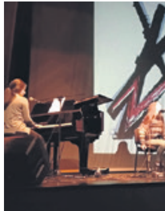
Musikak tartea izan zuen aurkezpenean.

razpena onartu du. Lehenik, herritarrek deitutako mobilizazioetan parte hartzera gonbidatu ditu (bihar, 20:00etan, plazan). Horrekin batera, udalak dispertsio politikaren eta urruntzearen berehalako desaktibazioa eskatu du, senideak kaltetu eta oinaze a eransten baitie. Gogoratu du, gainera, presoak bisitatzera egindako joan-etorrietan 16 senide hil direla trafiko ezbeharretan. Azkenik, udalak pertsona guztiak Giza Eskubideen errespetua exijitu du.