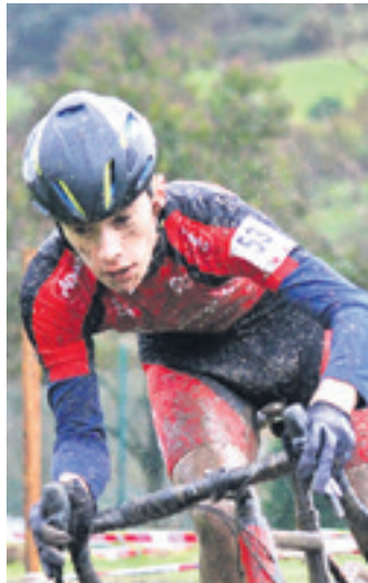
Uncilla ikusgarri aritu zen. @ERIZFRILE

Beasainen Uncilla ere txapeldun Hurrengo egunean V. Beasaingo Ziklo-Kros Sari Nagusia zegoen jokoan. 2,6 km-ko zirkuituari 6