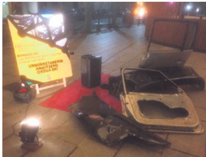
Presoen urrunketak eragiten dituzten istripuak salatzeke instalazioa.