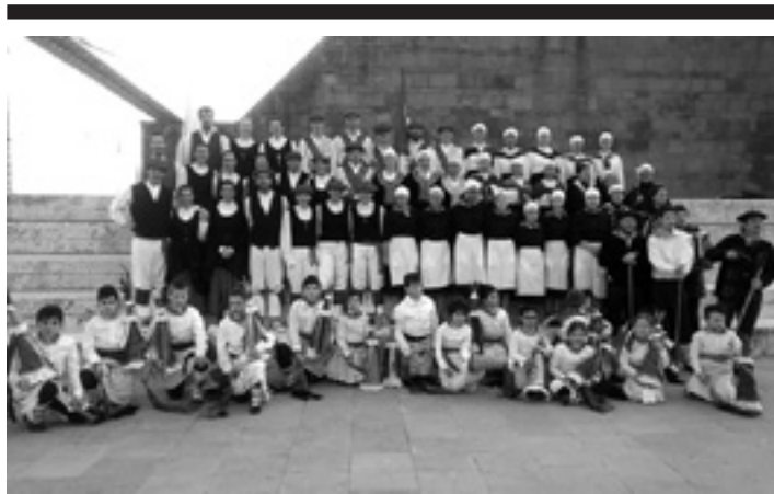
Orritz dantza taldea. UTZITAKOA