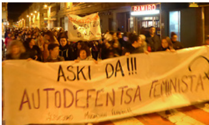
Estreinakoz manifestazioa egin zen azaroaren 25arekin.