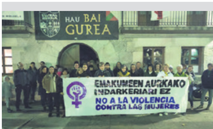
Uhartearrak emakumezkoen kontrako indarkeriaren aurka.

Asteleheneko manifestazioaren akaberan Altsasuko mugimendu feministako bozeramaileek "jendarte feminista lortzeko hezkuntzan eta profesionalen prestakuntzan inbertitzea" beharrezko jo zuten. Azkenik, dei bat luzatu zuten: "indarkeria jasaten dugun emakumezkoak doako, kalitatezko eta unibertsala den laguntza sozial, psikologiko eta legala behar dugu, salaketa judiziala jarri edo ez".