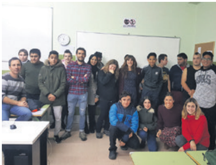
LHko irakasleak Belardiko eta garapen agentziako ordezkariekin. SGA

Ikasleendako oso proiektu hezigarria da. Baina guri aukera