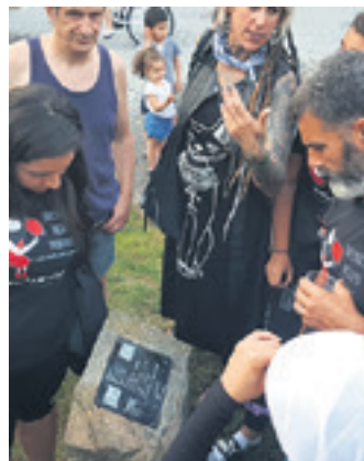
Palestinarrak Altsasun izan ziren udan.

eskuratu ditu 1.800 milioi euroren truke. Lantegiko enpresa batzordea kontratu horren kontra dago: "Palestinako lurretan legez kanpo eraikitako Israelgo koloniak lotzeko erabiliko da tranbia. Agintariak okupazio hori legez kotu eta iraunkortu nahi dute, biztanleei normalizatutako azpiegiturak eskainita. CAF ez da trenbide sistema huts baten hornitzailea izango: Palestinako herriaren aurkako politiken alderdi aktibo eta protagonista ere izango da".