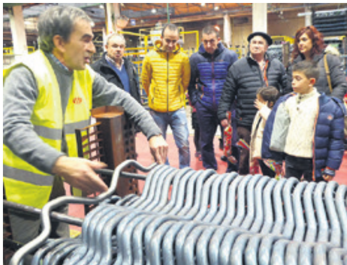
170 langilek 3.800.000 egonkortze-barra egin zituzten 2018an.