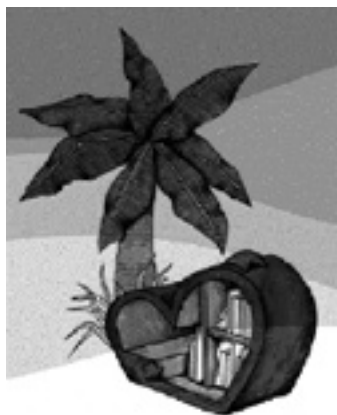
Itsaspeko bihotzak-ek ilustrazioa.

Galtzagorri elkarteak sortu du Itsaspeko bihotzak egitasmoa,