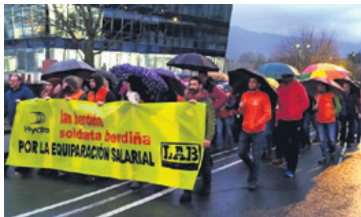
Langileak manifestazioan, lantegi parean. UZTITAKOA