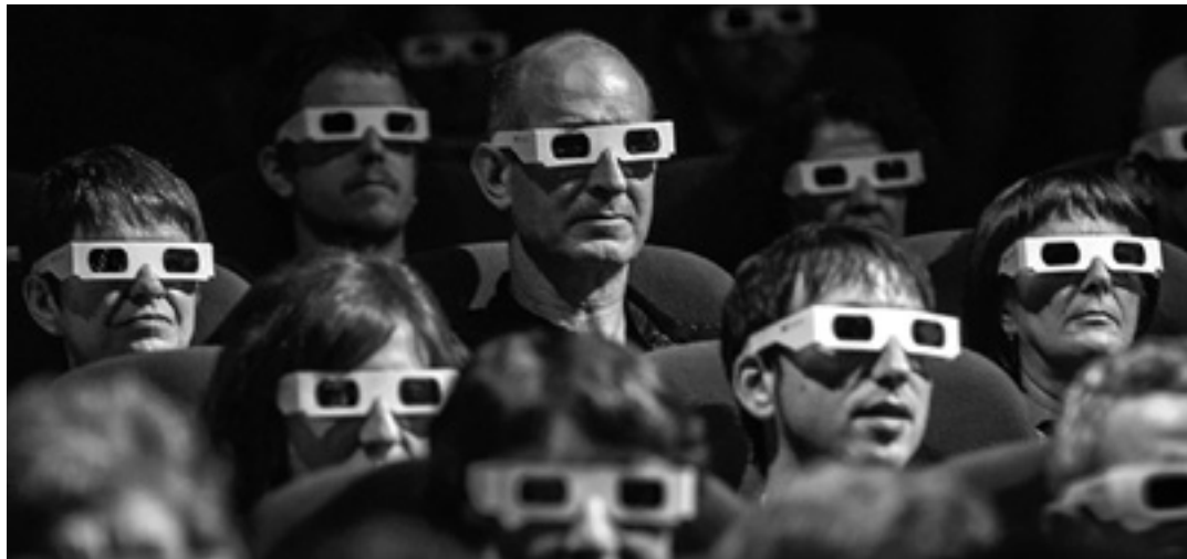
Ikor Kotx argazkilariaren irudi bat. IORTIA KULTUR GUNEA