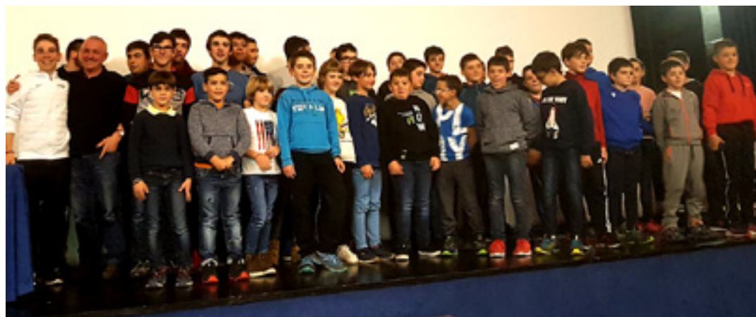
BURUNDA TXIRRINDULARITZA TALDEA

Barricarte Memorialak 2019ko Sakanako Atletismo Kopa-Lasa Kirolak Saria erabakiko du, puntuagarria den azken proba delako, Ziordiko VI. Herri Krosa, XVI. Aitzkotzar Herri Krosa, Ergoienako XVI. Bira eta Sakanako XIX. Herri Lasterketa eta gero. Hortaz, Altsasuko asterketaren ondoren jakingo da nortzuk diren Kopako irabazleak.