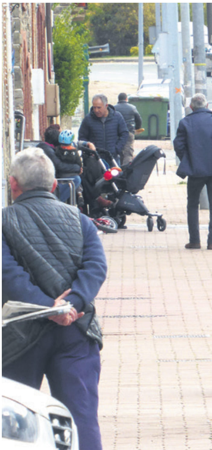
Jendea Irurtzungo San Martin kalean.

Euskadin komunitatea sortzearen inguruko proiektua landuko dute. "Zein garrantzitsua den pertsona asko bizi ez diren toki batean bertan dagoen apaiza, dendaria, tabernaria, botikaria edo dena delakoa. Ez da soilik zerbitzua ematen duen pertsona. Berak herria ezagutzen du, egunero jendearekin dago, badaki pertsona bat hiru egunetan ez bada azaldu agian zerbait pasa zaiola, pertsona batek lehengo gaitasunak ez dituela, lehengo higie ne bera, erlazionatzeko arazoak ditu... Berari pautu batzuk emanez gero, eta jasotzen duen informazioa nola iragazi dezakeen erraztuz gero, gizarte zerbitzuetatik joaterakoan teknikariari izugarritzko laguntza emanen lioke".