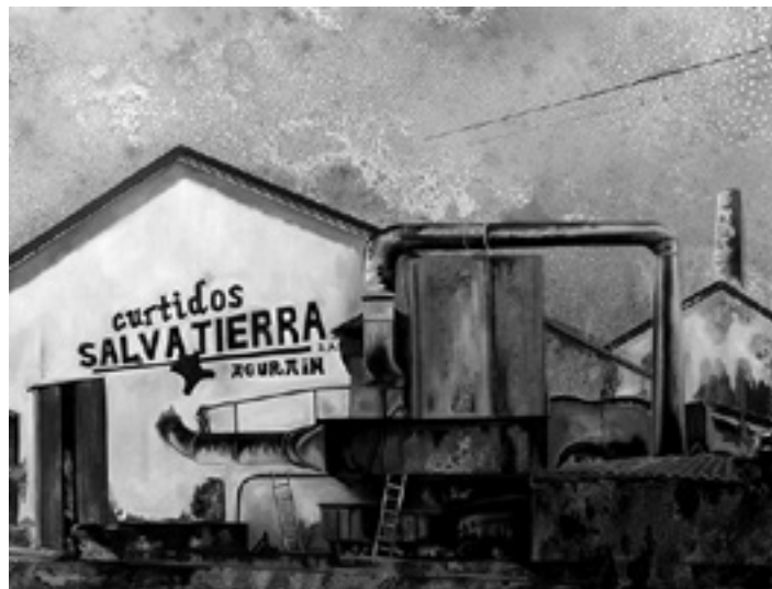
Agurainen zegoen Curtidos Salvatierra lantegiaren interpretazioa.

Lantegien margoak egiteko ikerketa handia egin du altsasuarrak. Izan ere, lantegietara joan da, bertako argazkiak egin ditu, "batzuetan ere itzuli behar