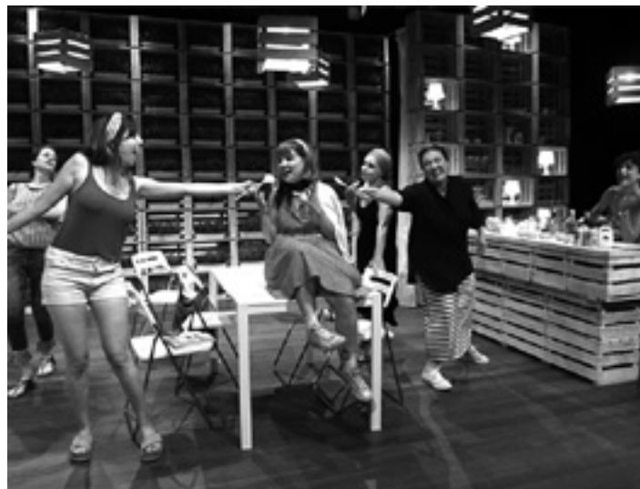
'Erlauntza' antzezlanaren protagonista. UTZITAKOIA

Bai. Kuadrillan ikusteko oso antzezlan polita da. Jendea iden-