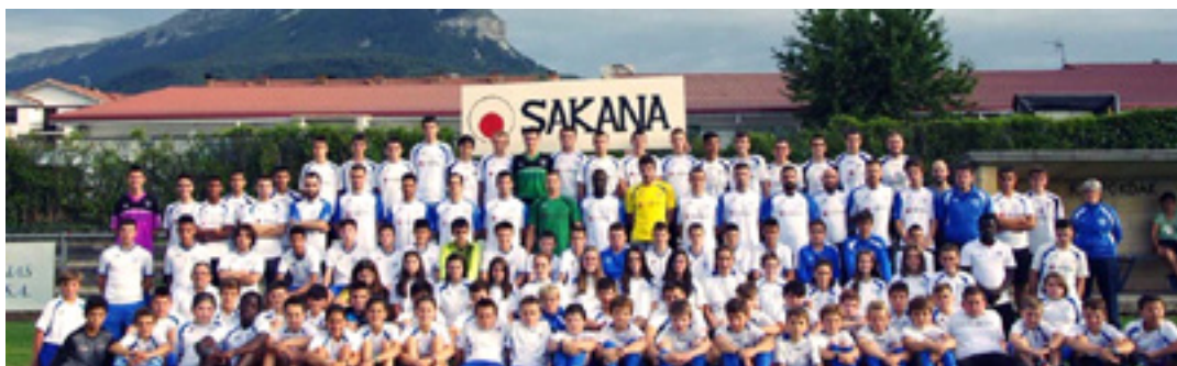
Lagun Arteak klubeko talde guztietako futbolariak elkarrekin, Zelai Berrin. LAGUN ARTEA

Kimuen eta haurren mailan batera lehiatzen dira neskek eta mutilak, baina kadete mailatik gora mutilak eta neskek banatu egiten dira. Horrela, haurren