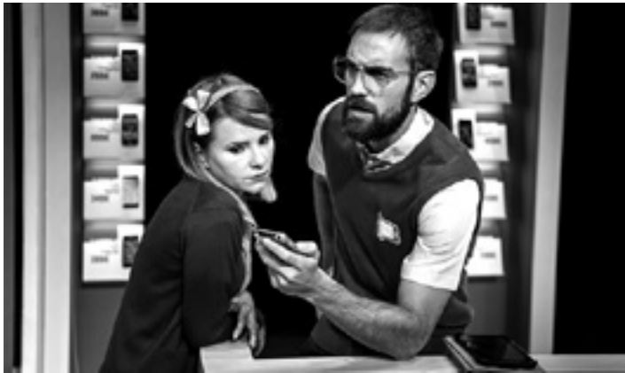
'Losers. Galtzaileak' antzezlaren une bat. TXALO PRODUKZIOAK