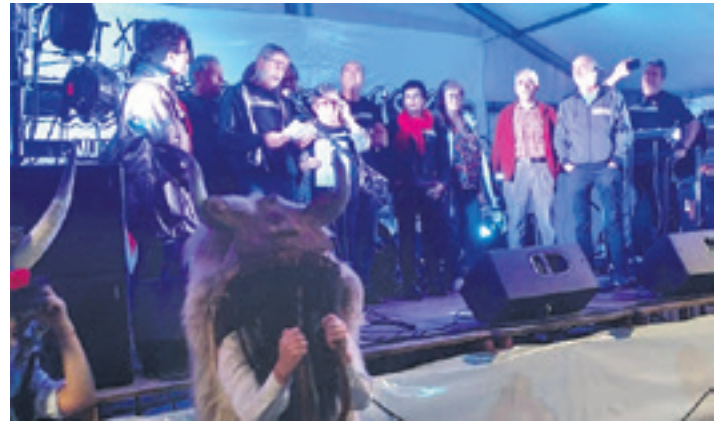
Altsasu Gurasoak taldeko kideak hitza hartu zutenekoa.