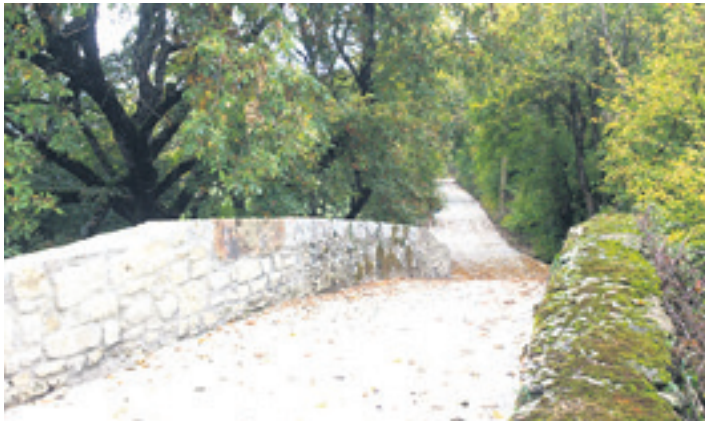
Izurdiagako zubia. ARTXIBOA