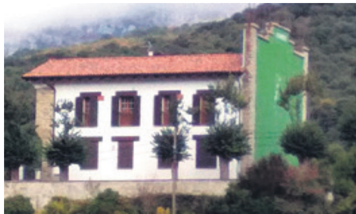
Errozko kontzeju etxea berrikuntza lanak egin eta gero.

Garagartzaroaren 6tik 7ra ezohiko haizeteak izan zirela (Migel erauntsia) ziurtatu du AEMETek. Partzuergoak jakinarazi du Uharthe Arakil kaltetutako udalerrien zerrendan sartu duela. Beraz, haizeteak eragindako kalteen ondorioak pagatuko ditu.