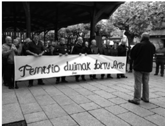
Pentsio duinen aldeko aldarrikapena Etxarri Aranazko azokara eraman zuten.

Hego Euskal Herriko Pentsiodunen Mugimenduk "bukatzat" jo zuen "promesen garaia" eta mobilizazio orokorrera deitu du. Aitortu dute bi urteko mobilizazioei esker "aldarrikapen apur batzuk lortu genituen, baina ez dira finkatu, hori oztopatzen du-