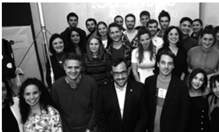
Nafarroako 'Encuentros de Arte Joven' programaren saridunak. NAFARROAKO GOBERNUA