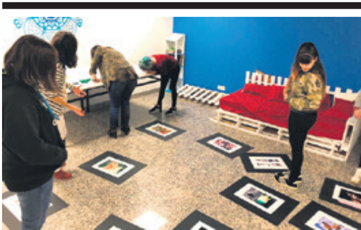
Intxostiapunta gaztegunean egindako zentzumen ibilbidea. GOZAMENEZ