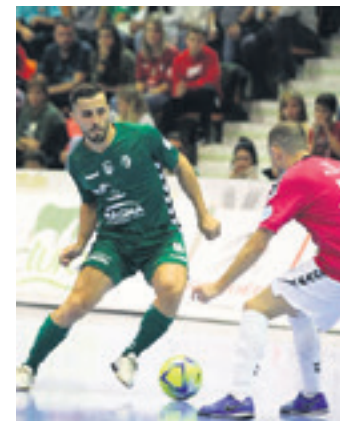
Galtzetik dator Osasuna Magna. XOTA

Emakumezkoetan, Nafarroako Kadeteen 2. mailako 5. multzoan asteburuan ez zen partidarik jokatuko. CBASK da lider sailkapenean (4 puntu) eta bihar, larunbatean, Iruñean jokatuko du Cantolagua A taldearen kontra, 9:15ean, Iribarren Kiroldegian.