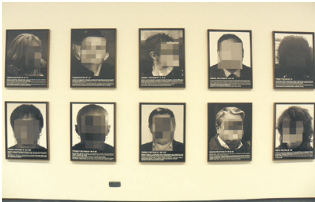
Preso Politikoak Espainia Garaikidean erakusketaren zati bat Altsasuko Iortia kultur gunean.