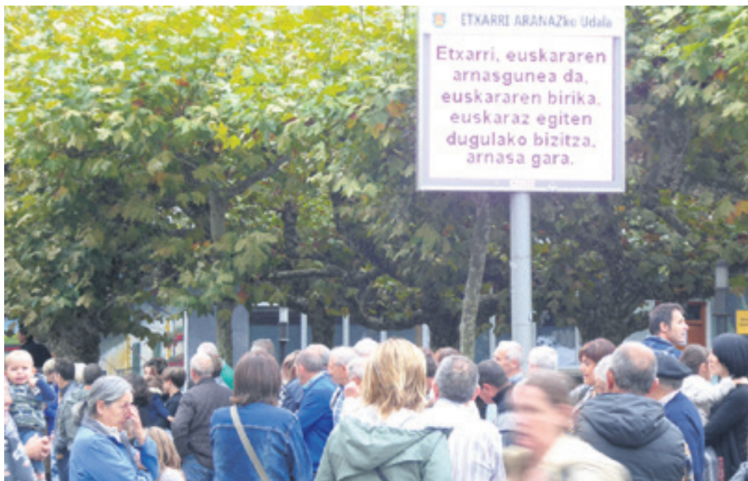
Etxarri Aranazko ferietan jendetza elkartu zen lasterkan ari zirenei animatzeko.