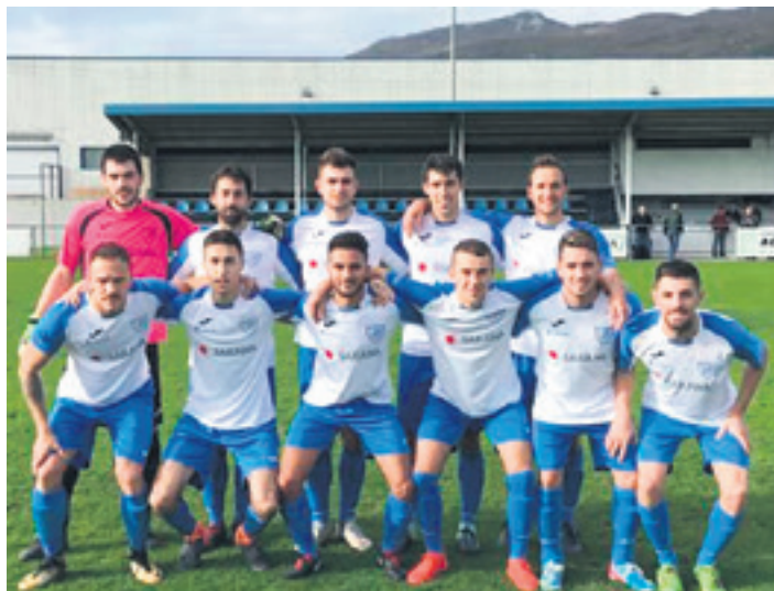
Lagun Artearen igandeko alineazioa, Ardoiren kontra. LAGUN ARTEA