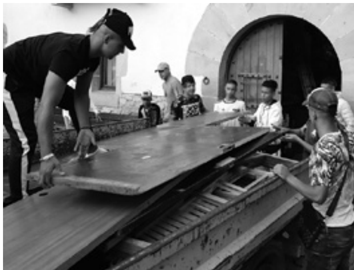
Bakarrak dauden adingabeak mahaiak eta aulkiak mugitzen Iturmendin. NG

Gauza da 12 eta 17 urte bitarteko nerabeek migratzen dutenean batzuetan dolua pasa behar dutela. Gehienetan Sei elkartean harreraren hartzen ditugu berriz elkartzen ari diren nerabeak. Hau da kasu orokorra: amak Bolivian ume bat izan zuen oso gaztetan, umea izanda ezer ez zeukala ikusi eta bere amari esaten dio Espainia aldera noa, han lan eginen dut, dirua egin eta nire umearekin bizitzeko etxea eginen dut. Urteak pasatzen dira eta 12-15 urte ondoren ekartzan du han utzi zuen semea edo alaba. Jakina, seme-alaba horiendako bere ama amona, izeba