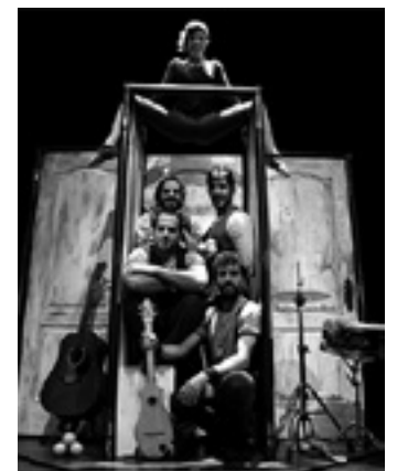
La Trocola Circo konpainia. UTZITAKOIA

Emportats ikuskizuna izanen da igandean, 17:00etan, Iortia kultur gunean. La Trocola Circo konpainiaren familiarterko ikuskizun bat da eta hainbat diziplina bateratzen ditu: malabareak, objektuekin egindako lanak eta zuzeneko musika. Umorez eta energiaz beteriko ikuskizuna da eta zehaztasunaren mugak gainditzen ditu.