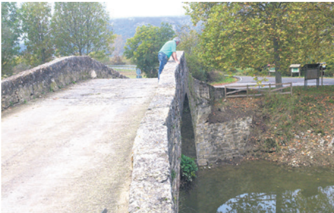
Gizona zubian egindako konponketari begira.