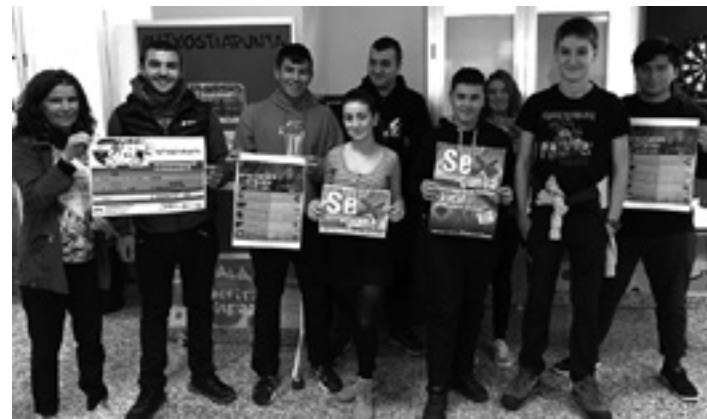
Ikasturte honetako zortzi berriemaileak. INTXOSTIAPUNTA GAZTE GUNEA

Intxostiapuntaren eta ikasleen arteko zubi-lana egiteaz zortzi neska-mutil arduratuko dira ikasturte honetan, bina ikastetxe. Guztiek Intxostiapunta gazte gunearekin lankidetzan aritzeko konpromisoa hartu dute. Euren egitekoa izanen da lagun eta ikaskideei gazte gunean antolatutako jardueren berri ematea ikastetxeetako Gazte Informazio Gune eta sare sozialen bidez.