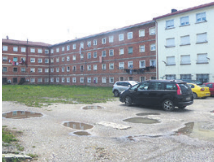
Bakea eta Erkuden arteko aparkaleku. ARTXIBOA

Bestalde, Altsasuko Udalak Otadiko bidea asfaltatzeko proiektua idazteko aurrekontu aldaketa onartu zen joan den asteko bilkuran. Aldi berean, abeltzain-