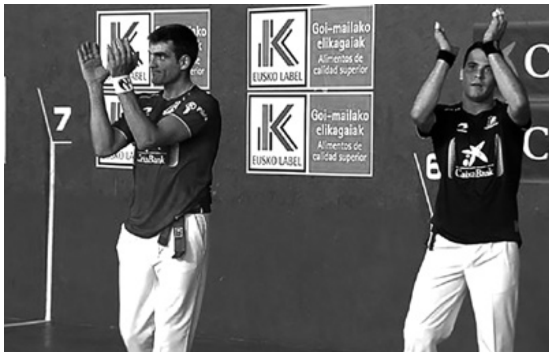
Ezkurdiak eta Jakak eskertuta txalotu zituzten Labriteko pilota zaleak, finalerdi gogorra eta gero. ETB.COM

Izan ere, eta nobedade moduan, txapelketa ikastola osatzen duten herri guztietan jokatu da. "Orain arte ikastolako frontoian jokatzeko zen, eta finala Altsasuko Burunda pilotalekuan, baina aurten txapelketa Ziordia, Olazti, Urdiain eta Altsasura eramatea erabaki dugu, herri guztiek osatzen dugulako ikastola" adierazi dute antolatzaileek. Etzi 2. jarduna hartuko du Urdiainen.