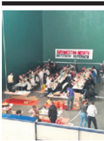
Aurreko urteko Gazte Eguna.

Sakanako Gozamenez batzordeak antolatu du egitaraua, Altsasuko Udalaren kultura eta gazteria zerbitzuen, Iruñeko Gozamenez batzordearen eta Osasunbidearen laguntzaz.