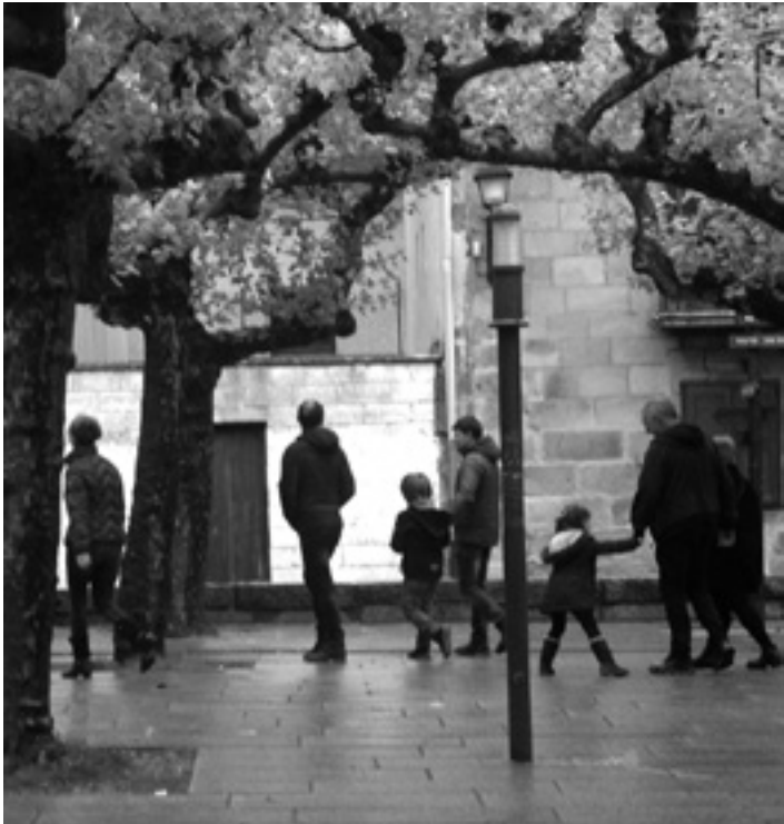
Etxarri Aranatz arnasmugua da.