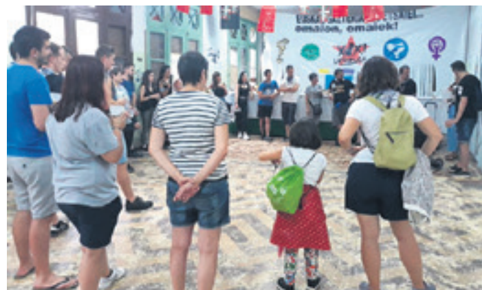
Bertsolariak eskola zaharraren eraikinaren barnean. BAKAIKU.INFO

Lanak azaroa bukatu aurretik despeditu behar ditu enpresak. Saneamendu sare hori Geltoki auzoko azpiegiturarekin lotzeko lanak etorriko dira ondoren. Hala, industrialdea araztegia lotzeko.