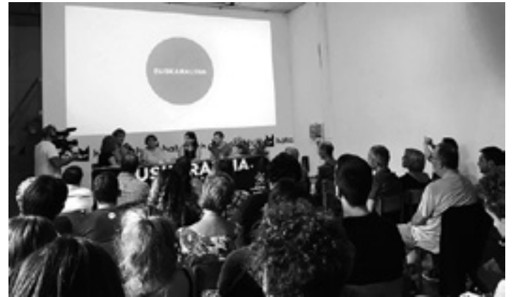
Euskaraldiko Nafarroako aurkezpena Iruñean egin zuten iraila akaberan.

J. Hori nahi dut, baina kezkek badaude. Jendeak gero eta gehiago bidaiatzen du, jende gaztea kanpora joaten da ikastera... Ez dakit hizkuntzarekiko atxikimendua mantenduko ote duen. Beste hizkuntzak oso indartsuak dira. Gaur hartzen dugun erabakien arabera etorkizuna modu batekoa edo bestekoa izanen da. Baikorrak izatea besterik ez daukagu.