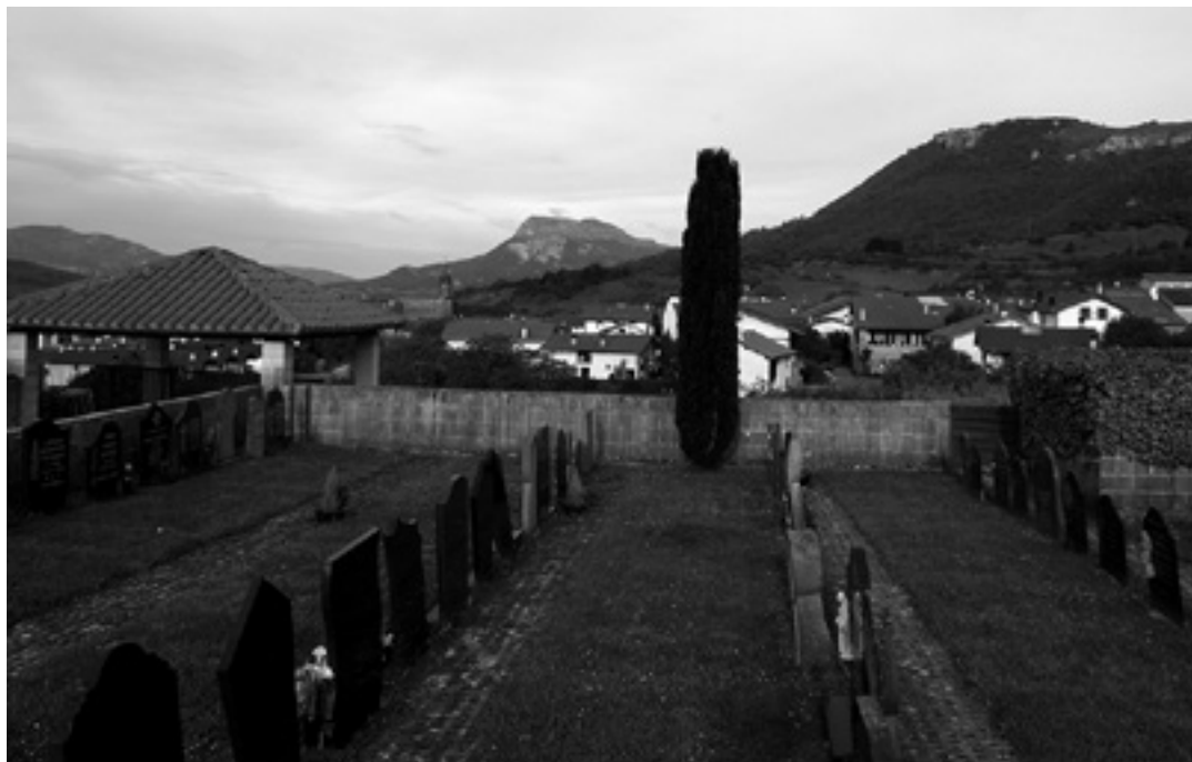
Urdaingo kanposantutik dagoen ikuspegia. ARTXIBOA