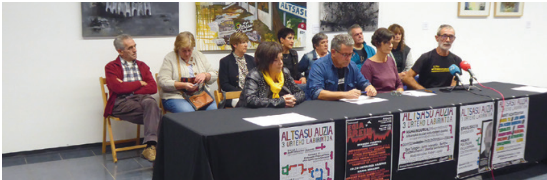
Iortia kultur guneko Altsasuko auziari buruzko erakusketa gelan eman zuten prentsaurrekoa.