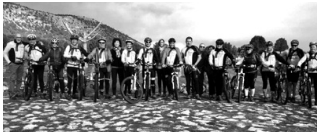
BARRANKA TXIRRINDULARITZA TALDEA

BTT Sakanako Mankomunitateak, Barranka Txirrindulari Taldearen laguntzarekin, BTT edo mendi bizikleta irteera antolatuta zuen igandean. Burgosen barna 42 km-ko buelta zoragarria egin zuten. "El bueno, el feo y el malo" film ezaguneko sekuentziak grabatu ziren Sad Hill kanposantua abiapuntu, Covarrubias gainditu eta Lerman bukatu zuten buelta.