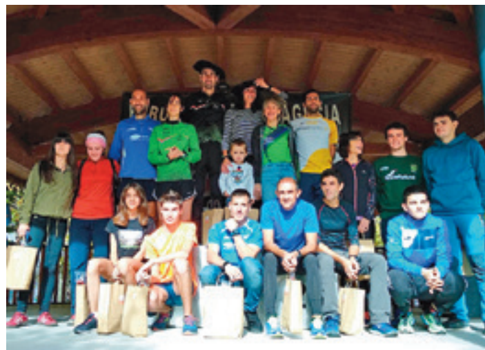
Bukaeran sari ematea izan zen plazan. Sarituek produktu loteak jaso zituzten.

Sari ematean bertako produktuen loteak jaso zituzten irabazleek, eta babesleek utzitako zenbait sari zozketatu zituzten antolakuntzak.