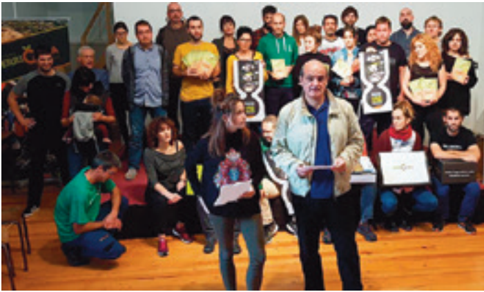
Ekimenaren bultzatzaileak aurkezpenan. ERRIGORA