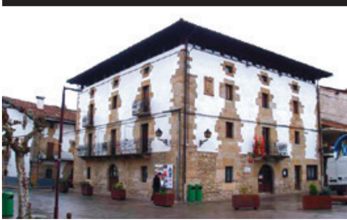
Lakuntzako udaletxea. ARTXIBOA