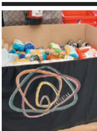
Paleta ia beteta. JP HIGUERO