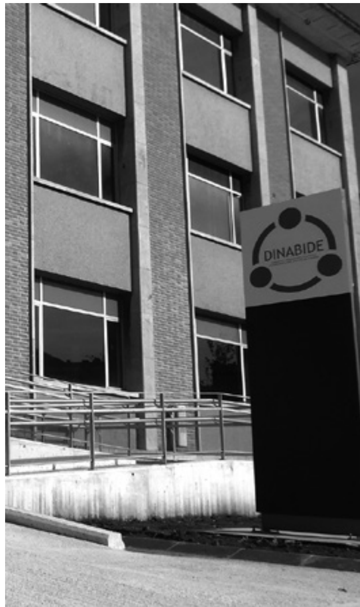
Inasa zeneko bulego eraikinean dago Dinabide. Astelehenean zabalduko ditu atak.