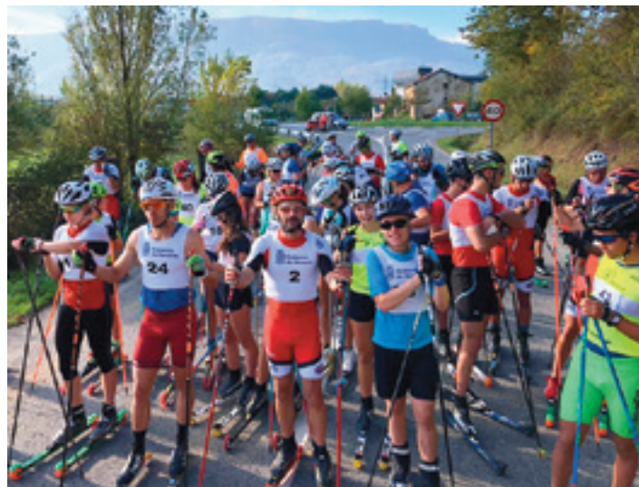
Rollerskiatzaileak, abiatzeko prest. UHARTE IPAR ESKI TALDEA

Bi distantzian jokatu zen XIII. Uharte Rollerski Saria eta bi distantziek irteera eta helmuga bera izan zituzten, Etxarri Aranatzko igerilekuetako bidean, errotonda ondoan dagoen Dorraukoetxea. Lehenik eta behin distantzia laburrekoak atera