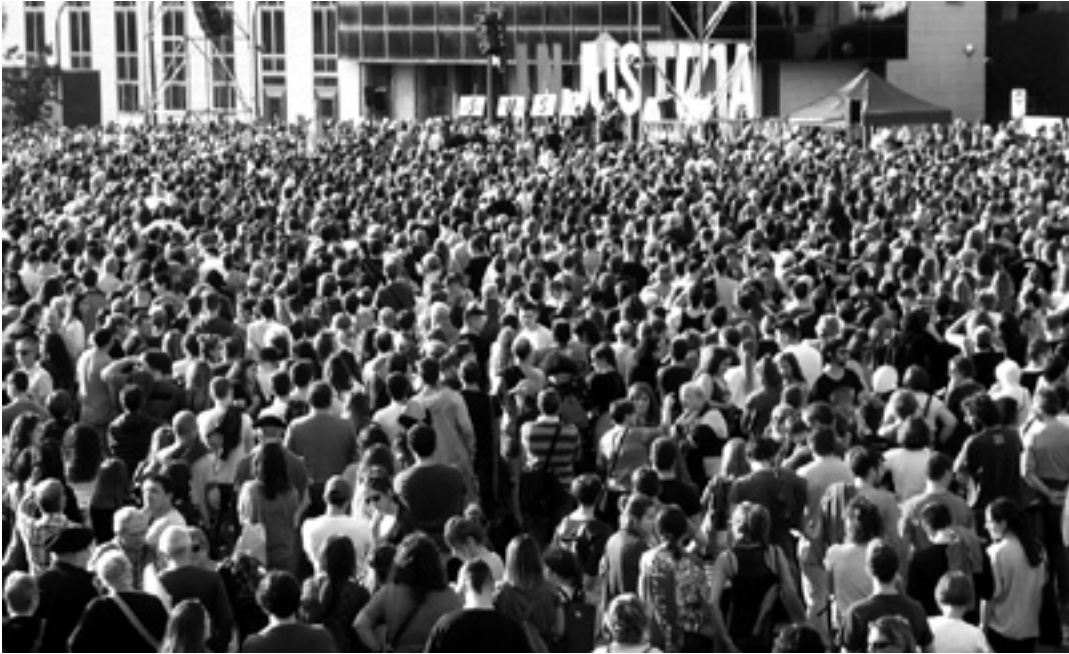
Antolatzaileek kontzentrazioan 52.000 pertsona elkartu zirela adierazi zuten.