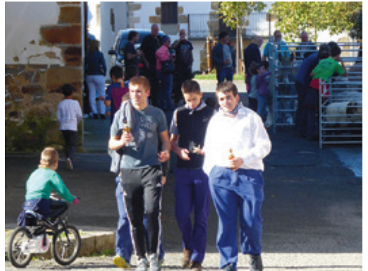
Konsistorial kalean herriko azienda ikusgai jarri zuten larunbatean.

Sareak eta zorua berritzeko lanen % 70 Nafarroako Gobernuaren Toki Azpiegitura Planaren bidez pagatuko du udalak. Sakanako Mankomunitatearen ardura da urarekin zerikusia duten sareak eta horregatik 56.800 euro inguru jarriko ditu. Gainera, kaleotako argiteria publikoko kableak lurperatu eta egungo bonbillak LED argiengatik ordezkatzeko Iturmendiko Udalak 40.000 euro ditu jasoak aurrekontuan. Herriko aurreneko LEDak izanen dira