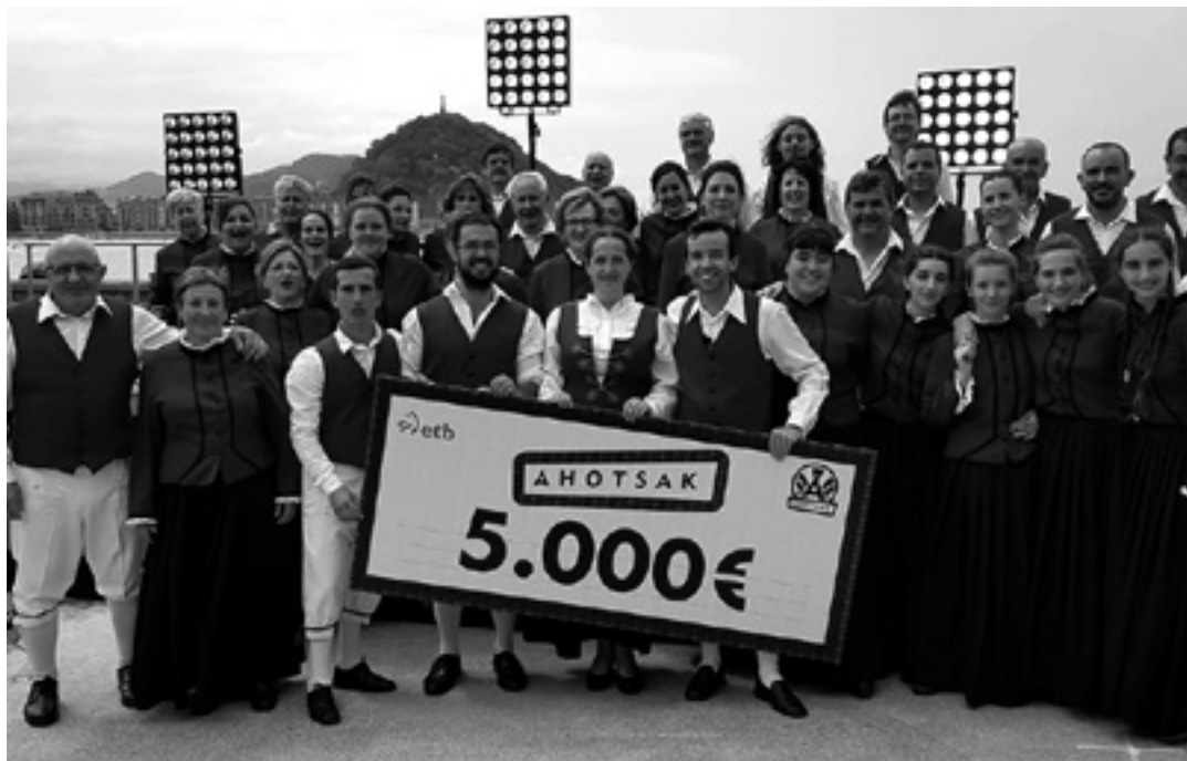
Etxarri Aranazko Abesbatzako kideak 'Ahotsak' saioko sariarekin.