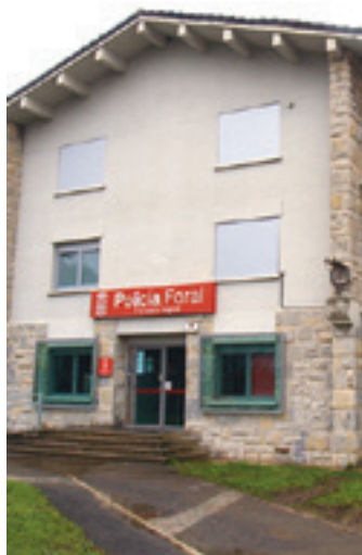
Altsasuko polizia-etxea.

Afanpak erabakiaren kontra epaitegietara jo zuen, Foru Dekretua baliogabetu asmoz. Sin-