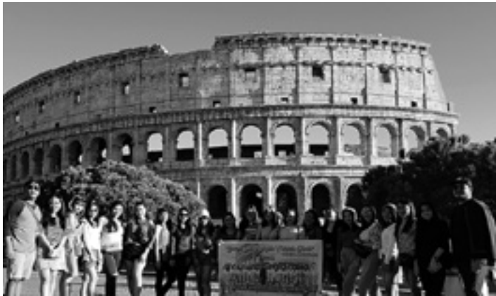
Gema Sangkakala Indonesiako abesbatza Etxarrin izanen da gaur.