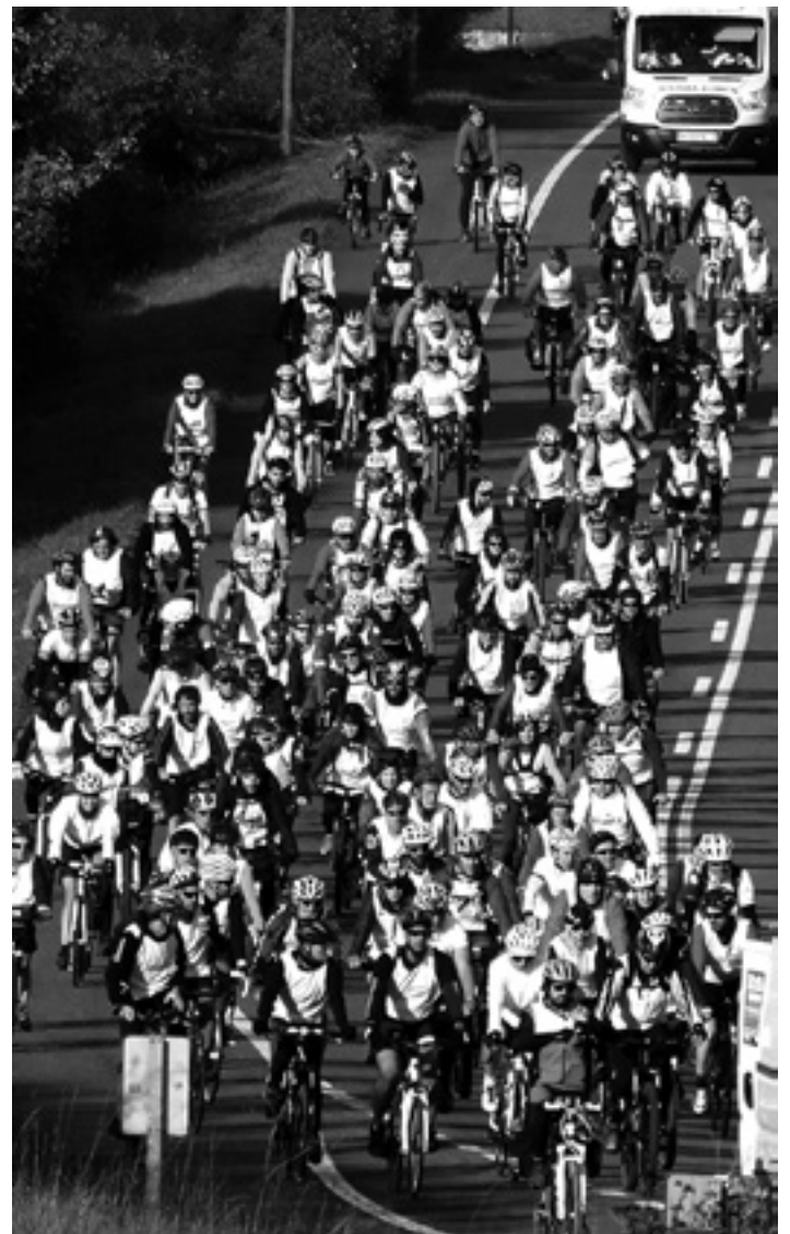
Duintasunaren Martxa Sakanako errepedeetan.

Tropela adin guztietako sakandarrek osatu zuten. Baita Hego Euskal Herriko hainbat tokitatik etorritako txirindulariak ere. Parte-hartzaileek pedalei eragitea nahikoa ez eta herrietatik pasatzen zirenean Altsasukoak askatu moduko leloak oihukatu zituzten. Herri batzuetan besteetan baino harrera beroagoa izan zuten, baina guztietan izan zuen tropelak bakarren bat zain. Behin Berriozarrera iritsita bazkaldu egin zuten. 50 tortilla, 60 litro salda, 30 bizkotxo eta edaria zituzten zain. Guztia Berriozarko boluntarioek prestatutakoa.