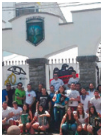
Gazteak Barazkigune parean.