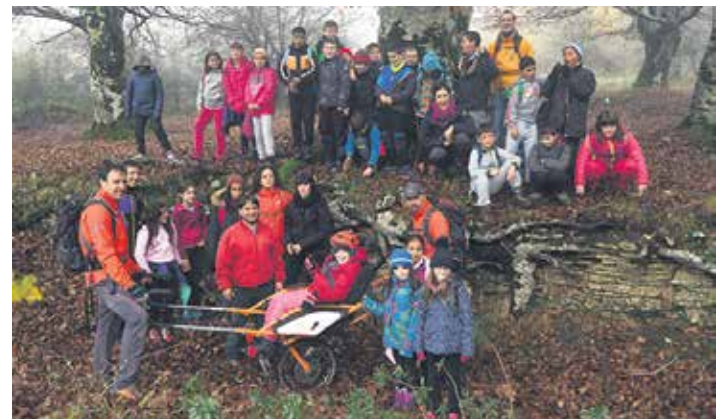
Asteartean 60 bat pertsona inguru elkartu ziren Urbanan. OLAZTIKO ESKOLA

tzaren antolaketa txalotu dute, eguraldiak lagun, goiz ederra pasatzeko aukera izan zutelako. Gainera, normalean mendira eurekin batera joaterik ez duen gelakideak parte hartzeko aukera izatea “oso ongi” baloratu zuten. Bukatzeko, hamaiketako Oinarrizko Lanbide Heziketako ikasleek antolatu eta bideratu zuten. Horrela, institutuko ikasleek ikasketa-zerbitzu egitasmoan parte hartu dute eta ikasi bitartean komunitateari zerbitzua eskaini diote.