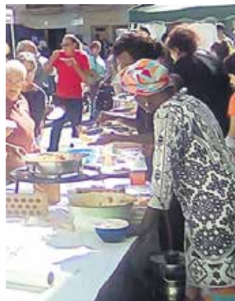
Munduko arroz dastaketa sanmigeletan

Etxean erabiltzen dituzten makina bat jostailu dituzte gaur egun haurrek. Jostailu horiei bigarren bizitza eman, haurrei gauzak trukatzeko aukera erakusteko eta, bide batez, kontsumorako beste bide batzuk badaudela jakinarazteko, jostailu trukaketa eginen da Altsasun. Baina trukatu aurretik haiek bildu egin behar dira eta hala eginen dute heldu den astean Altsasuko ikastetxeetan. Etxetik egoera onean dauden jostailuak eramaten dituzten haurrek txartel bat jasoko dute. Eta heldu den ostiralean txartel hori jasotako jostailuetako batengatik trukatzeko aukera izanen du. Ludotekan eginen da trukatzea.