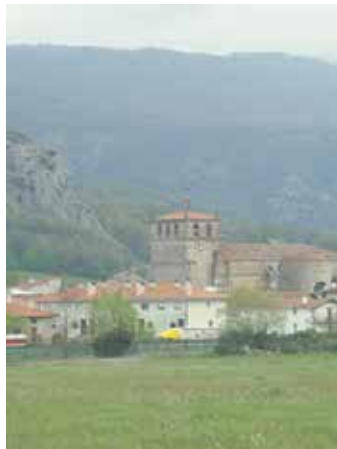
Uharteko Arakilgo ikuspegia. ARTXIBOA

Uharteko Arakilgo hirigintza plana berritzeko parte-hartze prozesuko laugarren bilera egin zen astelehenean. Aurreko hiru urteak auzo bakoitzeko aldamekin egin zituzten eta azken urteak guztiendako izan da. Hartan Lurraldearen Okupazio Estrategia eta Modeloa aurkeztu zuten, hirigintza plana idatzi aurretik egin beharreko agiria. Hartan Uharteko Arakilen lehentasunak, hazkunde eredua, baliabideen aprobetxamendua eta ahulguneak gainditzeko bideak