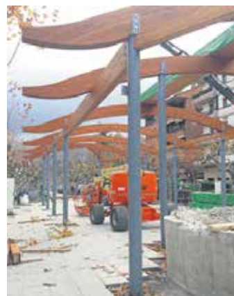
Egurrezko egitura jartzen.

Estalope berriko egurrezko egitura jartzen hasi ziren asteartean. Kioskoa eta estalopea biek teiatu bera partekatuko dute eta hari eutsiko dion egitura da Jamsarko langileek jarri dutena. Pixkanaka, beraz, itxura hartzen ari da Etxarri Aranazko plazako estalope berria. Udalaren asmoa litzateke eguberrietako ekitaldietarako estalopea prest egotea.