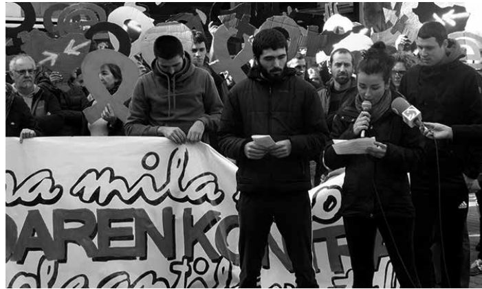
Ezkila-joleei babesa azaldu eta faxismoa salatu zuten larunbatean.

Plataformako kideen ustez, "guk ez dugu uste faxismoari gure plazak okupatzeko zilegitasunik aitortu behar zaionik, aldarrikatzen duten askatasun faltsu hori gure askatasuna ukatzera datorrelako". Horregatik, "uste dugu ezin dela faxismoa hazten utziko duen espaziorik hutsik