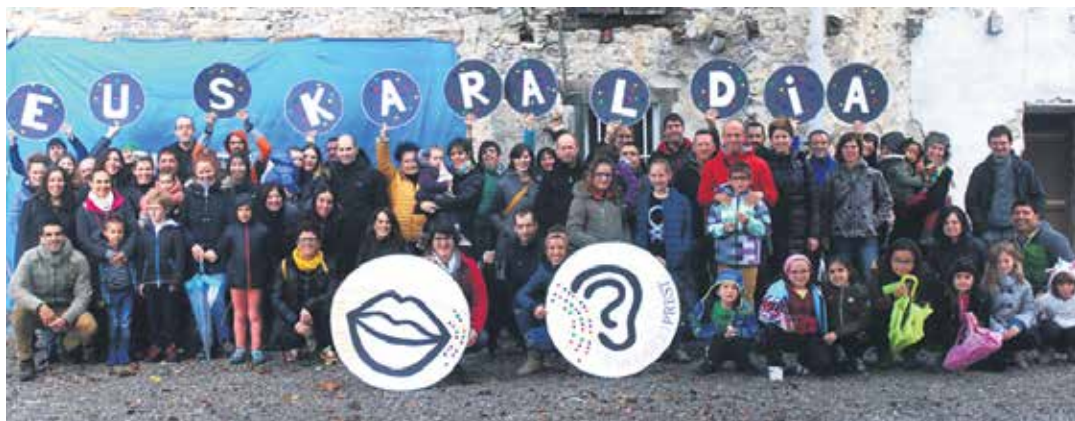
Euskaraldiaren aurkezpena Irurtzungo Pikuxar elkartearen. PIKUXAR