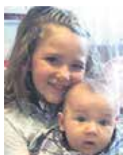
Iradi Lanz Zorionak Iradi Altsasuko aitona-amona eta izebaren partez!! Ondo pasa!!