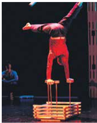
'Sinergia 3.0' ikuskizuna. IORTIA

Asteartean Beltx-ek Irurtzunera eginen du bidaia bertako hegazi-fauna ezagutarazteko. 17:00etan izanen da tailerra. Altsasun Juan Goñik "Los bosques que llevo dentro" liburuaren aurkezpena eginen du, 19:00etan. Asteko egitarau osoa: www.guaixe.eus-en .