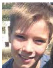
Artzai Karasatorre Sureda Zorionak Artzai!! 11 urte, 11 amets! Ongi pasa zure urtebetetzean. Maite zaitugu! Etxekoak