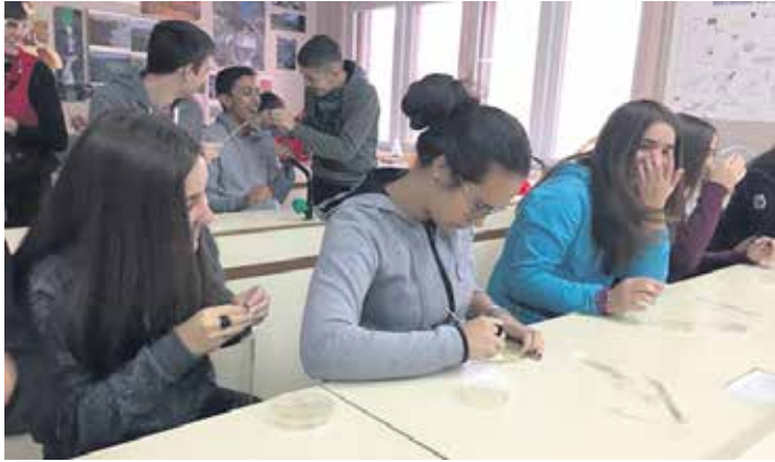
Altsasuko institutuko ikasleak laborategian esperimientua egiten. LEIRE PALACIOS