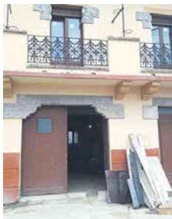
Ostatu lanak aurrera doaz.

Lizarragako Kontzejuak bultzatuta, medikuarena zen etxea gizarte etxe edo ostatu bihurtzeko lanak martxan dira. Lastailaren erdialdean hasi ziren eta ilbeltzean despeditzea aurreikusten da. Mustu, berriz, Aste Santurako mustu nahi lukete. Beheko solairuan ari dira taberna eta denda jartzeko lanak egiten. "