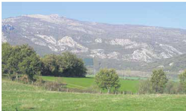
Aralar mendilerroa Sakanatik. ARTXIBOA