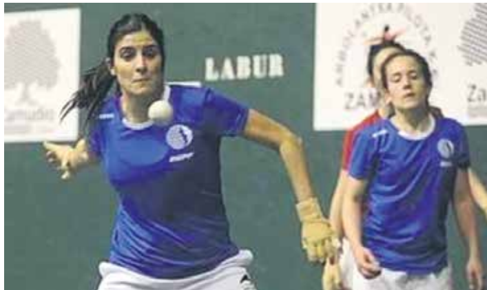
Emakumeek pilotan trebatzeko aukera badute Sakanan.