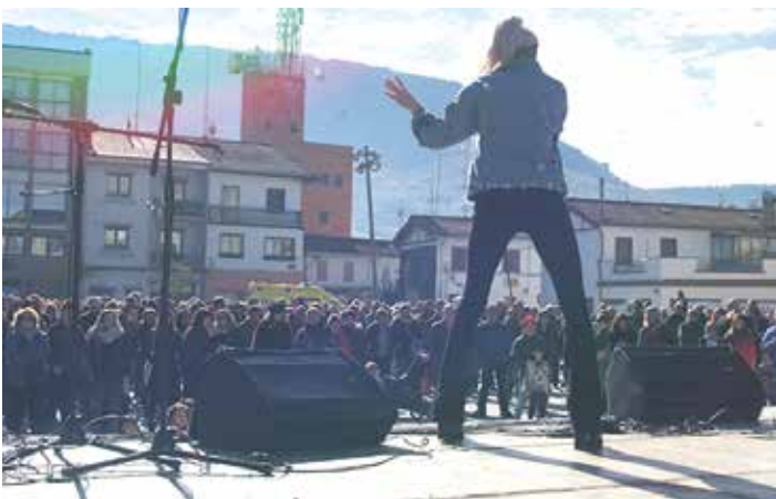
La Furia rap kantaria kultur guneko zabalgunean.