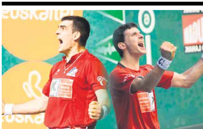
Ezkurdiak eta Altunak hitzordu garrantzitsua dute azaroaren 18an. ASPE