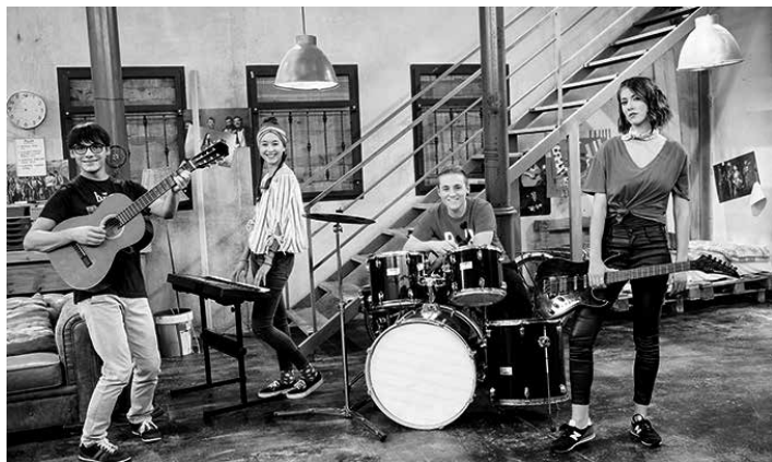
3zpa4 taldeko partaideak. UTZITAKOA