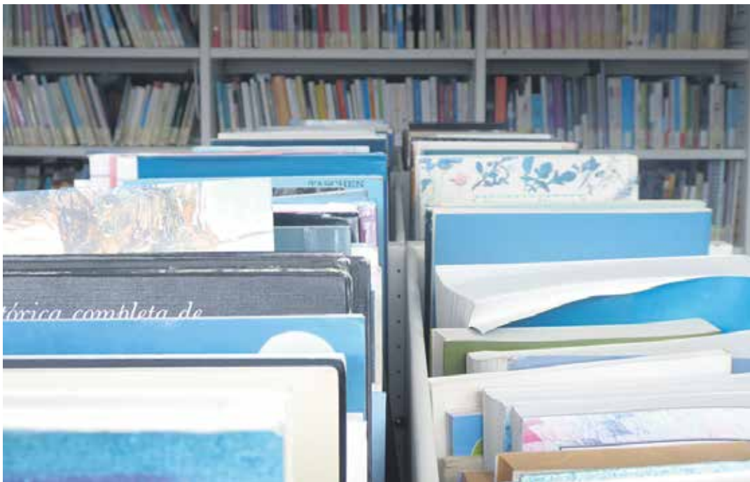
Irurtzungo liburutegiko apaletako liburuak.