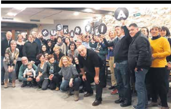
Lizarragako hamaikakoaren aurkezpena. TXANE