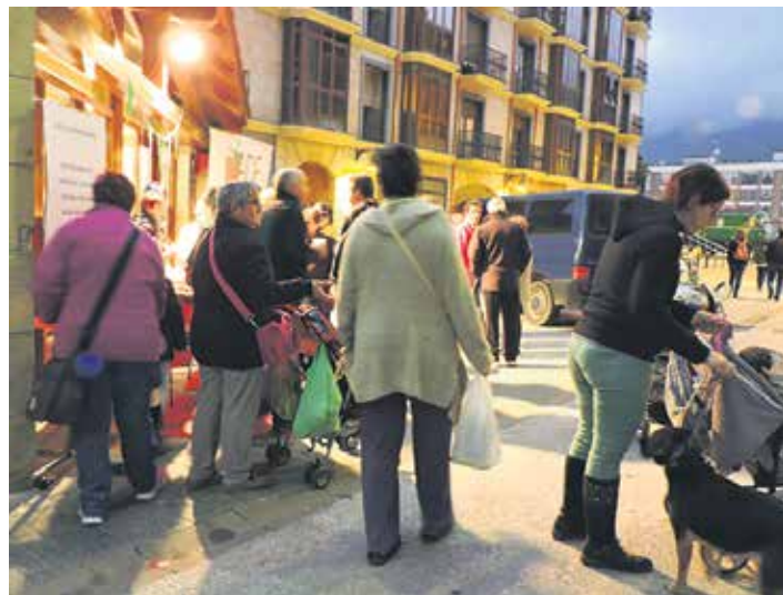
Joan den urteko Merkataritza festa.

Euritakoa elementu artistiko izatetik eguraldiagatik udaberriko hainbat aste pasa arte ezinbesteko den elementua izatera pasa da. Altsasuarren ohi-