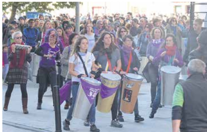
Bisitariak joan eta gero batukadak gidatuta Foru plazarrantz abiatu ziren.

Ikusi eguneko laburpenaren bideoa eta gertatu zenaren argazki guztiak: guaixe.eusen kanalean