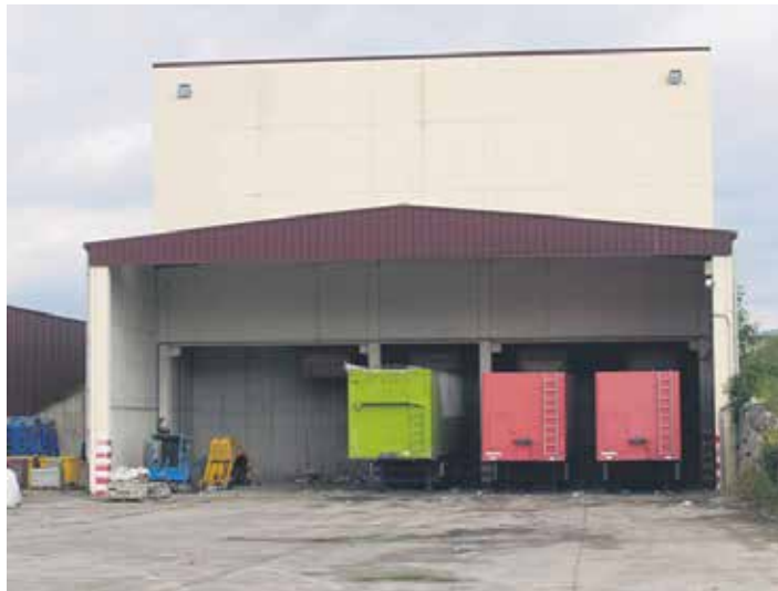
Arbizuko hondakindegiko transferentzia kaia.

Bitartean, hondakindegian industriako hondakin bizigabe ez arriskutsuak botatzen diren 32.280 m 2 -ko zatia itxeko lanek aurrera segitzen dute. Hura itxtearekin batera, hondakin mota hori hartzeko 22.000 m 2 izanen dituen beste zati bat prestatzen ari dira. Han 98.000 m 3 hondakin pilatzeko ahalmena izanen da. Zati berri horrek 10 urtez hon-