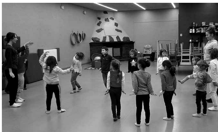
Haurrak Olaztiko ludotekaren gelan dantza ikastaroan.