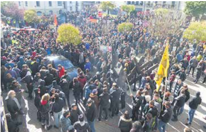
Ekitaldia egiten zen bitartean plaza inguruetatik oihua eta zarata egin zuten.