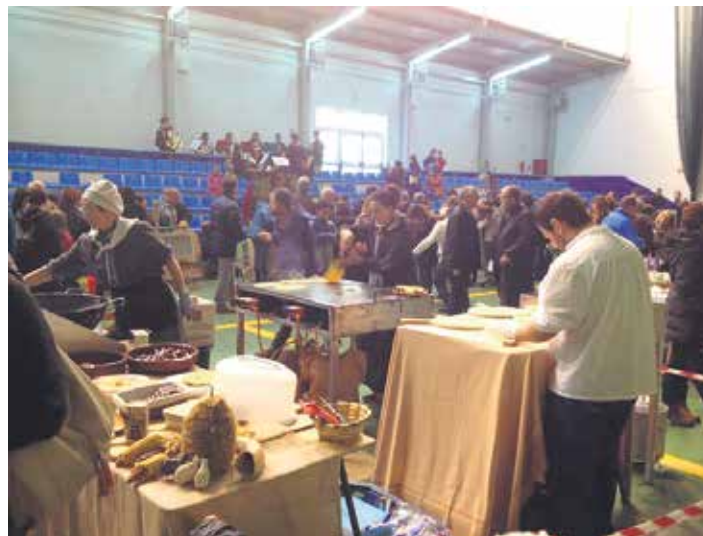
Joan den urteko artisau azoka.

Musika, jan-edanak eta konpainia ederra. Horrekin nahikoa da festa ospatzeko. Eta horrelako ezer ez da faltako Irurtzunen asteburuan. Haurrendako eskaintza, erraldioen eta buruhandien konpartsaren urteko azken irteera, gozogintza lehiaketa, bazkari-afariak, dantzaldiak, karta lehiaketak eta beste. Halako eskaintzarekin osatu dute egitaraua Irurtzongo Kultur Kontseiluak eta udalak. Gainera, igandean, 26 artisau bilduko dituen azoka izanen da. Haiekin batera Irurtzongo Euskaraldia taldeko kideak informazioa ematen izanen dira.