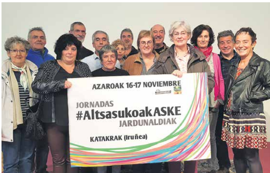
Gurasoek ostiralean aurkeztu zituzten jardunaldiak. ALTSASU GURASOAK