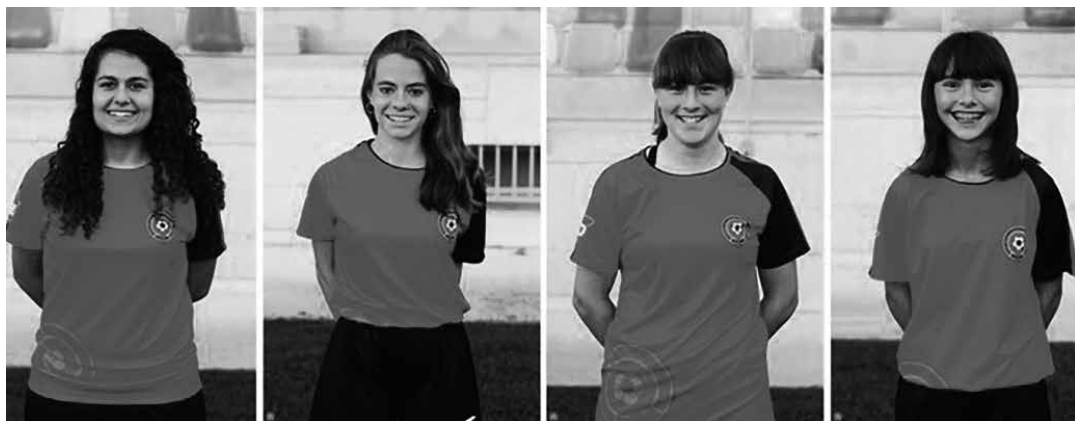
Aurten Mulierren segitzen dute dute Canterok, Cerezok eta Igoak, baina Vilariño Aurrera de Vitoria taldera joan da.