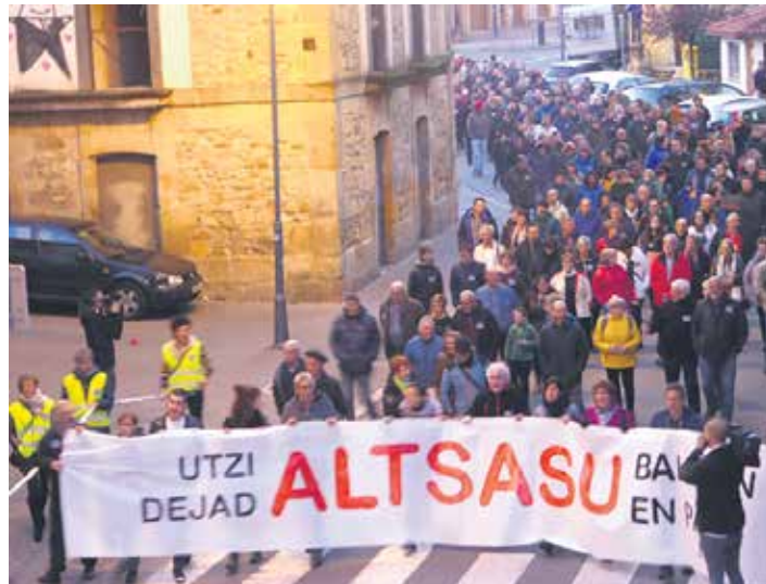
Igandekoa "Altsasuren kontrako beste eraso bat da, ankerkeria guztiaz egina".

Tentsio unerik handienak bisitariak joan zirenean izan ziren. Altsasuarrek osatutako segurtasun-hesia jendearen eta Guardia Civilen artean jarri zen. Batetik eta bestetik izan ziren oihera eta irainak. Gertakariak alderdien kolore guztietako erreakzioak sortu zituzten.