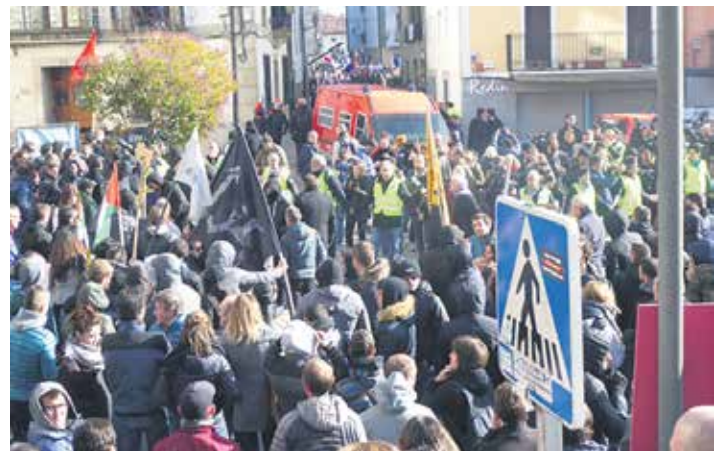
Antifaxisten asmoa plaza inguratzea zen. Eguerdirako segurtasun hesia eratu zen.