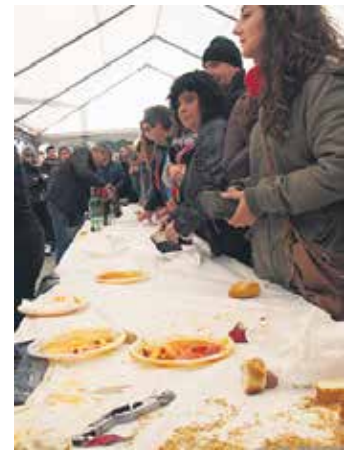
Jatekoa egon zen gunean.