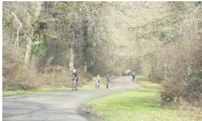
San Pedrorako bidean jendea paseatzen.