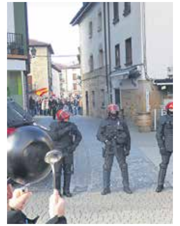
Edozerk balio zuen zarata ateratzeko.