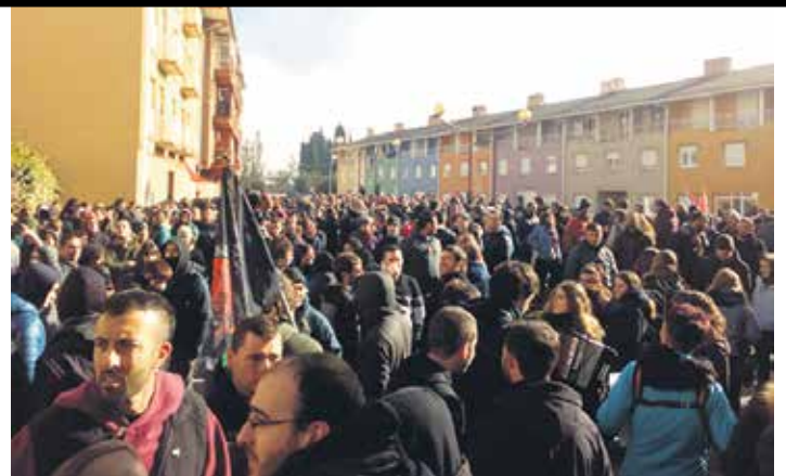
Altsasu antifaxistak deituta lehenik Amandrea plazara joan ziren.