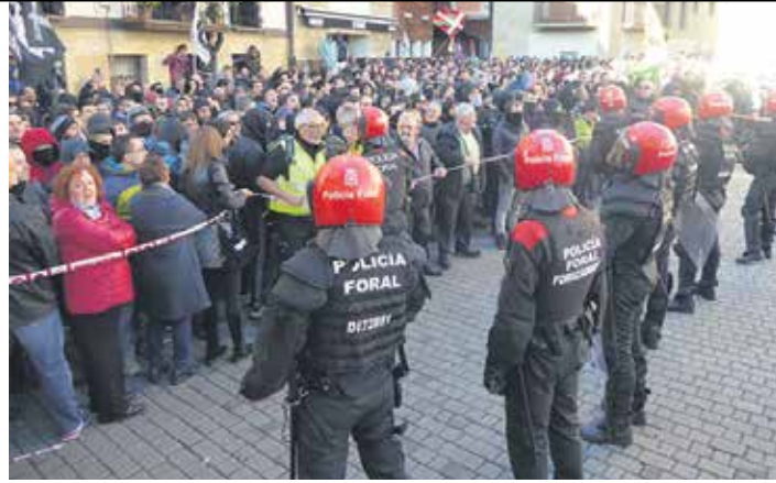
Foruzainak plazako ekitaldira inor ez gerturatzeko ardura izan zuen.