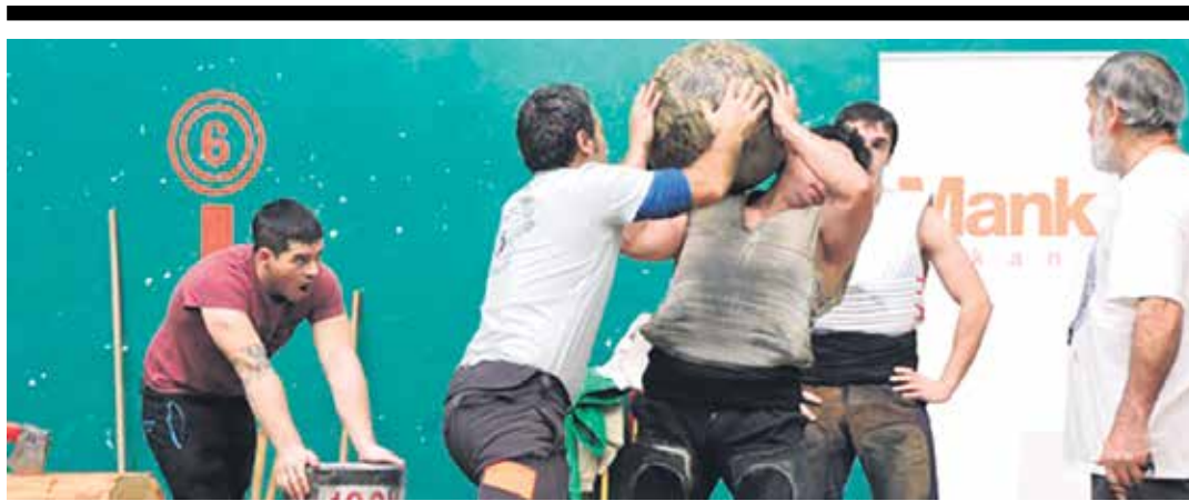
Sakanako Harri Jasotze Eskolako kideen erakustaldia, Sakanako Herri Kirol Jaialdian.

Sakanako Mendizaleak taldeak prest dauka azaroko irteera. Azaroaren 18an Errioxara joko dute, Nieva de Cameros eta Angiano arteko mendi ibilbidea egitera. Autobusa goizeko 6:00etan aterako da Irurtzundik. Azaroaren 15a baino lehen eman behar da izena, herrietako arduradunei esanez edo 639 117 631 telefonora hots eginez.