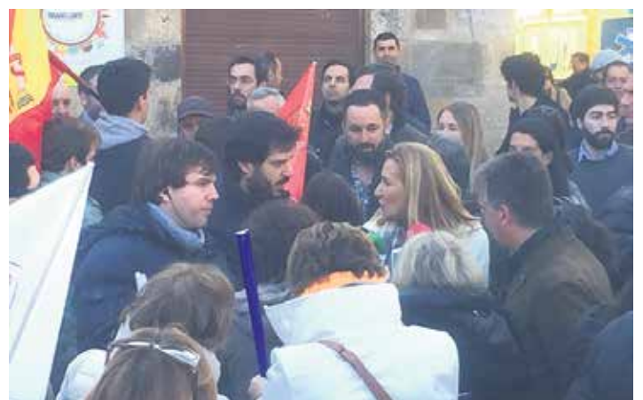
Voxeko eta Nafarroako PPko ordezkariak Foru plazan.