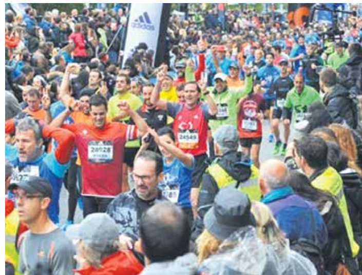
30.000 korrikalariaren muga gaindituko du, beste behin, proba ezagunak.

Ibilbidea ohikoa izango da: Behobiatik abiatu eta Donostiako Bulebarrean amaituko da, 20 km osatuta. Goizeko 09:45ean urritasunen bat duten 87 parte-hartzaileak abiatuko dira, 9:50ean 214 irristalariak ekingo diote probari eta korrikalarien irteera 10:15ean izango da. 18 taldetan banatuta ekingo diote probari korrikalariak, dortsalaren kolorea kontuan hartuta. Lasterkariak laguntzen 29 erbi arituko dira eta ibilbidean 7 hornidura gune eta 13 animazio gune izango dira. Lasterketa uzteko 23 toki prestatu ditu antolakuntzak.