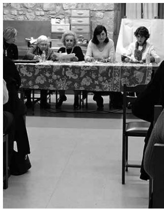
XII. Poesia errezitala, 2017an.