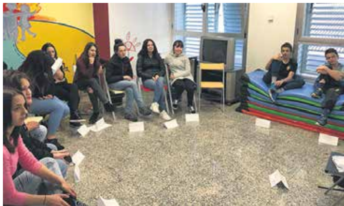
Ostiralean hasiko dira lehenengo saioarekin.