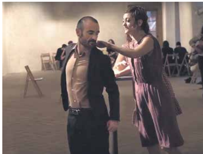
2017ko Zinetika jaialdiaren performance bat.

Zinetika jaialdia handituz joan da. Iruñean hasi zen eta dagoneko hiru hiriburutan egingen da: Iruñeko Kondestable jauregian, Donostiako Tabakalera eta Bilboko BilbaoArten eta La Fundizionen. Denborarekin ere atal berriak sortu dira. Lau dira