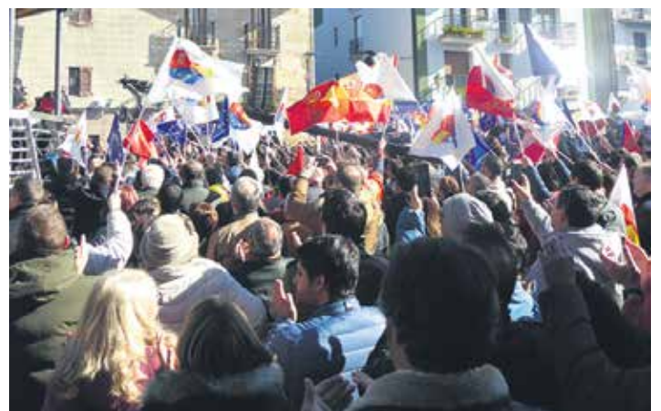
400 bat bisitariak plaza erdia bete zuten.