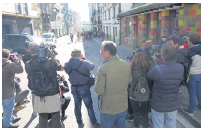
Estatuko bazter guztietatik etorri ziren bisitariak hedabideak erakarri zituzten.