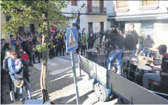
Plataformaren ekitaldi bitartean plaza inguruan kontzertu ibiltaria izan zen.