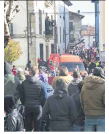
Ekitaldiak jakin-mina piztu zuen.