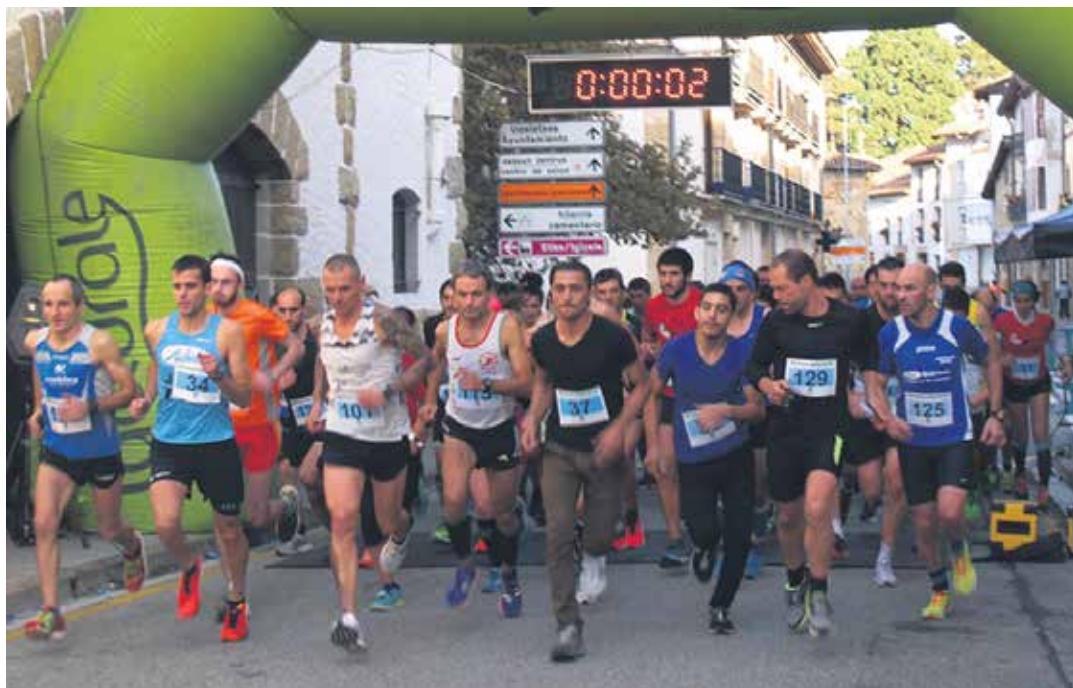
Sakanako Herri Lasterketa-Burundesa Sari Nagusiko irteera.