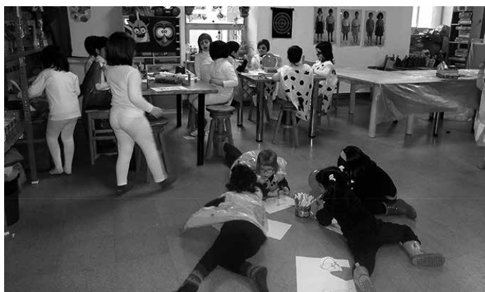
Azaroan barna ludotekan argazki erakusketa izanen da. TXANTXARI LUDOTEKA