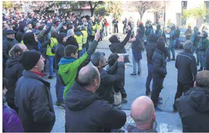
Bisitariak joan zirenean izan zen tentsio une handiena.