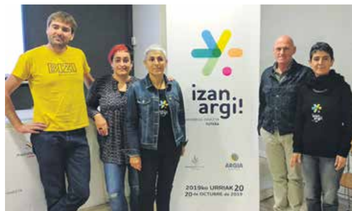
Asteazkenean egin zuten prentsurrekoa. NIE