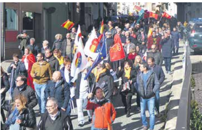
Bisitariak autobusetarako bidean hainbat irudi hartu zituzten.