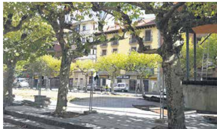
Parte-hartze prozesuaren bidez aukeratu zuten plaza berria.