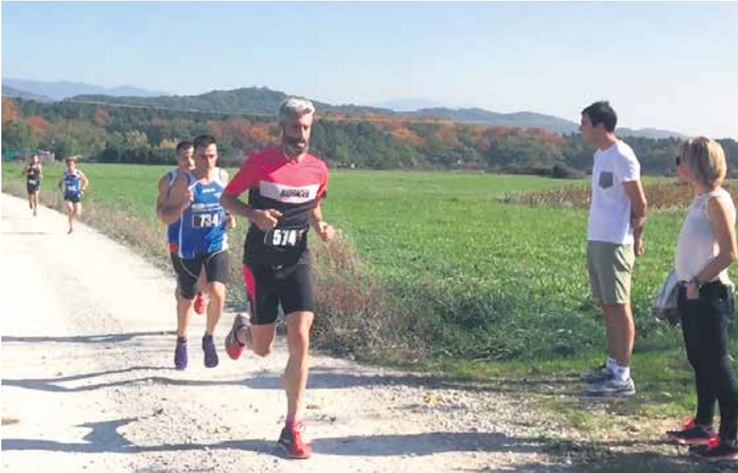
Onddo lasterketan parte hartzera animatu du Dantzaleku Sakanak.