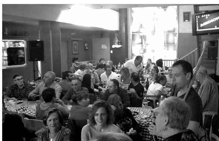
LA ENCINA EXTREMADURAKO KULTU ELKARTEA

Gobernuko lau departamentuk bat egin dute gobernuaren zeharkako ekintzan. Ezagutu sareko espazioen kudeaketa-sistemak dinamizatzeko eta modernizatzeko dinamika da eta "politika soilik kontserbazionistetatik haratago eta natur-ingurunea jarduera-motor gisa hartuta"