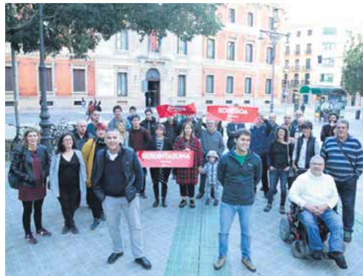
Iruñeko manifestaziora deitzen. KONTSEILUA

80 eragile horien iritzi "euskaldunok merezi eta behar dugun lege babesaren alde egiteko unea da". "Guztion erantzukizuna da, bakoitzak bere aldetik, norabide berean bultzatzea. Horregatik, bat egin dugu mobilizazioarekin. Euskaldunontzat ona izango den Legea egiteko aukera hau bultzatuko dugu".