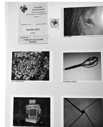
2016ko erakusketaren argazki batzuk.

Parte-hartzaileek gai bakoitzeko argazki bana atera behar-