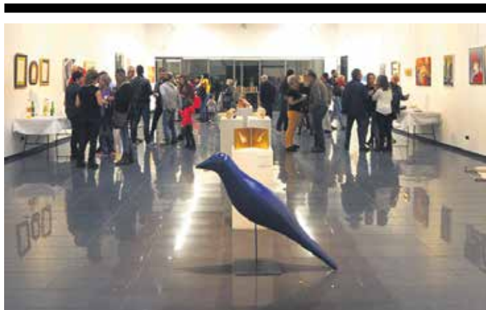
Arte Azoka mustu zuten urriaren 19an. UTZITAKOIA