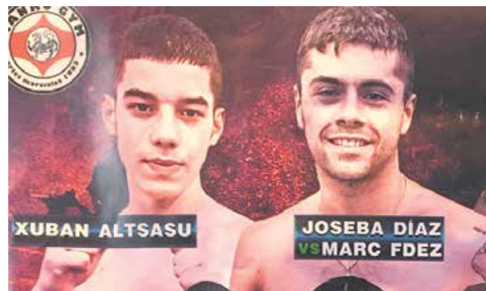
Gaurko boxeo jaialdiko karteletik hartutako irudia. UTZITAKOIA