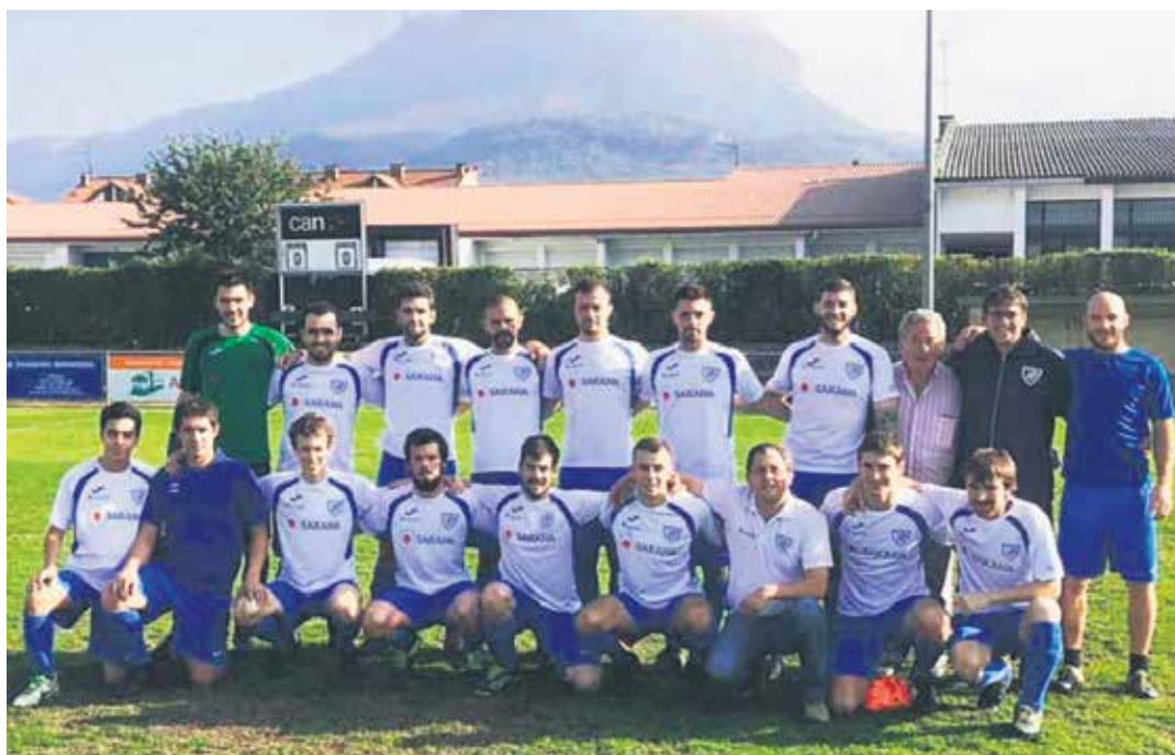
Erregional mailako lehen multzoan dabil Lagun Arteak eta egun liderra da. LAGUN ARTEA

Bartzelonako Mundialetan 14 herrialdetako pilotariak lehiatu ziren eta 160 pilota partida baino gehiago jokatu ziren guztira. Hurrengo Mundiala 2022an jokatuko da, Miarritzen.