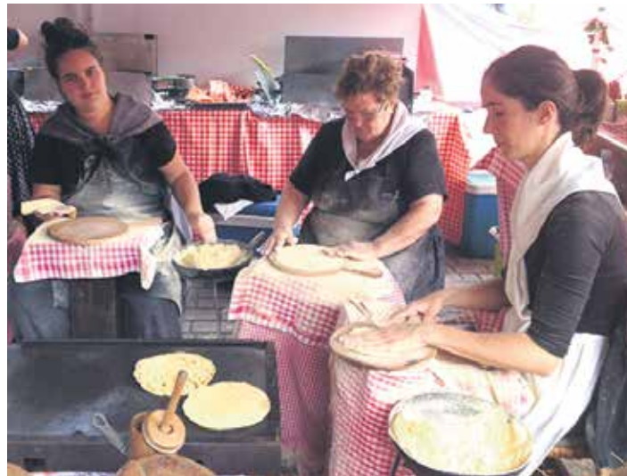
2016ko ferian talogileak lanean.

Antolatzaileek azaldu dutenez, jardunaldiaren bidez “aukera bat oparitu nahi diegu geure buruari: lurraldeak eta euren etorkizuna zerez eginda dauden elkarrekin hitz egiteko, lurralde horiek bizitza proiektu asko eta askotarikoak inplementatzeko