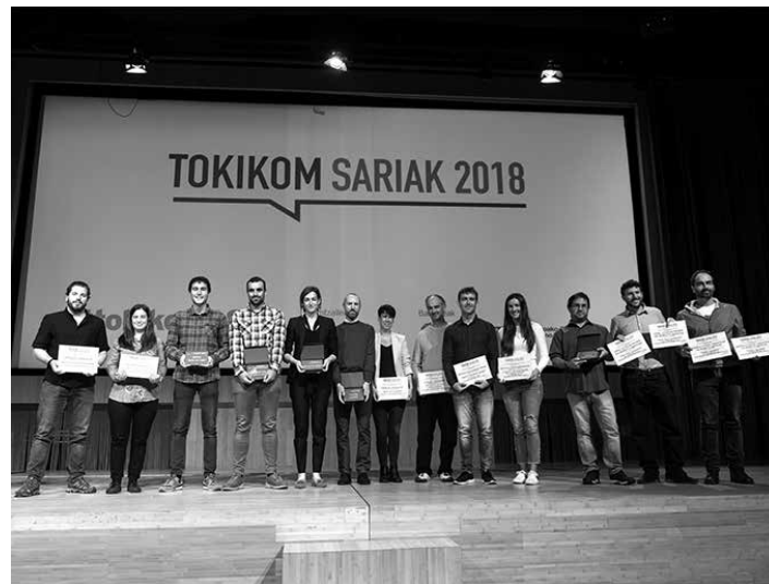
Tokikom Sarietako finalistak eta sarituak. TOKIKOM

Maila horretako saria Bizkaiako Hego Uribeko Geuria aldizkariaren Berba eta Irudia monografikoarendako izan zen. Eskualdeko sortzaileei egindako elkarrizketa sorta batek eman zien saria. Azalik onena Gipuzkoako Debagoieneko Goiena