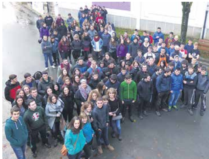
Joan den urteko Gazte Eguna Ziordian . ARTXIBOA

Sakanako gazte asanbladetako kideek jardunaldietan, hasteko, euren proiektua definituko dute. Horretarako, zuzentzen diren gazteriarren sektoreaz, gazte asanbladez eta gaztetxeen proiektuez hizketatuko dira. “Eztabaida hauen bidez, gure helburura iristeko bidea argitzen saiatuko gara”.