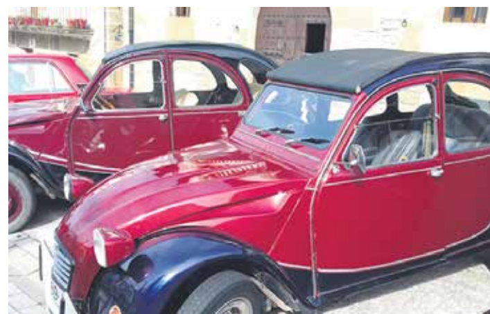
Auto klasikoek ikusmin handia piztu zuten.