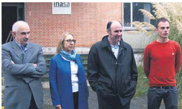
Nafarroako Gobernuako ordezkariak Irurtzungo alkatearekin Inasan 2016an.