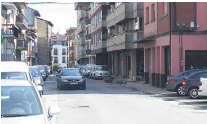
Isidoro Meleroko lanek ferien ondoren hasi eta 6 hilabete iraunen dute.