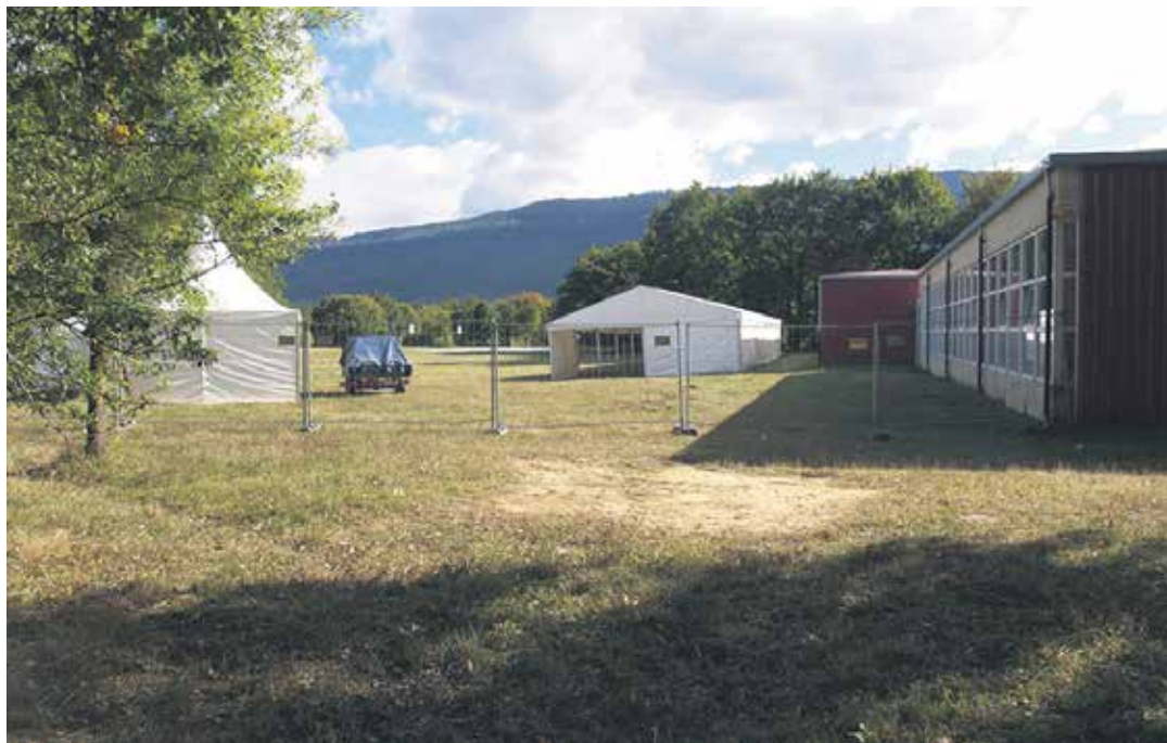
Aste guztian zehar izan dira montaketa lanak.