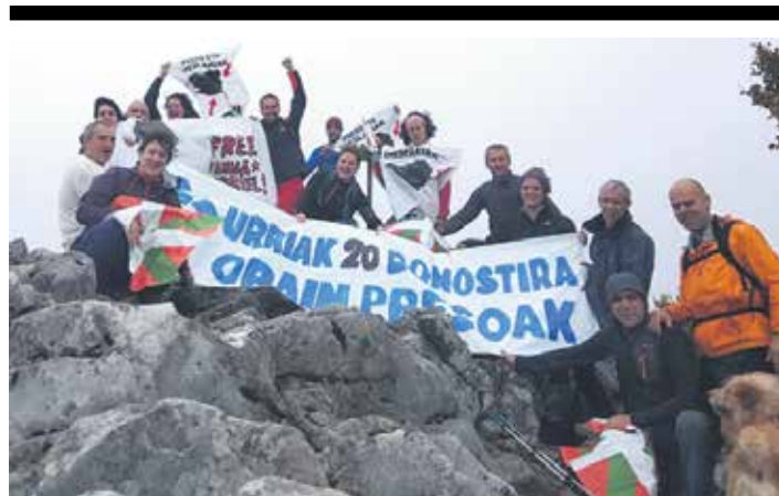
Preso, iheslari eta deportatuen aldeko martxa egin zuten Arbizun. UTZITAKOA

Aberri Egunari buruzko hausnarketa egin behar dela ondorioztatu zuten. "2010etik hona Independentistak Sareak antolatuta ditu azken bederatzi Aberri Egunak. Jauzi berri bat egiteko unea iritsi dela uste dugu. Diadak Kataluniako prozesuan duen garrantzia hartu nahi dugu erreferentzia moduan, eta 2019ko Aberri Egunean urratsa egitea planteatzen dugu: gure herriaren etorkizuna erabakitzeke eskubidean eta demokrazian oinarrituta, eraikitzearen alde dauden eragile politiko eta sozial guztiek bultzatutako Aberri Egun bateratua antolatzea proposatzen dugu" adierazi zuten independentistek. Bere ustetan "euskal herritarren gehiengo oso zabalak eta diaspora osoak ilusio handiz" hartuko luke berri hori.