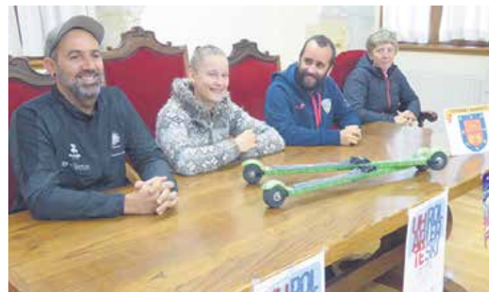
Urriaren 27an jokatu da proba, baina asteartean aurkeztu zuten.

Urriaren 27an goizeko 11:00etan abiatuko da nagusien proba, Lizarragabengoatik (9,8 km). 5 minutu beranduago hasiko da 14 urtetik beherakoena, Etxarri Aranatzeko (2,8 km). Parte hartzeko izena ematea urriaren 27an egin beharko da, 10:00etan.