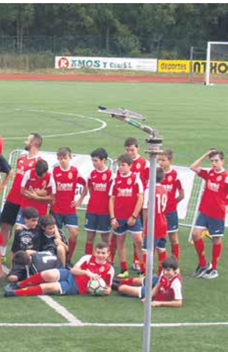
Errealeko jarlekuak itxura berria goraiatu zuten.