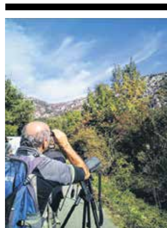
Hitzaldia 18:30ean izanen da. UTZITAKOIA

Euskararen erabilera bultzatzeko ariketa pertsonala eta aldi berean kolektiboa egingen da azaroaren 23tik abenduaren 3ra, Euskaraldia. Hartan izena emateko www.euskaraldia.eus web orrian sartu daiteke. Lakuntzan, gainera, liburutegian izena emateko aukera dago. Altsasun, bestalde, batzar irekia dago gaur, 19:00etan, Gure Etxea eraikinean.