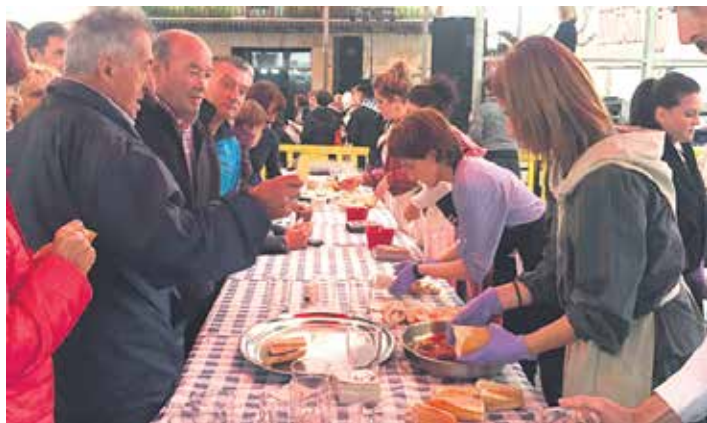
Karparen azpian babestu izan ziren inguratutakoak.