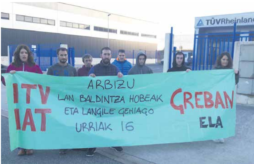
Arbizuko IAT-ko langileak lantoki parean egin zuten protesta. 2008an zabaldu zen lantegia.