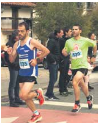
2017an Uharte Arakilen jokatu zen.