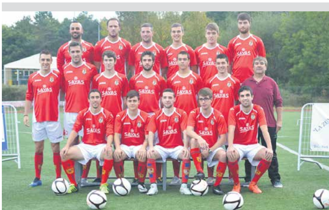
Erregional mailako 2018/2019 denboraldiko Altsasu taldea, aurreko ostiraleko aurkezpenean. GUZMAN LOBO