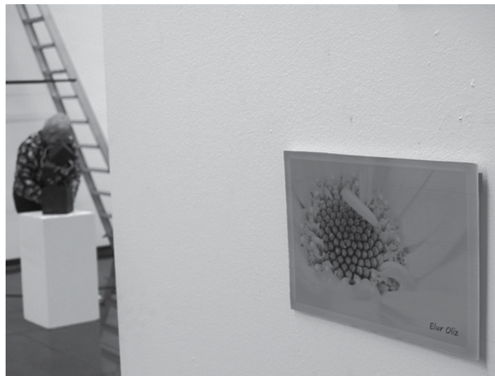
2017ko Arte Azoka erakusketa.

Erakusketa oso garrantzitsua da Sakanako artistendako. "Lehenengo urtetik parte hartu dut erakusketan, eta ilusioa egiten dit. Gainera, orain Altsasun bizi naiz eta ilusioa handiagoa da". Erakusketa ez ezik, izenak dioen bezala, azoka bat da; hortaz, erakusketan dauden lanak eros daitezke. "Altsasuko ferietan, gainera, salmahaiak jartzen