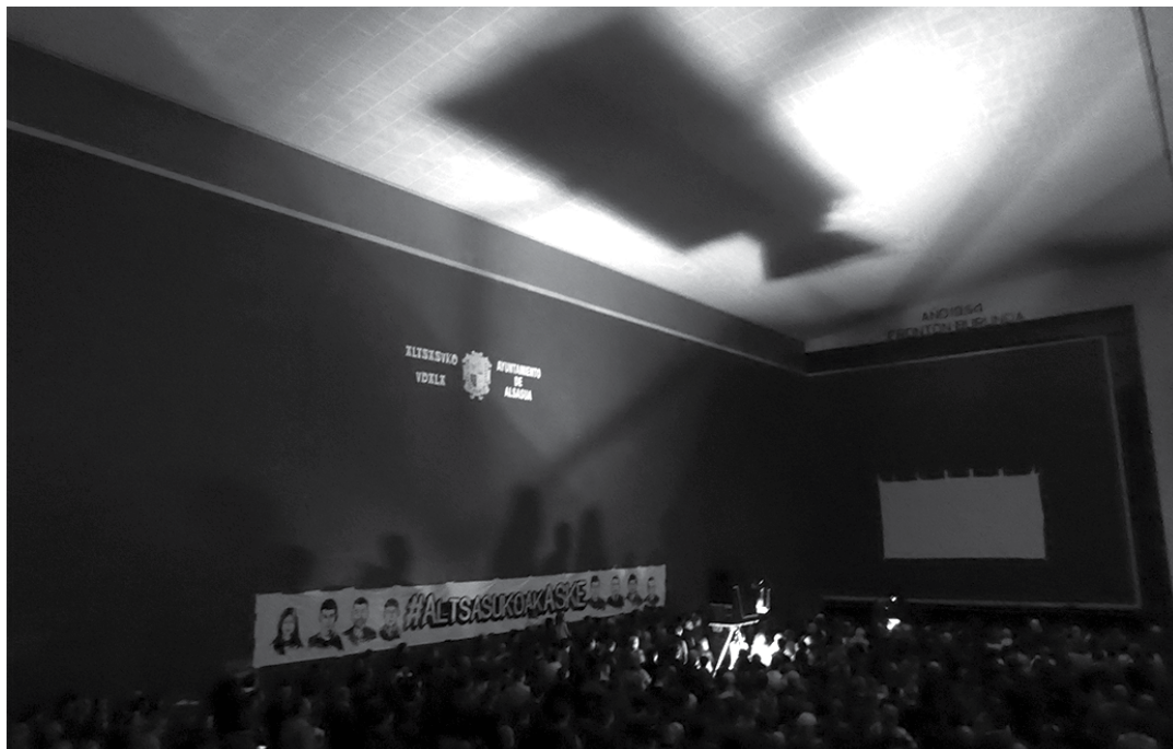
Domekan egindako ekitaldiaren une bat.