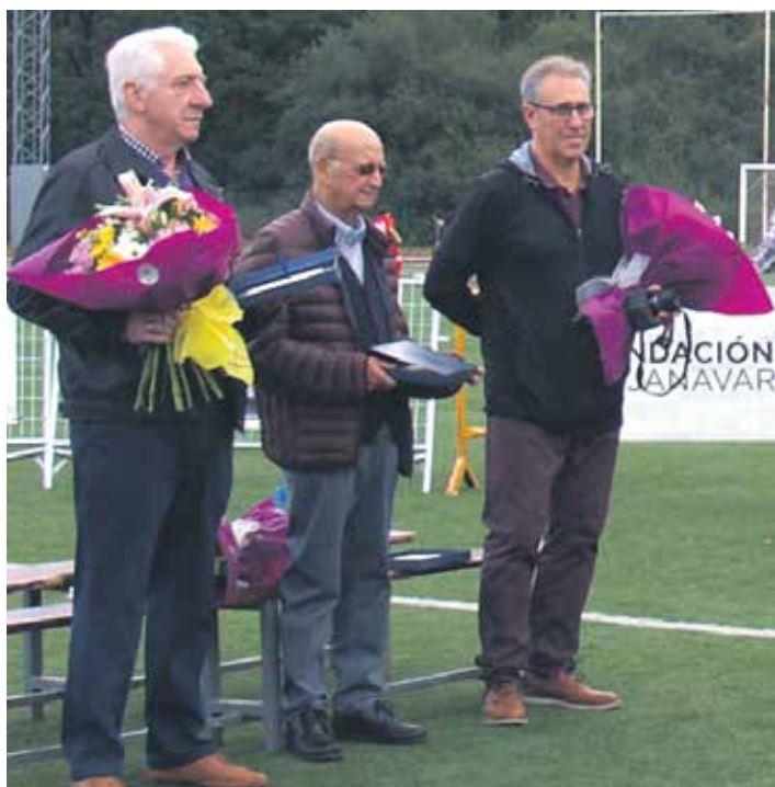
Hiru omenduendako erabateko sorpresa izan zen omenaldia; hunkituta zeuden.