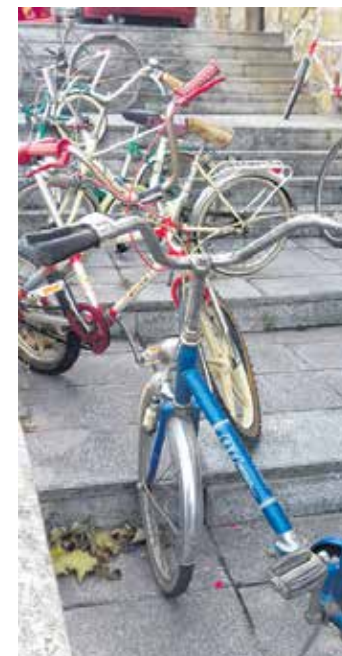
Garai bateko bizikletak.

txan jarri eta Altsasu-Urdiaingo San Pedrorra egin zuten joan etorria, giro bikainean. Eta festa behar bezala bukatzeko, Bakarrekotxea elkartean 100 pertsona inguru bildu zen bazkal-tzera. Beste behin, arrakastatsua izan zen Katxarro Eguna.