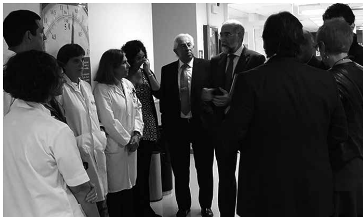
Astelehenetik aurrera dago zerbitzua martxan.