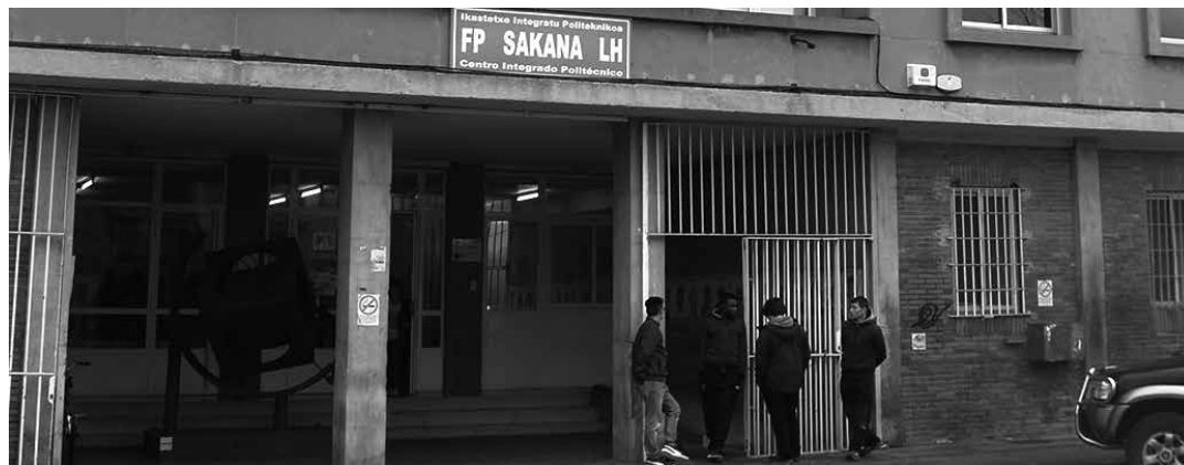
Epe luzera euskaraz funtzionatzeko helburua dute Lanbide Heziketan.

Lan horiek Goizuetako Her-manos Apezetxea enpresak eginen ditu eta haien truke 517.318,31 euro (BEZ barne) jasoko ditu. Ur azpiegiturak berritu behar direnez, lanen zati horren kostua Sakanako Mankomunitateak hartuko du bere gain. Horretarako 94.318,31 euro (BEZ barne) bideratuko ditu. Gainontzeko 423.314,95 euroak (BEZ barne) Lakuntzako Udalak ordainduko ditu. Baina horretarako Nafarroako Gobernuaren Tokiko Azpiegitura Planeko diru-laguntza jasoko du. Udalak bere zatia diruzaintzako gerakinean duenarekin eta erabilera askeko funtsetik jasotakoarekin ordainduko du eta ez da zorpetuko.