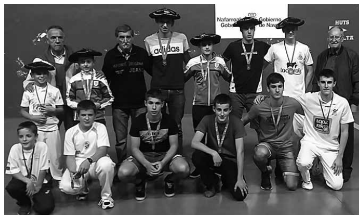
Nafar Kirol Jolasetako Buruz Buruko finalistak, Irurtzunen. NAFARROAKO PILOTA FEDERAZIOA

Nafar Kirol Jolasen Eskuz Banakako 1. mailako 22 urtez azpiko finalak ikusmin handia piztu zuen. Irurtzun klubeko Olaetxea eta Ardoi taldeko Arribillaga lehiatu ziren eta txapela