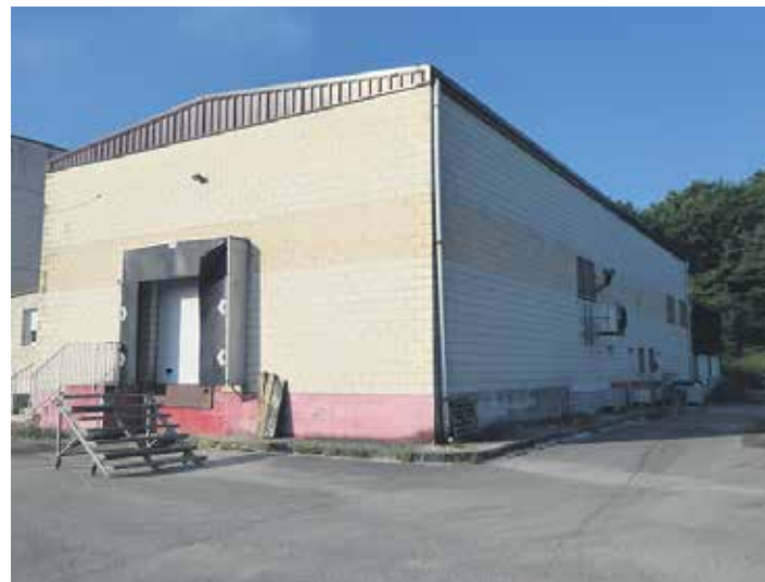
Etxarri Aranazko hiltegiaren eraikina.

Garapen agentzietatik jakinarazi dutenez, “halako proiektuetan gertatu ohi denez, prozesuan zailtasunak agertu dira, eta horietako asko eta asko gainditu badira ere, obra modu egokian egiteko gutxieneko baldintzak ez dira lortu”. Azaldu dutenez, alde batetik, Etxarri Aranazko Udalak Nafarroako Gobernuari eskatutako diru-laguntzaren ebazpenak atzerapen handia izan du, “ondorioz obra egiteko duen epea zeharo murriztu da, aurten gauzatzea bideragarria ez izateraino”. Bestetik, “emandako diru-laguntza eskatutakoa baino gutxiago izan da, beraz, obraren kostua ez litzateke %100ean diruz lagunduko. Hori zen obra egiteko Etxarri Aranazko Udalaren nahitaezko baldintza”.