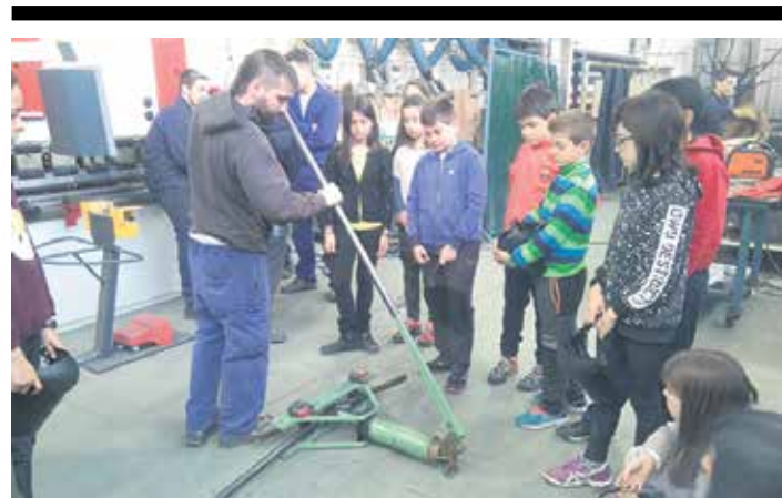
lazko ikasketa-zerbitzu proiektuan lantegia erakusten.

Dinamikatik herritar guztiak gonbidatu dituzte "gurekin batera bakearen eta elkarbizitzaren norantzan ekitera eta espainiar gobernuari urratsak determinazioz emateko, hitzetatik ekin-tzetara igarotzeko, eskatzera".