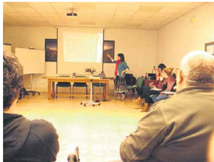
Zurrumurruek detektatzen ikastaroa egin zen udazkenean, orain liburuxka atera da.