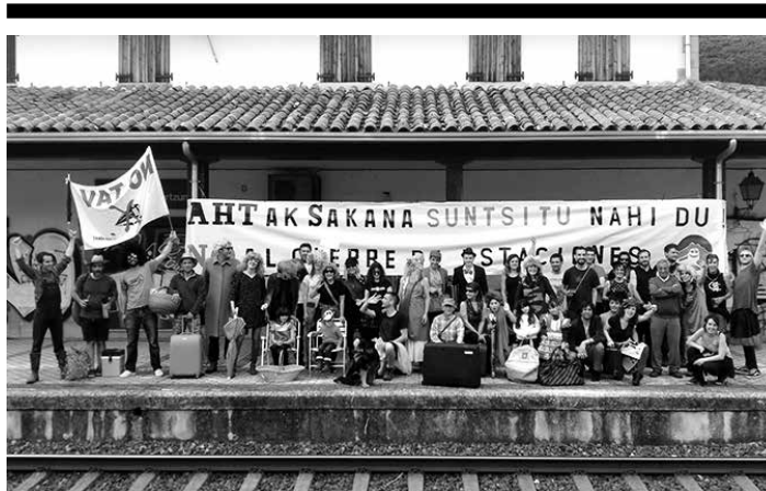
Izurdiagatik Ziordira arteko 8 geltokietan 300 bat pertsona elkartu ziren.

Pentsioen kutxa eta eltzetxu bakarra ere hizpide izan zituzten. "Pentsio sistema propioa aldarrikatzen dugulako insolidarioak izatea leporatzen digute". Galdetu zuten: "Esan daiteke PSOE, PP, CCOO, UGT, CEOE eta API-ME solidarioak izan zirela lan erreforma eta pentsioen erreforma 2011n sinatu zutenean?"