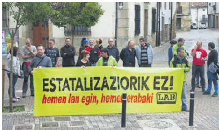
Lan hitzarmenen estatalizazioak dakarren berzentralizazioa salatzen LABek.