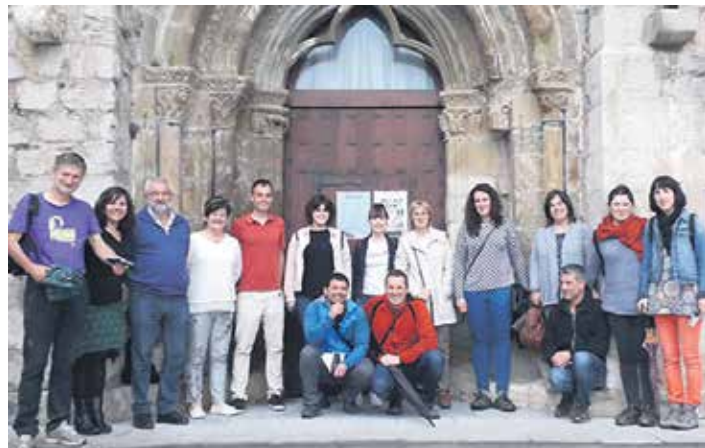
AIZPEA EUSKALTZALEEN TOPAGUNA

Euskaraldia ariketaren aurkezpena egin zuten Pikuxarreko euskalgintza batzordeko eta Aizpea euskara taldeko kideek pasa den ostegunean. Bilerara deituta zeuden Irurtzongo talde eta norbanakoak, baita Arakilgo herriak ere. Ekimenaren nondik norakoak azaldu ondoren, bildutakoek iritzia eta ideiak partekatu zituzten, eta Euskaraldia batzordea eratu zen.