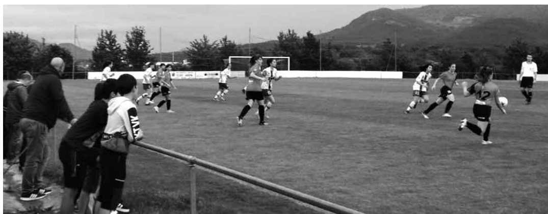
Goi mailako partida izan zen asteartean Mulierrek eta San Ignaziok Etxarrin eskaini zutena.