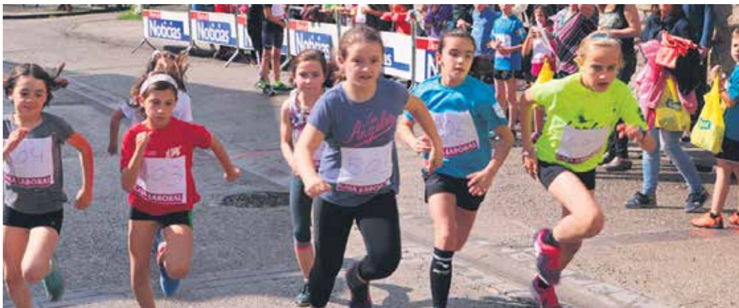
Kategoria txikietako lasterketetan oso gustura aritu ziren neska-mutilak. UTZITAKOIA