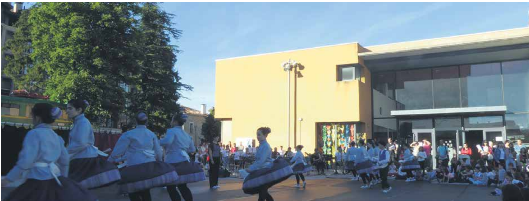
15 urte hauetan Iortia kultur gunean gauza asko antolatuta dira, bai kanpoan, bai barruan. ARTXIBOA