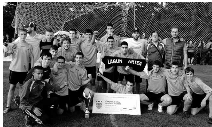
Lagun Arteako 2. mailako jubenilak, lortutako koparekin.

Altsasuk denboraldiari agur Erregional mailan dabilen Altsasuk, igoera faseko azken partidaren, 1 eta 0 irabazi zion Itaroa Huarteri. Burladesek, Itaroa Huarterek eta Pamplonak lortu dute mailaz igotzea. Altsasu 7.a sailkatu da (18 puntu) eta hurrengo denboraldian erregional mailan jarraituko du.