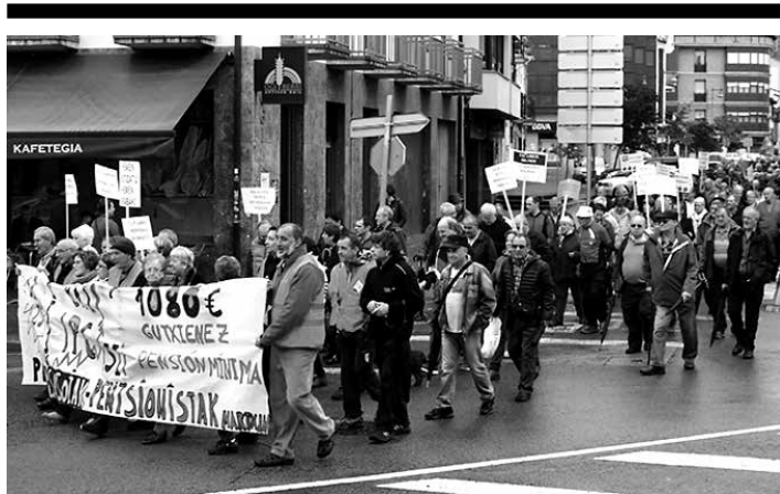
2011ko eta 2013ko erreformak bertan behera uztea eskatu zuten.