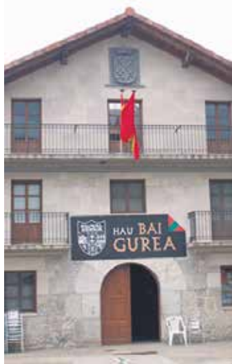
Uharte Arakilgo udaletxea. ARTXIBOIA

Lan horiek 84.000 euroko aurrekontua dute. Udalak 34.000 bideratuko ditu lan horietara eta, gainontzekoa, Cederna-Garalurren bidez lortutako Europako Landa-Garapenerako Programaren diru-laguntzaren bidez pagatuko du. Udaletxean eginen