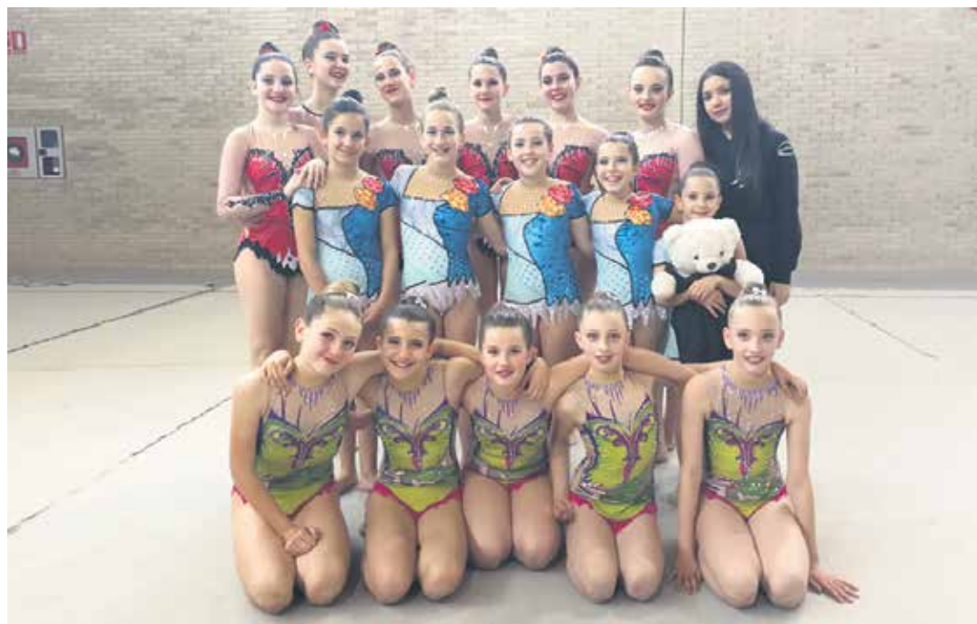
Nafarroako Taldekako Txapelketan parte hartu duten Sakana Iskizako taldeak. ISKIZA SAKANA