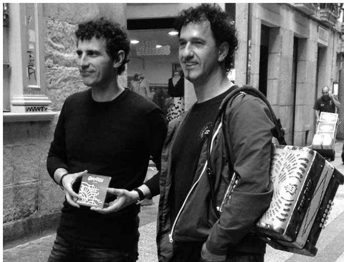
Gozategiren G puntua diskoaren aurkezpenean. GOZATEGI

Bai, guk behintzat bai. Zortzi urte generaman kanta berriak