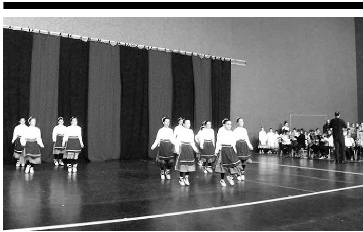
Musika eta dantza eskolako ikasleak ikasturte amaierako emanaldian.