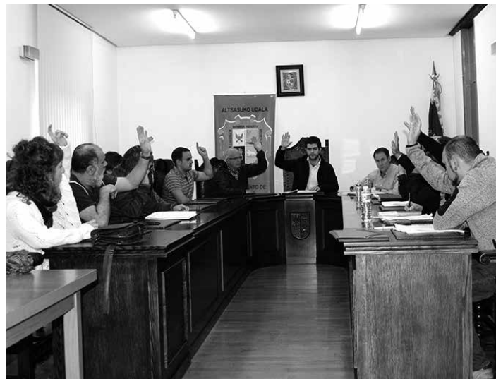
Herenegungo bilkuran Bardeako tiro poligonoaren kontrako mozioa onartu zen.

Altsasuko Udalak erabaki du lortia kultur guneko egungo