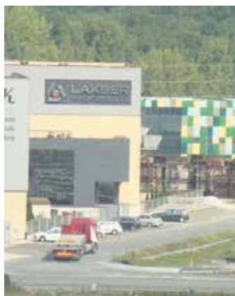
Sakanako industrialde bat.

Estatizazioari buelta emateko patronalaren, sindikatuen eta gobernuaren arteko Nafarroako akordioa sinatzea proposatu du LABek, herrialdekoa izatea gutxienekoa eta inork hori ez uztea estatuko ez hartzeko. UGT, CCOO eta patronalari egin zion proposamena LABek eta "ez zuten ongi ikusi. Sindikatu horiek nahiago dute estatuan negoziatzea, gaitasun handiagoa dutelako". LABek "akordio inter-profesionala lortu nahi du" eta, esparru bakoitzean, lan-harremanak hemen borrokatzea. Guretako sektoreetako Nafarroako hitzarmenak lortzea garrantzitsua da. Eta lortuko ez balitz, enpresetan ahalera bera egin beharko genuke". Administrazioan dagoen "egoera larria" dela gaztigitu zuen: "ezin dira plaza berrien deialdirik egin, soldata ezin da %1etik igo..."