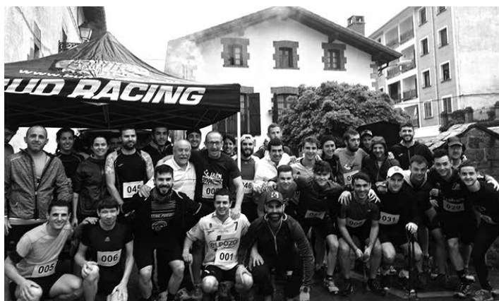
Parte hartzaileek talde argazkia egin zuten. BI SISTERS