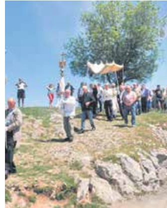
Korpuseko prozesioa Aralarren.

Kontu Ganberak Nafarroako Parlamentura bidalitako erantzunean jasotzen denez, fiskalizazio erakundearen iritziz ikastolari utzitako eraikin eta lur publikoak legeak ezarritakoari segituz egin da. "Izan ere, erakunde onuradunak interes orokorreko jardun baterako erabil-tzen dutelako". Kontu Ganberatik gaineratu dutenez, "toki erakundeek tokiko ikastetxei diru-laguntza emateko aukera dute legez". Eta zehazten du ikastolak berak pagatutakoa jasotzen dituen diru-laguntzak baino gehiago dela. Baina zehazten du: "ikastetxe kontzertatu finantziarioa kontzertu bidez egin beharko litzateke". Eta proposatzen du dual laguntzak kontzertuekin koordinatzea edo haietan sartzea. Baita udalek egindako ekarpenak diru-laguntza erregimenean sartzea.