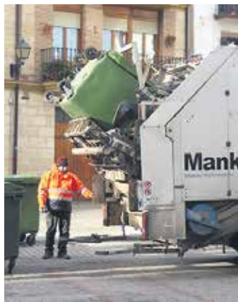
Hondakinak bilketa egiten.

Gaurko egunez, 1993an, Sakanako Mankomunitatea hiri hondakinak herriz herri biltzen hasi zen. Horretarako Durangoko Garbile enpresa kontratatu zuen. Bilketa lanean sei pertsona hasi ziren, 2 gidari eta 4 peoi. Kamioi bat Irurtzun eta Arbizu artean ibiltzen zen eta bestea gainontzekoetan. Etxarri, Bakaiku eta Iturmendi ez ziren sartu.