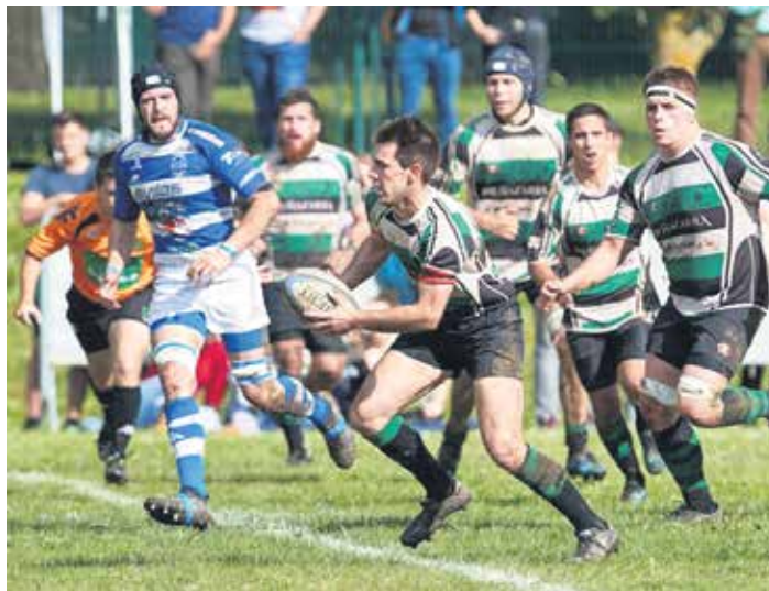
La Unica talde nafarra lanean ikusteko aukera izango dugu bihar Etxarrin. LA UNICA

Sakanako errugbi sustatzeko lan handia egiten ari dira azkenaldian honetan eragile ezberdinak. Esaterako, Sakanako Mankomunitateak Sakanako neska-mutilei zuzendutako errugbi campusa antolatu du aurtengoa, nobedadea. Nafarroako errugbi federazioak oso begi onekin hartu zuen campusa antolatzea-