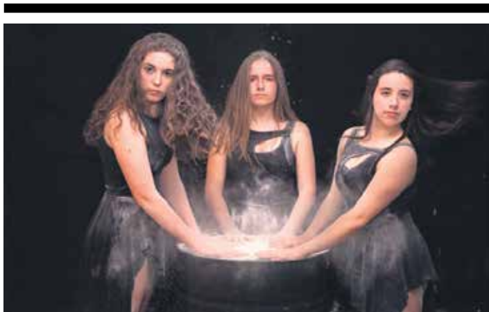
Zarata ikuskizuneko dantzariak. NAGORE DIAZ