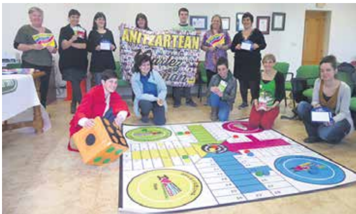
Aurtengo sentsibilizazio kanpainan ikastetxetako ordezkariak izan ziren.