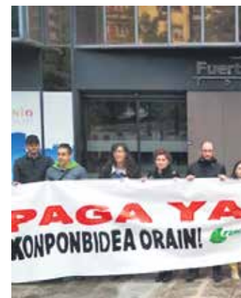
Trimaneko langileen protesta. LAB

Nafarroako Gobernuak ERSISI proiektua Tuteran eta Sakana mendebaldean garatzen ari da, gizarte arloko ikerketa eta berrikuntza proiektu gisa. Europako Batasunaren laguntza du horretarako.