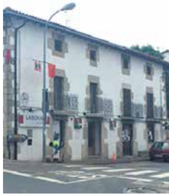
Pikuxar berria hartuko duen eraikina.

Aro berri hori hastear da eta horretarako proiektuarekin bat egiten duten bazkideak behar dira. Gaurtik 15era arte bazkide egiteko epea zabalik izanen da, haiek sarrerako diru-ekarpena egiteko konpromisoa hartuko dute eta kontratu bat sinatuko dute. Hamabostaldi horretan zuzendaritza batzordekoak bazkide izan nahi dutenekin banaka