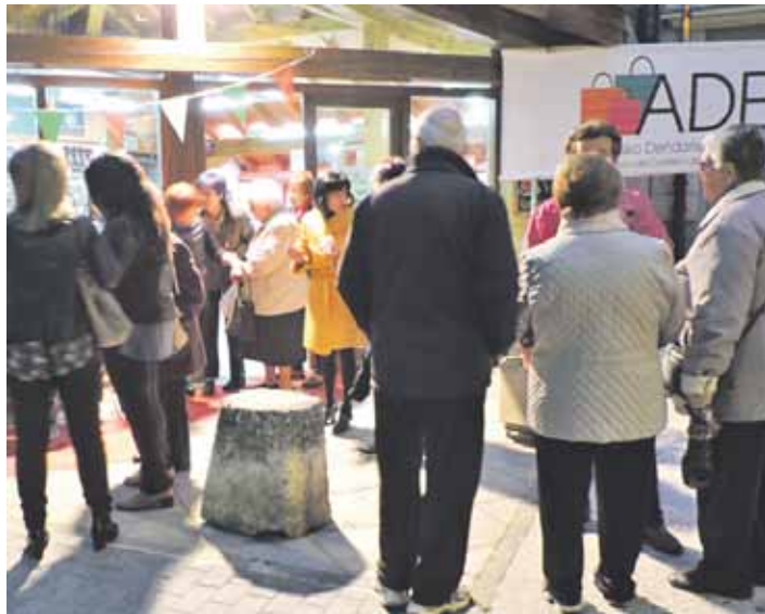
Makina bat jende atera zuen kalera merkataritza festak.