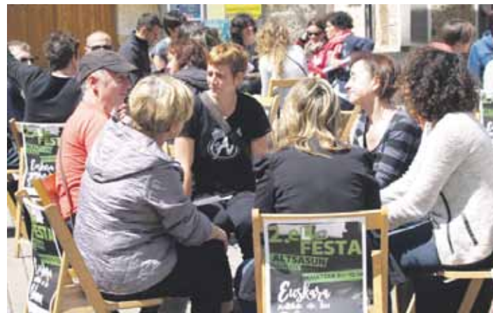
Maiatzean Altsasun antolatutako mintzodromoa.

Sakana LH institutuak hezkidetzaren jarduerak antolatzen ditu Emakumeen Egunerako eta Emakumeenganako indarkeriaren kontrako egunean. Aurten, gainera, Hezkuntza Departamentuak Berdintasun Plana ezartzeko 17 ikastetxe pilotuetako bat izateko aukeratu du. Departamentuaren asmoa da halako planak sare guztira 2018an zabaltea.