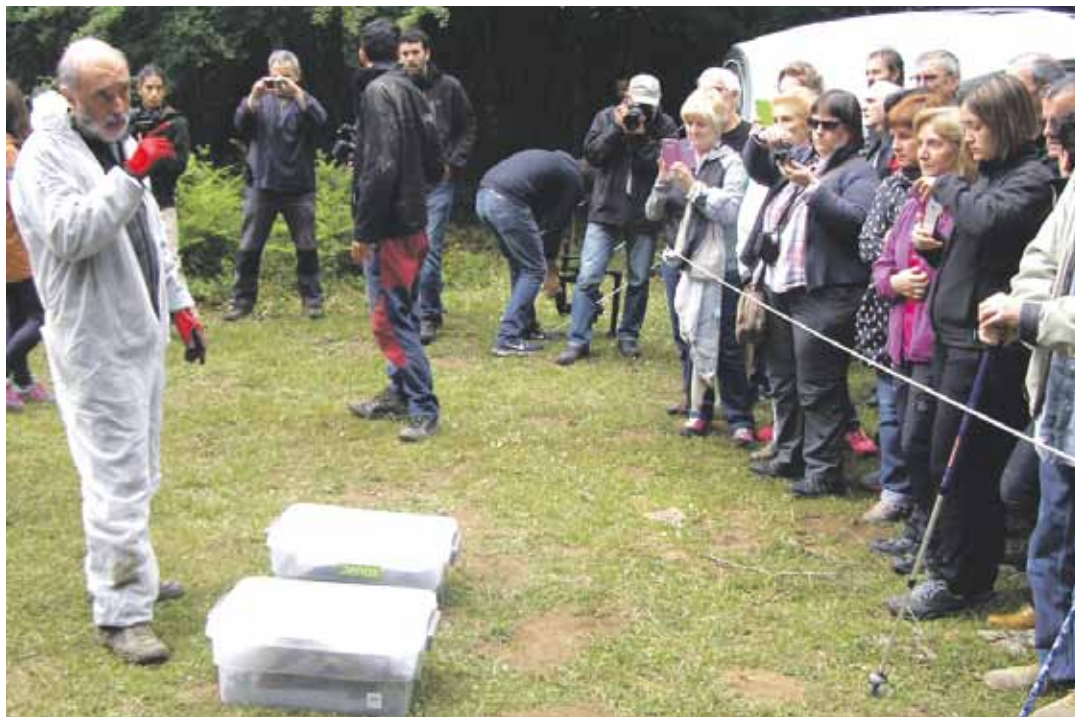
Otsaportillon 2016an ateratako bost hezurdura identifikatzeko daude, eta Urbasako sarioian 2015ean ateratako bat.