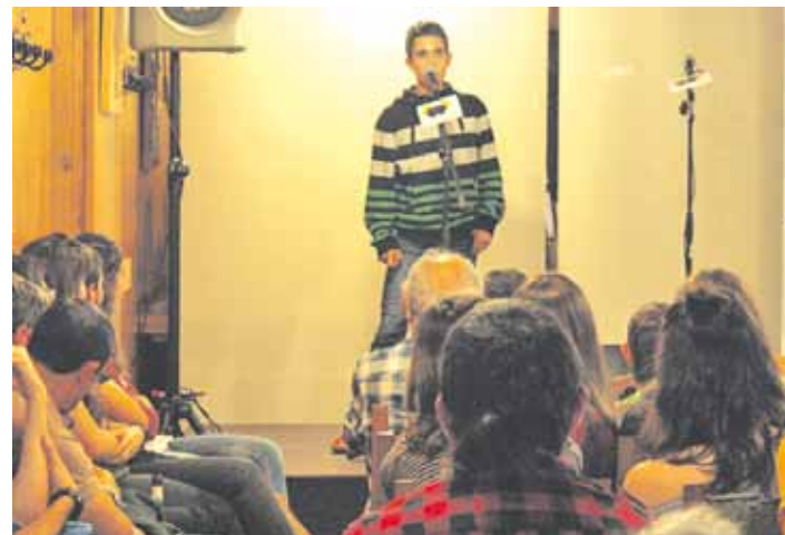
NAFARROAKO BERTSOZALE ELKARTEA