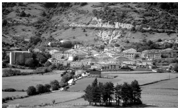
Lizarragako ikuspegia.