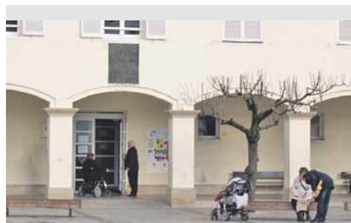
Irurtzango osasun etxera sartzen.

Asteartean bilera izan zuten Osasunbideako ordezkariekin Altsasuko osasun etxean. Gobernuordezkariak ordezkorik