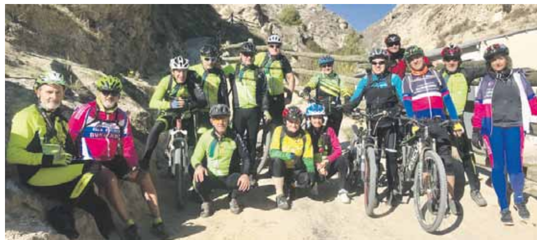
BARRANKA TXIRRINDULARITZA TALDEA