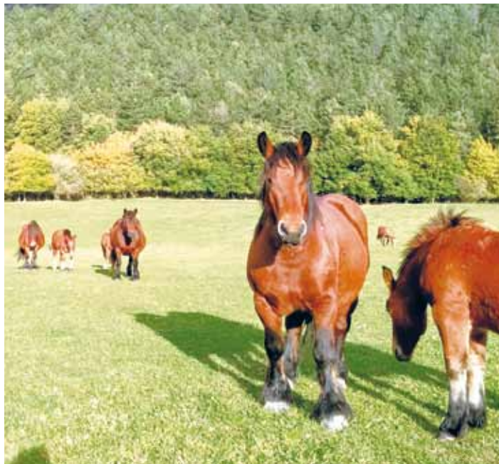
Gorka Mendiñetaren zaldiak. REBEKA MENDOZA

Behorrek eta moxalak izateaz aparte, haragizko behiak eta txekorrak ditugu. Txekorrak eta moxalak gizendu eta gero saldu