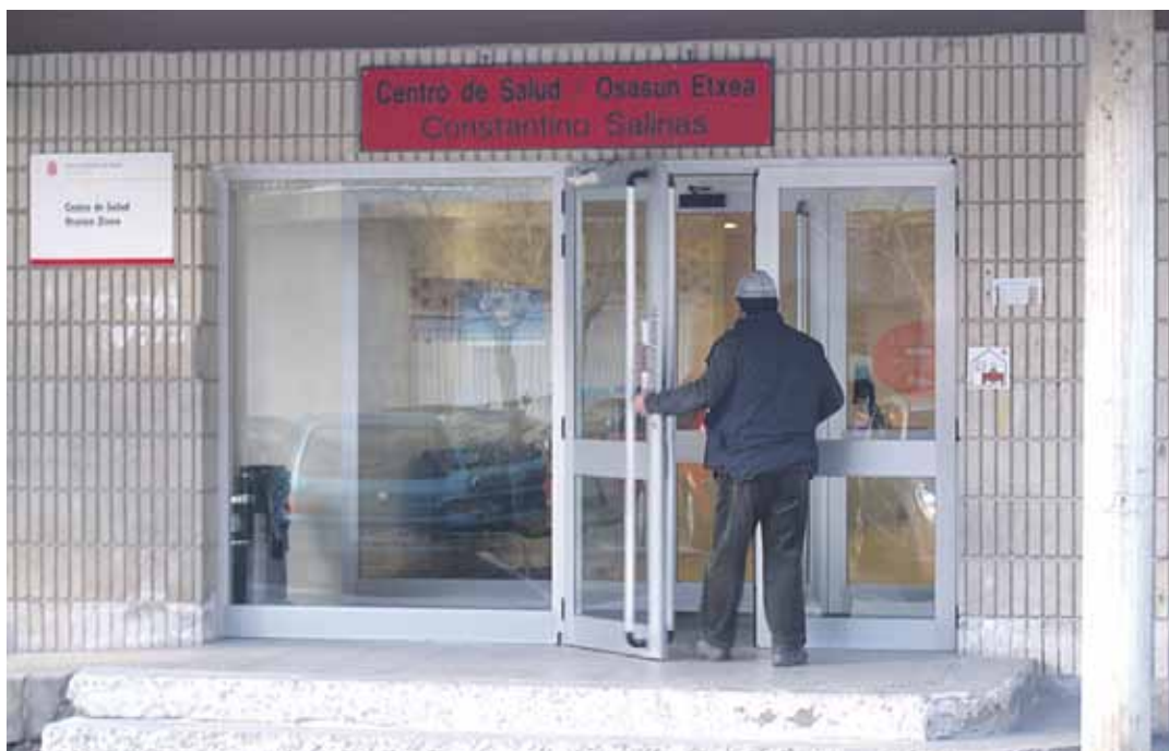
Jendea Altsasuko osasun etxera sartzen.