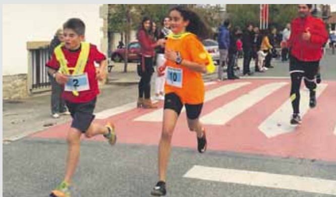
Txalo artean ibili ziren korrikalariek.

Irteera: Sakanako Herri Lasterketan, proba nagusian, 91 korrikalarik hartu zuten irteera eta 75 iritsi ziren helmugara.