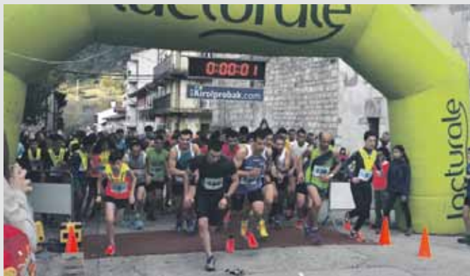
Eguraldia lagun, euria ez baina airea bidaide izan zuten korrikalariek.

Irteera: Sakanako Herri Lasterketan, proba nagusian, 91 korrikalarik hartu zuten irteera eta 75 iritsi ziren helmugara.