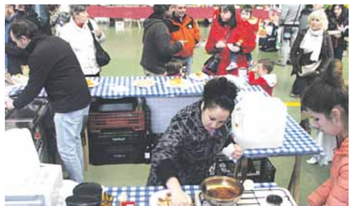
Azokaren osagarri, elkartasun afarian Siriako jakiak dastatu zituzten.

Ohi bezala, ateratako dirua ekimen bat laguntzeko izanen da. Oraingoan Sakana Harrera Harana taldearen aldeko azoka izanen da. Aurten ibarrean sortu den taldeak errefuxiatuen errealitatearen inguruan sentsibilizatzea du helburu. Sakana Harrera Haranakoek taldearen berri ematen. Gainera, errefuxiatu eremuen inguruko argazki erakusketa jarriko dute eta zenbait irakurgai ere.