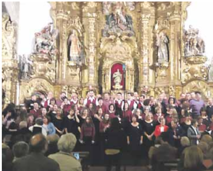
Larunbatean hiru abesbatza elkarrekin aritu ziren.

Elizkizunaren ondoren auzatea izan zen. Urteurrena ospatzeko bazkarian 50 bat pertsona elkartu ziren. Bestalde, asteburuan Bakaikuko elizako abesbatzaren historia laburbiltzen zuen argazki erakusketa ikusteko aukera izan zen. Larunbatean, urteurren ospakizunak hasteko, Paz de Ziganda eta Etxarri Aranatzko abesbatzen kontzertua izan zen. Akaberan bi abesbatzako eta Bakaikuko elizako abesbatzako kideek Maitia nun zira eskaini zuten. Eliza beteta zegoela egin zen musika emanaldia. Ondoren elkartera joan ziren abesbatzako kideak, guztien auzatea prest baitzegoen. Eta elkarrekin, giro onean, ordu txikiak arte kantuan izan ziren.