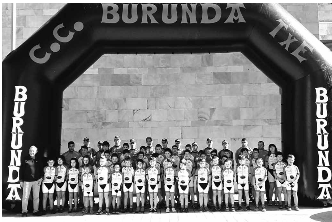
Burunda Txirrindularitza Taldearen 2017 denboraldiko aurkezpeneko argazkia, lortia parean.