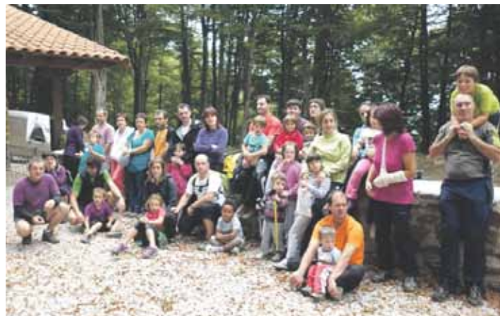
Sakanako ikastolen mendi taldea Auntzetxean.