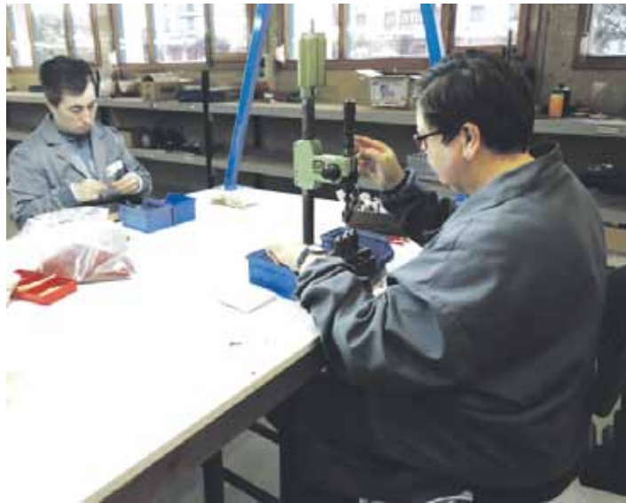
Tasubinsako langileak lantokian. İNÁKI BERASTEGI

Nafarroako Gobernuak eta Anfas elkarteak 1987an sinatutako akordio batean ostenan sortu zen Tasubinsa. Hala ere, aipatzekoa da, Lakuntzako lantokiak -900 metro koadroko lantegia- ordura arte martxan zegoen Altsasuko hezkuntza bereziko gela ordezkatu zuela 1987an: 1985era arte Lakuntzako Lanbide eskola izan zen eraikinean kokatu zuten gaur egungo lantokia. Irañeta, Uhartea Arakil, Arruazu, Lakuntza, Arbizu, Etxarri Aranatz, Lizarraga, Una-