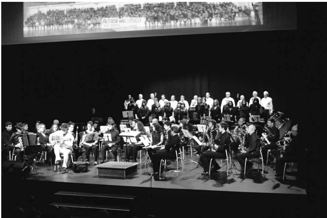
Haize Berriak bandak urte hasieran Flamenko etxea kontzertua eman zuenekoak.