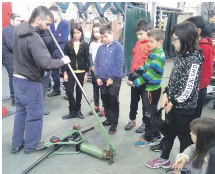
Ikasleak, burdina nola tolesten den ikasten. UTZITAKOIA

Lehen esperientzia hura positiboa izan zen eta institutu guztia ikasketa-zerbitzu proiektuaren