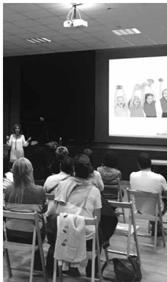
Ikastetxeetako ordezkariak bilduta. SGA

Gorostiagak azaldu digunez, ikastetxeetako jangelak tokiko ekoizleak eta tokiko ekonomia sustatzeko aukera izan daitezke. Gaur egun ibarreko jangelez catering enpresak arduratzen