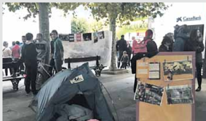
Errefuxiatuen kanpamenduen itxura hartu zuen Uharte Arakilgo plazak.

Zaleen babesa: Uharte Arakilen bildutakoen txaloak eta animoak jaso zituzten korrikalariek.