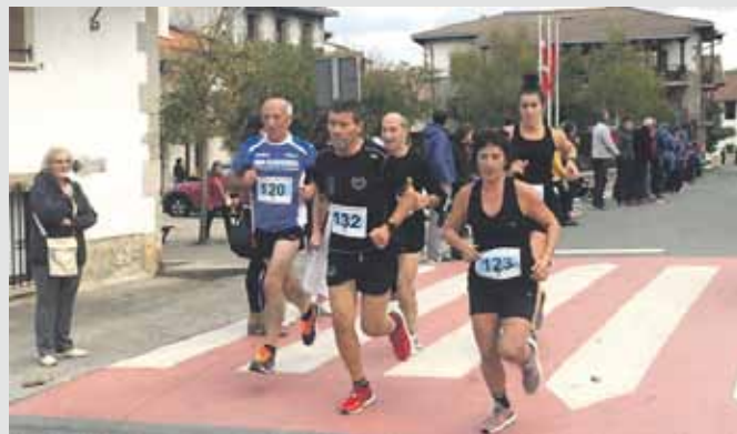
Gazteek eta beterranoek, denek izan zuten tokia.

Kadeteak: Kadete mailako korrikalariek zirkuituari buelta bat eman behar izan zioten (4 km).