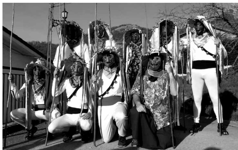
Unanuko ihotea Italia hegoaldean erakutsiko dute asteburuan.

Unanuarrek atzo abiatu ziren Italiarantz eta etzi bueltatuko dira. Joseba Imazek esan digunez, bigarren urtez segidan parte hartuko dute unanuarrek konbentzioan.