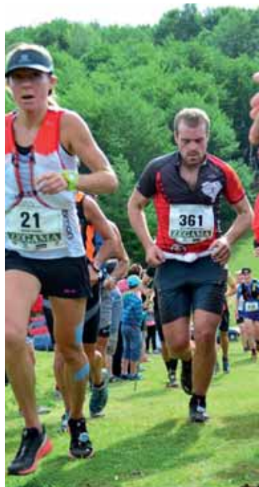
Munarriz, txalo artean gora. TXIRBIL

Zegama-Aizkorri mendi maratoia (42,195) ikusgarria eta arrakastatsua izan zen beste behin. Aratz, Santi Spiritu, Aizkorri, Urbia eta Andraitz ikusgarriak gainditu behar izan zituzten korrikalariek. Aurten eguzkia eta hego haize nahasia izan zituzten bidaide, eta lasterketako maldatan bildutako jendetzaren animuak lagun osatu zuten bidea. Tarte batzuetan, Tourraren antzera, zaleek osutako pasillo estetik igotzeko lanak izan zituzten.