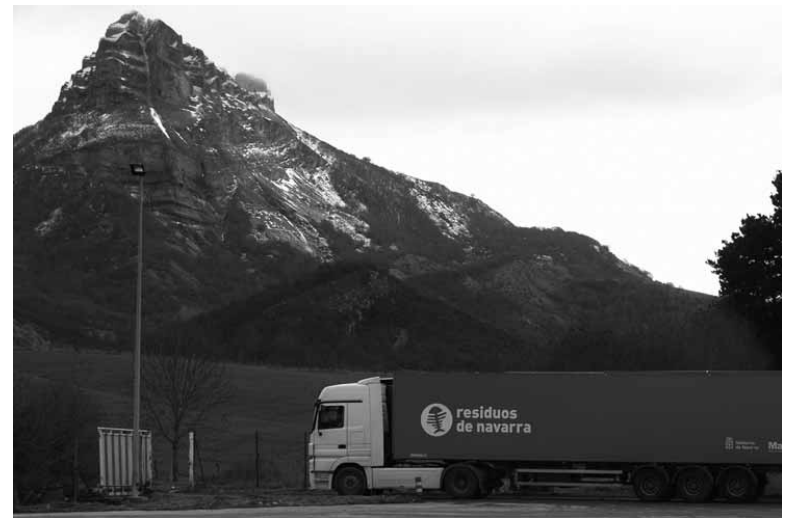
Kamioia Sakanako hondakinak Tuterara eramaten.

Horrekin batera, hondakinak biltzeko bi gune prestatuko ditu Mank-ek. Bien aurrekontua 240.000 euro ingurukoa da eta 56.082 euroko diru-laguntza du. Aurten Altsasuko Udalak Pilotajaukun duen biltegiaren ondoan garbigune bat eginen da. Hasiera batean 42.859,5 euroko inbertsioa aurreikusten zuen ibarreko erakundeak, baina, azkenik 200.000 euro inguruko lanak izanen dira. Egitasmoa aldatu eta handitu izanaren ondorioa da aurrekontua handitzea. Ziordian, bestalde, gar-