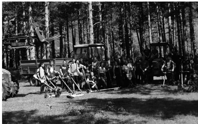
Boluntarioek pinudia eta ingurua txukuntzen aritu ziren.

toreekin eta bestelakoekin aritu dira lanean garilaren 27tik 30era etorriko den jendetzarendako dena prest egon dadin.