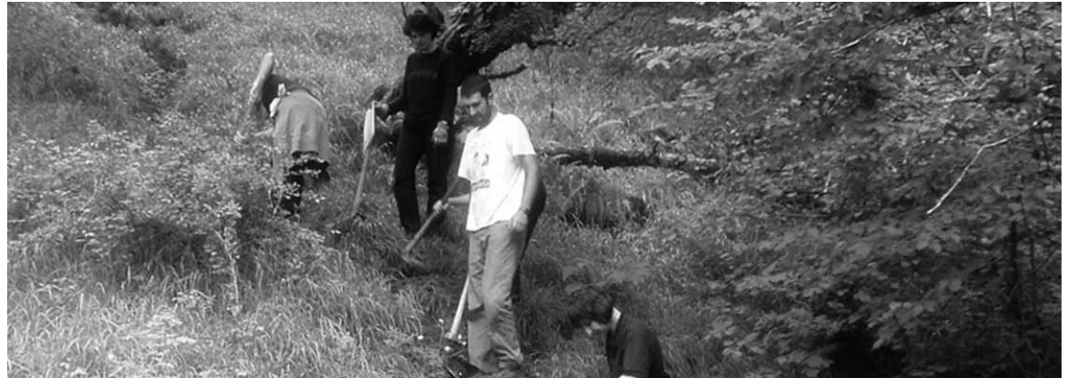
Bideetako bat konpontzen. Aurten launa gizon-emakume ariko dira Iturraskarriren. 12 urtetan 89 aritu dira. UTZITAKOIA

bide sarea txikiei ezagutarazi nahi diete, hurrek haien edertasunaz, erabilgarritasunaz eta aberastasunaz jabetu eta merezi duten errespetuaz eta zaintzaz sentsibilizatzeko. Horretarako, ikastetxeei zuzendutako txango gidatuak egingen dituzte. Ikastetxeei eta txikiei ere bide zati baten babesle izatea proposatuko diete. Onartuz gero, zati horretan txangoa egin eta bidea zein egoeratan dagoen jakinarazi beharko liokete mankomunitate-