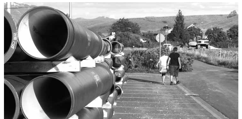
Ura eramateko hodiak Uharteko Arakilen pilotuta.

Lan horiek bukatuta, Mank-ek Urdalurko uharkako ura daraman sarea luzatzeko lanei helduko die