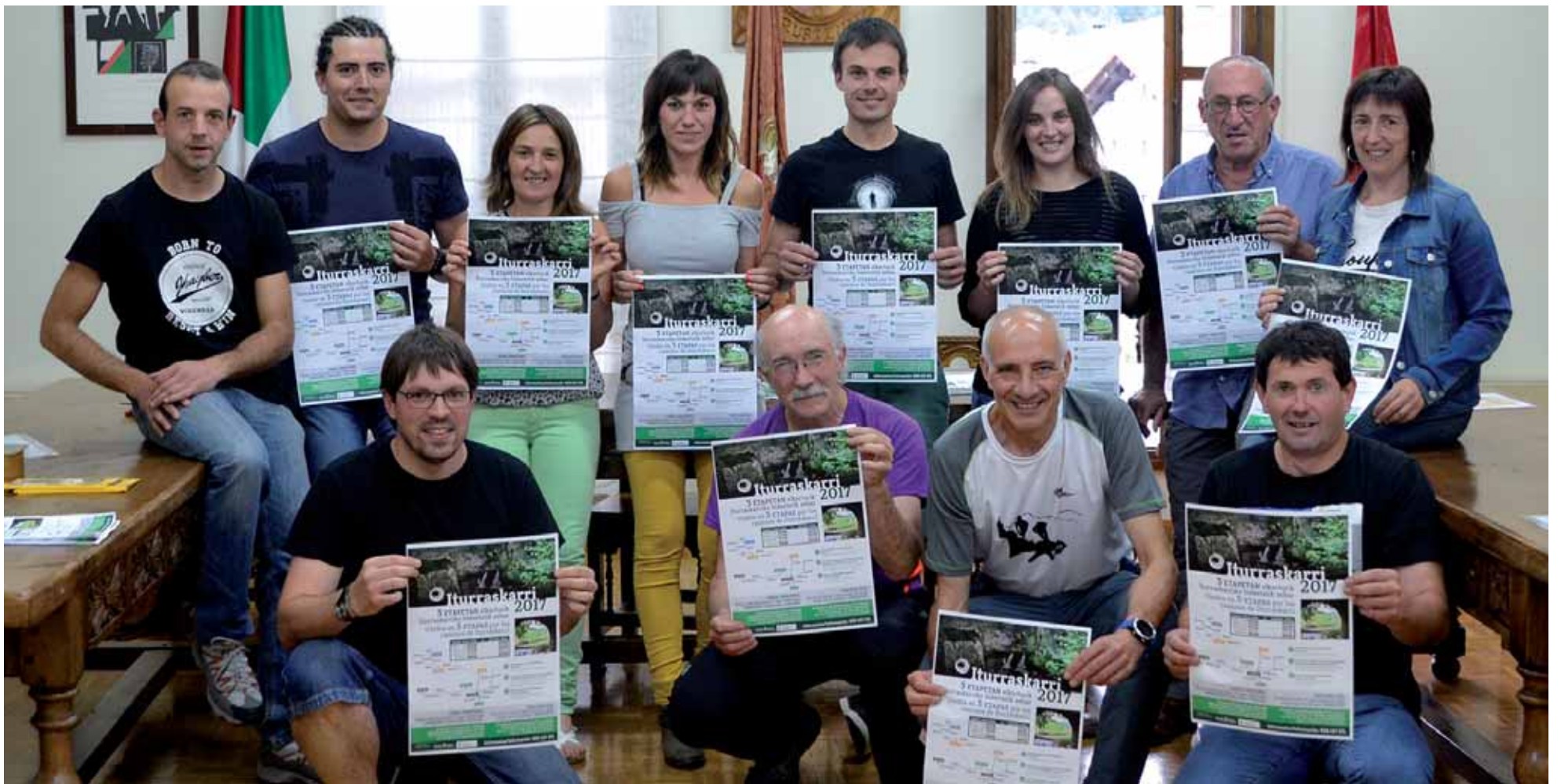
Iturraskarriko arduradunak, hura sustatzen duten udal ordezkariak, mendi elkartetakoak, mendi lasterketako antolatzaileak eta mendizaleak aurkezpenean.