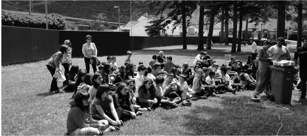
Greziako errefuxiatu eremuen berri jaso zuten eskola eta ikastolako ikasleek eta hainbat olaztiarrek. OLAZTI KULTURA

Eskolak, hango guraso elkarrekin, Olatzagutiko Udala eta Sakanako Mankomunitateko Anitzartean, kulturartekotasun zerbi-