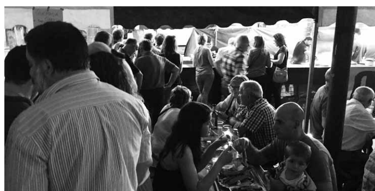
Uhartearrek ederki ase ziren Galiziako edari zein jakiekin.

Uhartearrak, eta Uharte Arakile-ra asteburuan gerturatu ziren makina bat sakandarrek gozatu ederra hartu zuten Galiziako itsasziak eta haragia janez. Plazako aterpea jendearen etengabeko emaria izan zen. Jatekoa Galiziako ardo txurriekin, Albariño eta Riveiroarekin bulkatu zuten.