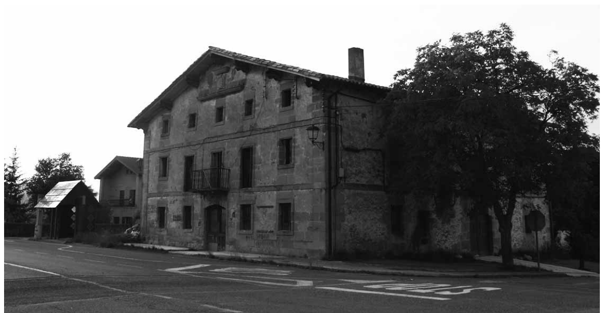
Urdiaingo bentako beheko solairuan udal biltegia eta gazteendako txokoa jartzea da proposamena.

Alkateak azaldu digunez, “hilerria betetzen ari zitzaigun. Pentsatzen genuen kanpo-santuak ezin zuela toki gehiago hartu. Kanpo santuak zati zaharra eta berria ditu. Azken hori betetze ar zegoen. Erabaki genuen zaharretik gorpuzkiak ateratzeko aukera ematea. Horretarako joan den urte osoa egon zen. Batzuek atera zituzten eta besteek bertan uztea erabaki dute”. Orain asmoa gainean lurra botatzea eta dena berdintzea da, “pixka bat txukuntzeko. Eta hor urteerarako tokia izanen dugu”. Kolunbarioak ere