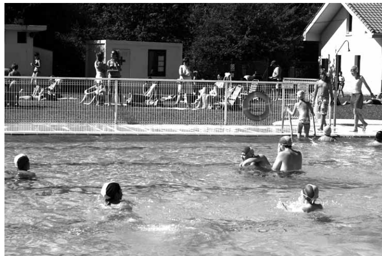
Altsasuarrek hilaren erdialdetik aurrera erabili ahaliko dituzte igerilekuak.

Altsasuko Udalak EAJren batzokian agertutako azken pintaketak gaitzesten zituen mozioa onartu zuen. Talde guztiek alde bozkatu zuten, abstenitu egin zen EH Bildu izan ezik. Bestetik, Altsasuko Gure Esku Dagok aurkeztutako mozioa EH Bilduren eta Goazen Altsasuren aldeko bozekin eta gainontzekoen abstentzioarekin onartu zen. Onartutako mozioan udalak "begi onez ikusten du garagarriaren 18ko galdeketa, eta are gehiago, dei egiten die herritar guztiei bertan parte hartzera, iritzia