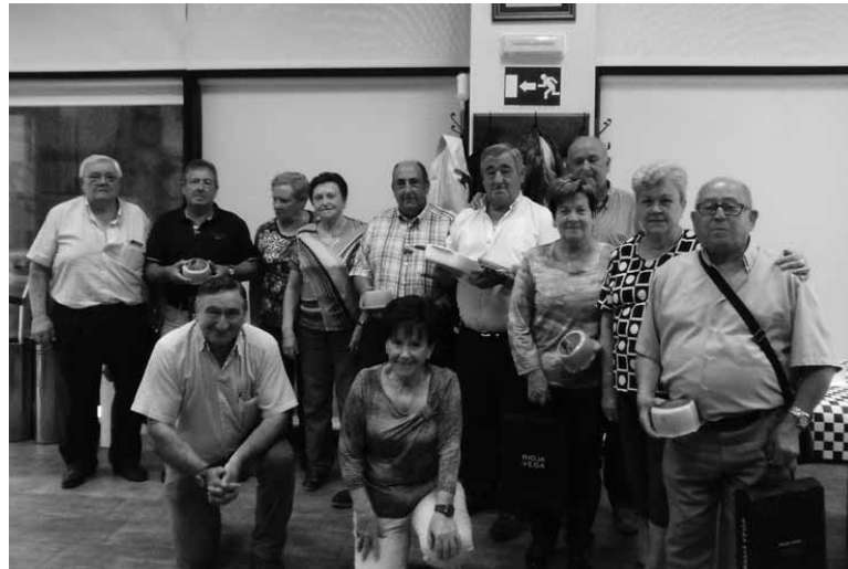
Jubilatu eta pentsiodun elkarten jokoetako sarituak.