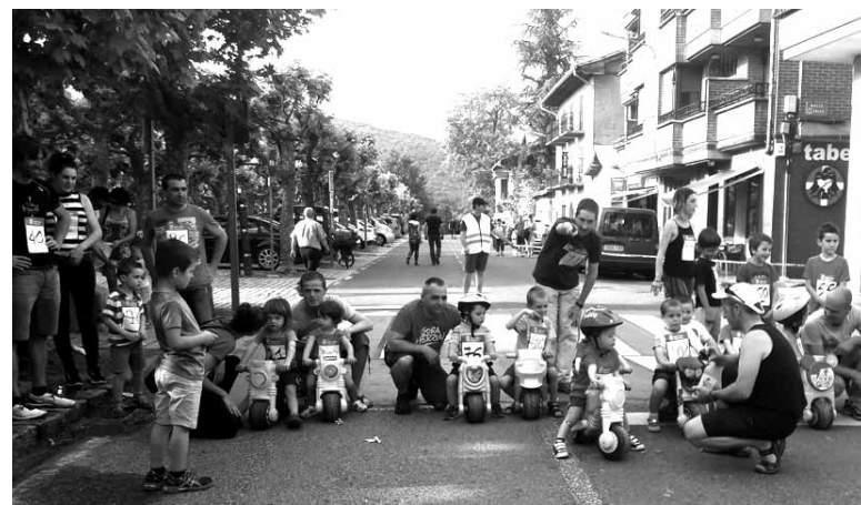
Txikiak euren motorrekin parte hartu zuten proban.