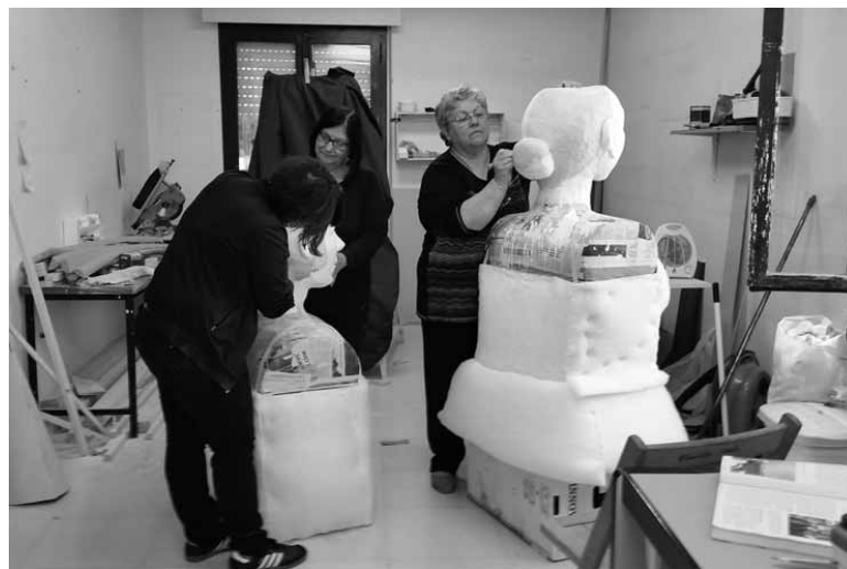
Erraldoiei forma eman dien hirukotea lanean.

Erraldodien izenak, zergatia eta haiek ezagutu nahi dituenak bihar du hitzordua plazan. Bide batez, Kultura Zerbitzuak erraldoiak dantzatzeko konpartsa osatzeko apirilko deialdiak eragirik izan duen jakiteko aukera izanen da. Bi hamarkada pasa erraldoirik gabe eman ondoren, berriro bueltan dira Etxarri Aranazko erraldoiak. Udalak buruhandiak duela bost urte konpondu zituen.