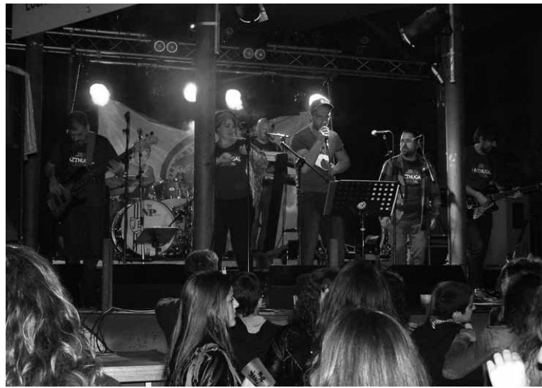
Altxatu eta Zopilotesekin, kontzertuko gunea goraino beteko da.

23:00etan Altxatu eta Zopilotes Txirriaos.