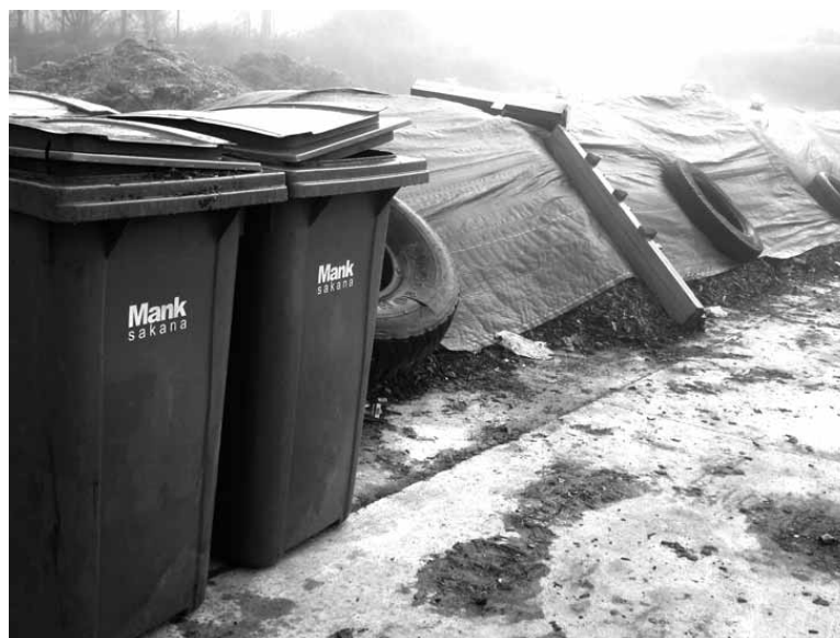
Hondakindegian konpost pila bat.

Konposta gure lurren kalitatea hobetzeko erabil daiteke. Loreontzietan erabiliz gero lur normalekin nahastu behar da, 3 zati lur konposteko bat proportzioa zainduz, bestela landarea erreko litzateke. Baratzetan erabili nahi duenak lurraren gainean zabaltzarekin nahikoa du, hori bai, gehiezin 2-3 cm-ko kapa eginez.