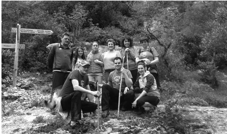
Atzera ere Plazaolako bide berdeen barna ibiliko da jendea igandean.

dagoenez, iganderako ibilaldiak antolatu dituzte. Lekunberri helmuga duten ibilaldiak hainbat herrietatik abiatuko dira. Etxeberrietik 9:45ean abiatuko da martxa, 15 km-ko luzera duena. Gainera, 11:30etik aurrera ibilbide animatu batek familia osoa parte hartzera gonbidatuko du. Lekunberri ibiltarietako programa zabal batez gozatzeko aukera izanen dute: txutxu tren, ipar martxa ikasi eta praktikatu, puzgarriak, pailazokak, globofexia-tailerra, artisautza-azoka eta beste.