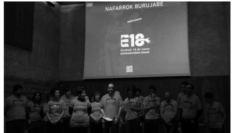
Nafarroako galdeketa guztietako galderak Iruñean ezagutarazi zituzten.

Orain arte antolatutako herri galdeketa “guztiak herritarren ahalduzko prozesu eredarriak, erabakitzeko nahiaren isla, eta demokratiaren ariketa argiak” izan direla azaldu dute Gure Esku Dagotik. Adierazpena babestu dutenek Nafarroan eginen diren herri galdeketa guztiei “sostengu osoa” azaldu diete. “Aukera ezin hobea izango da herritarren nahia adierazteko, erabakitzen hasteko. Elkarrekin etorkizuna eraikitzen lagunduko dutelakoan gaude.