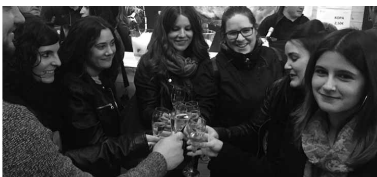
Cava festarekin batera, igandean, bertako produktuen azoka egin zen.

Cava festaren kokapena frontoetik elizaren dorre ondora aldatzarekin asmatu zutela esan du zinegotziak. "Nabaritu da eta asko. Esaterako, igande eguerdian joan den