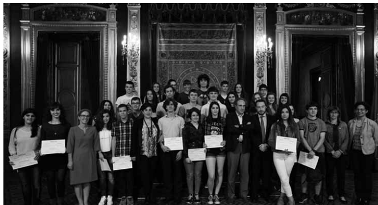
Saritutako 45 gazteetatik 33k jaso zuten aitortza asteartean.

Jakin-mina zikloa Jakiunde antolatu du. Haren helburua da akademikoki motibatuta dauden gazteen adimen-garapena eta garapen pertsonala azkartzea, adituek emandako hitzaldi eta erakustal-