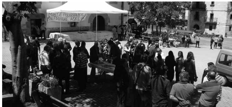
Arrano Beltza plazako bi zatitako sareak eta zorua berritzeko daude.

Bestetik mediku kontsultategiko isolamendua hobetzeko, bergailua eta leihoak aldatu dira eta baita margotu ere. Gutxi gorabehera, 10.000 euroko inbertsioa