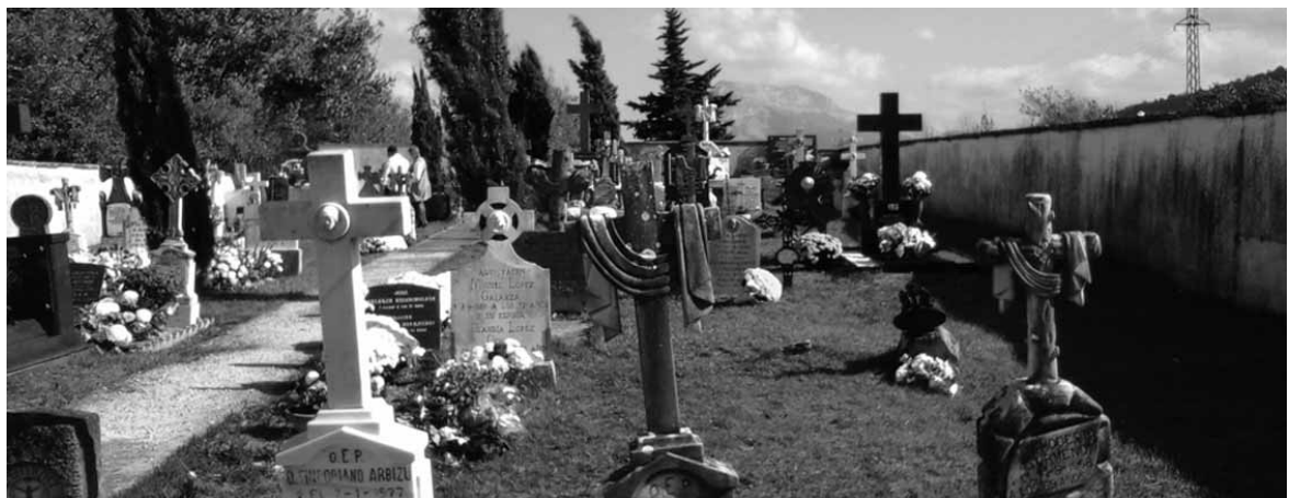
Iturmendiarrak hilerrian domu santu egunean.

Alkateak azaldu duenez, hartutako neurriak lurrean zuloa egi-