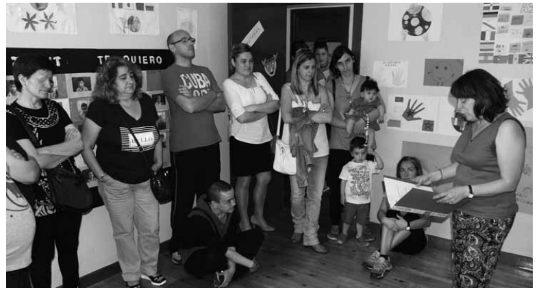
Gurasoek azalpenak eta kontakizunak entzuten.

Ikastetxeko atezainarena zen etxea erakusgela bihurtu dute. Geletan txokoak sortuz eta pasabidea aniztasunaren aldeko aldarria egiten duten irudi eta esku-lanez betez. Ikastetxeko ama talde bat arduratu da asteazkenetan