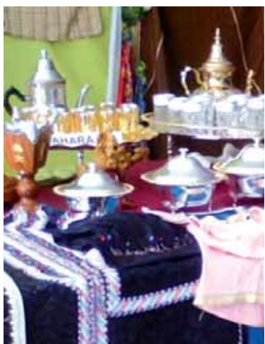
Arabiar komunitatearen erakusketa.