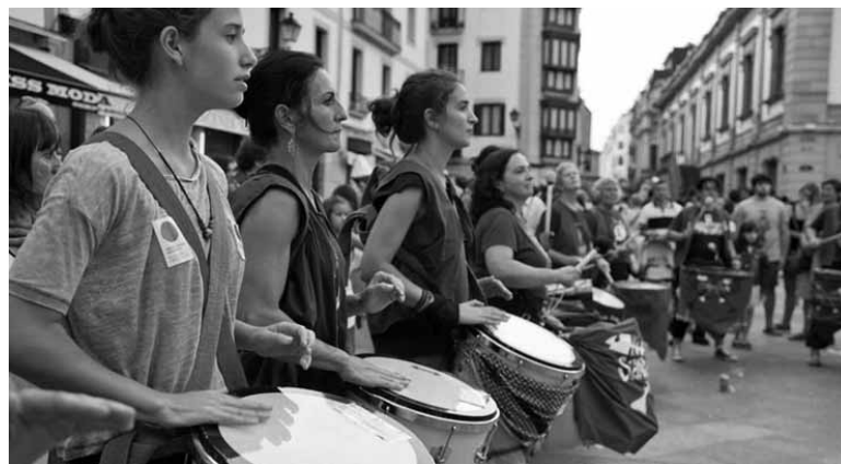
Batukada doinuak kolpe feministarekin. SARETIK

Hainbat batukadetako kideak aterpean ikasten ariko dira. Larunbatean, 19:30ean, ikasitakoa kalejira batean erakutsiko dute