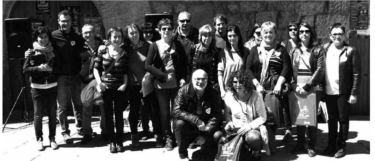
Omenduen eta aita-amapontekoen talde argazkia.

deskontua izanen dute. Bestela, Sakanako AEKn ohiko matrikulazioa egiteko aukera izanen dute irailean. Informazioa eskatu daiteke 948 468 258 telefonoan edo Itsasi euskaltegian. AEK-k udarako barnetegi eskaintza zabala du.