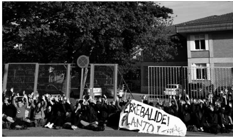
Ikasleek eserialdi batekin erantzun zioten errebalidari. INSTITUTUA

Errebalidei planto asanbladatik azaldu digutenez, "LOMCE