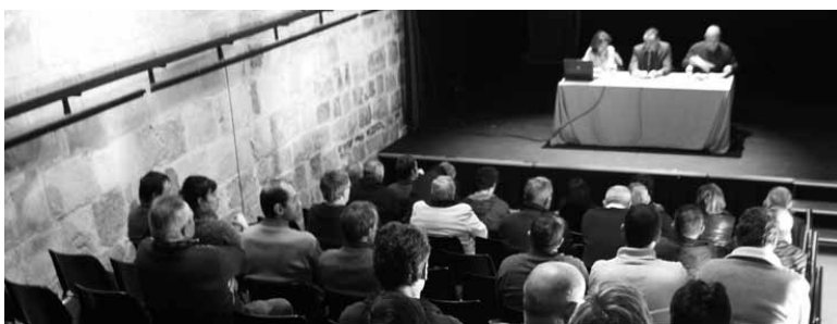
Aurretik Irurtzungo kultur etxean egindako beste batzar bat.

Euskera eta euskal sena gai hartuta ariko dira larunbatean, 9:30etatik aurrera kultur etxean