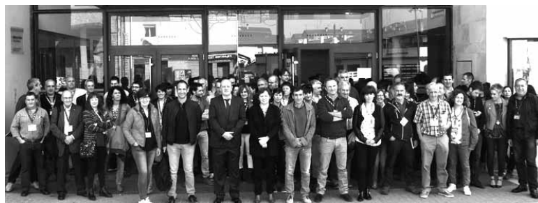
Planaren eraketan parte hartu zutenak jardunaldira sartu aurretik.

Kontseilariak esan zuenez, "sektore honek eginkizun estrategikoa du lurraldearen eragile gisa, oreka eta enplegua ematen