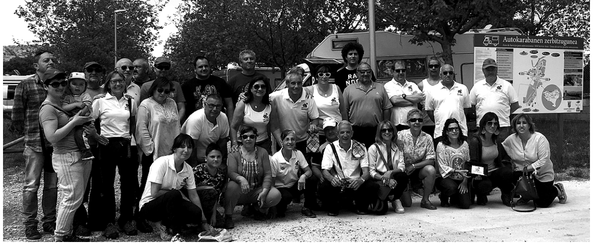
Tximeleta autokarabana elkarteko eta udaleko ordezkariak elkarrekin mustutako gunean.

Zerbitzu eskaintza zabala daukate eremu berri honetan. Gau bat ala bi bertan lo egiteko aukera ematen zaio hamabost autokarabanei, argia, ur garbia hartzeko aukera baita urzikina botatzeko lekua, igerilekuetako dutxak dituzte besteak beste. Udari begira udalekuek instalazioak aprobetxatu dai-