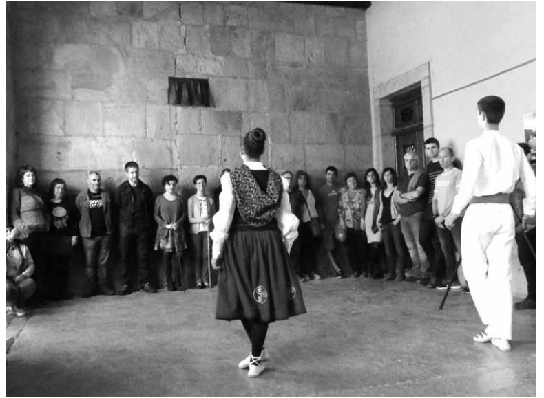
Dantzariak agurra dantzatu zieten udal-agintariei.

Etxarri Aranatz eta Arrankudiaga-Zollo senidetu dira. Bi herriak izan ziren estatus politikoari buruzko herri galdeketak egiten lehenak, 2014an. Senidetuta bi herrien artean lotura eta harreman kulturalak eta pertsonalak ezarriko dituzte, Euskal Herriak gaur egun duen lurralde-banaketa gainditzen lagunduko dutelakoan