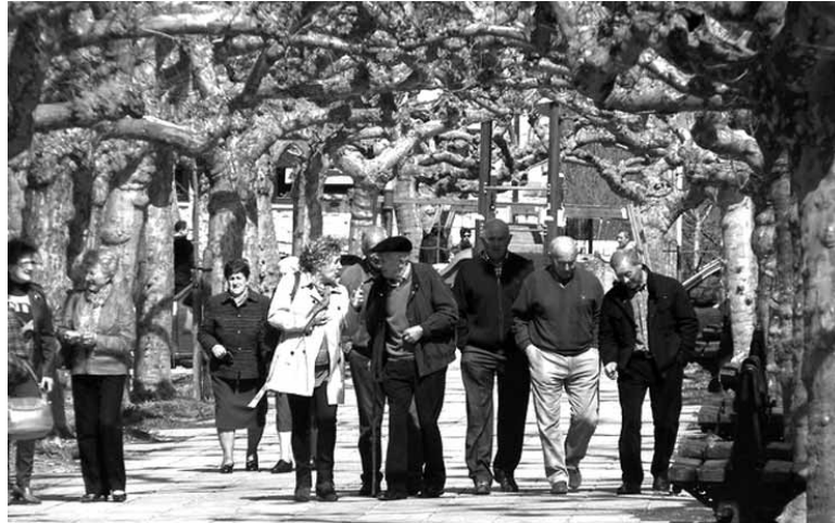
Herritarrak Etxarri Arantzeko plazatik pasean.

Etxarri Aranatz, maiatzaren 3an, 4an, 8an eta 10ean, 17:00etatik 19:00etara, Gure Ametsa Erretiratuen Klubean