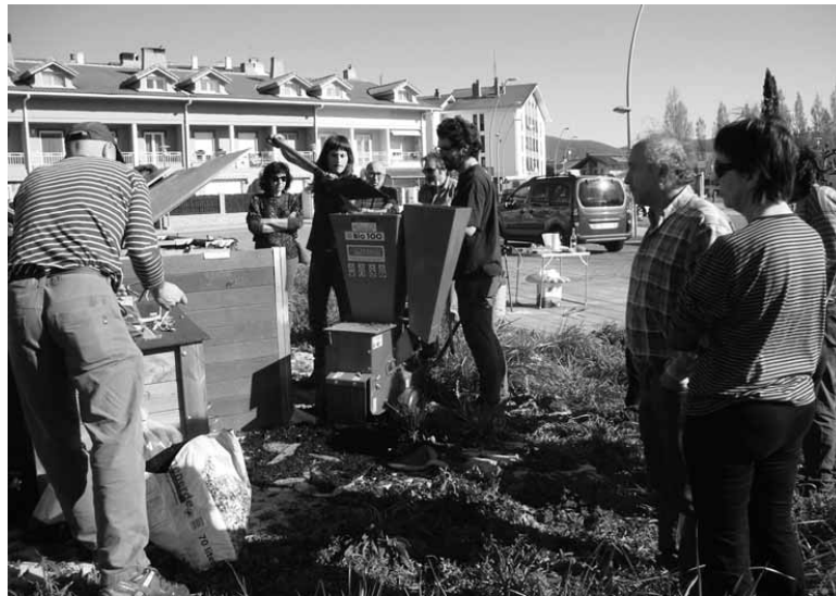
Dagoeneko altsasuar batzuk materia organikoa konpost bihurtzen dute.

Altsasuko Udalak herritarrak 5. edukiontzia erabiltzeko izen ematera animatu ditu. 2.260 etxebizitzetatik soilik 93k eman dute izena