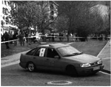
Maniobrak ikusgarriak izaten dira.