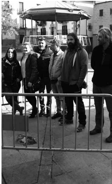
Herritarrak hilaran Gure etxean.

Jacques Audiard zuzendariaren Les Frères Sisters filmaren zati bat Urbasa-Andian filmatuko da garagarrila edo garilean, aste bat inguru eta Altsasun, atzo castinga egin zuten