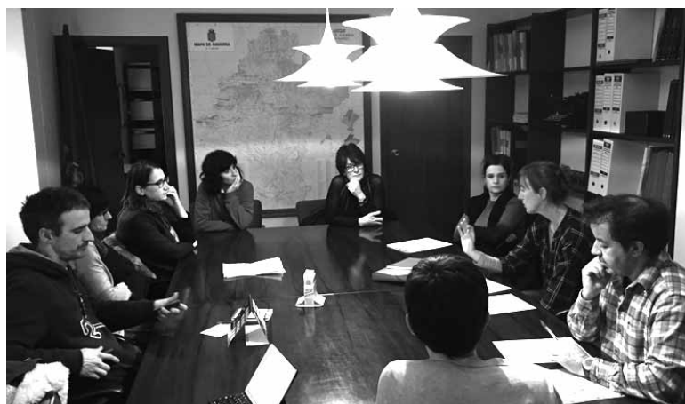
Gurasoen Euskara Batzordearen aurreneko ekimena da txangoa.

Haur eta gurasoak Bernoako galtzada hilaren 25ean, larunbatean, 15:30ean ezagutuko dute, Urrizitik abiatuta