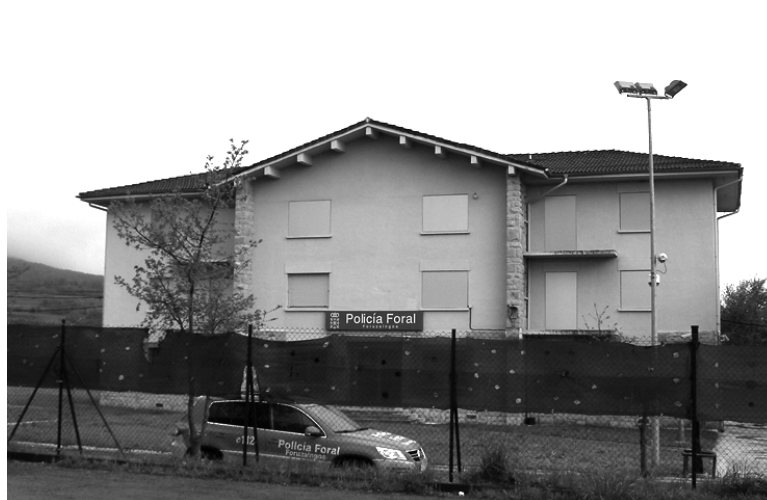
Altsasuko polizia etxea.

Foruzaingoak Altsasuko polizia etxearen eremua Sakanaz aparte, Larraun, Lekunberri, Arantzeta eta Leitzaldea da. Foru poliziak jakinarazi duenez, joan den urtean 277 delitu salaketa bideratu zituen, 2015ean baino sei gutxiago. Eskualde horretan egiten ziren salaketen ia bi herenak, %62,09, Foruzaingoak bideratu zituen. Beste heren bat, %31,41, Guardia Civilak bideratu zuen. Gainontzeko salaketak beste poli-