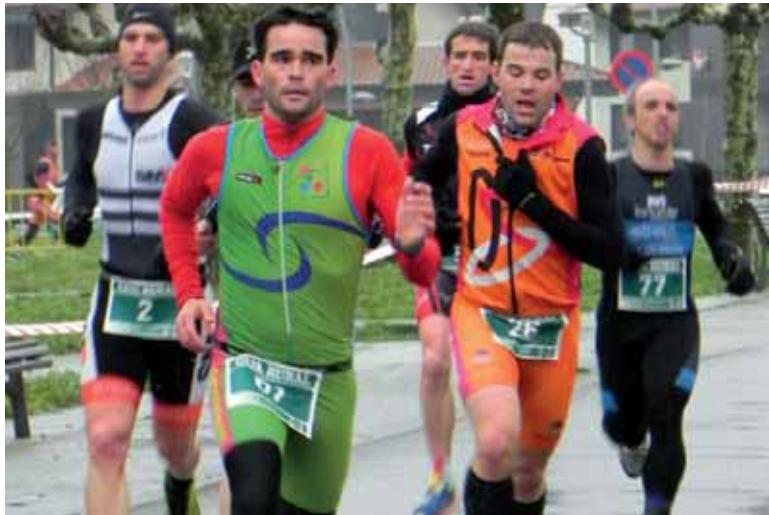
laz bertan behera geratu zen proba, elurragatik. Bihar eguraldi ona espero da.

VII. Altsasu Duatloia jokatu da bihar, larunbatean. Goizeko 10:30ean Nafar Kirol Jolasen Duatloi probaren txanda izango da, eta 15:45ean nagusien proba jokatu da. Altsasukoa, aldi berean, Nafarroako Sprint Duatloi Txapelketa izango da