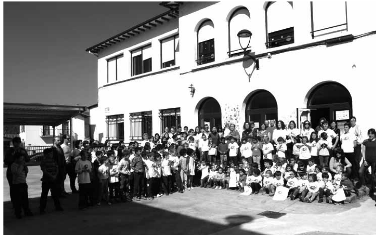
Eskolako 116 ikasleak eta 75 familien ordezkarietako batzuk festa iragartzen.

Herri bazkaria ere izanen da. Hartan izena eman nahi duenak astelehenera arteko epea du. Hurrendako (4 euro) eta helduenda-