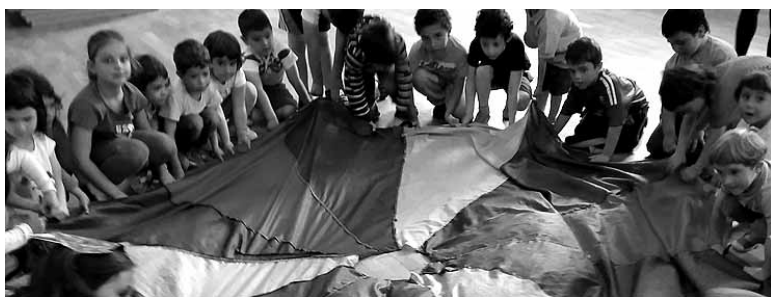
Haurrak ludotekan. ARTXIBOA

Asteleheneetik ostiralera izanen da izen ematea, doako 012 telefonora hots eginez edo udalaren web orrian sartuz, www.altsasu.net