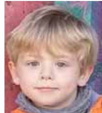
Adei Adei, zorionak maitia, zue onduen nola fan dan denbora. Muxu goxo goxuek amaxon eta eittan partetik.