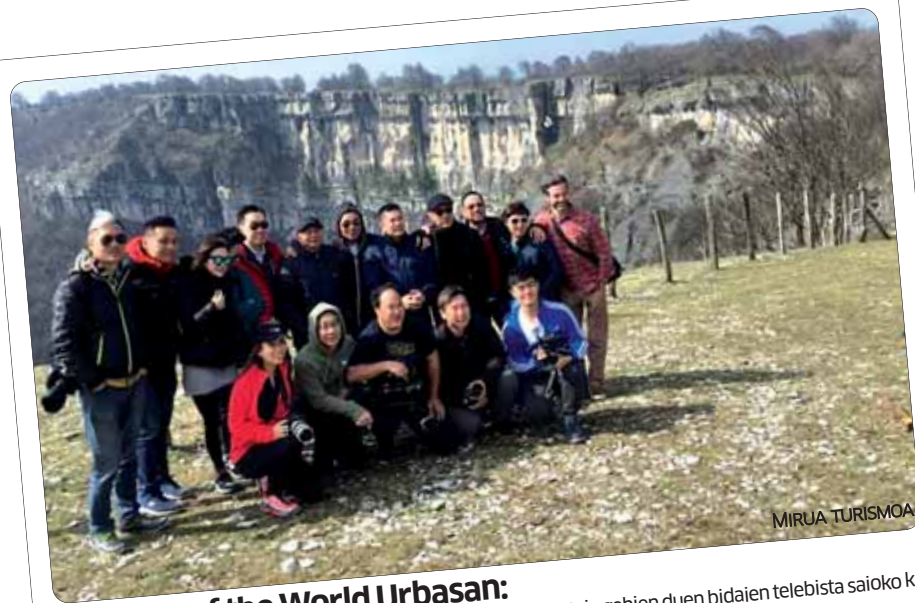
The Edge of the World Urban:

Sakanako Mirua Actividades Turísticas enpresak Txinan audientzia gehien duen bidaien telebista saioko ki-deak gidatu zituen Urbasatik barna. (375 milioi ikusle).