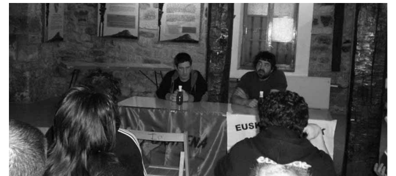
Askapenakoak brigaden berri emateko hitzaldiak egingen dituzte.

Europako brigaden eskaintzan Herrialde Katalanetakoari Britainia-ZAD eta Italiako brigadak gehitu zaizkie; “Kapitalaren Europar herri zapalduetatik sortzen diren alternatibak ezagutarazteko”. Azkenik, Askapenak Palestinarako brigada ere antolatu du; “sionismo gabeko Euskal Herria sortze bidean palestinar erresistentzia ezagutu eta Euskal