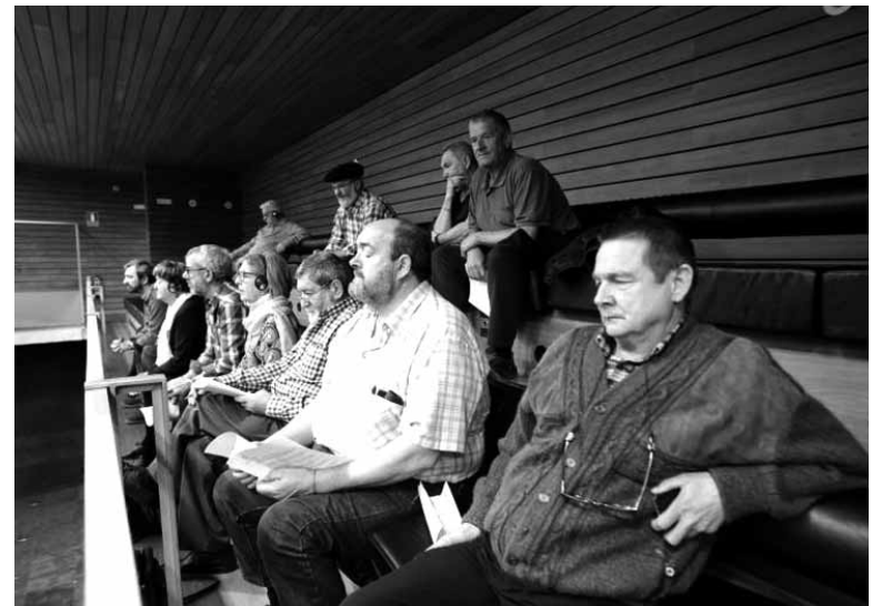
Pentsionistak Martxan-eko kideak parlamentuko eztabaidari adi. UTZITAKOIA