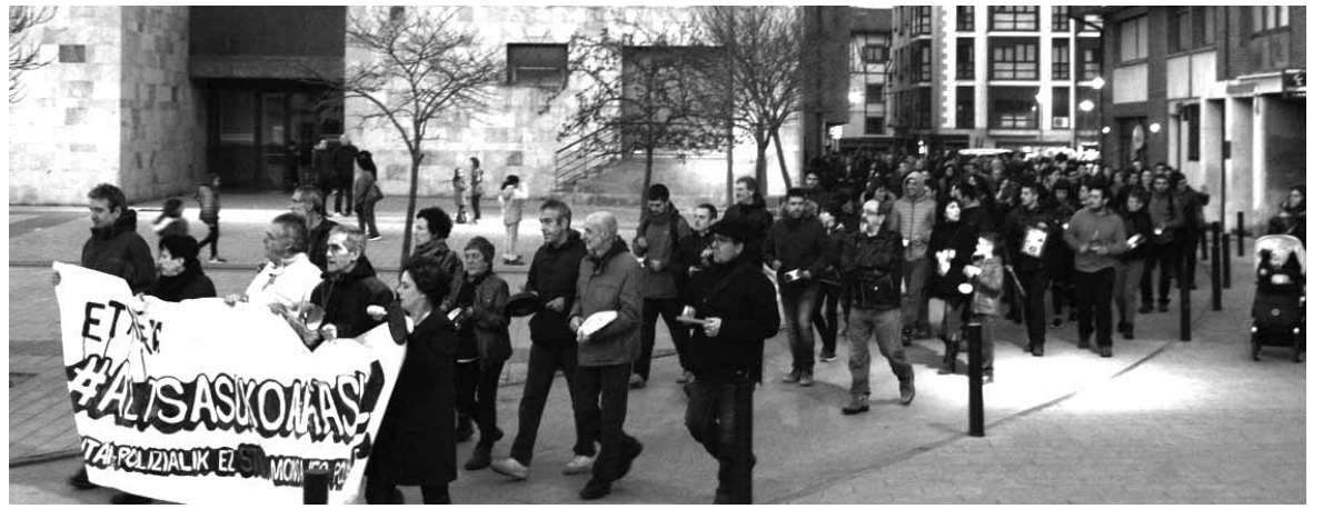
Hilabeteko 14. egunetan mobilizazioak egin dira, auzipetuen egoera gogorarazi eta salatzen.

Horren ondorioz hiru altsasuarrak espetxeratuengan Espetxe Erakundeak “kontrol zorrotza” ezarri duela azaldu zuten, “haien komunikazioak interbenituta daude (eskutitza guztiak fotokopiatuta, telefono elkarrizketak grabatuak, mintza-tokikoak...) haien oinarriko intimitatea hautsiz”. Salatu zuten, “bidean galdu eta inoiz iritsi ez diren eskutitzak” daude. Baita, “izapide akatsak direla eta baimendu gabeko deiak, bisean bisez sartzean bai fami-