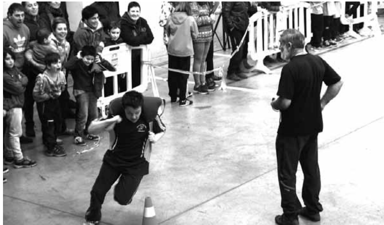
Proba konbinatuetan eta sokatiran lehiatuko dira, igandean, Altsasun.

Kimuen mailako proba konbinatua, haur mailako proba konbinatua, kadete mailako proba konbinatua eta, azkenik, haur eta kadete mailako sokatira probak jokatu dira. Jakina denez, Sakana Andra Mari eta Iñigo Aritz ikastoletatik sortutako 15 talde ari dira bertan lehiatzen, Berriozar, Baztan, Araitz-Betelu, Igantzi, Ultzama, Betelu, Ibero eta Antsoaingo taldeekin batera.