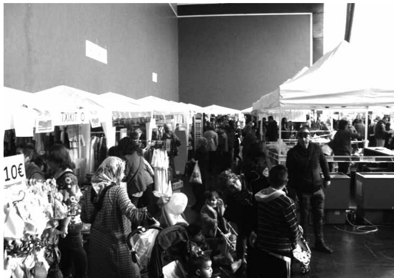
Maukak jende ugari erakarri zituzten Stock azokara.