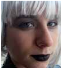
Onintza eta Lexuri Dantza eta txiruliruli Ondo pasa zuek bi. Etxekoak

info@dekovenavarra.com • www.dekovenavarra.com Ibarrea industrialdea, 9 pabiloia • ALTSASU Telf./Faxa: 948 468 360 • Telefono mugikorra: 690 641 860