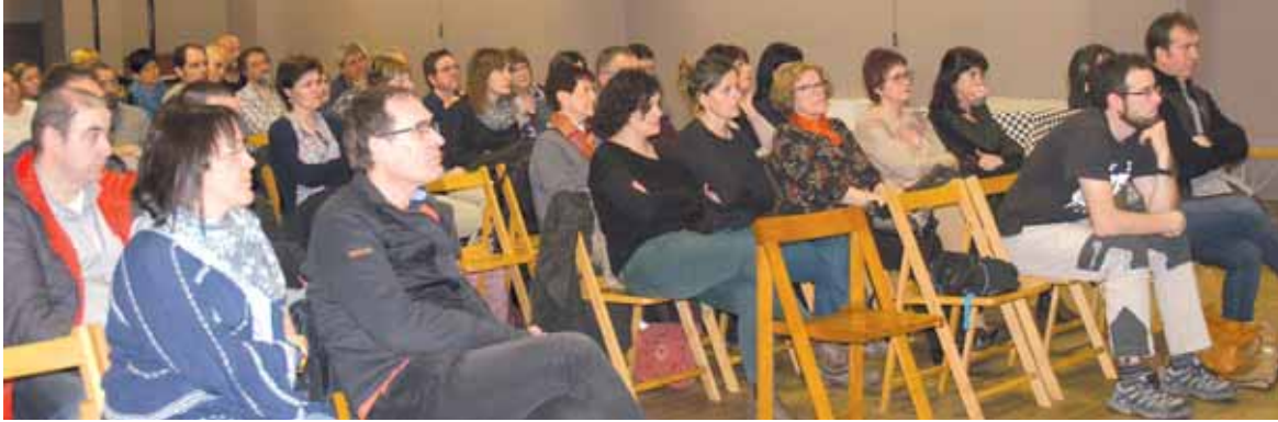
Sakanako 7 herrietako Gure Esku Dago-ko ordezkariak.

Garagarrilaren 18an erabakitze eskubidea praktikan jarriko dute Irurtzun, Lakuntza, Arbizu, Urdiainen, Altsasun, Olaztin eta Ziordian