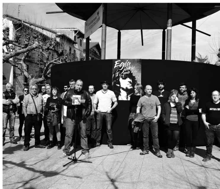
Zabalaren senide eta lagunek aurkeztu zuten ekimena.

Haren heriotzaren inguruko egia aldarrikatuko dute 20. urteurrenean, hilaren 25ean, 20:00etan, eginen den manifestazio batean