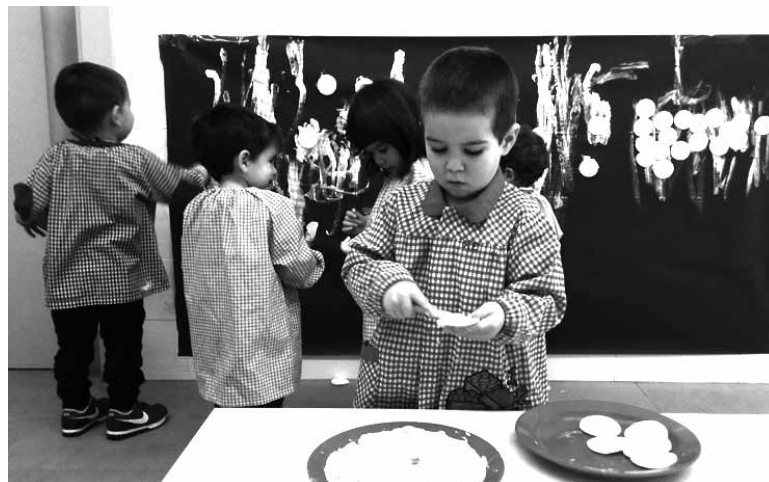
Uharte Arakilgo pausoka haur eskolako umeak.