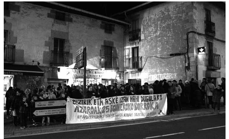
Emakumeen kontrako indarkeriaren aurkako kontzentrazioa Irurtzunen.

ordenantzaren kontra egiten duela: "euskaraz pairatu duen jazarpena onartzen du, euskarari lehentasunezko tratamendua emanez". Sindikatuko kideen iritziz, "Geroa Baik, PSNren babesarekin eta Goazen Altsasuko isiltasunarekin, euskararen eta hizkuntza eskubideen aurkako erabaki bat hartu du, langileok euskaraz lan egiteko dugun eskubideen aurka eta Altsasuarrek zerbitzu publikoak euskaraz jasotzeko duten eskubidearen aurka". LABekin batera, EH Bildu, Hizkuntza Eskubideen Behatokiak eta EHEK aurkeztu dizkiote alegazioak udalaren erabakiari.