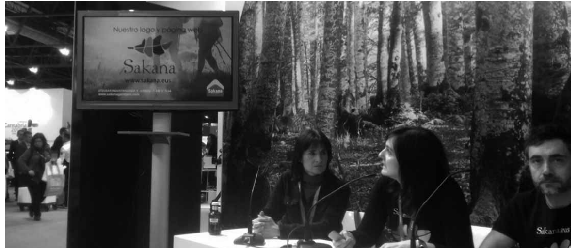
Sakanaren berri Fitur azokan eman zuten.

Donostiako turismo feria, Sevatur, eginen da gaurtik igandera. Nafarroak bere stand izanen du eta han tokia izanen du ibarrak. Alde batetik, Bidelagun turismo elkarte izanen da eta, bestetik, Plazaola turismo partzuergoa. Donostia, Gipuzkoa eta gainontzeko tokietako publikoari Sakanako turismo eskaintza ezagutaraziko diote biek.