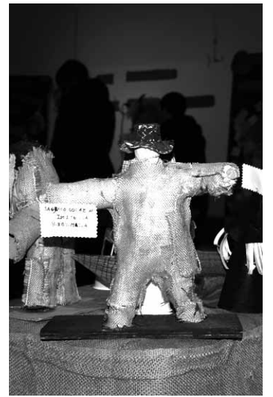
Erakusketako panpinak argazkian.

Erakusketa muntatzea nahikoa ez eta galtzak bete lan dituzte batzordeko kideek. Urtero moduan, ihoteen aurretik Intxostiapunta gaz-