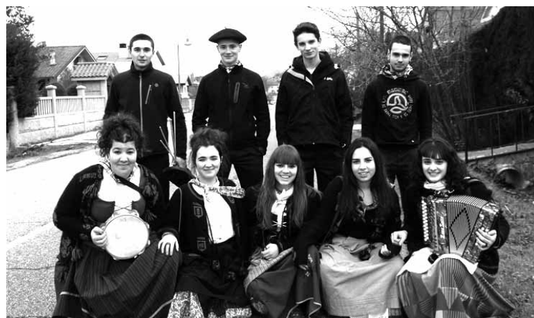
Kintoak trikitilariekin batera herriko sarreran.

kizunetan. Larunbatean eskean atera ziren, sagardotegira buelta egin zuten eta jai giroan ibili ziren asteburu guztian.