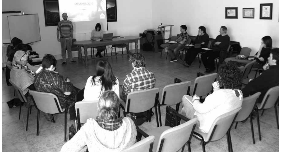
Aurreko bilera batean SGAREN arduradunen azalpenak jasotzen.

Datu horietatik abiatuta diagnosia egiten hasi ziren. Egileak aitortu zuenez “lantzea kostatu zaigu”. Diagnosian baliabideen inbentarioa osatu eta baliabide bakoitza irizpide batzuen arabera aztertu dute. “Baliabide asko daude. Batzuk turistikoak izan daitezke, beste batzuk ez”. Turismo informazio bulegorik ez izatean bisitarien inguruko datuekin arazoak izan dituzte. Egungo produktuen analisiarekin osatu zuten diagnosia, produktu bakoitza zein segmentutan eta zein egoeratan