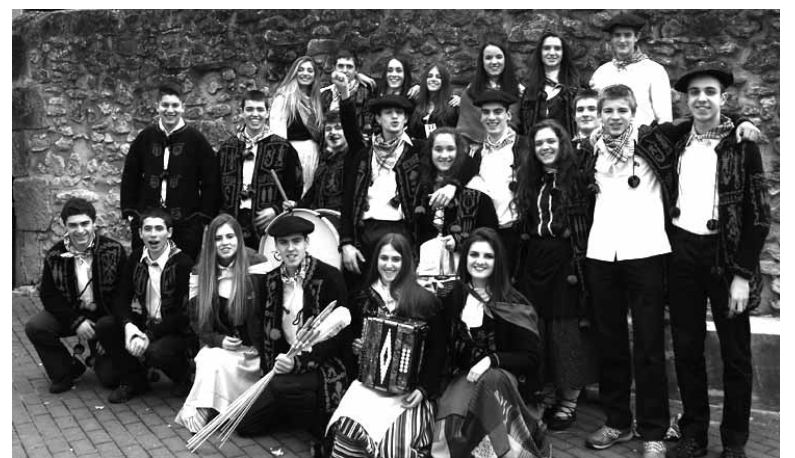
Urte desberdinetako kintoak elkartzen dira Iturmendin.

tean eskean ibili ziren eta pastak eta moskatela eskaini zizkieten herritarrei. Bazkari eta afariak elkartean egin zituzten.