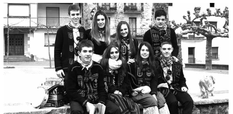
Ziordiko 8 gazte osatu zuten Ziordiko kinto-kuadrila.

kizunak Ziordian. Kinto gazteek, kintoek eta kinto zaharrek ospatu zuten festa, 8 ziordiarrek guztira. Baita beste kintadek ere.