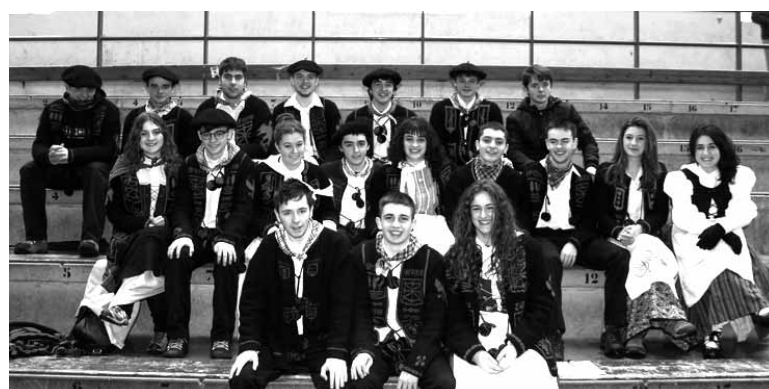
Urdiaingo kintoek kuadrila argazkia egin zuten frontoiko harmailetan

da. Igande eguerdian, aldiz, aurtengo kintoek zortziko dantzatu zuten. Zortzi zortziko dantzatu ziren guztira.