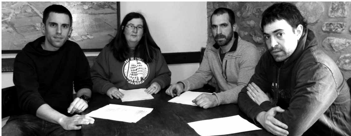
Bakaikuko zinegotziak bilera batean.

Udalak bakaikuarrek "parte hartzera gonbidatzen ditu. Denon artean nahi dugun herria erabakitzeke ezinbestekoa delako". Proposamenak bi hilabetez landuko dituzte. Maiatzaren hasieran aurkeztu eta bakaikuarrei aukeratzeko beta eman diete. Proposamen arabera aukeraketa eredu afinkatuko dute eta emaitzak batzarduz jakinaraziko dituzte.