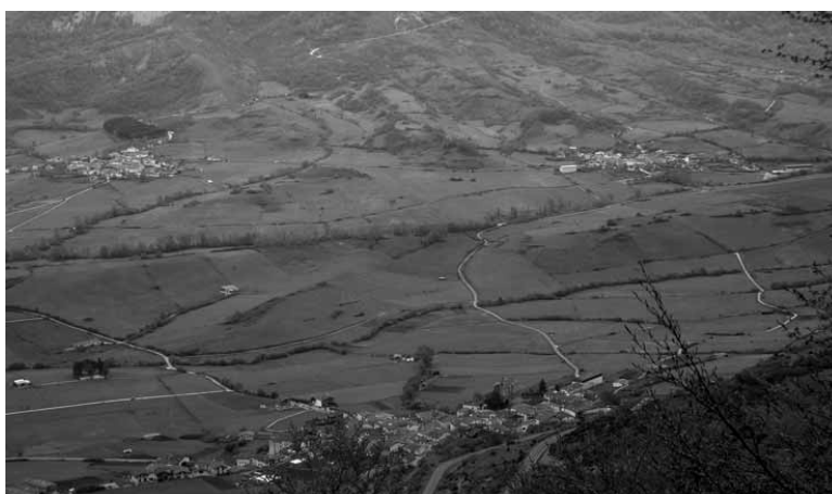
Ergoienako ikuspegi orokorra.