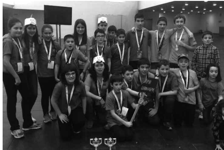
Sariekin batera taldeko argazkia ateratzen

Nafarroako First Lego Leagueko (FLL) topaketak 22 taldetako 10 eta 16 urte bitarteko 230 bat gaztetxo elkartu zituen larunbatean. Iruñeko Planetarioan egin zen topaketa eta han talde parte-hartzaileek hainbat egiteko izan dituzte. Alde batetik, Emakume eta Neska Zientzialarien nazioarteko egunazela baliatuta haietako hainbaten lanaren berri ematen zuten posterrak erakutsi zituzten.