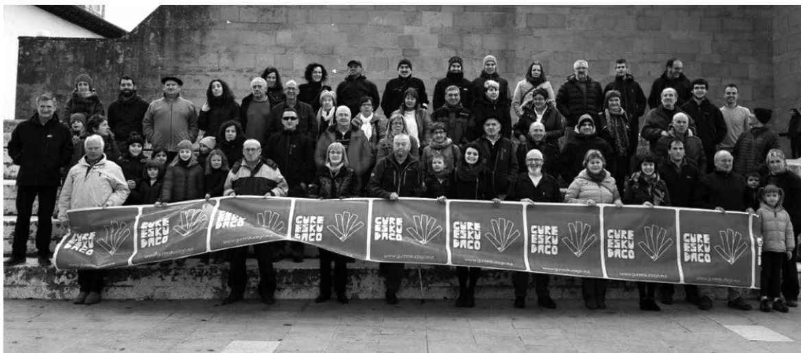
Irurtzongo plazako frontoian pankartarekin, GED dinamikari babesa ematen.

Herri galdeketa antolatu ahal izateko Irurtzongo Gure Esku Dagok herritarren erroldaren %10aren sinadurak jaso behar ditu. Taldekideak langintza horretan buru-belarri ari dira. Nahi duenak bihar sinatzeko aukera