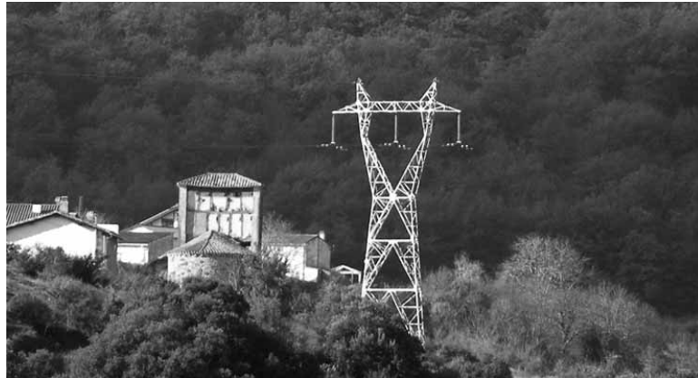
Argi-indar linea Urritzolatik.