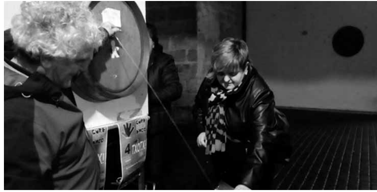
Altsasuko Gure Esku Dagoko kideek kupela ireki zuten unean.

Otsaila bukaera bitartean ahalik eta sinadura gehien bildu nahi dituzte. Galdeketa aurrera egin ahal izateko Altsasuko erroldaren %10 jaso behar dute gutxienez. Bere sinadura eman nahi duten altsasuarrek Gure Esku Dago taldeko kideekin hitz egin behar dute. Bestela, Facebook sare sozialeko Gure Esku Altsasu profilaren bitartez harremanetan jar daitezke.