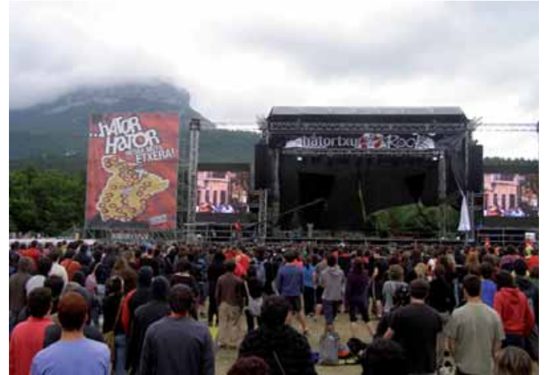
Hatortxu Rock-en 10. urteurrena ospatu zeneko kontzertu baten irudia.

lau kanta aurkeztu beharko dituzte. Emanaldiaren gainontzeko tartea bertsioekin osatu dezakete. Abesti guztiak egile edo konpositoreen onarpenarekin eta baimenaren egiaztapen agiriarekin batera aurkeztu beharko dira. Bestela, salaketarik balego taldea izanen litzateke arduradun bakarra. Talde irabazlea deseginen balitz edo taldekideen funtsezko aldatetak baleude saria bigarren sailkatuari emanen lioke antolakuntzak. Oinarri guztiak www.lakuntza.eus web orrian daude.