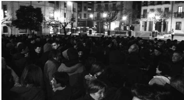
Ostiralero bezala, gaur ere udaletxe aurrean elkarretaratzea egingo da.

Atxiloketetatik hiru hilabete pasa direla gogorarazteko ekimenak iragarri dituzte astelehenerako eta astearterako