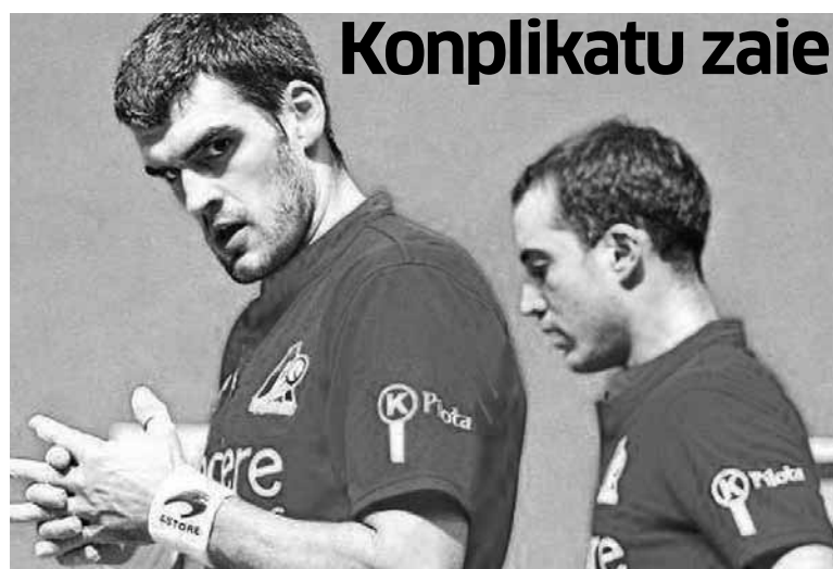
Ezkurdia eta Merino lau punturekin daude, irabaztera derrigortuta. NOTICIAS

Aurreko jardunaldian galdu ondoren, asteburuan irabaztera derrigortuta daude Ezkurdia-Merino II.a eta Elezkano II.a-Zabaleta