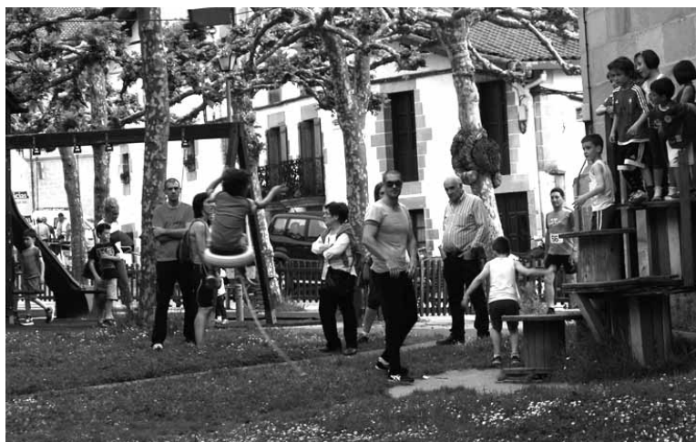
Hainbat bakaikuarrek bertako euskalkia sustatu nahi dute.

Euskalkiak.eus webguneak euskalkiei buruzko informazioa ematen du. Besteak beste, sailkapenak, euskalkien ezaugarriak, jatorria eta euskararen batasuna lantzen ditu luze eta zabal. Gainera, ikusentzunezkoen atala ere badu Bertan hiztun desberdinekin egindako elkarrizketak jaso dituzte. Zuazo kezkatuta dago euskalkiak