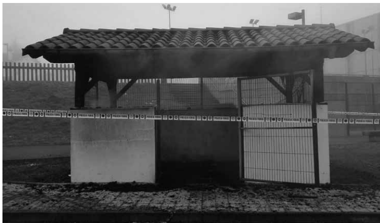
839 etxebizitzari zerbitzua ematen die larrialdi guneak. UTZITAKOAK

tzeko deia luzatu dute. Olatzagutiko larrialdi gunean lau edukiontzi eta beste txiki bat zeuden. Guztiz kixkalita gelditu dira. Horien balioa 700 euro ingurukoa da. Mank-eko teknikariek larrialdi gunearen egurrezko egituraren egoera aztertuko dute gaur. Baita inguruak txukundu ere. Dagoeneko, larrialdi gune ondoan edukiontzi berriak jarri dituzte.