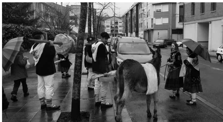
Opil-makilarekin sorbalda gainean eta astoari tiraka ibili ziren 2017. kintakoeak.

lar bankuan zenbatu ondoren, azken urteetan Gure Etxea eraikinean zenbatu izan dute jasotako sosa kintoek. Aurten, berriro, segurtasun enpresa batek zenbatu du.