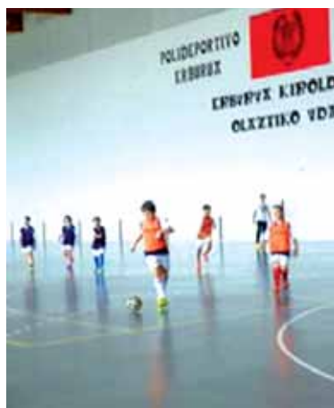
Areto futboleant, Olaztin.

Irurtzungo Guan taldeak Gabonetarako 12+12 orduko areto futbol txapelketa antolatzen du. Baina aurten Gabon gaua, Pazko eguna, Gabon zahar eguna eta Urteberri eguna asteburuan direnez, data-rik gabe egotean txapelketa ez antolatzea erabaki zuen taldeak. Horren partez, abenduaren 6an I. Emakumeen Areto Futbol Txapelketa antolatu zuten.