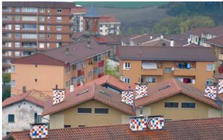
Irurtzongo etxeetako ur hornidura bermatuko du Mank-ek.

1.010.000 euro inbertituko ditu Mank-ek, gobernuak 888.000 euroekin lagunduko dituenak