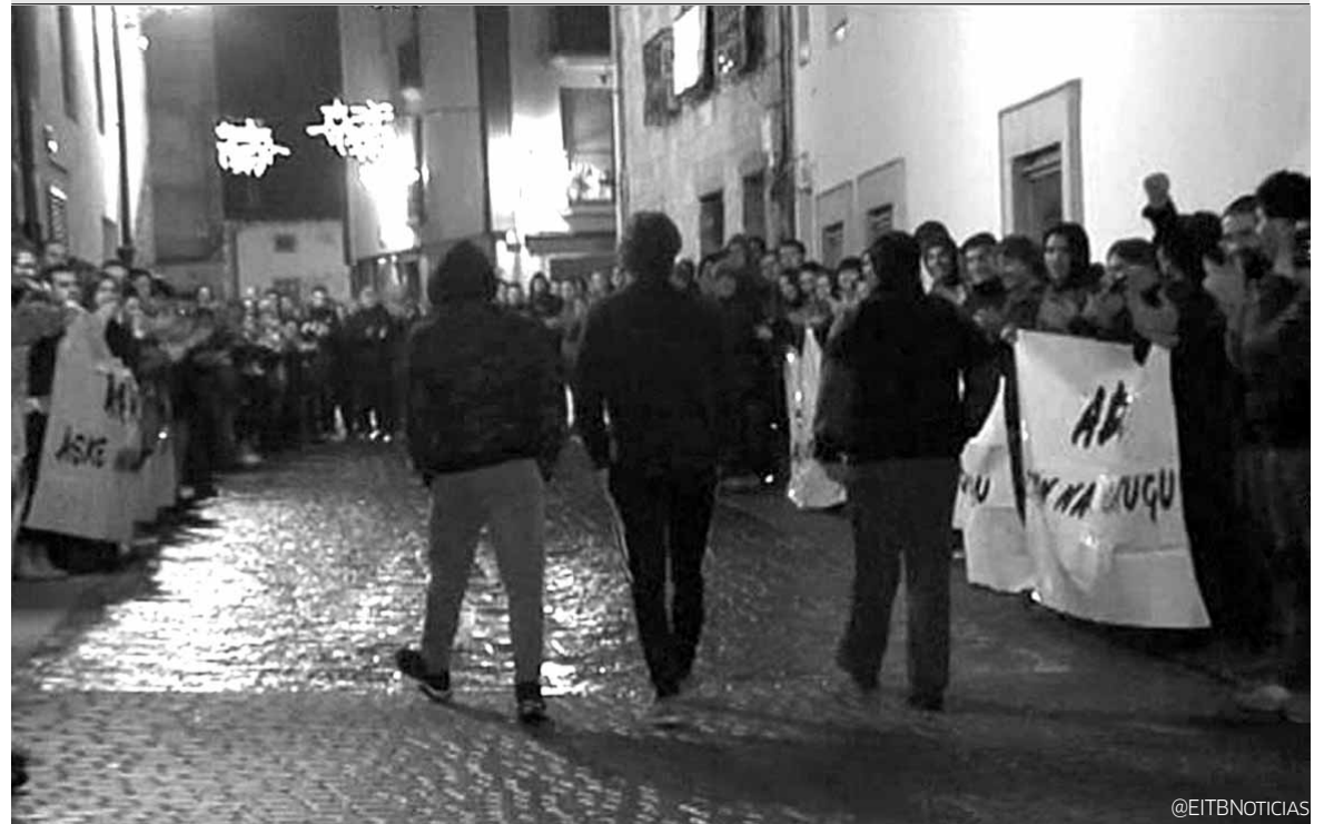
Horiek bota zituzten asteazkenean, 2:30 aldera. Ferietako liskarragatik auzipetutakoei harrera egiteko hainbat altsasuar zain egon dira bart. Haiak iritsi direnean udaletxetik Foru plazara eramaten duen kalean txaloka hartu dituzte hainbat altsasuarrek. Soto del Real eta Alcalá Meco 21:00ak aldera utzi zituzten. Bueltarako bidean afaltzera gelditu eta, horregatik, berandutu zen harrera.