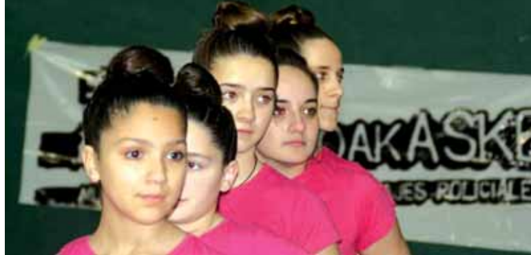
Iskiza taldeko gimnastek ikuskizun bikaina eskaini zuten igandean. ISKIZA

Iskiza Sakana Kirol Taldeko gimnastek ikasturtean barna ikasitakoaren primerako erakustaldia egin zuten, igandean, Burunda