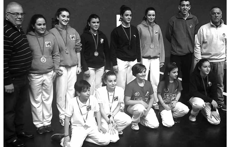
Nafar Kirol Jolasetako finaleran maila bikaina eman dute gure palistek.