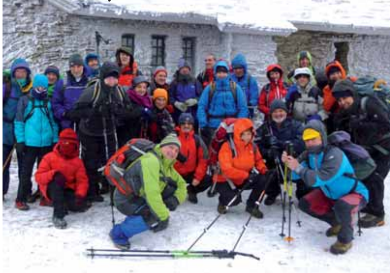
Horrelako irudiak ikusiko dira aurten ere.

Mendi tontorrek mendizaleen topaleku egun seinalatuetan