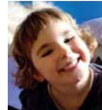
Maren ZORIONAK Lau, lau, lau,sardiña ba- kalao! Urte bat gehio bete duzu politte!! ZO- RIONAK Bihotz biho- tzezi!!