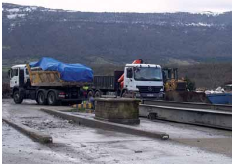
Kamioiak hondakindegian lanean.

Nafarroako Gobernu berriak hondakindegia itxteko lanari heldu dio eta Arbizuko ere tartean dago. Mank-ek 1,7 milioi euroko aurrekontua duen proiektua aurkeztu du eta gobernuak 1,3 milioi-ko diru-laguntza eman dio. Hona-