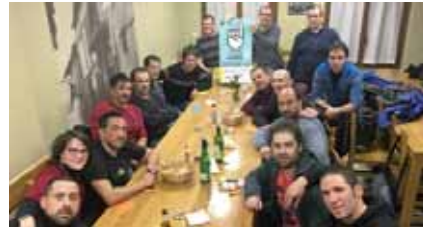
Zorionak Lully Urtiek aurria duezie beye ilusiyo eta inyerra bazikobau aurria tietu ta Hi,Boltio,Oihan ta beste geñako guziek ETXIA bidien jartzeko!