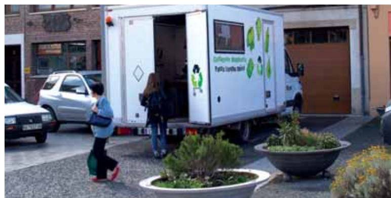
2017an garbigune mugikorraz aparte, finkoa izanen da Altsasun.

Altsasuko Udalak Pilotajaukun duen biltegiaren ondoan gaur egun industria-educiontzia handiak uzten dira eta altsasuarrek han denetarik botatzen dute. Bereizi gabe. Hiri hondakinen tratamendu egokia egiteko Sakanako Mankomunitateak eta Altsasuko Udalak han garbigune bat egitea erabaki dute. Egungoa arautzeko espazio bat itxiko dute eta porlanezko zorua emanen diote. Han barruan hainbat edukiontzia izanen dira, hondakinak gaika egoki birziklatzeko.