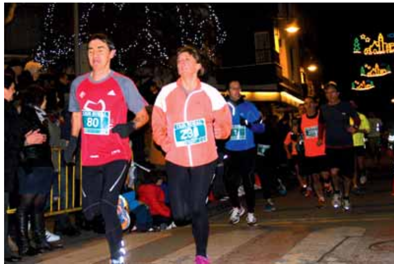
Altsasuko San Silbestrean aurreko urtean 665 korrikalari aritu ziren.

Izena ematea dohainik da, eta Dantzaleku Sakanak web gunean izena emateko gomendioa egin du. Bestela, egunean bertan izena emateko aukera egongo da, 18:30ak arte.