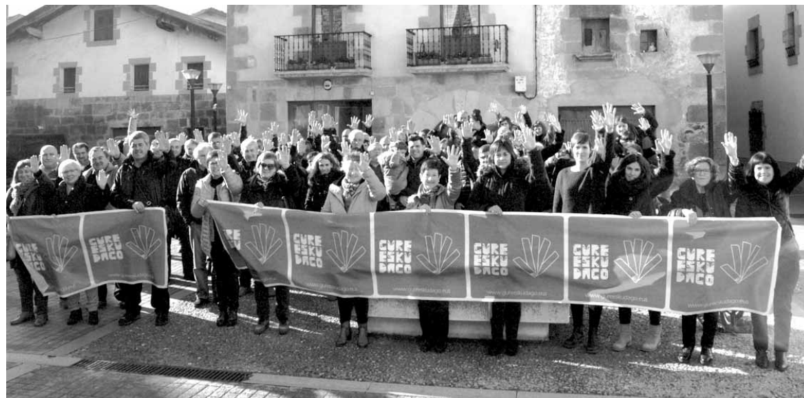
Aurkezpenaren ondoren hainbat olaztiarrek talde argazkia egin zuten.