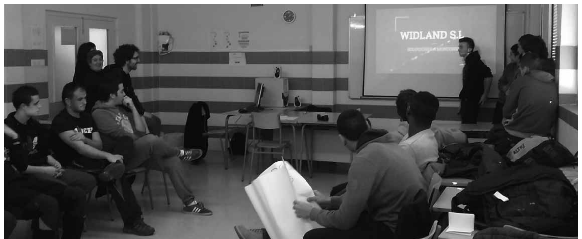
Ikasleek gogoz heldu zioten Mank-ek jarritako erronkari eta konponbideak proposatu zituzten. CEDERNA-GARALUR

Ekimen horrekin ikastetxeak ikasleak lan merkatuko errealitate hurbildu eta,aldi berean, haien ekintzaile gaitasuna gartzea sustatu nahi zuen, "autonomo edo besteendako lan egiteko gaitasun garrantzitsua baita ekintzailtza. Gero eta enpresa gehia-