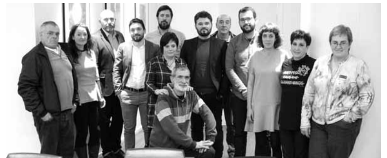
Altsasuarrek ERCko ordezkariak. @HITZONDO

suan bertan, Barne lantaldeak ferietako liskarraren inguruan lastailaren 18an onartutako era-