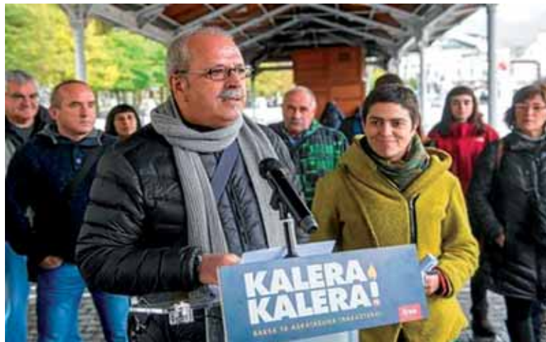
Ekimenaren aurkezpena. @NAIZ

Kalera, Kalera dinamika preso politiko izandako talde batek sustatu du eta Euskal Herrian barrena hainbat ekimen egiten ari dira. Guztiek Euskal Preso Politikoaren Kolektiboari (EPPK) babesa azaldu, "herri borroka sustatu eta preso guztien kaleratzea zein iheslari guztien itzuleraren beharra exijitu" nahi dute. Dinamikaren sustatzaileek diotenez, "iragana den gatazka armatuaren ondorioak erabakitzeke inolako mugiri-