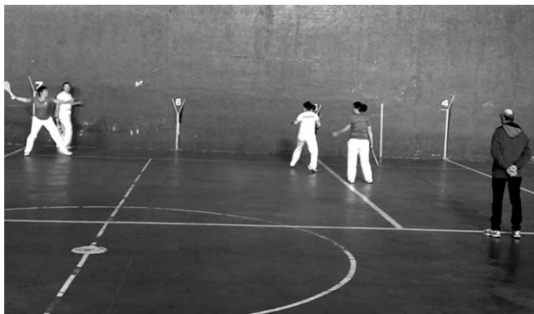
Gaur puntako partidak espero dira txapelketaren finalerdietan, Altsasun.

XI. Sakanako Gure Pilota Emakumeen Pala Torneo final aurrekoak gaur, ostiralean jokatu dira, 17:00etan, Altsasuko Burunda pilotalekuan