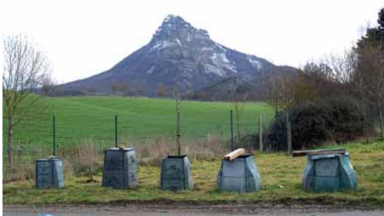
Konpostagailu motak Arbizuko hondakindegian.

Eta materia organikoaren kasuan Sakanako Mankomunitateak konpostaren aldeko apustua egin du. Arbizuko hondakindegian konpost planta bat eraikiko du heldu den urteko udaberri akaberarako. Eraikinetan 75 metro luze eta 25 metro zabal izanen ditu eta baskularen hegoaldera eraikiko da. Lanek