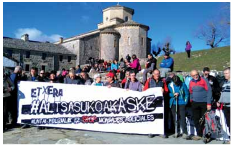
Altsasuko atxilotuak izan zituzten gogoan igandean Aralarren.

Mendizale ugari bildu zen Aralar gainean, 51. Mendigoizale Egunean