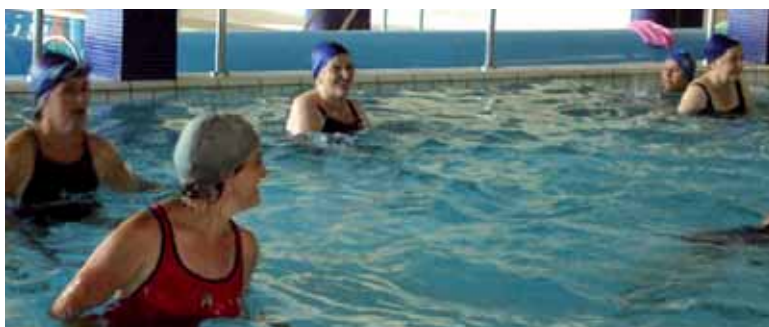
Aquagim saioa bat Zelandiko kiroldegian.

Horrekin batera Altsasuko Udalak enpresa publikoaren estatutuak aldatu ditu. Hemendik aurrera Atabo SRL izanen da, hau da, irabazimorik gabeko erantzukizun mugatuko sozietatea. Ollok azaldu duenez, “zerga-ondorio garrantzitsuak ditu honek. Izan ere, bere kirol azpiegiturak erabiltzen dituzten pertsona fisiko eta juridikoek ez dute BEZA jasan beharko. Baina