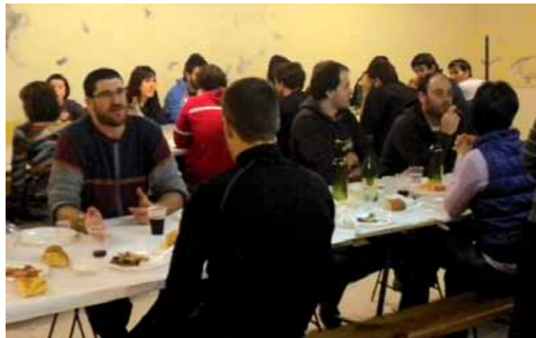
Herriko bajaran, atzera ere, mahaira eseriko dira ihabardarrak.

Olentzeroren bisita eta eguberritako egunaren ondoren, astelehenean, ihabardarrek Doneztebe patrioaren eguna ospatuko dute, ibarreko azken festa. Eguerdian patrioaren omenezko meza izanen da. Ordu batean hurrendako bazkaria iragarri dute eta mahaitik jaso ondoren, 14:30etik 18:00etara, haiendako begiraleek gidatutako tailerrak izanen dira. Heduak bazkaltzera 14:30ean eseriko dira. Bazkal ondorengo kantatuz eta dantza eginez animatuko dute.