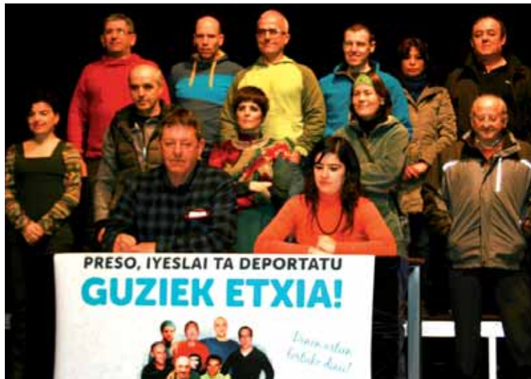
Hainbat etxarriarrek aurkeztu zuten manifestazioa.

Mobilizazio horren alde ahalik eta pertsona, antolakunde eta elkarte gehien atxikimendua lortu asmoz harreman eta komunikazio kanpaina abiatu dute taldeko kideek. Deitzaileek azaldu-