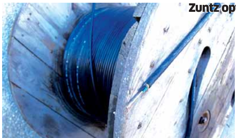
Zuntz optiko kable metroak eta metroak jartzen ari dira egunotan.