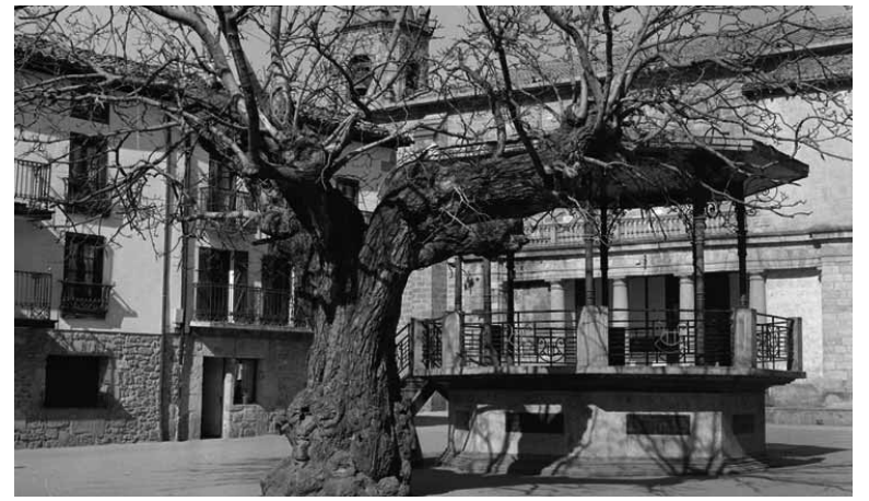
Kioskoaren aurrean zegoen intxaurrondo 1991. urtean kendu zuten.