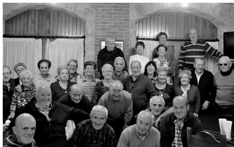
Unanuarrek mahai inguruan ospatu zuten San Andres.

Azaroko azken egunarekin batera, 30ean, San Andres eguna ospatu zuten unanuarrek. Denok bat elkartearen bazkari animatuaz gozatzeko aukera izan zen. Bertan elkartearen ziren herriko adinduak eta nahi izan zuen guztia. Majo bazkaldu ondoren kontu-kontari eta kantari aritu ziren. Giro horrek beste hainbat unanuar erakarri zituen. San Andresetan omenezko ospakizuna duela urte batzuk hasi ziren ospatzen.