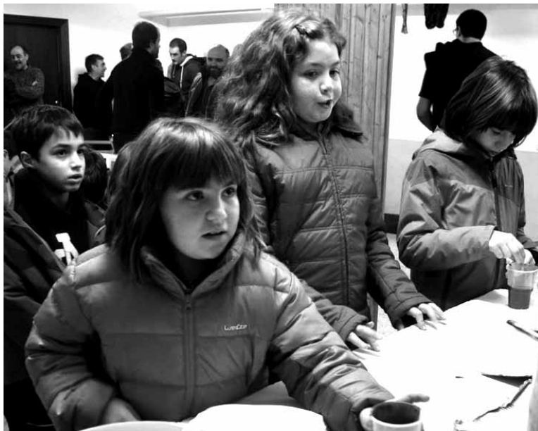
Mustutze ekitaldian ez zen txokolaterik falta izan. MAIALEN HUARTE

Larunbatetan zabalduko dituateak liburutegiak. 10:00etatik 11:00etara aukera izanen da liburu