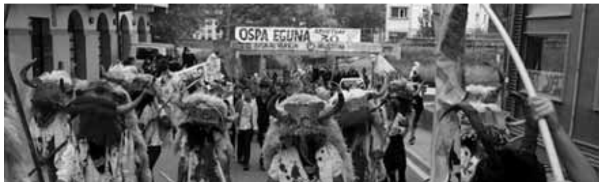
2014ko Ospa Egunaren irudi bat.

Mugimendutik gogorarazi dute, batetik, beti herri erakundeek bermatutako lege baimenak izan dituela. Ospa eguna modukoak udalaren jai batzordetik pasatzen zela gogorarazi du, “honela frogatuz gure helburuekin guztiz