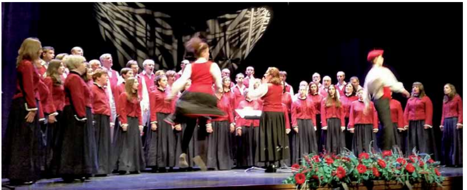
Etxarri Aranazko abesbatzak emanaldian dantzarien laguntza izan zuen.

24 familiei energia moztea eragotzita >> 5