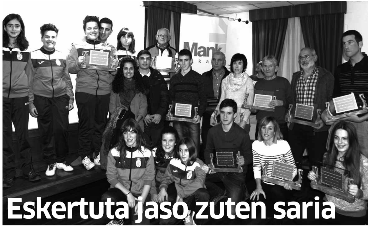
Sakanako 2015-2016ko kirolari onenak. Kategoria ezberdinetan 8 sari eta 2 aipamen berezi eman zituen Mank-ek.