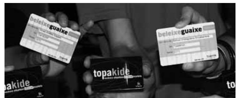
Beleixeguaixe txartela eskuetan

Beleixeguaixe txartelak asmo bikoitza du. Alde batetik, Sakanako euskarazko hedabideak sustatzea. Horretarako, txartela eskuratzen dutenak urtero kuota bat ordaintzen dute. Gutxienekoa 50 eurokoa da. Baina errenta aitorenaren bidez ekarpen horren %80 itzultzen da. Horri establezimenduetan eskaintzen diren abantailak gehitu behar zaizkio. Txar-