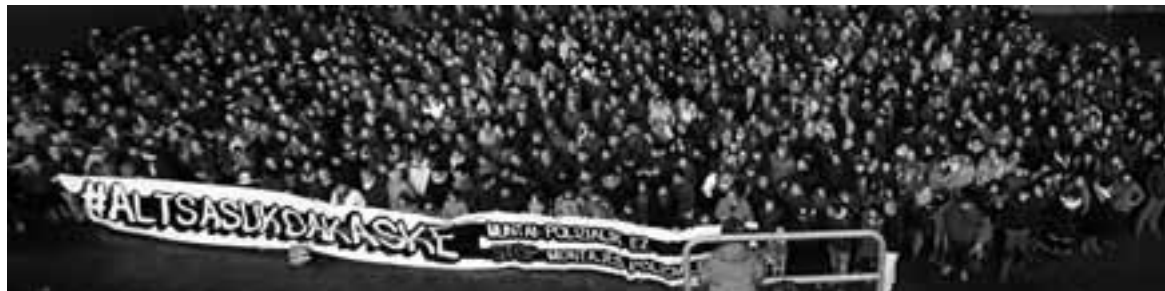
Altsasuarrek herenegun argazki erraldoia egin zuten. Sare sozialetan Entzun Altsasu profilak zabaldu dituzte.

an Espainiako Auzitegi Nazionalera agertu beharko dute. Lamela epaileak auzipetze autoaren berri emanen die auzipetuei. Sare-