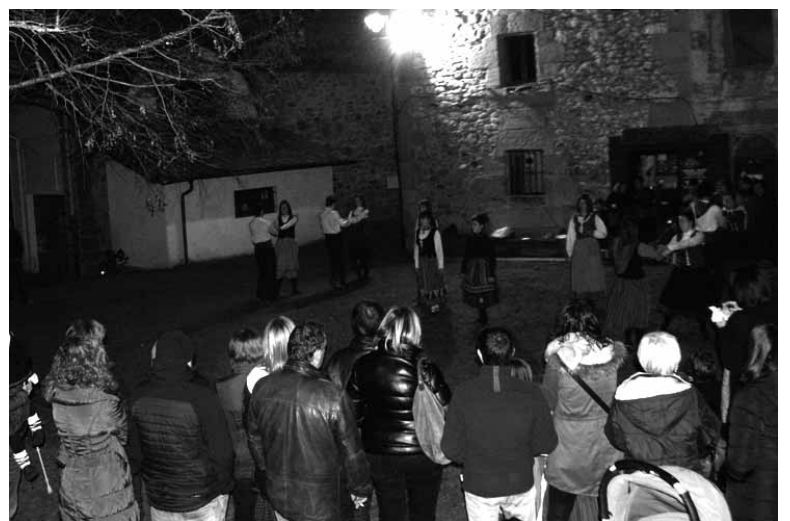
Dantzariak Gure Esku Dagoen kantaren doinura dantzatu zuten.