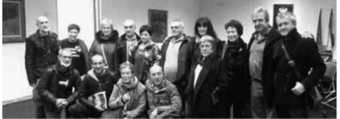
Auzipetuen gurasoek Nafarroako Parlamentuan politikariei euren eskaerak azaldu zizkieten.