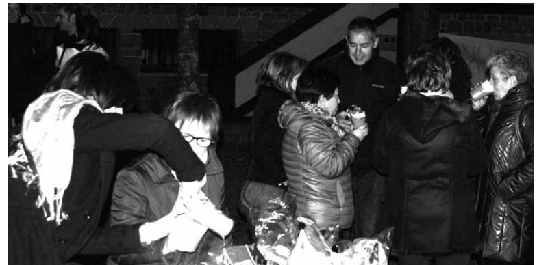
Gaztetxe aurrean ospatu zuten Santa Luzia, txokolate beroa tarteko.

Halaxe atera ziren atzo hainbat ziordiar, Santa Luzia eguna ospatzera. Joan den mendeko 70eko hamarkada erdialdetik ermitarik ez badago ere, ziordiarrek ez dute ospakizuna galdu. Bi hamarkada inguru izanenda berreskuratuzela. Garai batean etxekoan garai-koproduktuak eskaintzen baziren, ohitura moldatuta berri zuten. Atzo 18:30etik aurrera, esaterako, elkartearen txokolatea dastatzeko aukera izan zen, gerora gaztetxe parera eramane zena. Han bertan