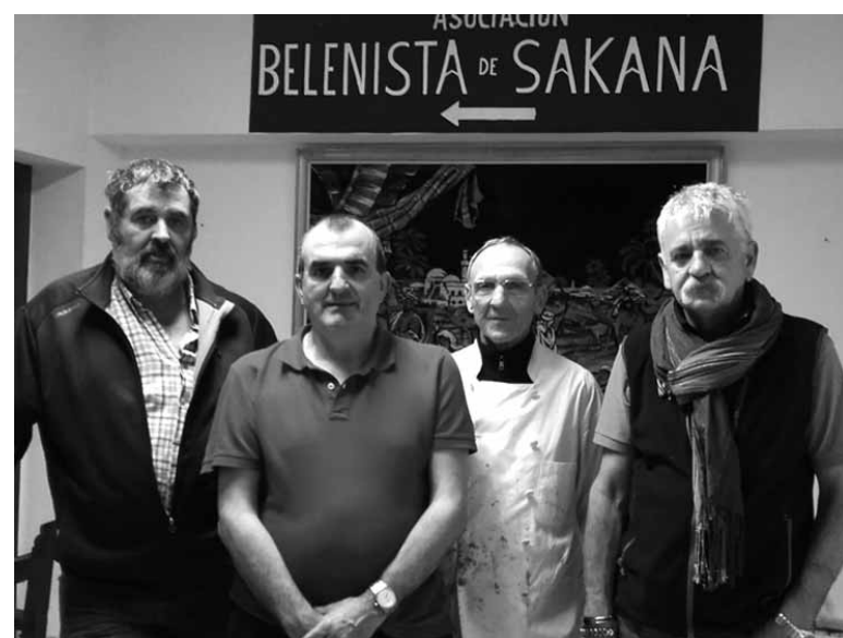
Sakanako belenzaleen elkarteak